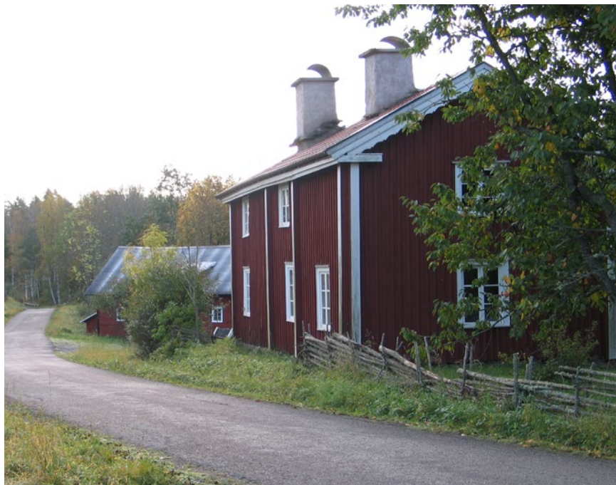
Hustypen kallas parstuga och har här två gamla skorstenar.

Detta faktablad om byggnadsvård ingår i en serie. Övriga handlar om: Jordkällare i Småland, Skiftesverk, Stenkällare på Öland, Tegeltak, Stråtak, Väderkvarnar på Öland, Ängslador samt Energismart.