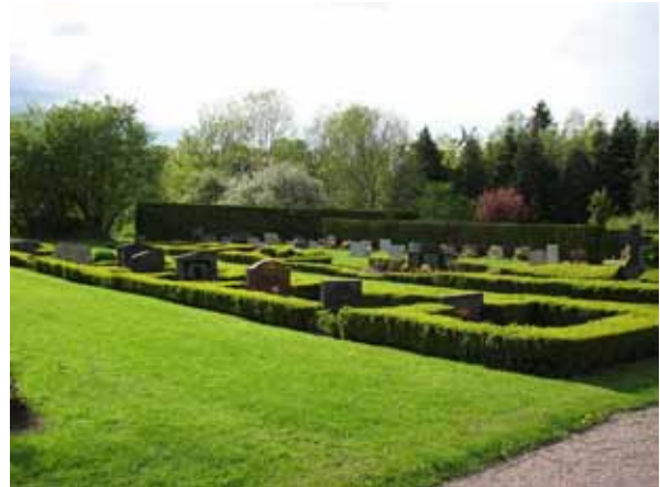
Översikt över den norra delen av kvarter B (KI Åby kyrkog 151)