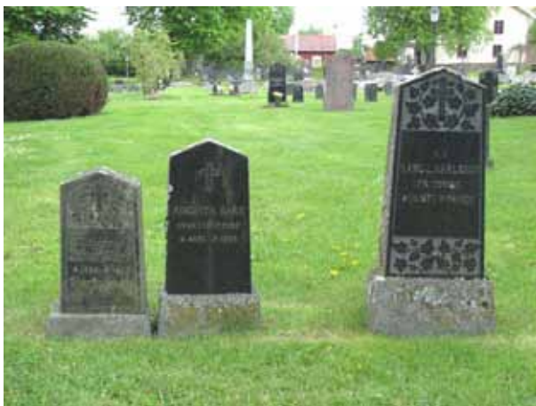
Linjegravvårdar från 1922. Den längst till vänster är dock makens som begravdes 1934 och möjligen har flyttats hit (KI Åby kyrkog 020)