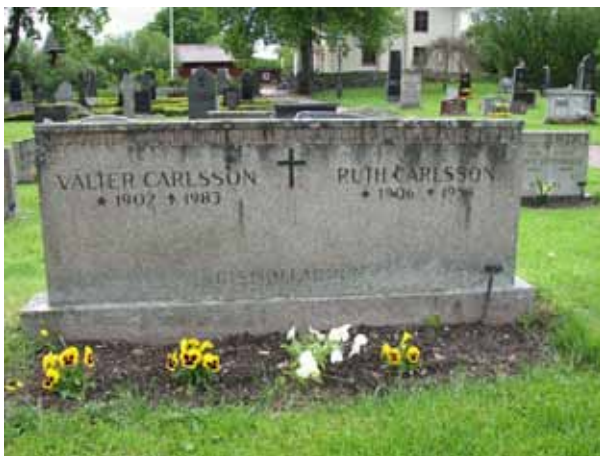
Bred vård från 1950-talet (KI Åby kyrkog 104)

I kvarteret finns olika typer av vårdar från senare hälften av 1800-talet och framåt. I den västra delen dominerar gravvårdarna av höga, stående, svarta och blankpolerade vårdar. Flera av dem är återanvända. I den östra delen är flertalet låga rektangulära. Den äldsta gravplatsen från 1867 är över majoren Carl Otto Posse och hans familj. En hög, obeliskformad vård i grå granit vilken omgärdas av ett svartmålat gjutjärnsstaket. Gravvårdarna är företrädevis av grå och svart granit. Ett fåtal i röd granit finns. Fem vårdar är av kalksten och en är ett gjutjärnskors. 35 gravplatser i området västra del utgör ett sammanhängande grusgravsområde med omgärdningar i form av låga buxbomshäckar. Två gravplatser har stenram och en omgärdas av ett vitmålat smidesstaket. På området finns det fyra gravplatser som har gravkullar beväxta med murgröna. Förutom den redan nämnda vården från 1867 finns det ytterligare fyra vårdar från samma århundrade. I övrigt dominerar vårdar från 1970-talet.