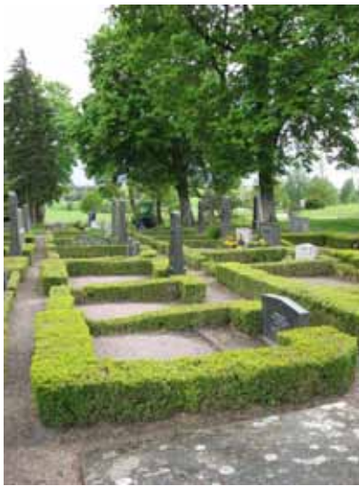
I västra delen av kv C är ett välbevarat grusgravsområde (KI Åby kyrkog 125)

I kvarteret finns en stor gryta utav gjutjärn gjord av 1930-talet.