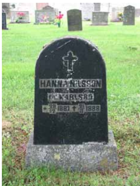
Gravvård som minner om ett idag försvunnet linjegravsområde i slutet av 1800-talet i kvarter G (KI Åby kyrkog 035)

Kvarteret avgränsas i öster och söder av kyrkogårdsmuren. I norr är en grusgång och i väster ligger kyrkan. Hela kvarteret är insått med gräs. Vårdarna i kvarteret är vända mot öster, väster och söder. I kvarteret finns både påkostade köpegravar och allmänna gravar. Intrycket av kvarteret domineras av låga rektangulära vårdar. I det sydvästra hörnet ligger det gamla sockenmagasinet.