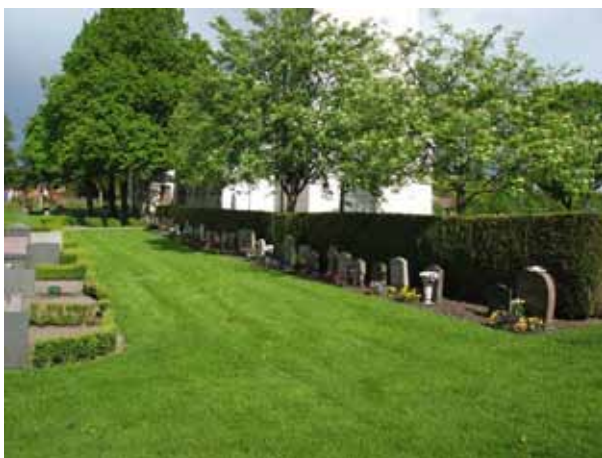
Del av urngravsområdet (KI Åby kyrkog 146)