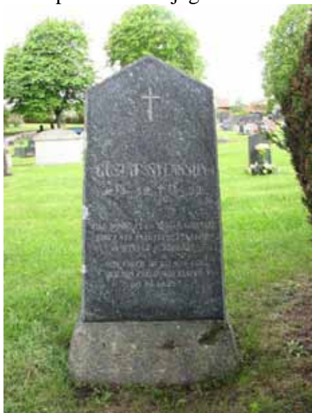
Vård rest, 1893, över Gustaf Svensson. "Arbetare som dog i sin pligtuppfyllelse å Stäflö herrgård" (KI Åby kyrkog 026)

Kvarteren har under en lång tid använts som linjegravsområde och är fortfarande ett relativt välbevarat sådant. Vid den här tiden var det vanligt att placera köpta gravplatser i en ram utanför linjegravarna. Det kan man se spår av längs gången och längst i väster. Linjen går att följa från öster till väster från 1920-tal och fram till 1970-talet. Bruket med allmänna gravar eller linjegravar var tidigare ett självklart inslag på kyrkogårdarna. Det är därför viktigt för kyrkogårdens historia att en sammanhängande del av området långvarigt bevaras. Så länge platserna inte behövs bör samtliga vårdar få stå kvar. När nya gravsättningar görs bör vårdarna anpassas till linjegravvårdarnas låga och enkla karaktär.