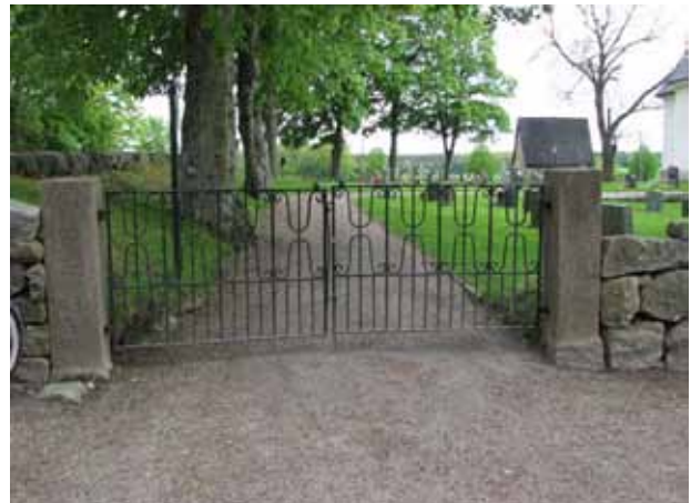
Modernare järngrind i nordost (KI Åby kyrkog 205)

I öster: en ingång via svartmålade dubbelgrindar av smidesjärn, med liljor och mässingsknoppar, mellan stolpar av granit.