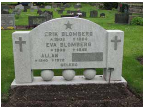
Vård från 1940-talet i kv D (KI Åby kyrkog 090)