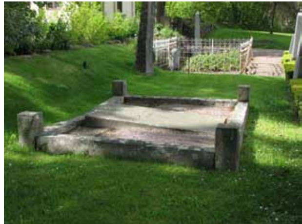
Ett fåtal gravplatser omgärdas med stenram. Notera det vitmålade smidesstaket i bakgrunden (KI Åby kyrkog 120)