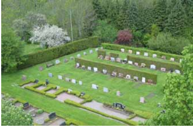
Översikt över kvarter A, den västra delen. I förgrunden skymtar delar av kvarter B (KI Åby kyrkog 010)

tujahäck medan det i norr och öster växer en häck av avenbok. Kvarteret delas av en grusad gång som leder ner till minneslundan norr om kvarteret. I gränsen mot söder finns i den östra delen den gamla kyrkogårdsmuren. Den del av muren som avgränsade den västra delen revs på grund av rasrisk på 1980-talet. Gravvårdarna är placerade i öppna jordremсор i gräsmatta, vissa ryggställda mot häckar av tuja, andra enkla. Vårdarna är vända mot öster, väster, norr och söder. Den östra delen av området har inte tagits i bruk.