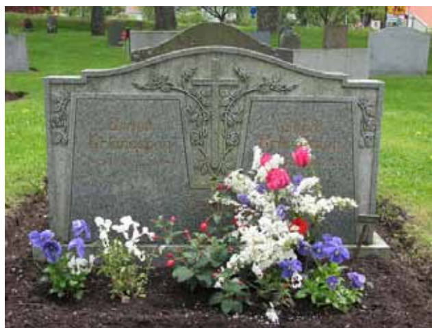
Vård från 1980-talet i kvarter G (KI Åby kyrkog 039)