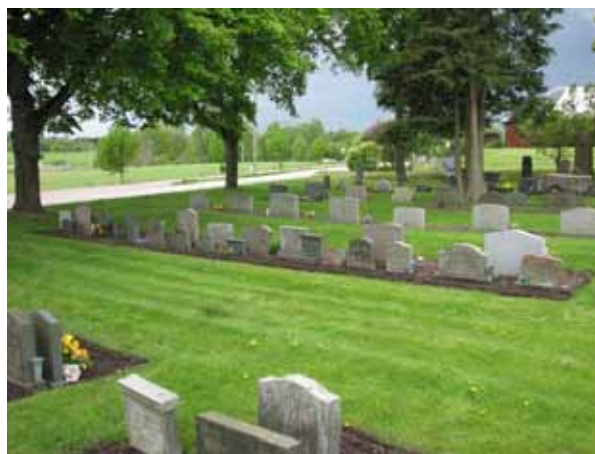
Man kan fortfarande följa "linjen" från 1950-talet (KI Åby kyrkog 088)