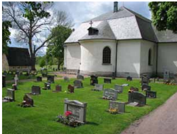
Översikt över kvarter F från NO (KI Åby kyrkog 045)