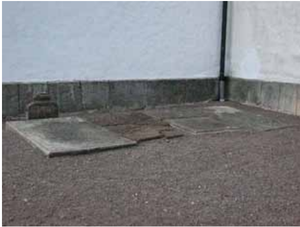
Äldre hällar utanför vapenhuset. De har tidigare legat ute på kyrkogården (KI Åby kyrkog 188)