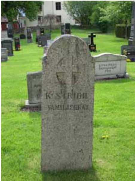
Gjord av Oskar Fredriksson, en lokal stenhuggare (KI Åby kyrkog 128)