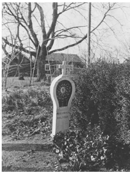
En mycket ovanlig typ av vård som det tidigare fanns ett flertal av på Åby kyrkogård. Vården stod på västra delen av kyrkogården intill muren mot prästgården.