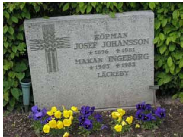
Endast en av vårdarna i kv A anger den dödes yrkestitel (KI Åby kyrkog 165)