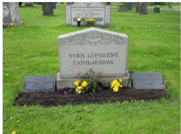
Ett antal familjegravar ligger längs med grusgången i västra delen av kvarter H (KI Åby kyrkog 031)

På majoriteten av gravvårdarna anges den dödes hemort. Yrkestitel anges endast på ett fåtal av vårdarna. Vanligast är lantbrukaren men även titlar som slöjdaren, arbetaren, köpmannen, hemmansägaren, handelsträdgårdsmästaren, snickaren, majoren, sjömannen och fiskaren förekommer.