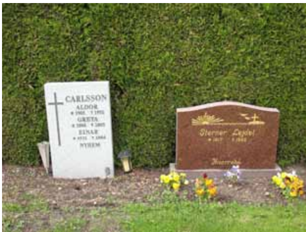
Tidstypiska vårdar i kv A (KI Åby kyrkog 158)