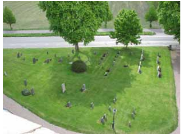
Översikt över kvarter H. Notera att den tidigare vägsträckningen fortfarande "syns" som en vådfri yta (KI Åby kyrkog 016)