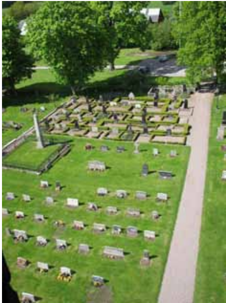
Översikt över kvarter C från kyrktornet (KI Åby kyrkog 008)