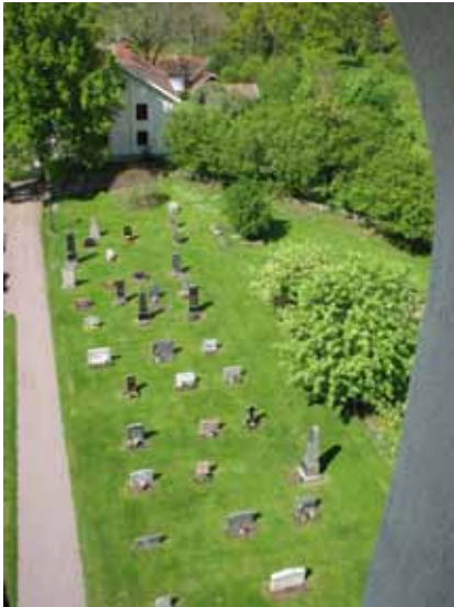
Översikt över södra delen av kvarter B (KI Åby kyrkog 005)

De södra delarna av kvarter B ingår i den gamla kyrkogården. Den norra delen av kvarter B samt kvarter E tillkom på 1930-talet vid den första utvidgningen under 1900-talet av kyrkogården. Kvarteren ligger norr om och väster om kyrkan. I kvarteren finns enligt gravkartan planerat för 388 kistgravar och 93 urngravar. I väster och öster avgränsas kvarteren av kyrkogårdsmuren. I söder gränsar kvarter B till en grusgång. Kvarter E är omgärdat i söder och norr av äldre kyrkogårdsmurar. Gränsen i norr vid kvarter B utgörs av en gräsmatta. En tujahäck är rygghäck mellan urngravsraderna och skiljer också den nyare och den äldre delen åt i kvarter B. Mellan de båda kvarteren är en grusbelagd gång i nord-sydlig riktning. Inne i kvarteren finns omgärdningar av buxbom. I västra änden av kvarter E är en rundel av sten och en mindre trappa uppbyggd. På sidorna om trappan växer ölandstok och bräken. Inne på området finns det också planterat rönnar och längs med kyrkans norra långhusvägg är den forna trädkransen med lindträd. Vårdarna står i den äldsta delen i gräsmatta men i den del som tillkom på 1930-talet är det till största delen grusade gravplatser.