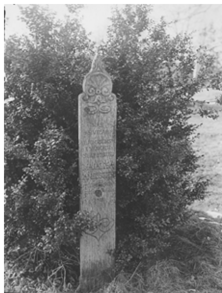
En trävård rest över Majalisa Jansdotter. Vården stod tidigare söder om kyrkan nära landsvägen. Vården finns bevarad och förvaras inomhus.

Intill kyrkans södra långvägg ligger några äldre gravhällar samt en sockel av kalksten. Hällarna är från 1600- 1800-talet. De har tidigare legat ute på kyrkogården. Hällarna är i mycket dåligt skick.