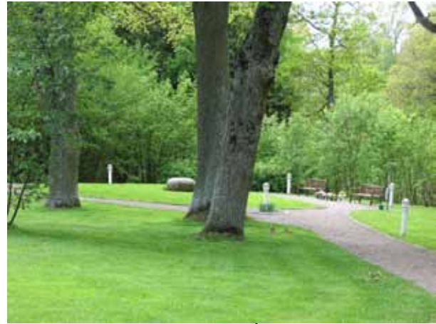
Minneslunden anlagd 1997 (KI Åby kyrkog 203)