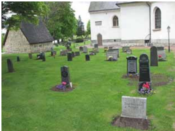
Översikt över kvarter G öster om kyrkan, från NO (KI Åby kyrkog 032)