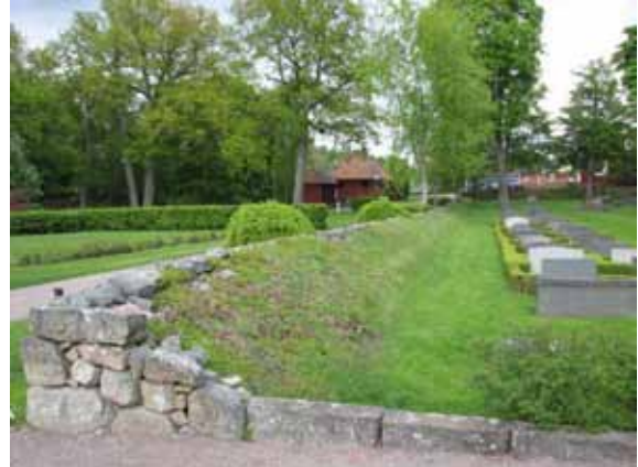
Den gamla kyrkogårdsmuren från 1930-talet gränsar mot nya som tillkom på 1960-talet (KI Åby kyrkog 019)