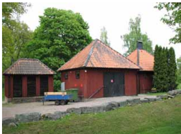
Förråd/redskapsbod och personalutrymme strax utanför kyrkogårdsmuren i norr (KI Åby kyrkog 208)