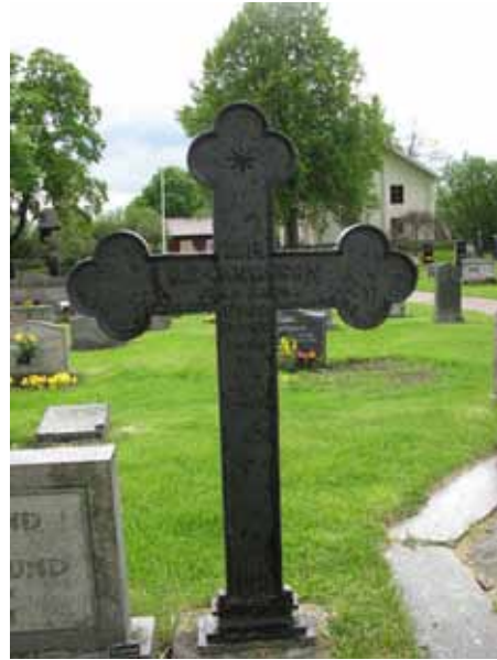
Gjutjärnsvård rest över C F Carlsson 1874 (KI Åby kyrkog 101)