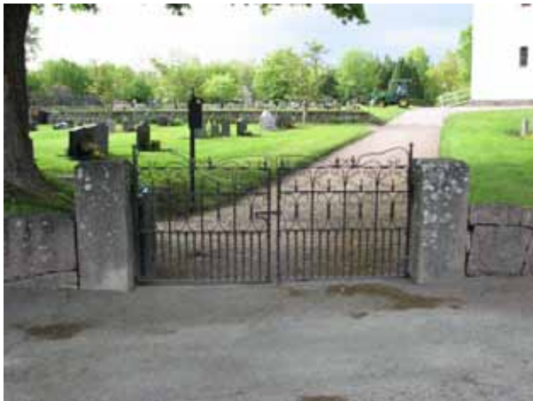
Smidesgrindar mellan granitstolpar, södra ingången (KI Åby kyrkog 177)