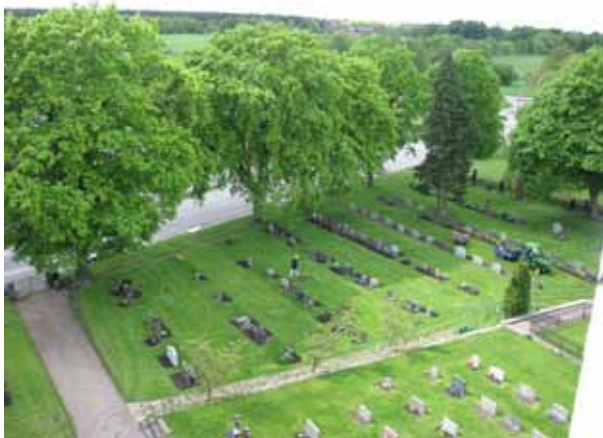
Översikt över kvarter D (KI Åby kyrkog 015)