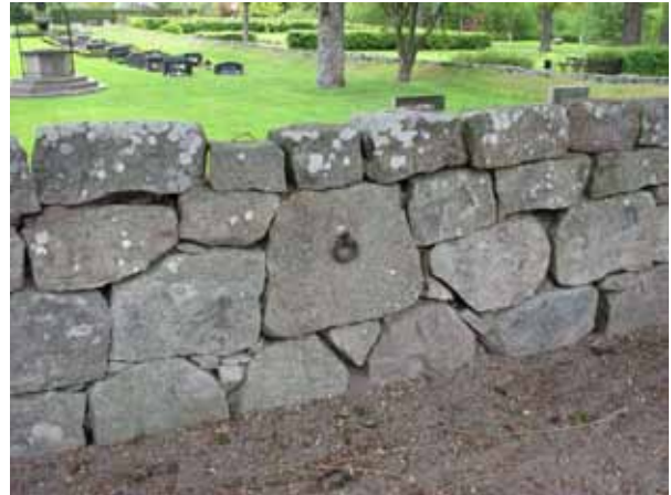
Ringar fästa i kyrkogårdsmuren minner om tider då hästskjuts var det vanligaste färdmedlet till kyrkan (KI Åby kyrkog 168)