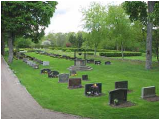
Översikt över kv E. Raderna till vänster är från 1940-talet och de till höger från 1960-talet (KI Åby kyrkog 057)

Gravvårdarna är av varierande ålder och utförande. De vanligaste materialen är grå och svart men också röd granit. Två vårdar är av kalksten och en gravplats har en stenram, också den av kalksten. Vårdar från 1940- och 50-talet dominerar. I urnkvarteret är det övervägande andelen vårdar från 1980-90-talen. De första begravningarna i urnområdet gjordes i början av 1960-talet. Fem vårdar i kvarter B är från 1800-talet varav en är kyrkogårdens äldsta bevarade vård. Det är en kalkstensvård rest år 1834 i den södra delen av kvarteret. Den nyare delen av kvarter B samt kvarter E består till största delen av gravplatser vilka omgärdas av låga buxbomhäckar och där gravplanerna är grusade. Många av vårdarna är klassiserande till form och dekor.