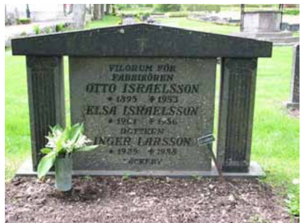
En klassicistisk vård i kvarter E (KI Åby kyrkog 059)