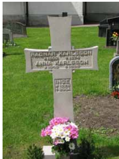
Nygjord/återanvänd kalkstensvård (KI Åby kyrkog 048)