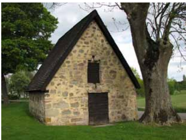
Det medeltida sockenmagasinet användes under en tid som bårhus. Nu är det förråd (KI Åby kyrkog 175)

Utanför kyrkogården i nordost finns förråds och personalutrymmen i två röda träbyggnader. Förrådet uppfördes 1955 och tillbyggdes 1985.