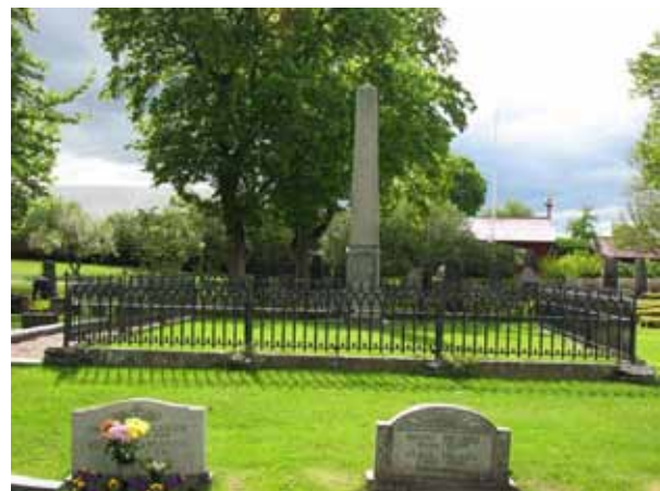
Major Posses familjegravplats. Omgärdad av ett gjutjärnsstaket. Notera 1970-tals vårdarna i förgrunden (KI Åby kyrkog 108)