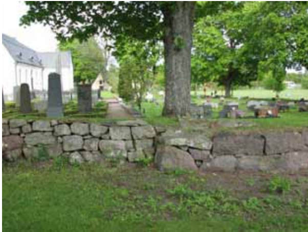
Skarven mellan kyrkogårdens olika utvidgningar syns tydligt i kyrkogårdsmuren (KI Åby kyrkog 182)

Vid utvidgningen mellan kvarter C och D syns en tydlig skillnad i stenmaterialet. I norr avgränsas hela kyrkogårdsområdet av naturen.