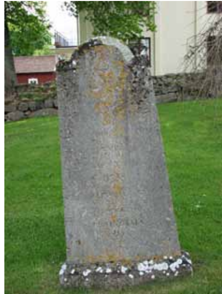
Kyrkogårdens äldsta vård rest 1834 över familjen Petersson Gyllenram. Vården är gjord av kalksten (KI Åby kyrkog 137)