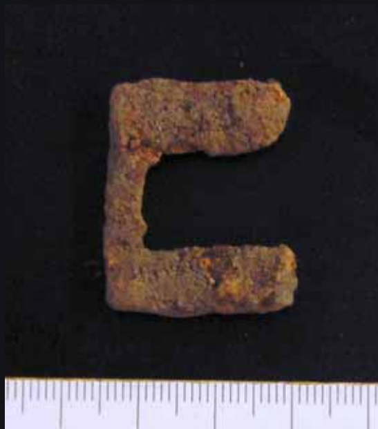
Fig. 2. Fynd KLM 94:1. Bältessölja av järn. Foto: DU193_002