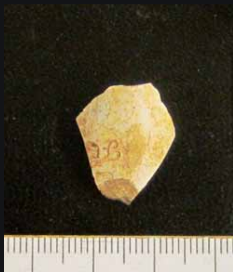
Fig. 4. Fynd KLM 181:2. Del av kritpipa. Foto: DU193_004