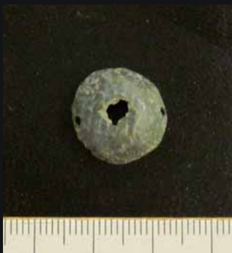
Fig. 3. Fynd KLM 160:2. Beslag av brons. Foto: DU193_003