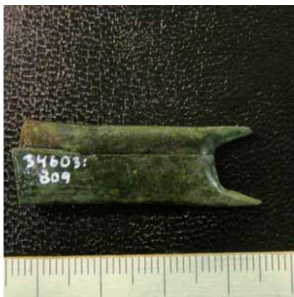
Fig. 5. Fynd KML 34603:890m Övre Vannborga, Köping socken, Öland. Foto: DU193_005

I fyndlistan och i rapporten (Wennerström et al 2008:16) omnämns benfynd som eventuellt kommer från människa. Den översiktliga osteologiska genomgången visar att så inte är fallet. Benmaterialet är till största delen hörigt till tamboskap såsom nötkreatur, häst, får och eller get samt svin och någon hund. Inslag av fisk, fågel och möjligen något småvilt förekommer också. Vidare ger den till handen att majoriteten av benmaterialet kan föras till så kallat