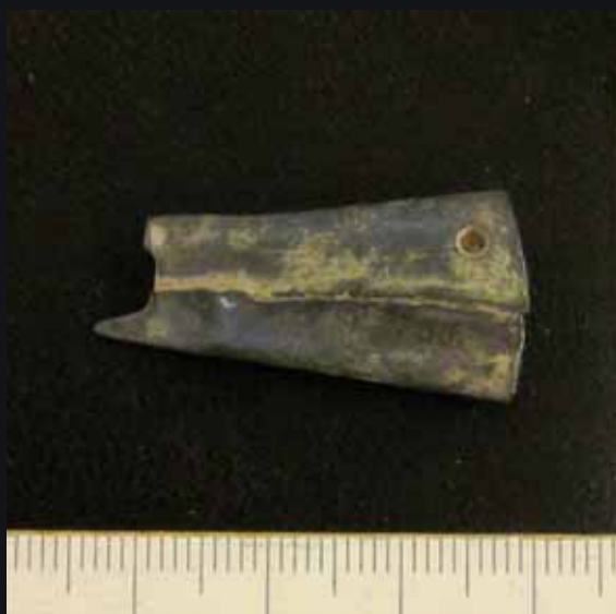
Fig. 1. Fynd KLM 93:3. Tvinnare av brons. Foto: DU193_001