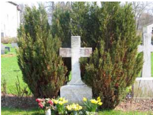
Korsformad vård av marmor i kvarter 1. Vården är återanvänd och den gamla texten finns kvar på baksidan (KI Arby kyrkog 013)

Kvarteren utgörs av den del, väster om kyrkan, som utvidgades i slutet av 1920-talet. Kvarteret rymmer drygt 520 gravplatser. Området omgärdas i söder, väster och norr av kyrkogårdsmuren. Gränsen mot den äldre delen av kyrkogården utgörs av häckar av ölandstök. I kvarteret finns ingen markerad gång utan hela området utgörs av gräsmatta. Gravvårdarna i de södra och norra delarna står placerade i rader mot rygghäckar av liguster. Längs rabatterna, som tidigare följde den gång som är igensådda, är gravvårdarna ryggställda mot rosenbuskar. Längst i norr och söder, samt längs rabatterna med rosor, är till största delen familjegravar medan de i mitten har ett något mindre uttryck. I mitten av kvarter 1 finns rester efter ett linjegravssystem och möjligen i kvarter 2. I området finns ett urngravsområde runt den kulle som iordningställdes som minneslund under 2006. På kullen växer en ek och en lönn. Vårdarna är vända mot norr, söder, öster och väster.