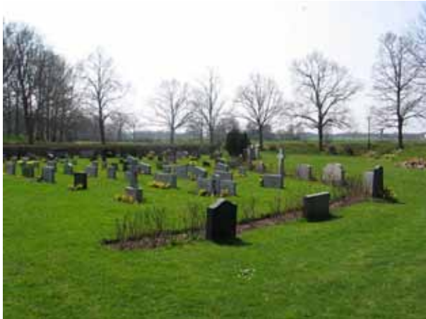
Översikt över kvarter 1 från NO (KI Arby kyrkog 006)