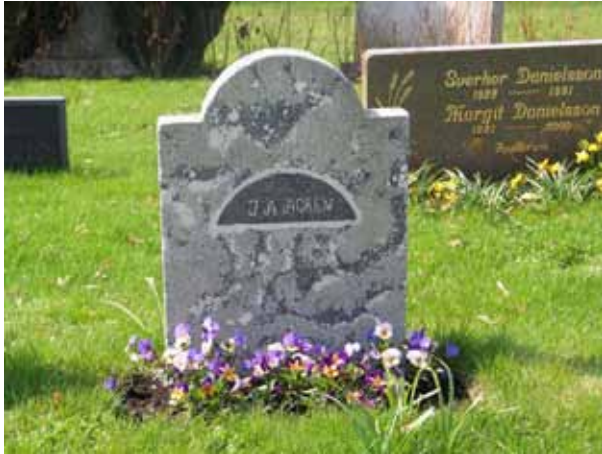
Vård av betong sannolikt hemmagjord, kvarter 1 (KI Arby kyrkog 016)