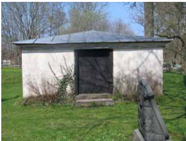
Familjen Wittboms gravkor uppfört 1821 i kyrkogården nordöstra hörn (KI Arby kyrkog 039)

By- eller gårdsnamn förekommer på ungefär hälften av vårdarna i kvarteren. Den dödes yrkestitel anges också på ett relativt stort antal stenar. Här finns titlar så som hemmansägare, lantbrukare, byggare, rättare, mjölnare, toffelmakare, landstingsmannen, kommunalnämndens ordförande, kyrkoherde, kyrkoherde och prost, prostinnan, kassör, kyrkoherde, kantor, läroverksadjunkt, trädgårdsmästare och kyrkoherde, och major vid kungl. Kronobergs regemente.