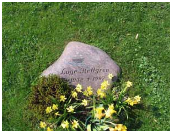
Vård av natursten (KI Arby kyrkog 073)