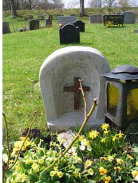
Vård av kalksten med järnkors från slutet av 1900-talet i kvarter 2 (KI Arby kyrkog 025)