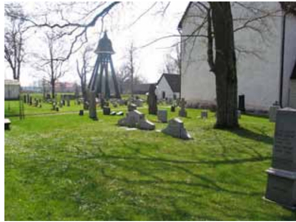
Översikt över kvarter 4 från NV (KI Arby kyrkog 034)