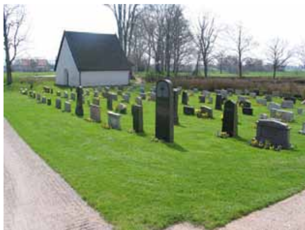
Översikt över kvarter 6 från NO (KI Arby kyrkog 066)

Kvarter 6 är beläget söder om kyrkan och omfattas av cirka 200 gravplatser. I väster är en häck av ölandstök, i söder är kyrkogårdens mur och i öster och norr är det grusgångar. Området utgörs av en rektangulär gräsbesådd yta där samtliga vårdar är vända mot öster.