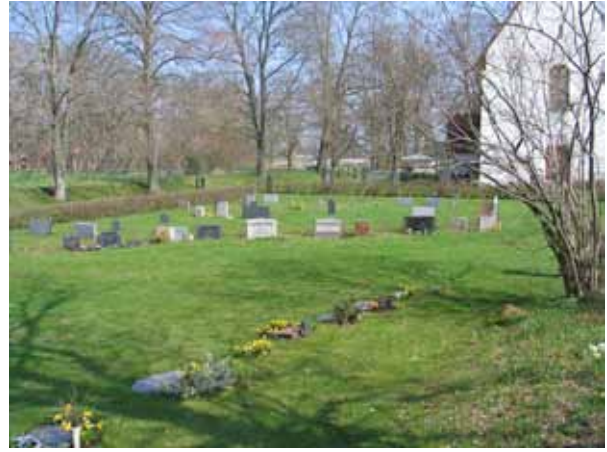
Översikt över kvarter 2 från SV (KI Arby kyrkog 020)