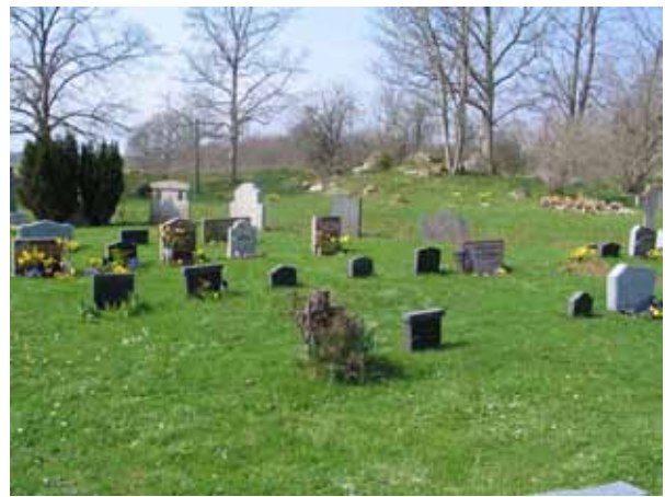
I kvarter 1 fanns små svarta granitvårdar. Möjligen rester efter ett linjegravssystem (KI Arby kyrkog 017)