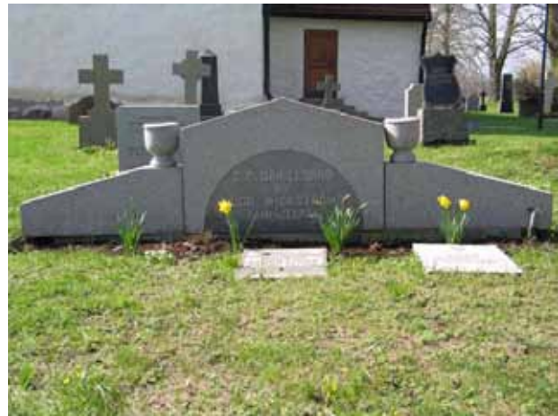
Mycket breda vårdar var vanliga under 1930-talet. Gravplatsen har troligen haft stenram som idag är borttagen (KI Arby kyrkog 037)

By- eller gårdsnamn förekommer på ungefär hälften av vårdarna i kvarteren. Den dödes yrkestitel anges också på ett relativt stort antal stenar. Här finns titlar så som hemmansägare, lantbrukare, byggare, rättare, mjölnare, toffelmakare, landstingsmannen, kommunalnämndens ordförande, kyrkoherde, kyrkoherde och prost, prostinnan, kassör, kyrkoherde, kantor, läroverksadjunkt, trädgårdsmästare och kyrkoherde, och major vid kungl. Kronobergs regemente.