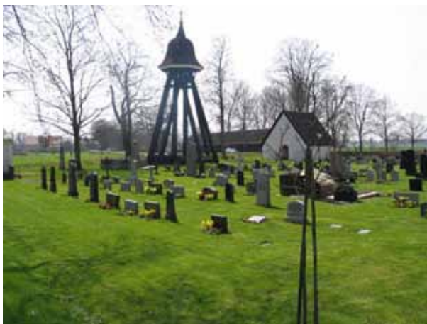
Översikt över kvarter 5 från NO med klockstapeln och det före detta bårhuset i bakgrunden (KI Arby kyrkog 042)