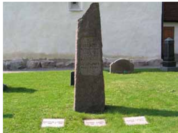
Nationalromantisk vård från 1898. Gravplatsen har tidigare sannolikt varit omgärdad (KI Arby kyrkog 040)