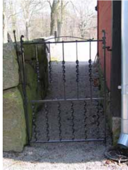
Grinden mellan muren och de gamla kyrkstallarna är en enkel smidesgrind (KI Arby kyrkog 083)