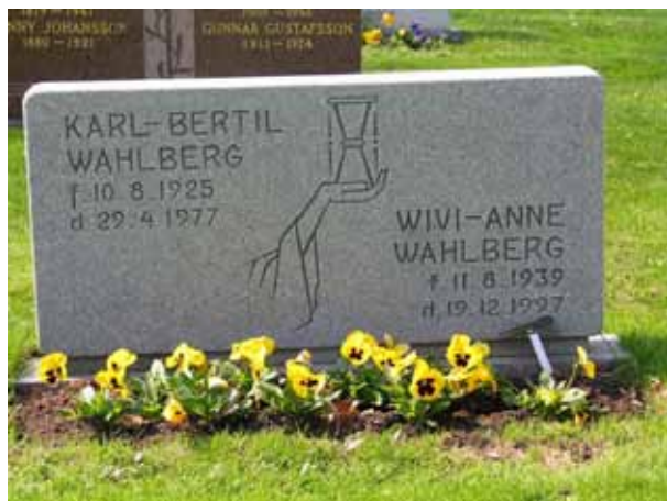
Tidstypisk vård från 1970-talet (KI Arby kyrkog 072)

De flesta vårdar är gjorda i grå eller svart granit men även röd förekommer. Två vårdar är av kalksten. Övervägande delen är stående vårdar men ett fåtal liggande finns också.