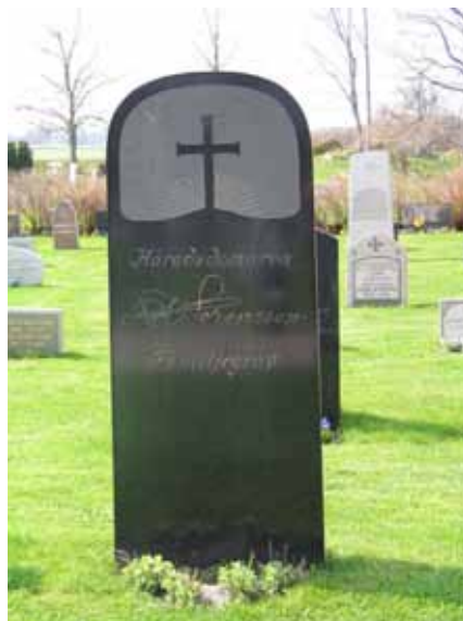
Häradsdomare Lorenssons familjegravvård (KI Arby kyrkog 068)