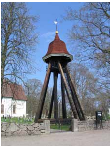
Klockstapeln från 1600-talet, ombyggd på 1800-talet (KI Arby kyrkog 086)