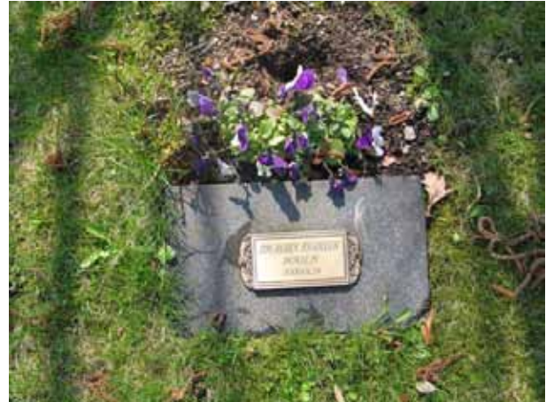
Liggande vård i urngravsdelen i kvarter 2 (KI Arby kyrkog 021)