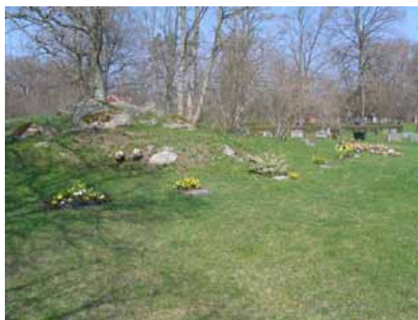
Kullen som planeras iordningställas som minneslund under 2006. Urngravar i kvarter 1 i förgrunden (KI Arby kyrkog 015)