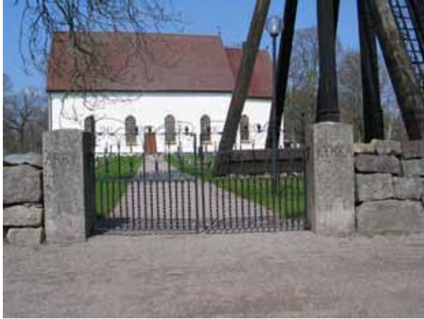
Ingången i söder. Smidesgrind från 1866 mellan granitstolpar, på vilka det står Arby kyrka (KI Arby kyrkog 085)