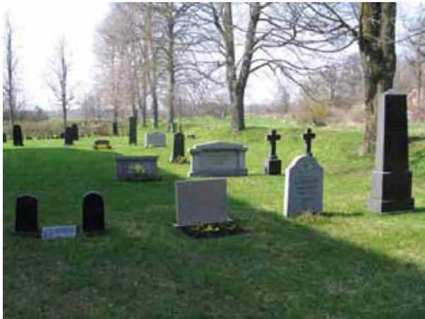
Översikt över kvarter 3 från Ö (KI Arby kyrkog 030)