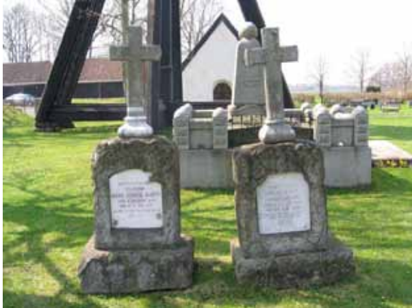
Gravvårdar i sandsten med kors och platta i marmor rest över friherre Axel Rappe och friherrinnan Emelie Rappe (KI Arby kyrkog 053)

I det sydöstra hörnet finns familjen Rappes gravkor och i kvarterets sydvästra hörn står klockstapeln.