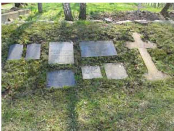
En del vårdar tagna ur bruk ligger i vallen till kyrkogårdsmuren (KI Arby kyrkog 082)

raka eller formade som en gavelspets. Oljelampan är fortfarande ett vanligt dekorelement liksom palmkvistar och kors. Utformning och dekor är den samma hos såväl gravvårdar på köpta gravplatser som linjegravplatser. De sistnämnda är dock mindre och enklare. Från 1950 och framåt i tiden dominerar de låga rektangulära gravvårdarna med enkel dekor. Vanliga motiv är talldungar, soluppgångar, kors och blommor. Bland gravvårdarna från det senaste årtiondet kan man märka ett visst nytänkande. Formen är inte strikt rektangulär och det finns också exempel på mer personligt utformad dekor. Materialet är främst grå, svart och röd granit. Bland de äldre vårdarna finns flera av gjutjärn eller smide. Andra material som förekommer är marmor, sandsten och kalksten. Det är också relativt i de äldre kvarteren att ange den dödes yrkestitel. På majoriteten av kyrkogårdens gravvårdar anges från vilken by eller gård den döde kommer.