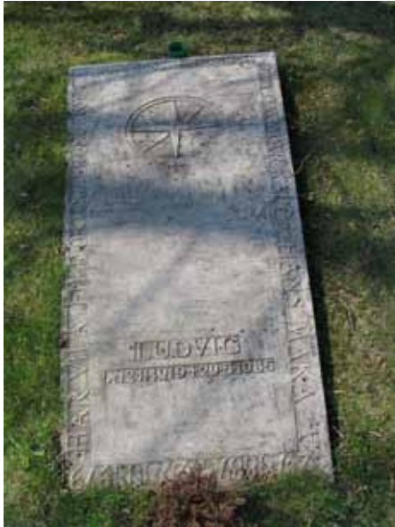
Liggande kalkstenschäll från 1934 i kvarter 2 (KI Arby kyrkog 023)