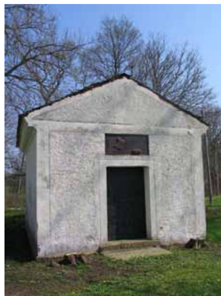
Familjen Rappes gravkor i det sydöstra hörnet av kyrkogården. Tidigare var det planterat en tuja på var sida om ingången (KI Arby kyrkog 052)