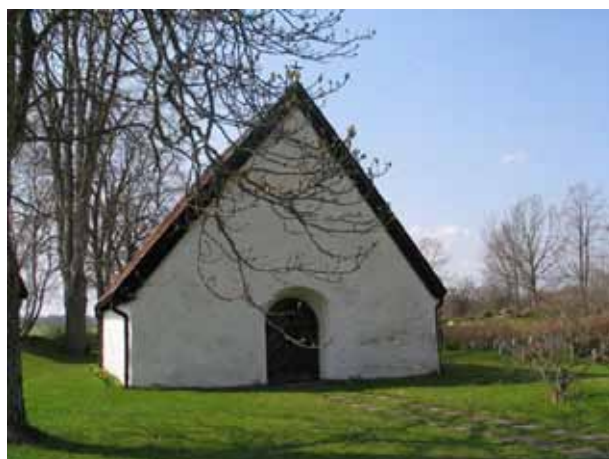
Det medeltida stenhuset i sydvästra delen av kyrkogården används som bårhus. Huset kan med tanke på hur den är uppförd vara lika gammal som kyrkan (KI Arby kyrkog 089)

Kyrkstallarna nämns första gången i de skrivna källorna 1840, då de reparerades och rödfärgades. År 1864 uppmättes kyrkbacken och förslag upprättades till nya kyrkstallar istället för de gamla. Vid kyrkostämman 1874 beslöts, att de nya stallarna skulle byggas på samma plats som de gamla. Stallarnas antal var ursprungligen tio. Stall 1-2 används nu av kyrkovaktmästaren för kyrkogårdens redskap. De övriga fungerar som magasin för kyrkans kyrkliga inventarier, likvagn med mera. I anslutning till de nya stallarna byggdes 1874 också en materialbod. Till detta ändamål användes virket i det gamla skjulet utanför kyrkogården, det vill säga den byggnad, som syns på Löfgrens teckning sydväst om kyrkogården