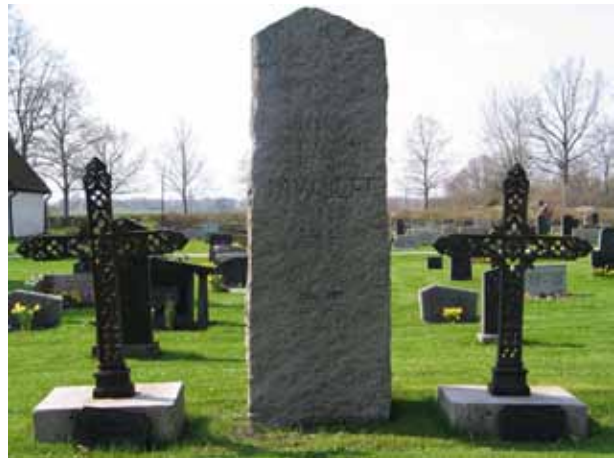
Direktör Wulffs familjegravplats med gjutjärnsvårdar över döttrarna Hanna och Julia som flankerar den höga stenvården, kv 5 (KI Arby kyrkog 051)

På flertalet av vårdarna är den dödes hemort angiven. Titlar förekommer på en mindre del av vårdarna. De titlar som finns är: smedmästaren, jungfrun, missionären, nämndemannen, lantbrukaren, byggmästaren, hemmansägaren, direktören för Applerums lantbruksskola. R W O, fältprosten, lokreparatören, häradsskrifvaren, skräddaremästaren, friherrinnan, landshövdingen, översten och friherren, Agr.doktorn, prosten samt kapten vid kungl. Första Livgrenärregementet och R.S.O.