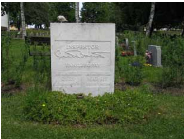
Marmorvård i kvarter 4. (KI Bäckebo kyrkog 069)

Kvarter 4 och 5 är anlagda enligt de principer som var moderna i början av 1950-talet. Gravvårdarna är ryggställda med häckar emellan, platser finns för urngravar vilket är ett gravskick som blivit allt vanligare under 1900-talet och gravvårdarna har för tiden den typiska rektangulära formen. I det fortsatta bruket av området är det viktigt att ta hänsyn till områdets karaktärsdrag.