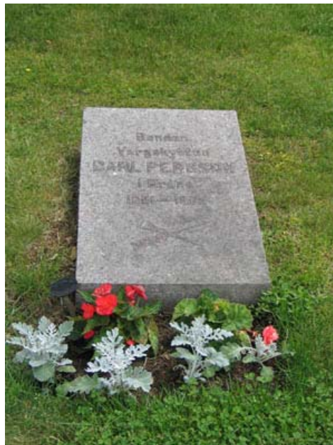
Bonden och vargskytten Carl Persson i Brånas gravvård i kvarter 3. (KI Bäckabo kyrkog 057)