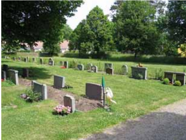
Kvarter 5 från sydväst. (KI Bäckebo kyrkog 073)

Gravvårdarna i kvarter 4 och 5 är låga, stående gravvårdar typiska för perioden från 1950 och framåt. Materialet är framförallt grå granit men även svart och röd förekommer. Ett mindre antal gravvårdar är tillverkade av andra material. I kvarter 4 finns två gravvårdar av marmor varav den ena är i form av ett kors. Dessutom finns också ett modernt träkors. Även i kvarter 5 finns ett marmorkors samt två träkors. Ett av dessa har försetts med träsniderier. Enligt uppgift ska det ha tillverkats av den lokale bildhuggaren Henning Rosenlund, tidigare anställd på Sandslätts möbelfabrik.