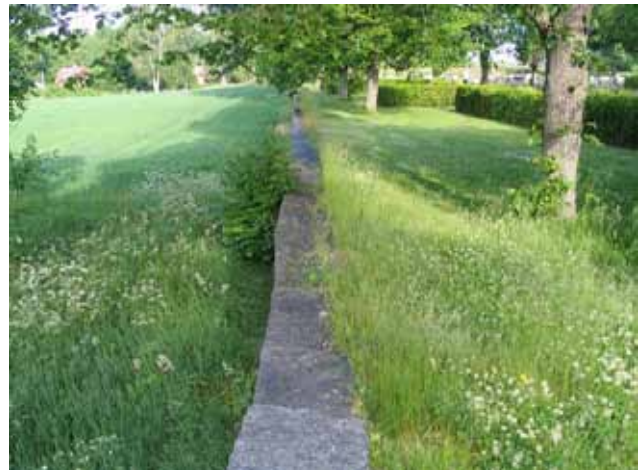
Kyrkogårdsmuren i söder. (KI Bäckebo kyrkog 008)