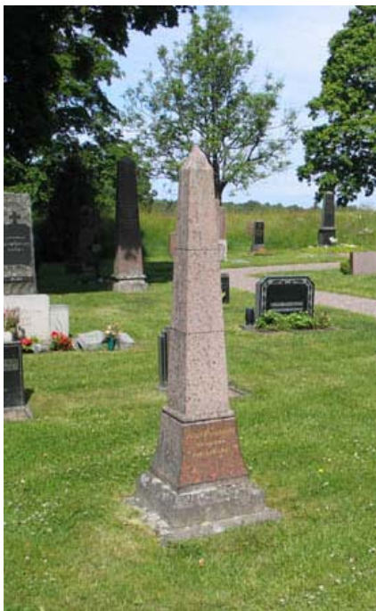
Gravvård i form av obelisk. (KI Bäckebo kyrkog 039)

Marmorvården med nygotiska drag som står i östra delen av kvarter 2 ska enligt uppgift vara placerad på den plats där altaret i det gamla kapellet stod.