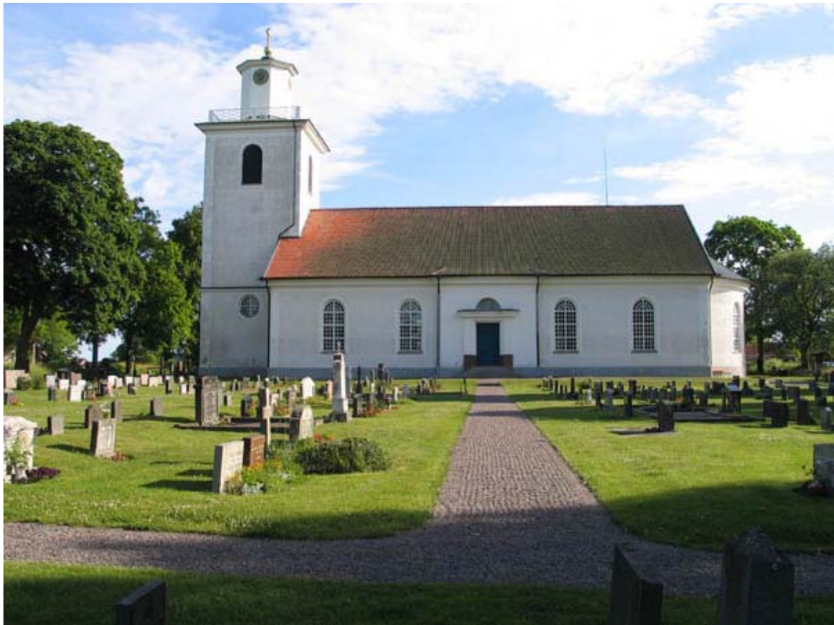
KI Bäckebo kyrkogård 021

Kulturhistorisk inventering av kyrkogårdar/ begravningsplatser i Växjö stift 2005