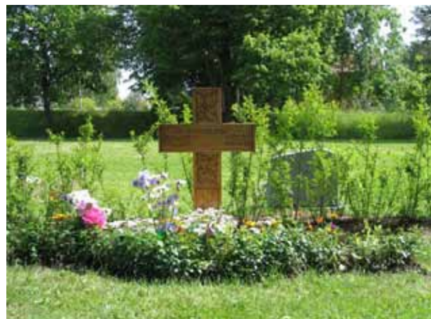
Snidat träkors i kvarter 5. (KI Bäckebo kyrkog 075)