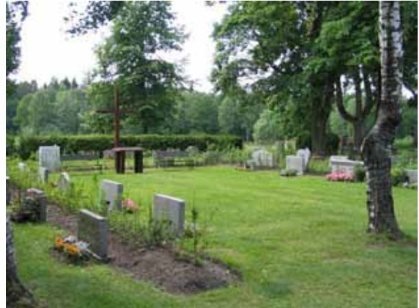
Plats för friluftsgudstjänst i kvarter 4 omgiven av urngravplatser. (KI Bäckebo kyrkog 070)