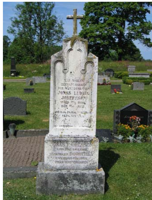
Gravvård av marmor som enligt uppgift markerar den plats där altaret i gamla kapellet tidigare stod. (KI Bäckebo kyrkog 042)