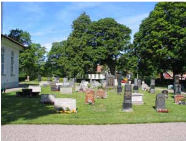
Kvarter 1 från öster. (KI Bäckebo kyrkog 026)

Kvarteret har brukats kontinuerligt under hela 1900-talet och gravvårdarna utgör därför en blandning av de olika typer som varit vanliga under denna period. Här finns höga stående gravvårdar från 1900-talets första decennier och låga stående gravvårdarna är av den typ som förekommer från 1930-talet. Här skiftar utformning och dekor mellan olika decennier. De äldsta av dessa gravvårdar har stildrag som knyter an till antikens tempel medan gravvårdar av yngre datum har en enklare dekor. Majoriteten av gravvårdarna är stående men liggande gravvårdar förekommer. Materialet är främst grå och svart granit, men även röd förekommer. Två gravvårdar har kvar sina omgärdningar. Den ena är en grusbelagd gravplats i kvarterets östra del. Den omgärdas av stenspallare och kätting. I vart och ett av gravplatsens hörn är buxbomsbuskar planterade. Mitt i kvarteret finns en gravplats insådd med gräs som har kvar sin stenram. I närheten av denna gravplats finns två gravvårdar i form av urnor av sten som placerats på pelare av sten samt en ovanlig gravvård med en skulptur av två händer på en pelare av sten.