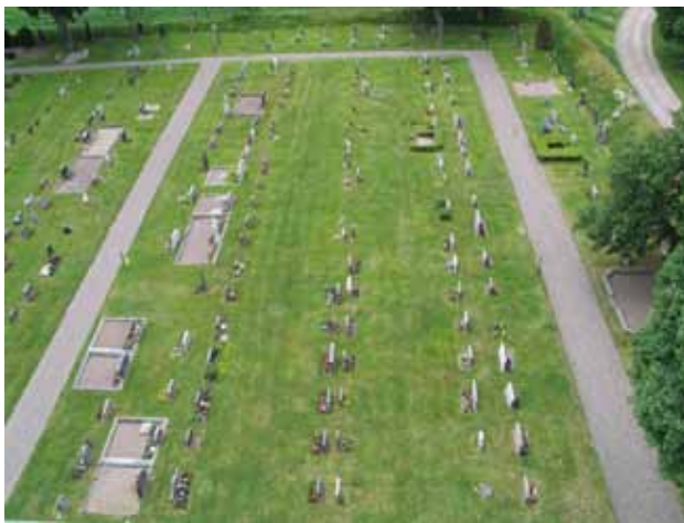
Kvarter 2 mot söder. (KI Bäckebo kyrkog 060)