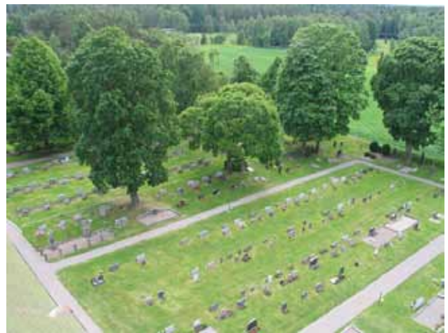
Kvarter 3 mot sydost. Träden i bildens mitt markerar gränsen mellan gamla och nya kyrkogården. Bortom raden med träd anas kvarter 4. (KI Bäckebo kyrkog 061)