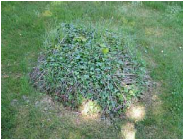
En av kyrkogårdens gravkullar, kvarter 2, som är klädd med murgröna. (KI Bäckabo kyrkog 037)

finns hantverksmässiga, konsthistoriska och lokalhistoriska värden. En typ av gravplatsarrangemang som idag är ovanlig på våra kyrkogårdar är gravkullar klädda med murgröna. På Bäckobo kyrkogård finns några gravkullar med murgröna bevarade vilket bidrar till att ge kyrkogården en ålderdomlig karaktär.