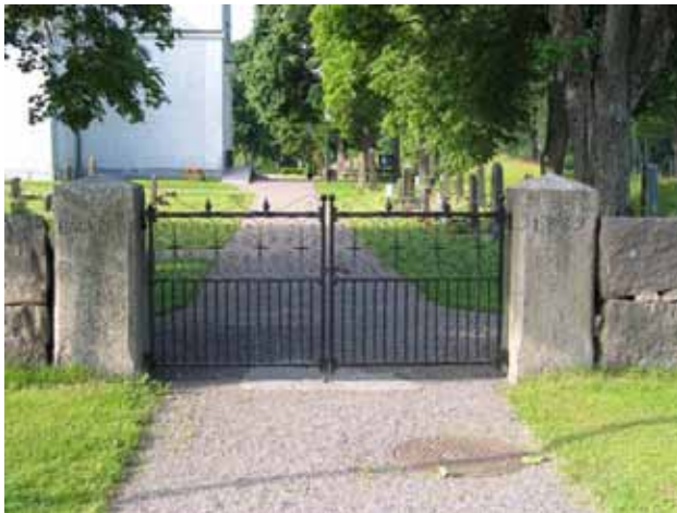
Den västra av de båda ingångarna i norr. På portstolparna är texten Bäckebo 1889 inristad. (KI Bäckebo kyrkog 004)

Utanför sydöstra hörnet av kyrkogårdsmuren ligger en mindre rödfärgad förrådsbyggnad av trä.