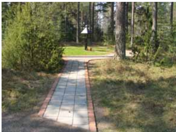
Gången in till minneslunden. (KI Bockara kyrkog 030)

På kyrkogården finns gravvårdar från tidigt 1930-talet fram till idag. Under 1930-talet försvann de höga stående gravvårdarna som än idag utmärker många äldre kyrkogårdar. Dessa finns således inte på Bockara kyrkogård. Här har man istället från början använt för tiden mera moderna gravvårdsformer. De är enhetligt låga och rektangulära till formen. Vid den här tiden var den nyklassicistiska stilen en viktig inspirationskälla. Denna stil tar upp drag som var typiska för antikens arkitektur och formgivning. Typiskt för gravvårdar från den här tiden är vårdarnas symmetriska uppbyggnad som ofta markeras av pelare eller kolonner, trekantiga eller raka krön samt dekorelement som kvistar, lövkransar och blomsterslingor. I mitten av 1900-talet blir gravvårdarna allt mer enkla. De är nu ofta helt rektangulära till formen. Även dekoren blir mer sparsmakad. Vanligt är ett enkelt kors. På 1970-talet blir talldungar och soluppgångar populära dekorelement. Under de senaste åren har gravvårdarna blivit alltmer individuella. De raka, rektangulära formerna har mjukats upp och dekoren har blivit mer personlig. Denna utveckling kan man dock ännu inte se så mycket av på Bockara kyrkogård. Man kan emellertid här finna flera exempel på att man återvunnit äldre gravvårdar.