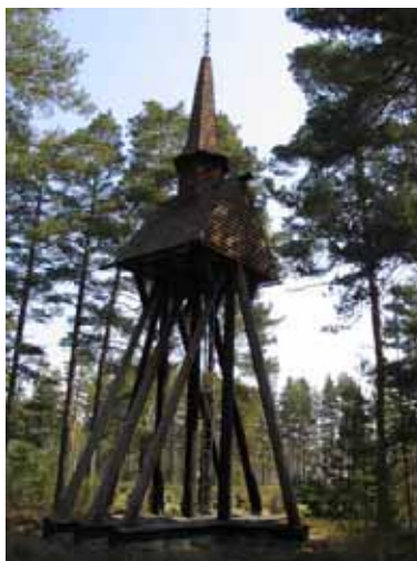
Klockstapeln (KI Bockara kyrkog 029)