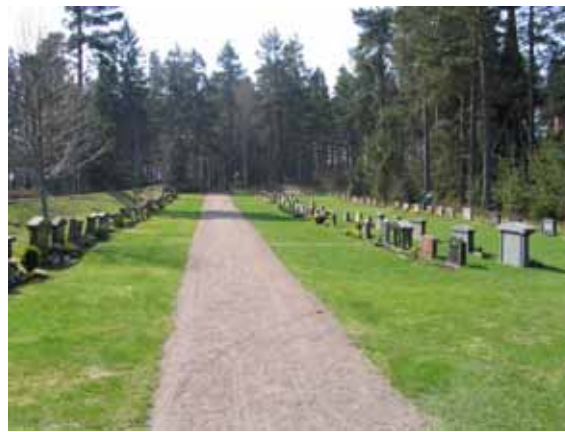
Till vänster kvarter D och till höger kvarter C. (KI Bockara kyrkog 022)