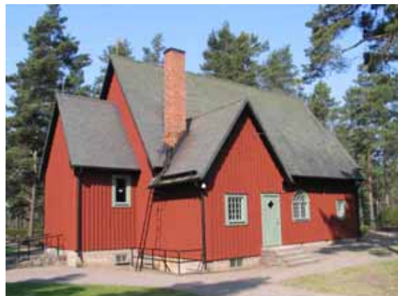
Bockara kapell från öster. (KI Bockara kapell 012)