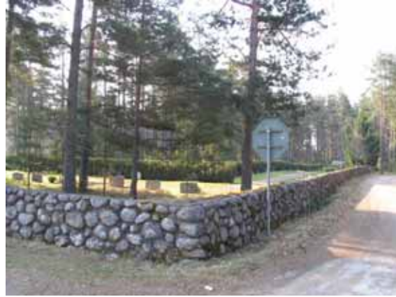
Kyrkogårdens mur i norr och väster. (KI Bockara kyrkog 002)