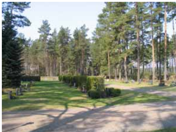
Till vänster kvarter F, i mitten delar av kvarter B och till höger kvarter E. (KI Bockara kyrkog 011)

I anslutning till förrådet, utmed kyrkogårdens södra mur, finns en uppställningsplats för vårdar som plockats bort från kyrkogården.