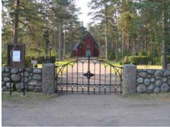
Kyrkogårdens ingång i norr. (KI Bockara kyrkog 001)