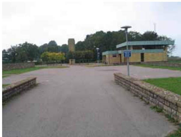
S:t Elavi kapell, klockstapeln och ingången till kyrkogården i öster. (KI Borgholm kyrkog 006)