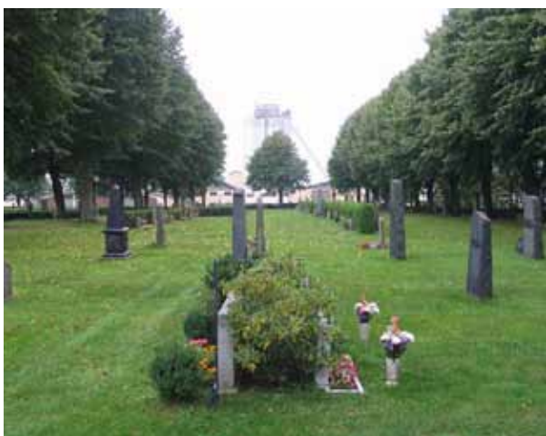
Norra delen av kyrkogårdens äldsta del från öster. (KI Borgholm kyrkog 024)

Den äldsta delen av kyrkogården är ett rektangulärt område i kyrkogårdsområdets västra del. Upplevelsen av områdets långsträckt karaktär förstärks av den gång kantad av höga lindar som delar området i en nordlig och en sydlig del samt genom gravvårdarnas placering i ryggställda rader. Mellan dessa rader är häckar av tuja eller liguster planterade. Samtliga gravvårdar är vända mot norr eller söder. I områdets västra och östra del står vårdarna i rader utan rygghäckar. Här är majoriteten av vårdarna vända mot söder. Området har genomgått flera genomgripande förändringar. Gravplatserna var tidigare belagda med grus men alla utom två är idag insådda med gräs. Raderna med gravvårdar har troligen rätats upp och rygghäckarna har planterats. Ursprungligen ska här ha funnits linjegravsområden men av dessa ser man idag inga spår. Det tydligaste tecknet på områdets ålder är de äldre gravvårdarna som i flera fall är mycket framträdande.