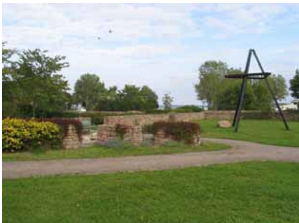
Ceremoniplatsen i norra delen av kyrkogårdsparken. (KI Borgholm kyrkog 048)