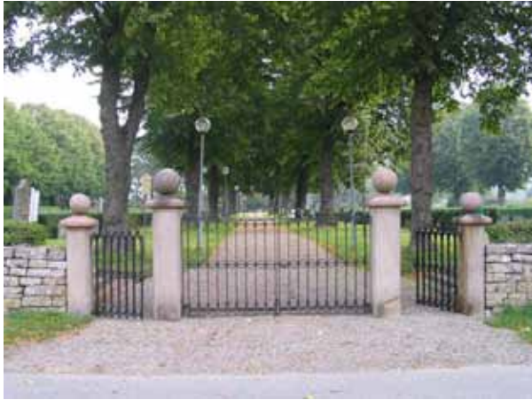
Kyrkogårdens ingång i väster. (KI Borgholm kyrkog 001)