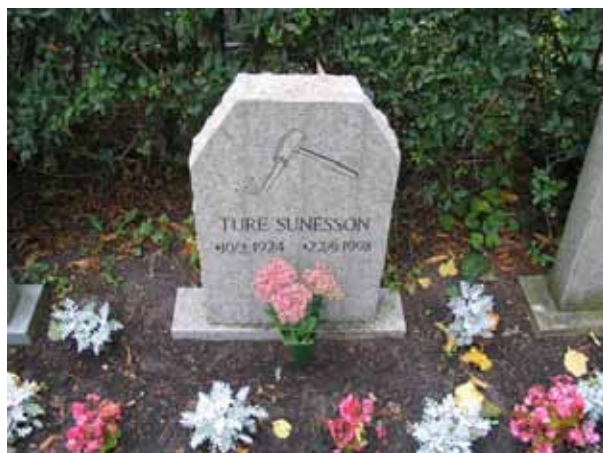
Efter att ha varit omodernt under en tid börjar det nu på nytt bli vanligare att ange den dödes yrkestitel. Nu mera görs det dock ofta med hjälp av bilder. Här en stenhuggares gravvård. (KI Borgholm kyrkog 030)