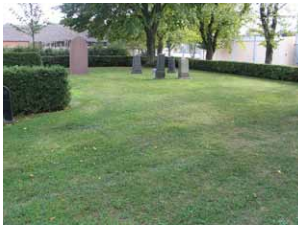
Resterna av det ursprungliga S:t Elavi kapell i sydvästra hörnet av den äldsta delen av kyrkogården. En svag, rektangulärt formad förhöjning i marken kan ses. (KI Borgholm kyrkog 057)