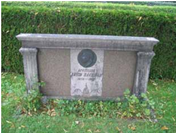
Gravvård över apotekare Backman död 1947. Vårdens utformning är typisk för sin tid fränsett porträtt medaljongen. (KI Borholm kyrkog 017)