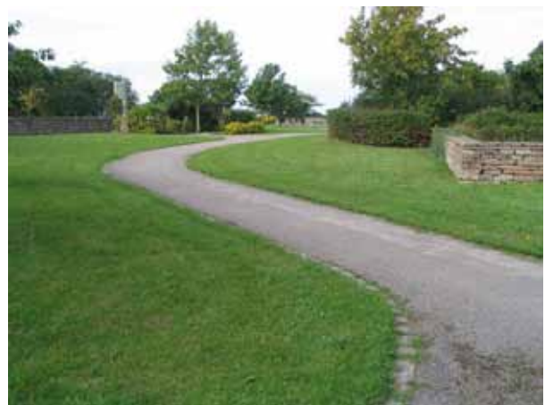
Asfalterad gång genom kyrkogårdsparken i kyrkogårdens östra del. Här slingrar sig gångarna fram. (KI Borgholm kyrkog 050)