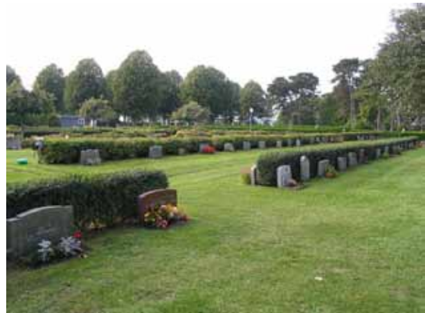
Området från 1950-talet fotograferat från sydost. Gravvårdarna är låga och har en enkel dekor vilket är typiskt för 1900-talet andra hälft. (KI Borgholm kyrkog 040)