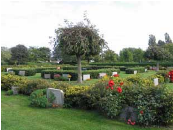
En del av området från 1950-talet är anlagt i rektanglar där gravvårdarna är ryggställda med häckar t.ex. ölandstok och lagerhägg är planterade. I en av rektanglarna är sorgaskar planterad i hörnen. (KI Borgholm kyrkog 036)

häckarna är låga har man en god överblick över området. Detta i kombination med de låga gravvårdarna ger området en regelbundenhet.