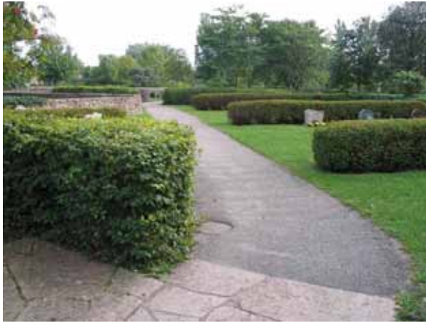
1990-talets utvidgning av kyrkogården från norr. (KI Borgholm kyrkog 045)

genom området, låga murar och rygghäckar hjälper till att dela in området i mindre rum. Gravvårdarna är placerade i ryggställda rader i vinkel mot gången. Häckarna är bl.a. av spirea, avenbok och måbär. Området har en modern karaktär med en mjukare anläggningsform och större avskildhet.