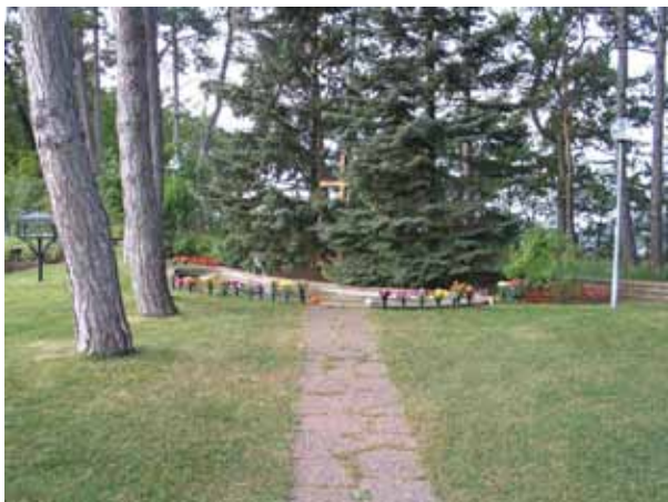
Minneslunden från söder. (KI Borgholm kyrkog 043)