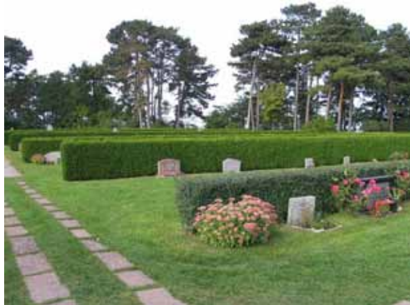
På området från 1920-talet står gravvårdarna ryggställda mot häckar av tuja. (KI Borgholm kyrkog 035)

Vårdarna är vända mot norr eller söder. Eventuellt kan man i de södra delarna av området se rester av ett linjegravsområde men det är inte helt klarlagt. Karaktären är enkel och enhetlig.