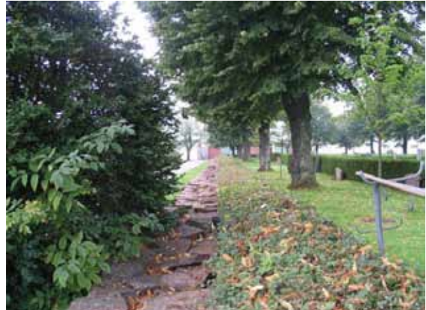
Kyrkogårdsmur, häck och trädkrans omgärdar den äldsta delen av kyrkogården. Här den södra sidan från öster. (KI Borgholm kyrkog 012)