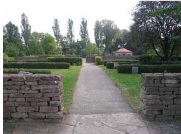
Kalkstenmurar avdelar den nya kyrkogårds delen i flera rum. Söder om kyrkogården, i fonden syns en av vaktmästeriets byggnader. (KI Borgholm kyrkog 046)