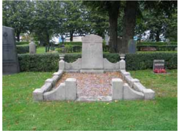
Påkostat gravplatsarrangemang med stenram, urnor och grusbeläggning. Vården är över kronfogden ? som dog 1921. (KI Borholm kyrkog 015)