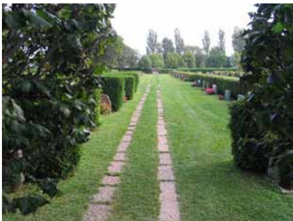
Gång från minneslundan mot söder. Kalkstensflisor har lagts som två spår i gräsmattan. Gången är rak och anslutande gånger möter i räta vinklar. (KI Borgholm kyrkog 042)

På den äldsta delen av kyrkogården finns en gång från ingången i väster fram till gränsen mot 1920-talets utvidgning. Denna gång är belagd med grus. Gången viker av i rät vinkel och fortsätter söderut fram till vaktmästeriet. Den är i norr belagd med grus men övergår till att markeras av två rader med kalkstensplattor i gräsmattan. Ytterligare en gång går söderut från minneslundan. De båda sist beskrivna gångarna binds samman av två gånger i nord-sydlig riktning. Även dessa markeras av två rader med kalkstensplattor. På kyrkogårdsområdet från 1990-talet förbinds del olika delarna av området med asfalterade gånger.