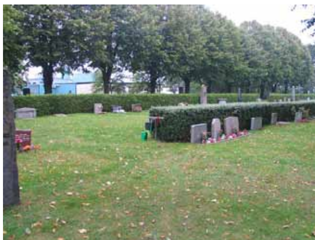
Norra delen av kyrkogårdens äldsta del från väster. (KI Borgholm kyrkog 029)