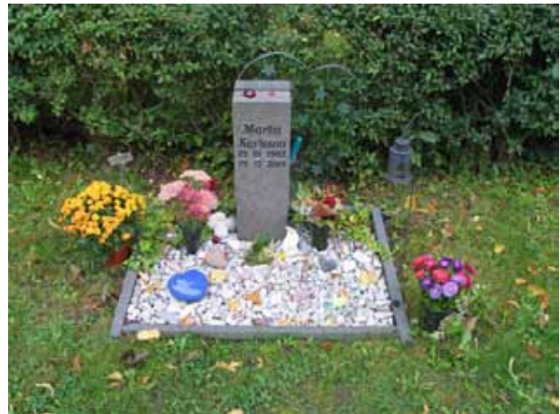
Modern gravvård av glas och sten. Att smycka gravplatsen med blommor, lyktor, stenar, små skulpturer, leksaker m.m. blir allt vanligare. (KI Borholm kyrkog 026)

Majoriteten av vårdarna är av svart eller grå granit men även röd förekommer. Det är också vanligt med vårdar av kalksten. Utöver dessa material finns en vård av sandsten och marmor, tre av marmor, ett gjutjärnskor, två av smide, två av sten och glas samt en mycket ovanlig gravvård av kalksten med en mosaikinläggning. Troligen har samtliga äldre familjegravplatser tidigare varit omgärdade och belagda med grus. Idag finns endast två av dessa kvar. Den ena,