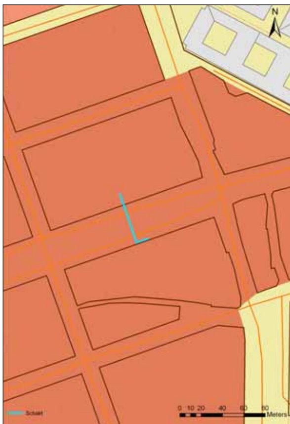
Bild 2. Schaktets ungefärliga utsträckning.

Ett schakt drogs över Esplanadens södra del och in i Esplanadens grönyta. I den delen av schaktet påträffades inget av antikvariskt intresse.