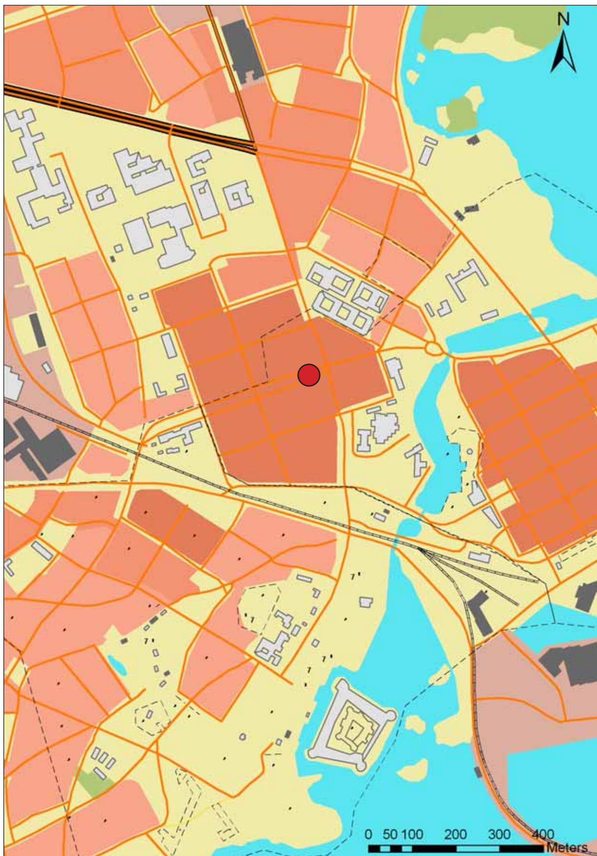
Bild 1. Undersökningsplatsen markerad med röd punkt på kartan. Fornlämningsområdet markeras med tunn svart linje.