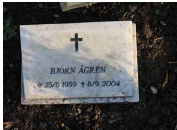
I urngravskvarteret finns en liten vård av marmor (KI Dörby kyrkog 118)