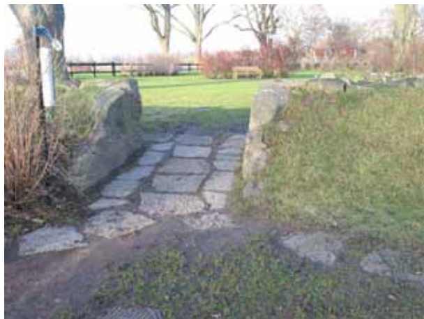
Mellan gamla och Nya delen har man lagt en gång av kalkstensplattor (KI Dörby kyrkog 162)