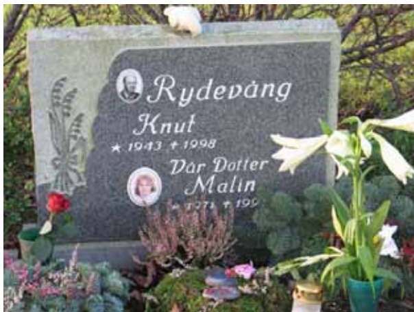
I kvarter 13 finns en vård med fotografier infällda (KI Dörby kyrkog 123)