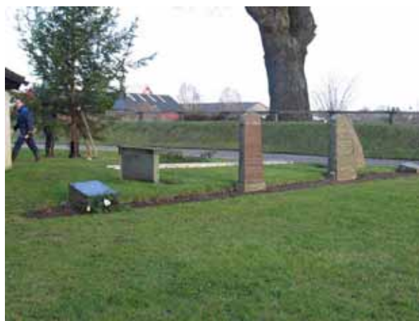
Kvarter 8 är ett litet kvarter intill stenhuset (KI Dörby kyrkog 091)