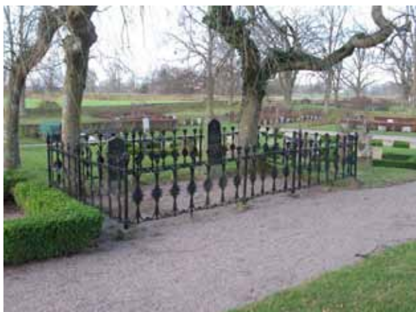
Gjutjärnsstaket väster om kyrkan (KI Dörby kyrkog 058)