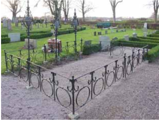
En gravplats anlagd 1939 omgärdas av ett smidesstaket och vårdarna är också dom av smide. (KI Dörby kyrkog 078)