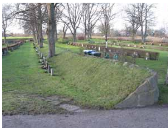
På insidan är et en gräsklädd jordvall (KI Dörby kyrkog 142)