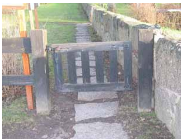
In till den Nya delen leder en enkel trägrind i väster (KI Dörby kyrkog 160)