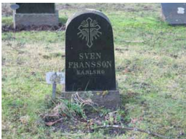
I det sydvästra hörnet finns ett flertal mindre vårdar (KI Dörby kyrkog 046)