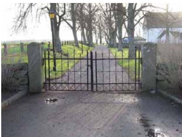
I norr är en dubbel svartmålad järngrind mellan portstolpar av granit (KI Dörby kyrkog 136)

I söder finns en enkel grind av träd i en öppning upptagen i muren. Den leder till personalutrymmen och förråd som ligger strax utanför kyrkogårdsmuren.