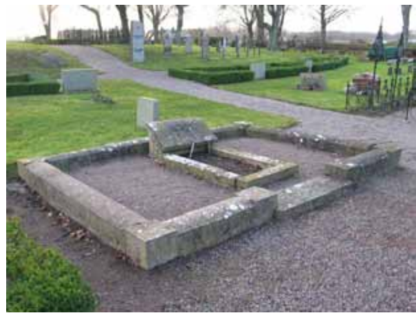
En av gravplatserna omgärdas av en stenram istället för en låg häck (KI Dörby kyrkog 072)

I området förekommer titlar endast på fyra av vårdarna och de titlar som finns är handlanden, sergeanten, hemmansägaren och plåtslagaremästaren. Den dödes hemort omnämns på mindre än hälften av vårdarna.