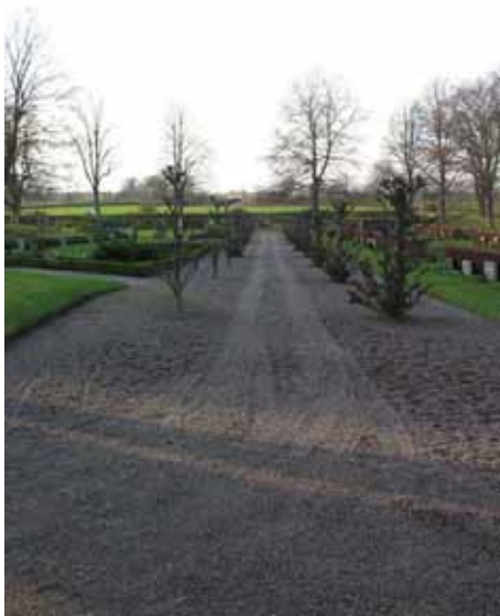
Mellan den del som tillkom 1920-talet och den del som tillkom i slutet av 1950-talet är en gång kantad av pyramidalmar (KI Dörby kyrkog 143)