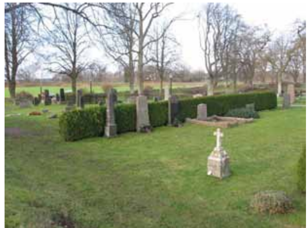
Översikt över kvarter 3 och 4 från sydost (KI Dörby kyrkog 031)

Kvarter 1-5 ligger söder och precis väster om kyrkan och kvarter 8 utgörs av ett mycket litet kvarter strax nordost om kyrkan intill det gamla stenhuset och utgör den äldsta delen av kyrkogården. Området avgränsas av kyrkogårdsmuren i öster, söder och delvis i väster. I övrigt utgörs begränsningen av en grusgång. Mellan de olika kvarteren är det planterat häckar av tuja. Den gamla vallmuren har sparats mellan den gamla kyrkogården och den Nya delen.