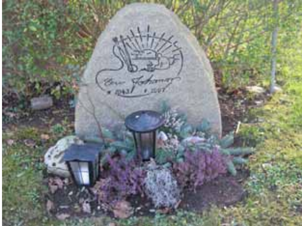
Symbolerna på de moderna vårdarna är mycket friare och personligare (KI Dörby kyrkog 132)

Vårdarna står i ryggställda rader med rygghäckar av liguster. Kvarterets äldsta vård är från 1993 och kvarteret domineras helt av vårdar från 1990-talet och framåt. Majoriteten av vårdarna är av grå granit, ett fåtal är tillverkade i röd granit och enstaka i svart granit. Det finns endast två vårdar som anger den dödes yrkestitel, civilingenjören och lantbrukaren. På ett fåtal vårdar finns den dödes hemort upptagen.