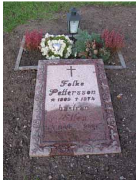
I mitten av kvarter 9-11 är det liggande vårdar (KI Dörby kyrkog 098)

Endast på ett fåtal av gravvårdarna finns den dödes yrkestitel upptagen. I kvarter 11 finns det dock inte på någon. De titlar som finns är: kyrkoherde, kantor, nämndeman, hemmansägare, byggmästare, civilingenjören, fanjunkaren, folkskolläraren, lantbrukare, läraren och friherren. Den dödes hemort nämns på ett fåtal av gravvårdarna.