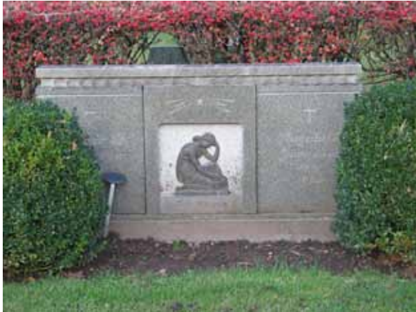
Ovanligt motiv på vårdan (KI Dörby kyrkog 100)