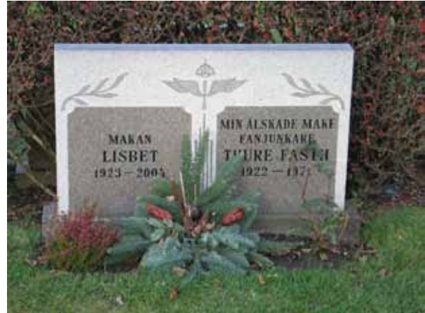
En av gravvårdarna som har den dödes titel utskriven (KI Dörby kyrkog 105)