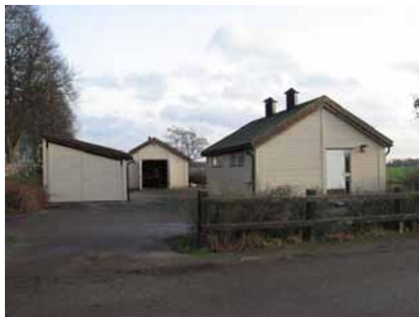
Utanför kyrkogården i sydväst ligger förråd, garage och personalutrymmen (KI Dörby kyrkog 154)