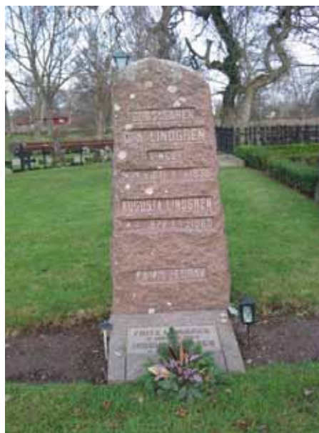
Röd granitvård rest över godsägare C A Lindgren och hans familj (KI Dörby kyrkog 052)