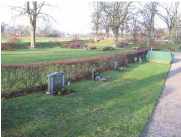
Översikt över kvarter 13 från söder (KI Dörby kyrkog 121)

Kvarteret domineras av låga rektangulära gravvårdar. Materialet är främst grå och svart granit men även röd förekommer. En liten vård i kvarter 11 är en natursten med en textplatta av koppar. I kvarter 13 finns en kalkstensvård och en granitvård har de gravlagdas fotografier infällda. En vård i urngravskvarteret är av marmor. Den äldsta vården är från 1960 och finns i kvarter 9. Kvarteren har tagits i bruk från öster mot väster. I mitten av kvarteren är det en enkelrad med bara liggande vårdar. Den äldsta graven i urnlunden är från 1968.