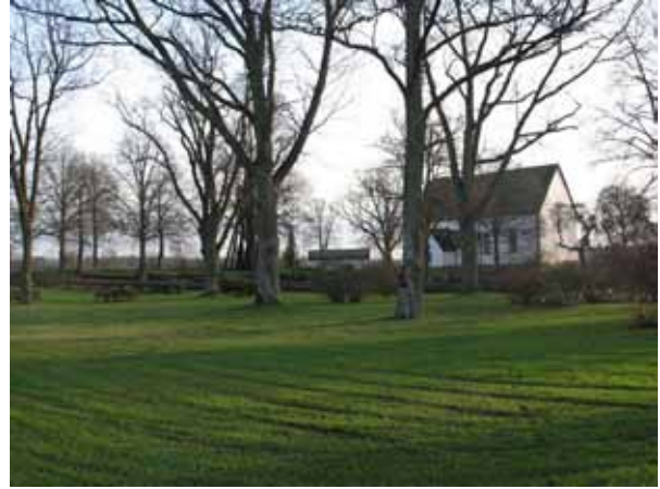
I den del som är kyrkogårdspark intill minneslunden planerar man för att anlägga en asklund (KI Dörby kyrkog 167)