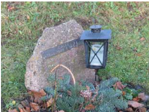
På en natursten sitter en textplatta av koppar (KI Dörby kyrkog 107)

Nya kyrkogården tillkom vid utvidgningen av kyrkogården 1950-tal och är tidstypisk för tiden med sin enhetliga karaktär. Vårdarna är låga och stående. De är placerade i ryggställda rader mot häckar. Inom området finns även en urnlund. I det fortsatta bruket av området bör den plan som finns för områdets utformning följas.