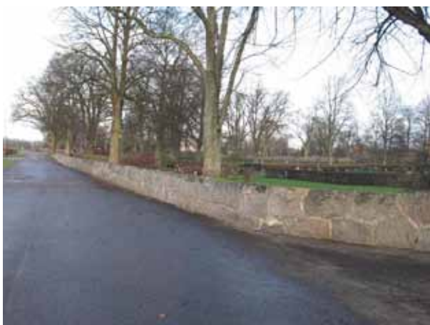
Muren mellan Nya och gamla delen samt i väster är uppförd av huggen sten och lagd i bruk (KI Dörby kyrkog 152)