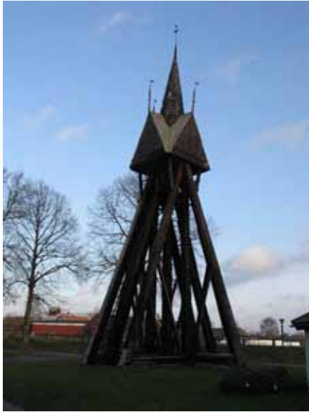
Klockstapeln som troligen uppfördes på 1600-talet står nordost om kyrkan (KI Dörby kyrkog 146)