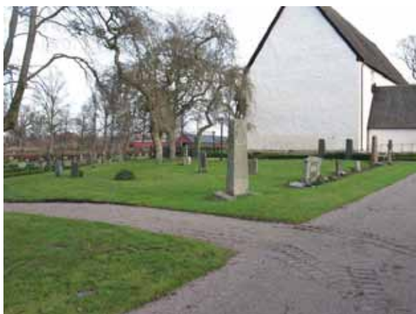
Översikt över kvarter 5 från sydväst (KI Dörby kyrkog 049)

Närmast kyrkan har de stora gårdarna i socknen sina familjegravplatser. En del gravrader står mot rygghäckar av tuja, främst mellan de olika kvarteren. Vårdarna är vända åt väster, öster, norr och söder och hela området är insått med gräs.