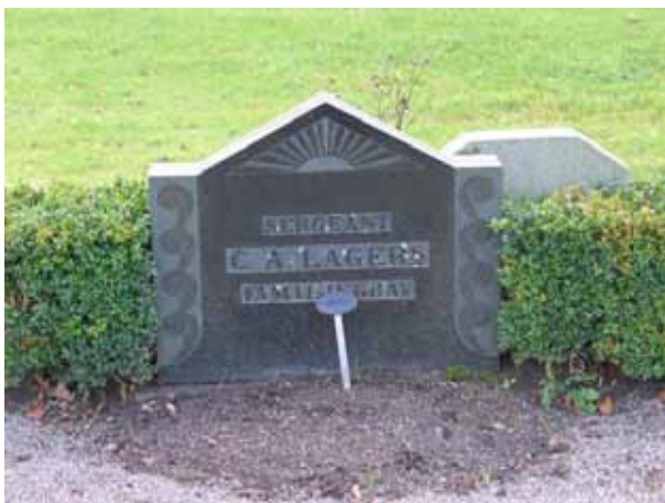
En av de få gravvårdar med titlar i området (KI Dörby kyrkog 071)

Kvarteren domineras av de omgärdade gravplatserna som ligger i kvarterens ytterkanter. I mitten av varje kvarter är det en gräsmatta. Huvudparten av gravplatserna i ytterkanterna omgärdas av låga buxbomshäckar och grusade gravvitor. En gravplats omgärdas av en stenram av grå granit och ytterligare en kringgärdas av ett modernt smidesstaket. Även de tre vårdar som står på gravplatsen är moderna smidesvårdar. Majoriteten av vårdarna är av svart eller grå granit. Enstaka i röd granit förekommer också. Några av vårdarna har klassicerande stildrag. De omgärdade gravplatserna är familjegravar. I mitten av kvarteren står mindre enklare gravvårdar. Det är rester efter linjegravssystem som funnits. I kvarter 6 finns vårdar från 1933-40 och i kvarter 7 kan man eventuellt följa ett linjegravsområde från 1941-63.