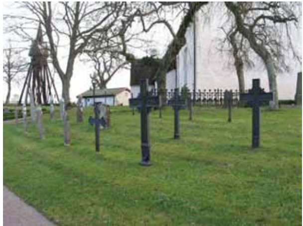
I slänten nordväst om kyrkan står ett stort antal äldre vårdar som tagits ur bruk uppställda (KI Dörby kyrkog 063)