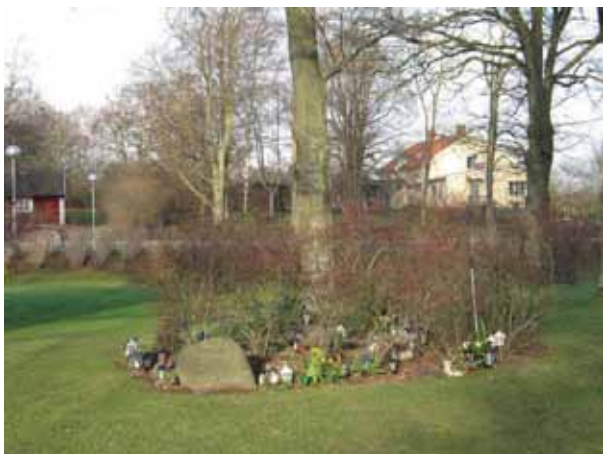
Minneslunden invigdes 1988 och ligger i den nordvästra delen av kyrkogården (KI Dörby kyrkog 163)

En minneslund anlades under 1980-talet i den del som är kyrkopark. I mitten finns en springbrunn och bakom den är häckoxbär och syrener planterade. På andra sidan står en bänk och bakom den växer det häckoxbär och korneller. Intill springbrunnen finns en natursten med texten minneslunden inhuggen. Församlingen har för avsikt att förändra minneslunden. I samband med detta skall också en asklund iordningställas i området mellan minneslunden och den nya delen.