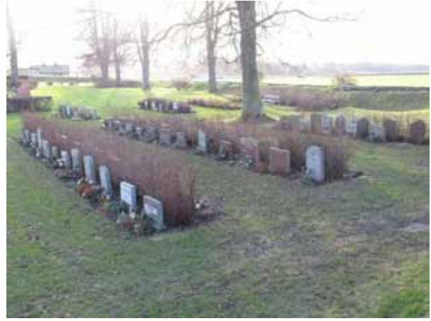
Översikt över kvarter 12, urngravskvarteret, från norr (KI Dörby kyrkog 112)