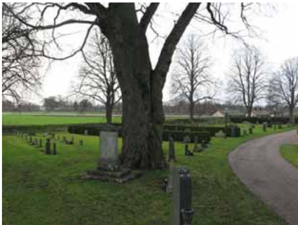
Översikt över kvarter 1 och 2 från nordost (KI Dörby kyrkog 001)