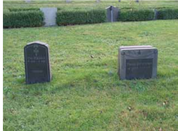
Ett fåtal av linjegravvårdarna finns kvar, dessa två är från 1948 respektive 1949 (KI Dörby kyrkog 087)