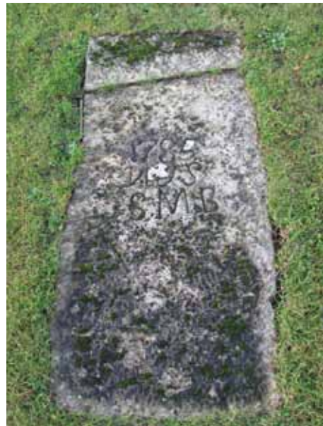
Liggande häll från 1785 med de dödas initialer förutom årtalet (KI Dörby kyrkog 023)

Titlar är vanliga i kvarteren utom kvarter 4 där titlar helt saknas. Godsägaren och hemmansägaren är de vanligast förekommande titlarna. I övrigt finns det ett stort antal olika titlar som; lantbrukaren, disponenten, smålänning, båtsmannen, stationsinspektoren, tegelslagaren, ingenjören, majoren, muraren, trotjänarinnan, lektorn, fil. Dr, agronomen, skraddaremästaren, kyrkovaktmästaren, agronomen, kommunal mannen, riksdagsmannen, åldermannen, kyrkovärden, smedmästaren, modellsnickaren, rättaren, godsägaren, Sergeanten vid flygvapnet, doktor med, distriktschefen, komministern, torparen, kyrkovakten, kronofjärdingsmannen, kyrkoherden, komministern, kontraktsprosten, kantor, fil. Stud., prosten och Högalidsrektorn. Den dödes hemort anges på ungefär hälften av vårdarna.