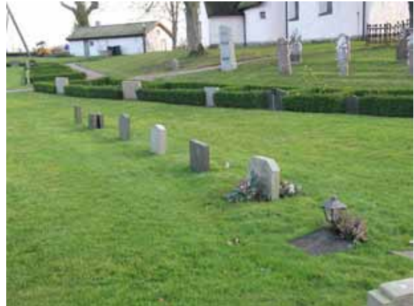
I mitten av både kvarter 6 och 7 finns rester efter ett linjegravssystem (KI Dörby kyrkog 082)