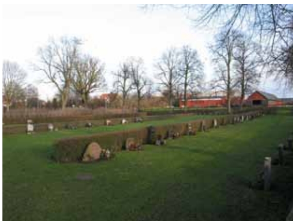
Översikt över den Nya delen från sydväst (KI Dörby kyrkog 127)

Nya delen är den senast tillkomna delen av kyrkogården. Den anlades i mitten av 1980-talet. I norr avgränsas området av en mur av natursten. I öster är det en gång innan kyrkogårdsomgärdningen i form av en vall med ett trästaket tar vid. I söder är den gamla kyrkogårdsmuren och i väster är ett parkområde som avgränsas av ett brunmålat staket av trä. Till en början var det inte tänkt att vara några häckar i kvarteret men då det blev så stora öppna ytor var det svårt att få folk att välja en plats på den nya delen och man planterade rygghäckar för att skapa rum. Vårdarna är vända mot norr och söder. Hela området är insått med gräs. I områdets västra del finns minneslundan och där planeras också för en asklund.