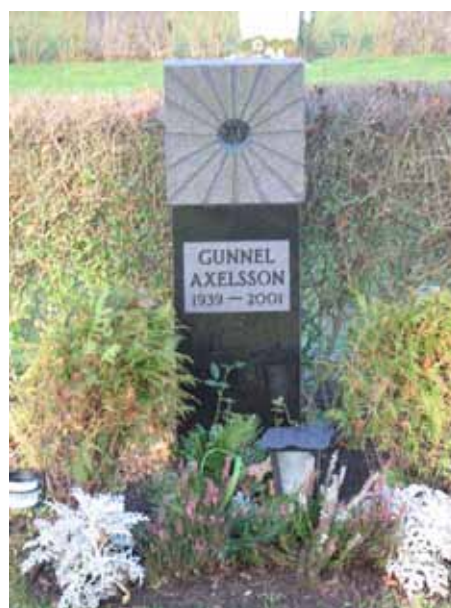
En annorlunda gravvård av svart granit (KI Dörby kyrkog 129)