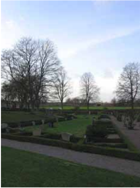
Kvarter 6 och 7 anlades i samband med utvidgningen på 1920-talet (KI Dörby kyrkog 069)