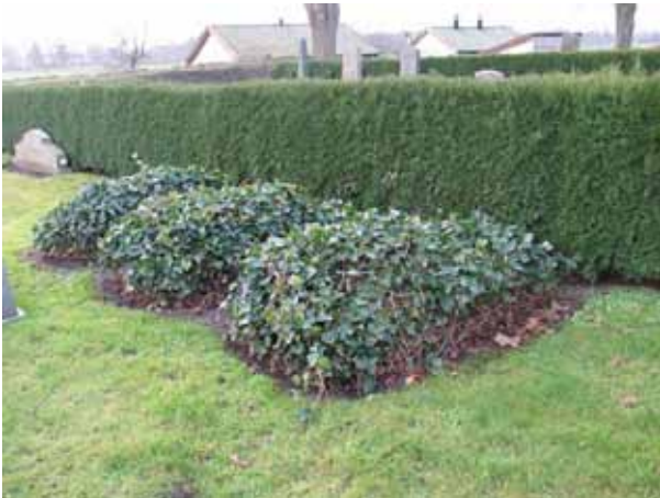
Flera gravplatser i området har jordkullar beväxta med murgröna men ingen vård (KI Dörby kyrkog 026)