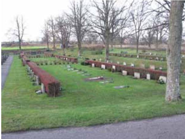
Översikt över kvarter 9-11 från öster (KI Dörby kyrkog 095)