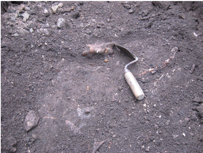
Figur 5. Kulturlagret framför Restaurang Höjden, längs Kabelsträckning 1. Foto från öst Ludvig Pappmehl-Dufay / Kalmar läns museum.

Inom en sträcka av ca 5-6 m söder om och snett framför restaurang Höjden (se fig 2) framkom på ca 60-70 cm djup ett kompakt kulturlager innehållandes rikligt med obränt ben och träkol (figur 5). Lagret berördes inte vidare av schaktningen, som längs denna sträckning generellt sett inte gick djupare än ca 50-60 cm. Kulturlagrets ålder är oviss, men med tanke på resultaten från undersökningarna för restaurangen på 1980-talet och för entrébyggnaden 2004 torde en datering till yngre järnålder eller medeltid inte vara osannolik.