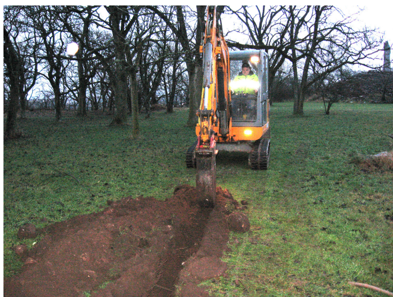
Figur 4. Arbetsbild från schaktningen för kabelsträckning 2, den 8 januari 2008. Foto från sydväst Ludvig Papmehl-Dufay / Kalmar läns museum.

Till större delen visade sig Kabeldragning 1 gå genom kraftigt omrörda lager, med rikligt med sentida avfallsmaterial såsom ben, buteljglas och stora mängder kapsyler. Ingenting observerades här som antydde att lagret innehöll förhistoriskt eller medeltida material, även om detta inte ska uteslutas. Längst i öster var lagret påfallande mörkt och sotigt med