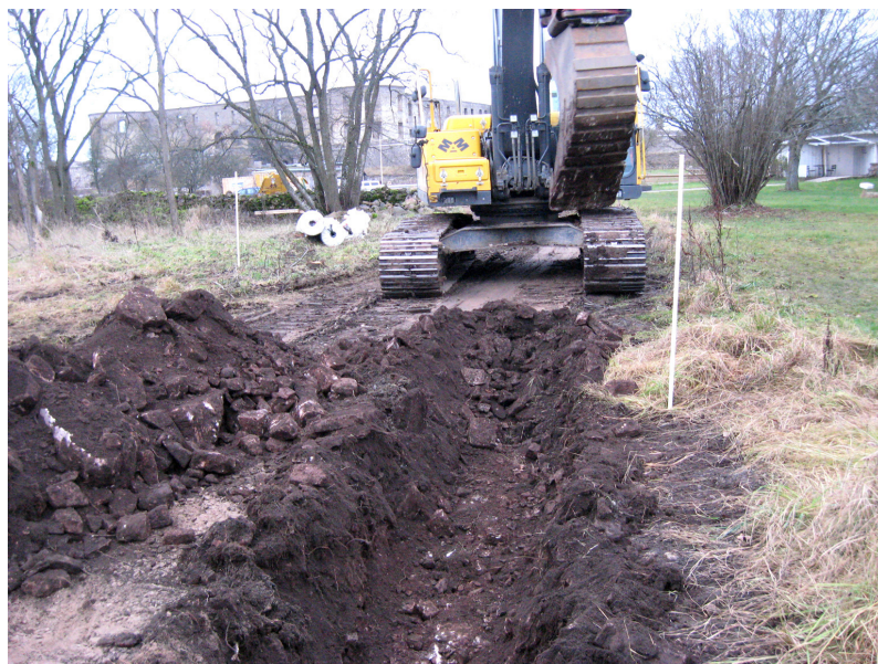
Figur 3. Arbetsbild från schaktningen för kabelsträckning 1, den 13 december 2007. Foto från öst Ludvig Papmehl-Dufay / Kalmar läns museum.