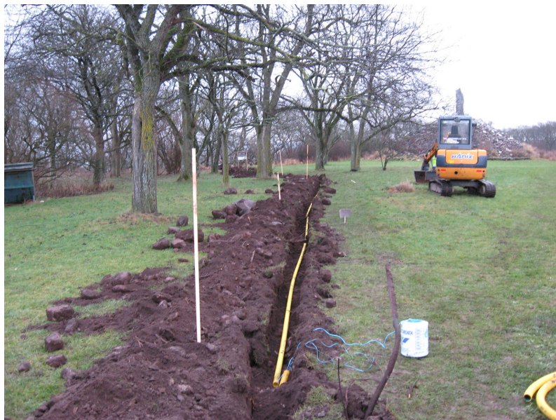
Figur 6. Översiktsbild över Kabeldragning 2. Kulturlagret noterades från strax innan kröken (i höjd med maskinen) och bortåt ca 25 m. I bakgrunden till höger skimtar den s.k. Jaktstenen. Foto från sydväst Ludvig Pappmehl-Dufay / Kalmar läns museum.

stora delar av Kabelsträckning 1. Den mörka jorden tolkas här som ett kulturlager, vars ålder tills vidare är oviss.