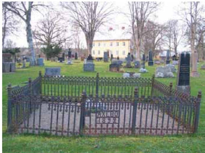
Gjutjärnsvård och bevarad grusbeläggning från 1892 i kvarter B. (KI Fagerhult kyrkog 080)