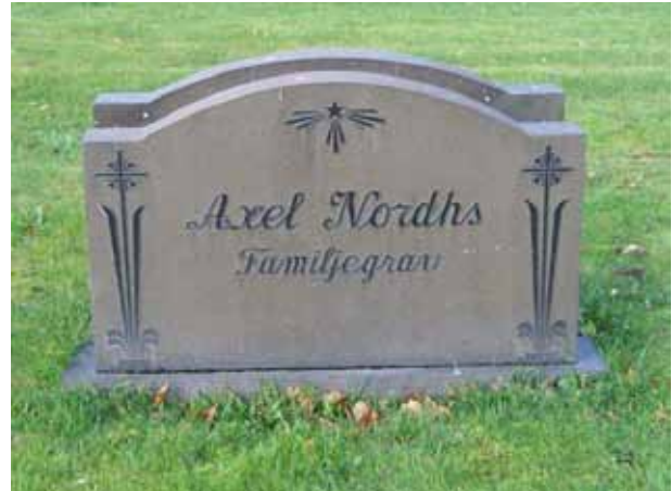
Vanlig typ av vård i kvarter A (KI Fagerhult kyrkogård 037)