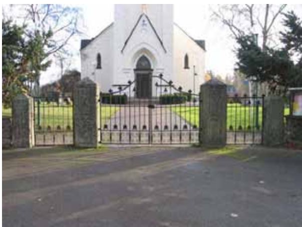
Ingången i väster med svartmålade järngrindar (KI Fagerhult kyrkog 006)