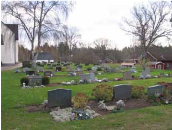
Översikt över kvarter A från väster (KI Fagerhult kyrkogård 028)

Kvarter A består av ungefär 307 platser och ligger söder om kyrkan. Området avgränsas i söder och väster av kyrkogårdsmuren. I norr och öster löper en asfalterad gång. Kvarteret delas i två hälfter av den asfalterade gång som leder från trappan i kyrkogårdsmuren i söder fram till kyrkans södra ingång. Kvarteret består av dubbla rader med vårdar som är ryggställda. De två sista raderna längst i öster har dock en rygghäck av rosenspirea. Vårdarna är vända mot väster och öster samt en mot söder. Gravplatserna är anlagda för kistgravar. Hela området är gräsbesätt men gravvårdarna är placerade i öppen jord.