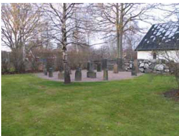
Olika typer av äldre vårdar uppställda på en iordningställd yta (KI Fagerhult kyrkog 016)

I den sydvästra delen av den gamla kyrkogårdsdelen finns bårhuset. Det uppfördes år 1952 av byggmästare Oskar Helgee i Alsterbro. Kapellet har vitputsad fasad och svartmålat plåttak likt kyrkan. Ingångspartiet har hörn av kalksten och trappan ner till kappellets ingång är också kalksten. På taggaveln över den inskjutna entrén är det tjärade träspån. Bårhuset används fortfarande som bårhus.