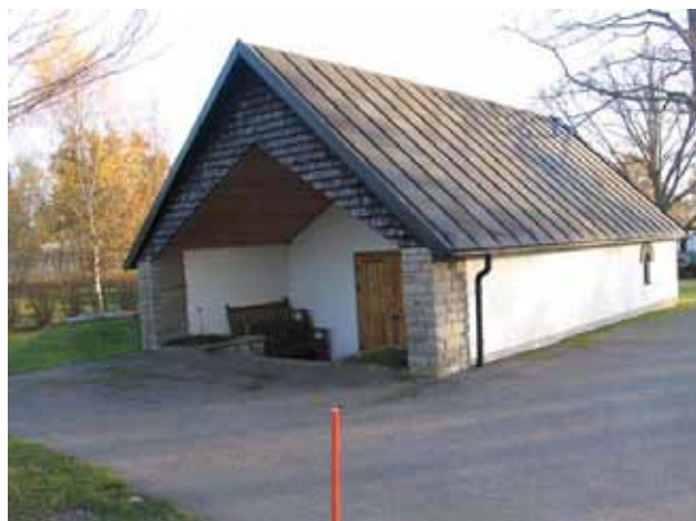
Bårhuset uppfört 1952 (KI Fagerhult kyrkog 153)