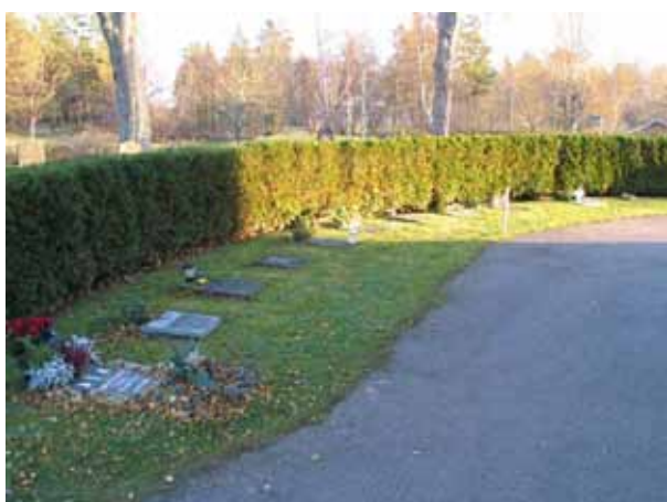
Urgravsområdet öster om kyrkans kor. (KI Fagerhult kyrkog 149)