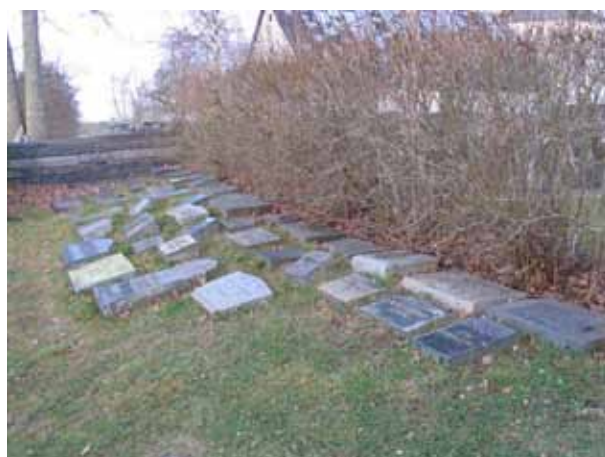
Äldre vårdar tagna ur bruk (KI Fagerhult kyrkog 018)