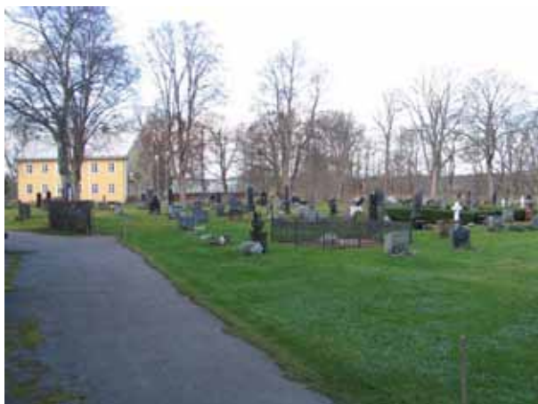
Översikt över kvarter B från sydost. Gamla skolhuset syns i bakgrunden (KI Fagerhult kyrkog 047)