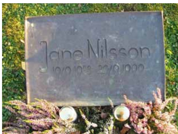
Liggande vård av kopparplåt i urngravsområdet (KI Fagerhult kyrkog 152)