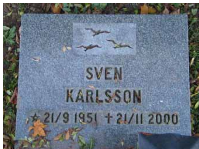
Liggande gravvård i kvarter D (KI Fagerhult kyrkog 165)