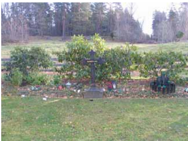
Minneslund tillkom öster om kyrkan 1993 (KI Fagerhult kyrkog 013)