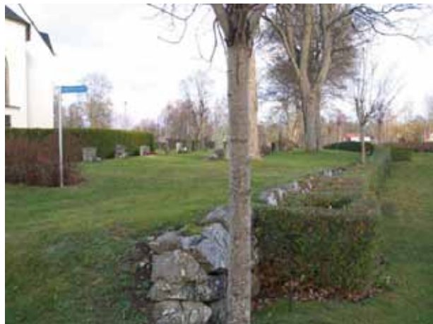
Gränsen mellan nya delen, kvarter D och gamla delen av kyrkogården, kvarter C (KI Fagerhult kyrkog 015)