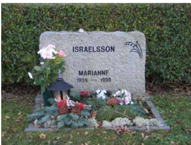
Gravvård i kvarter D (KI Fagerhult kyrkog 163)

På en av vårdarna anges den dödes yrkestitel, glasblåsaren. På nästan hälften av gravvårdarna anges den dödes hemort.