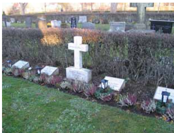
Några av kyrkogårdens många vårdar av marmor kvarter C (KI Fagerhult, kyrkog 138)