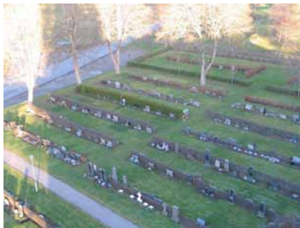
Översikt över kvarter C från kyrktornet (KI Fagerhult kyrkog 107)