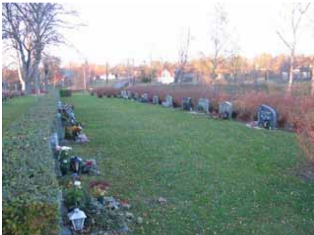
Översikt över den del av kvarter D som tagits i bruk från sydost (KI Fagerhult kyrkog 162)