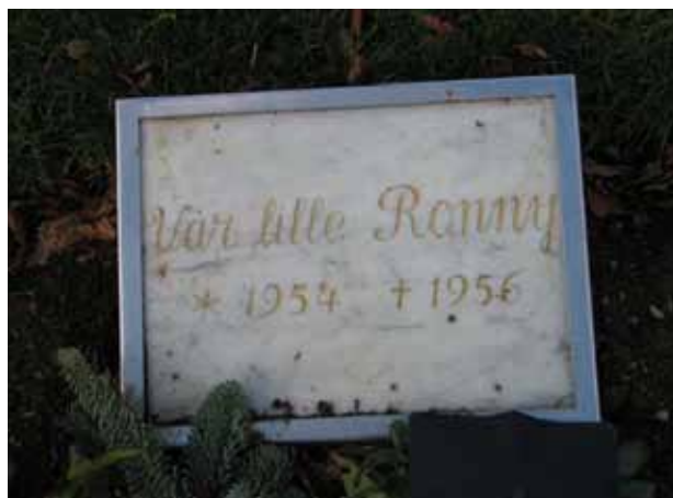
Liggande marmorvård med skyddande glasskiva i kvarter A (KI Fagerhult kyrkog 034)