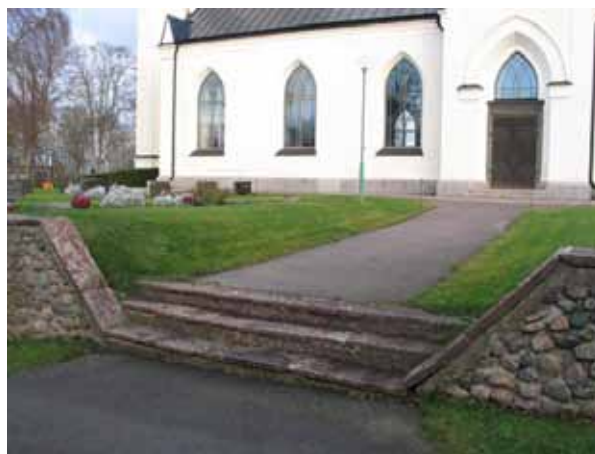
Ingången i söder består av en enkel kalkstenstrappa (KI Fagerhult kyrkog 001)