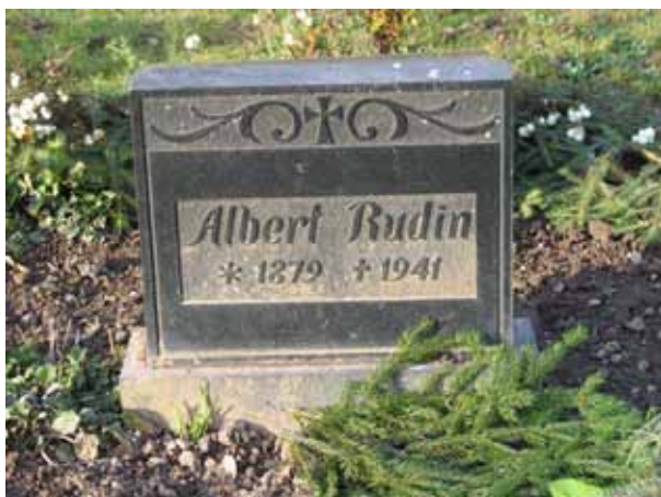
Mindre vård i kvarter A troligen linjegravsvård (KI Fagerhult kyrkog 042)