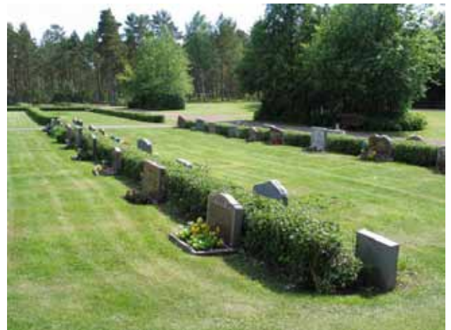
Kv VII i förgrunden och där bortom kv VIII, X och XI. (KI Fliseryd kyrkog 070)