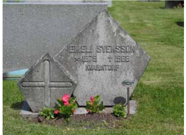
Gravvård i kv V. (KI Fliseryd kyrkog 062)