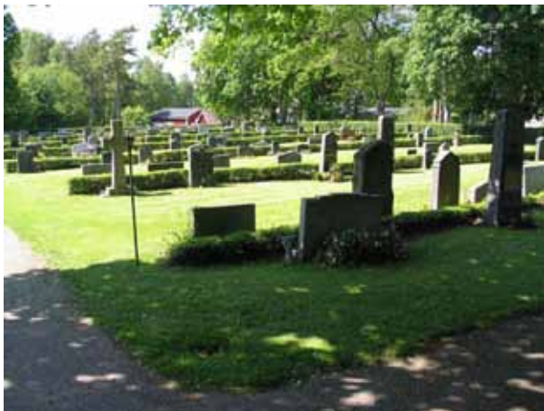
Kv I från sydost. (KI Fliseryd kyrkog 042)

Majoriteten av gravvårdarna i kvarteret är låga stående gravvårdar. Flera av gravvårdarna har en utformning som är typisk för linjegravvårdar under olika perioder av 1900-talet. Bland köpegravarna finns höga stående gravvårdar och låga stående gravvårdar med klassiserande stildrag. Kvarteren har brukats under lång tid och här finns gravvårdar från flera olika tidsperioder. Liksom i kvarter II och IV finns flera gravvårdar, framförallt bland köpegravvårdarna, som getts en avvikande form t.ex. kors, pelare och urna på pelare. Materialet är främst grå och svart granit men också röd förekommer. Ett mindre antal trävårdar finns, främst i kvarter I. I kvarter III finns ett marmorkors. I anslutning till en del av köpegravplatserna kan man ana rester av omgärdningar.