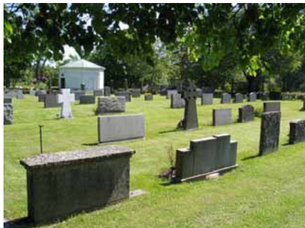
Kv IV från nordväst. (KI Fliseryds kyrkog 040)

röd granit förekommer. Ett gjutjärnskors, ett kors av marmor samt en gravvård av sandsten finns i kvarter IV. Två gravplatser, varav den ena tillhör ryttmästare Nordenankar, är belagda med grus och omgärdade av gjutjärnsstaket. Kring tre gravplatser som är insådda med gräs är stenramarna bevarad men bitvis överväxt av gräs. Vid flera av gravplatserna kan man också ana sig till deras ursprungliga utformning.