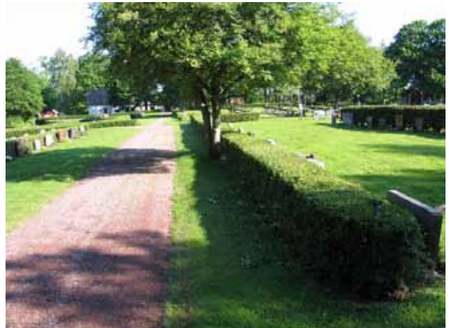
Grusgång mellan kvarter IX och V. (KI Fliseryds kyrkog 011)