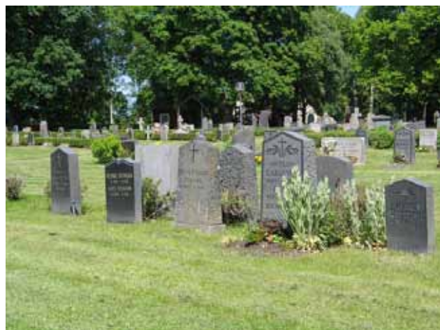
Linjegravvårdar från 1940-talet i kv III. (KI Fliseryd kyrkog 052)