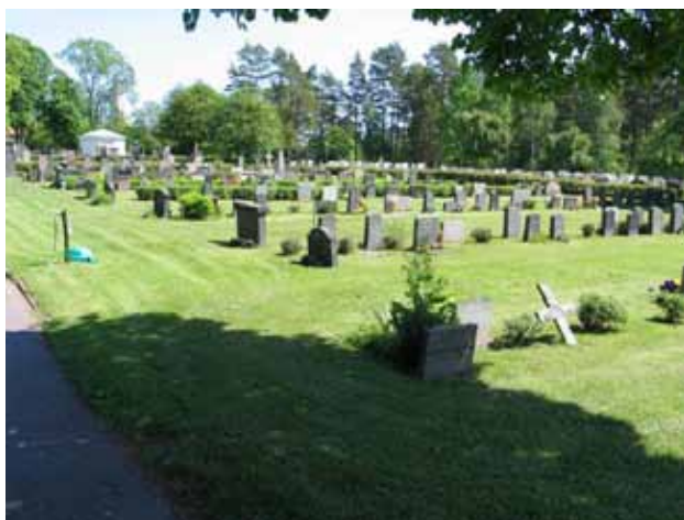
Kv III från nordväst. (KI Fliseryd kyrkog 050)

låter betraktaren ana den tidigare utformningen med grusbeläggning och omgärdningar. En kontrast till dessa gravplatser är de enklare linjegravarna. Linjegravsområdet kan idag följas från 1916 och fram till slutet av 1950-talet. Dessa gravvårdar berättar om ett gravskick som idag är borta samtidigt som de visar på sociala skillnader mellan sockenborna. Flera av gravvårdarna representerar också ett hantverksmässigt värde genom sin speciella utformning eller valet av material. De trävårdar som finns kvar ska skötas så att deras livslängd förlängs så långt möjligt.