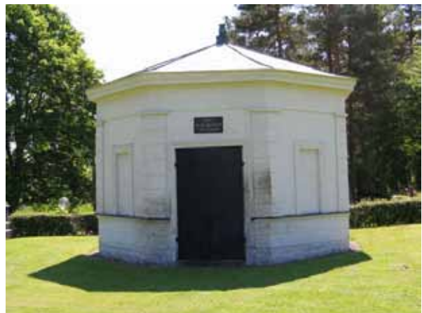
Gravkoret som kapten Oscar Ahlgren lät uppföra. (KI Fliseryd kyrkog 037)