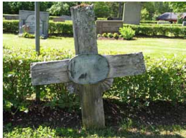
Träkors på linjegravsområdet i kv I. (KI Fliseryd kyrkog 045)