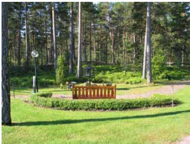
Minneslundan från nordost. (KI Fliseryds kyrkog 012)

Minneslundan anlades i kyrkogårdens sydvästra hörn i samband med utvidgningen av kyrkogården 1984. Området är en skogsdunge med höga tallar och blåbärsris. Nordöstra delen är insådd med gräs. Gräsmattan genomkorsas av en gång belagd med smågatsten. En bänk, ett skåp för gravljus i svart plåt och en mindre natursten finns på platsen. I gräsmattan är ett rutmönster av smågatsten lagt. Här kan man placera blomvaser. I nordost avgränsas platsen av en låg måbärshäck.