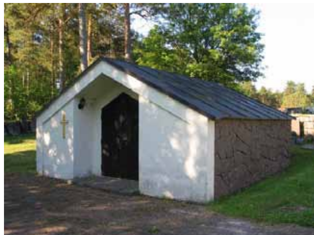
Gravkapellet. (KI Fliseryds kyrkog 004)