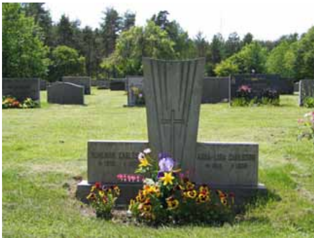
Gravvård i kv VI. (KI Fliseryd kyrkog 058)

Kvarteren har en struktur och en uppsättning av gravvårdar som är typiska för kvarterens anläggningstid. I det fortsatta bruket av området är det viktigt att bevara områdets karaktär med ryggställda gravvårdar och låga stående gravvårdar.