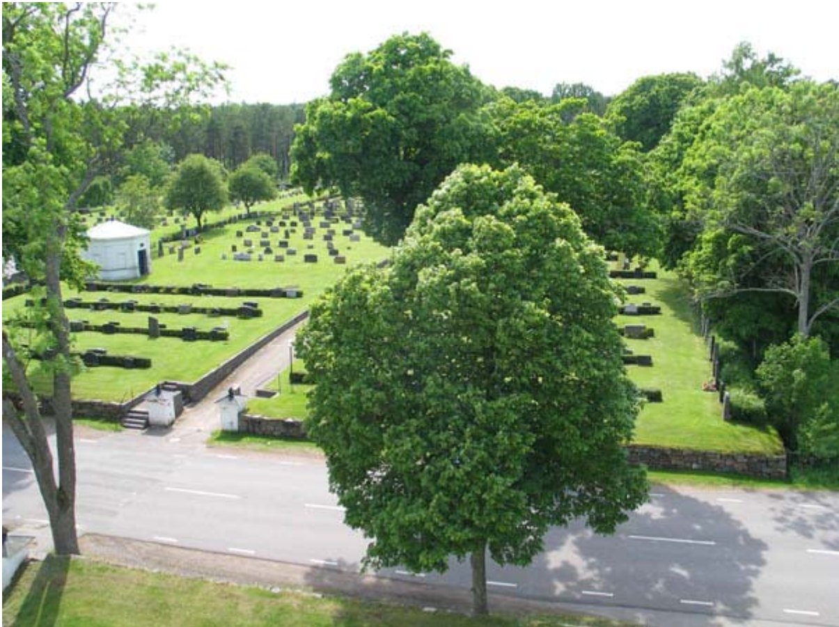
KI Fliseryds kyrkogård 066

Kulturhistorisk inventering av kyrkogårdar/ begravningsplatser i Växjö stift 2005