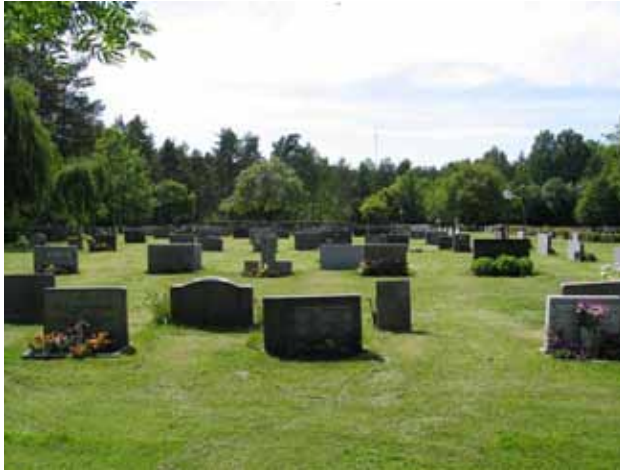
Kvarter VI och V. (KI Fliseryd kyrkog 057)