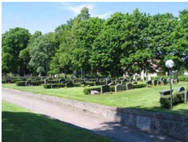
Kv II från sydost. (KI Fliseryd kyrkog 039)

Intrycket av gravvårdarna i kvarteren domineras av de höga stående gravvårdarna som främst finns i kvarterens norra respektive södra ytterkant liksom i de västra delarna av kvarteren. Flera av gravvårdarna har fått en avvikande utformning t.ex. i form av kors, stubbar, eller pelare. Eftersom de båda kvarteren har brukats under hela 1900-talet finns det en stor variation av gravvårdar. De flesta gravvårdar är stående låga gravvårdar. Endast enstaka liggande gravvårdar förekommer. Stående gravvårdar från 1930-50-talen har försett med klassiserande stildrag som tempellika gavlar och kolonner. Flera av gravvårdarna är försedda med polerad dekor. Materialet är företrädesvis grå granit men också svart och