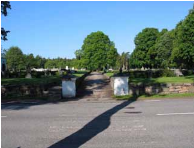
Ingång till kyrkogården i öster. (KI Fliseryds kyrkog 001)

Fliseryds kyrkogård är belägen väster om Fliseryds kyrka. Mellan kyrkan och kyrkogården går landsvägen från Mönsterås. Kyrkogården är i det närmaste rektangulär till formen och indelad i 11 kvarter. Den kyrkogård vi ser idag har flera klassicistiska drag t.ex. en markerade huvudgång samt väl avgränsade kvarter. De två senaste utvidgningarna som gjorts av kyrkogården är väl synliga. Den utvidgning som gjordes 1957 har i synnerhet kommit att sätt sin prägel på kyrkogården eftersom den förefaller ha varit utgångspunkt för den omläggning som successivt gjordes av den äldre kyrkogården från mitten av 1960-talet. Majoriteten av gravvårdarna är ryggställda och flera av raderna har rygghäckar emellan. I kvarter II och IV har flera av de mest påkostade köpegravarna placerats i kvarterens ytterkanter. Båda kvarteren har under lång tid varit köpegravsområden. Köpegravar finns även i kvarteren I och III men dessa båda kvarter domineras av ett sammanhängande linjegravsområde kvar. I kvarteren I, II, III och IV finns enstaka lediga gravplatser medan kvarteren V och VI är fullbelagda. Av de områden som tillkom vid utvidgningen 1984 har kvarteren VI, VII och VIII tagits i bruk medan IX och X ännu inte börjat användas.