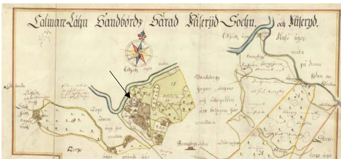
Utsnitt av karta över Fliseryds gård från 1705. Pilen markerar den gamla kyrkans läge.

Eftersom kyrkplatsen hade legat i socknens västra utkant valde man en ny plats för den nya kyrkan. Det blev nära den plats där vägarna mot Mönsterås, Oskarshamn, Finsjö och Ruda möts. Den nya kyrkan stod klar 1818.