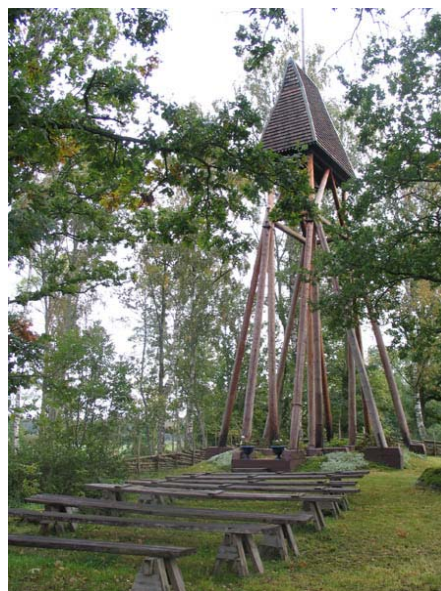
Klockstapeln från 1952. (KI Fliseryds ödekyrkog 014)