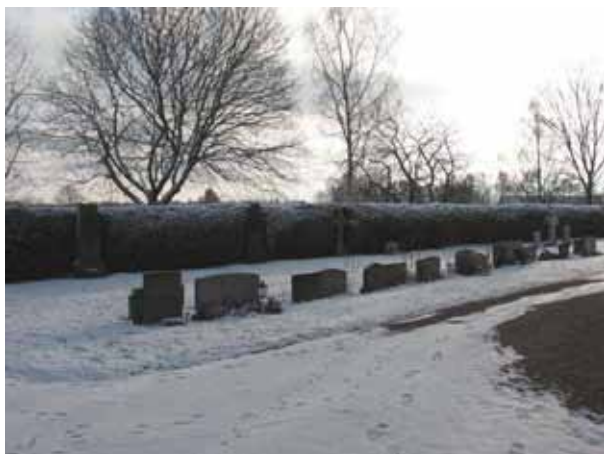
Kvarter 7 öster om kyrkan från nordväst (KI Förlösa kyrkog 093)