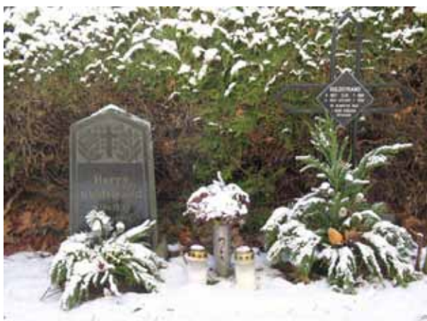
Traditionell vård från 1930-talet till vänster. Modern järnvård till höger (KI Förlösa kyrkog 124)

Kyrkans södra sida har sannolikt sedan medeltiden använts som begravningsyta. Ett fåtal gravvårdar från slutet av 1800-talet och tidigt 1900-tal är de äldsta bevarade i kvarteren. Kvarteren har dock brukats kontinuerligt under hela 1900-talet vilket avspeglas i sammansättningen av gravvårdar. I det fortsatta bruket av kvarteret är det värdefullt att bevara vårdar från olika tidsperioder som speglar kvarterets historia. Det gäller i synnerhet de äldre gravvårdarna. Kulturhistoriskt intressanta är de gravvårdar som anger den dödes yrkestitel. Dessa berättar om innevånarna i socknen och vilka näringar, yrken m.m. som funnits. De enstaka bevarade linjegravvårdarna berättar om en tidigare vanlig gravform och har ett socialhistoriskt värde i kontrast till de mera påkostade gravvårdarna. Ett urval av linjegravvårdar bör långsiktigt bevaras.