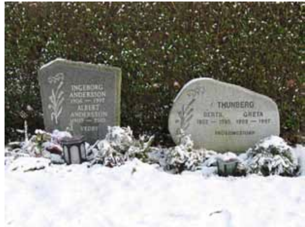
Vårdar i kvarter 11, urnkvarteret (KI Förlösa kyrkog 147)