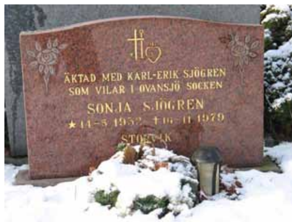
Maken vilar på en annan kyrkogård (KI Förlösa kyrkog 132)