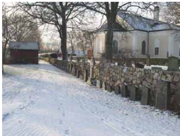
På utsidan av den östra kyrkogårdsmuren står äldre gravvårdar uppställda (KI Förlösa kyrkog 073)