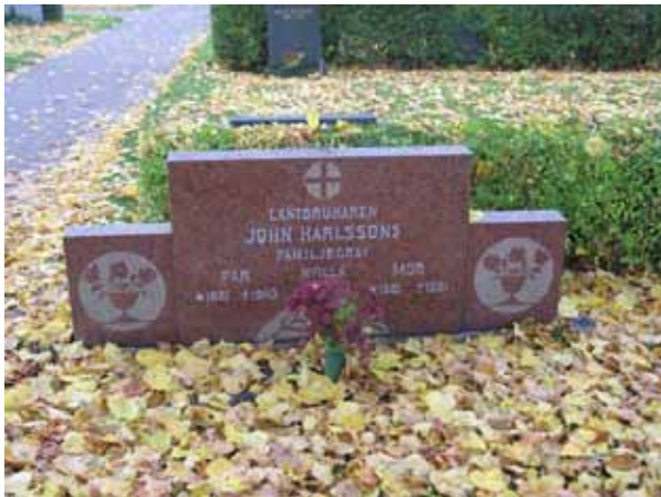
Tidstypisk vård från 1940-tal vanligt förekommande i kvarter 1-7 (KI Förlösa kyrkog 028)

I kvarter 1-7 finns blandade gravvårdstyper från 1860-talet och framåt. Här finns höga stående gravvårdar från andra hälften av 1800-talet och 1900-talets första decennier och låga stående gravvårdar av den typ som ofta förekommer från 1930-talet. Här skiftar utformning och dekor mellan olika decennier. En del vårdar har klassicistiska stildrag. Majoriteten av gravvårdarna är stående men liggande gravvårdar förekommer. Materialet är främst grå och svart granit, men även röd förekommer. Ett fåtal vårdar är naturstenar. En är av kalksten. En rad med vårdar från 1800-talet står längs muren i kvarter 6. Två är av gjutjärn varav den ena har formen som ett kors och den andra som en oval med en krans runtom. Den sistnämnda är kyrkogårdens äldsta gravvård rest år 1861 över Eva Elisabet Fornander. I övrigt finns det ytterligare sex vårdar från 1800-talet. Vanligast är annars vårdar från 1940- fram till 1990-talet