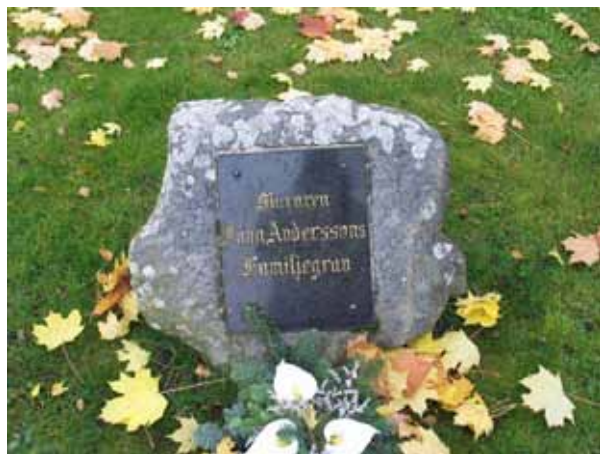
Natursten med platta av svart granit, kvarter 6 (KI Förlösa kyrkog 022)