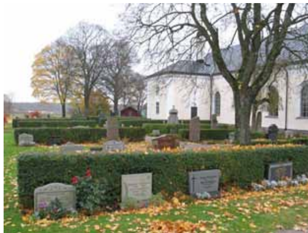
Översikt över kvarteren 2- 6 norr om kyrkan (KI Förlösa kyrkog 007)