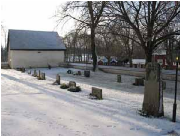
Kvarter 8 med bårhuset i bakgrunden (KI Förlösa kyrkog 093)