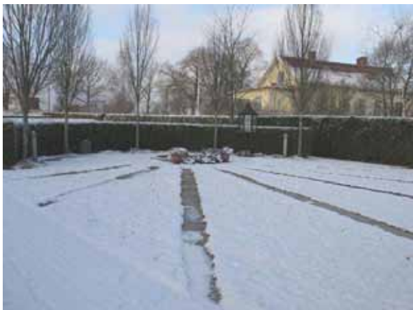
Minneslundan i kyrkogårdens nordvästra del, foto från sydväst (KI Förlösa kyrkog 136)