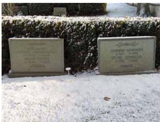
Tidstypiska vårdar från 1960- och -70 talet i kvarter 9 (KI Förlösa kyrkog 114)