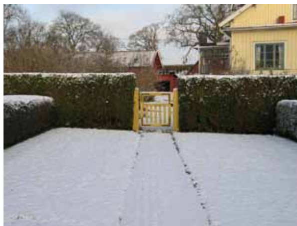
Ingången i norr utgörs av en gulmålad trägrind. Prästgården i bakgrunden (KI Förlösa kyrkog 139)