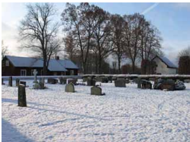
Översikt över kvarter 10 från nordost (KI Förlösa kyrkog 126)