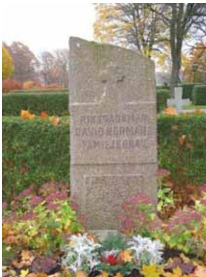
Nationalromantiskt inspirerad vård från 1900-talets första decennier, kvarter 2 (KI Förlösa kyrkog 010)

I kvarter 5 har man behållit en del av de tidigare så vanliga grusgravarna och gravplatserna omgärdas också av små låga buxbomshäckar. En av de mest påkostade gravplatserna har också pollare av grå granit och en svartmålad gjutjärnskedja. Gravvården är rest över grosshandlare E Th Ludvigsson från Förlösa. I övrigt finns endast ett fåtal stenramar bevarade i kvarteren.