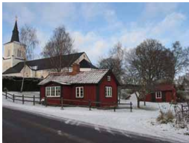
Personalutrymmen och förråd finns i ett par mindre träbyggnader utanför östra kyrkogårdsmuren (KI Förlösa kyrkog 084)