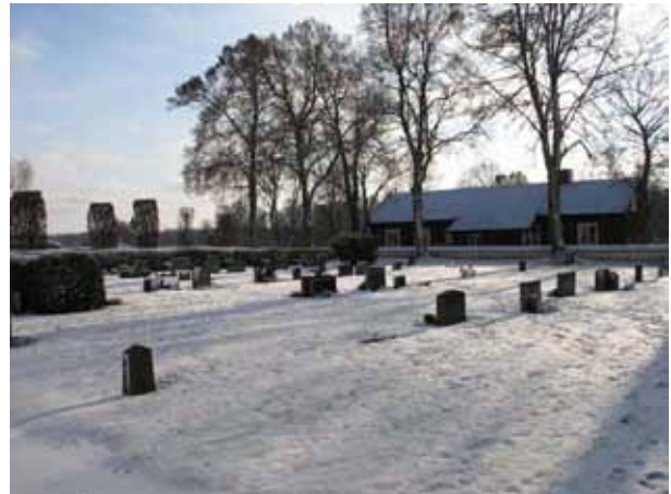
Översikt över kvarter 9 från nordväst (KI Förlösa kyrkog 140)