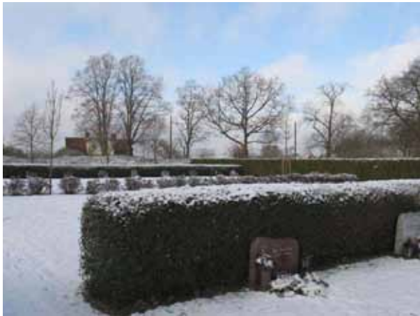
Översikt över kvarter 11 och 12 från sydost (KI Förlösa kyrkog 140)