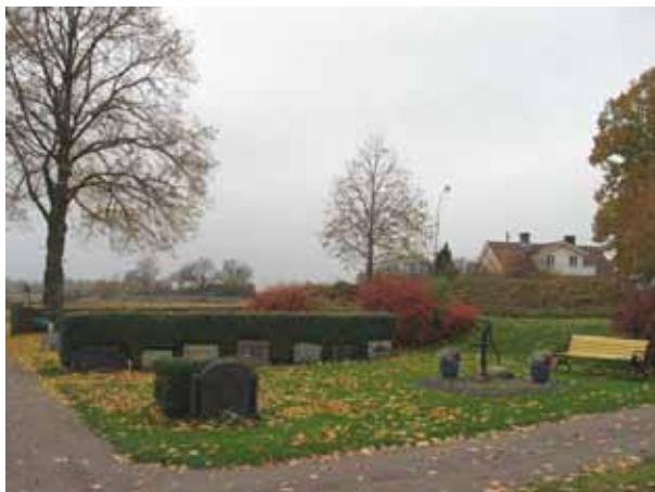
Översikt över kvarter 1 från sydost (KI Förlösa kyrkog 003)

Kvarteren 1-7 ligger norr, nordväst och öster om kyrkobyggnaden och rymmer omkring 380 gravplatser. Kvarteren avgränsas av kyrkan i söder av kyrkogårdsmuren i väster och öster och av gamla kyrkogårdsmuren i norr, mot kvarter 11-13. Kvarteren består av ryggställda gravvårdar med rygghäckar av liguster. I kvarter 5 finns en del av ett grusgravsområde bevarat. Kvarter 1 används delvis som ett urngravsområde. Gravvårdarna står vända mot öster eller väster och någon enstaka mot söder. Mellan de olika kvarteren finns grusbelagda gångar.