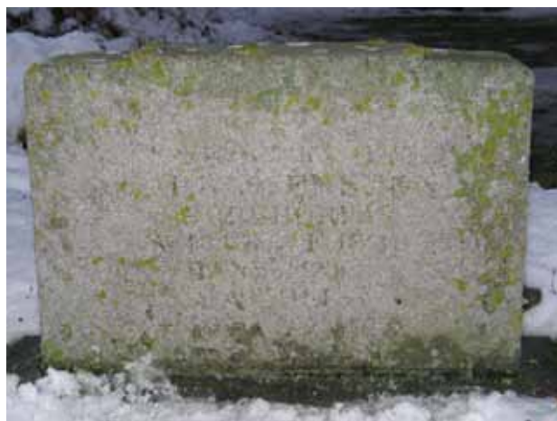
Äldsta vårderna på södra sidan om kyrkan rest över en lantbrukare från Borshorva 1886, kvarter 9 (KI Förlösa kyrkog 149)