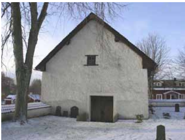
Bårhuset i kyrkogårdens sydvästra hörn (KI Förlösa kyrkog 107)

Förråd och personalutrymme finns inrymt i ett par mindre rödmålade träbyggnader öster om kyrkogården Byggnaden som personalen använder är troligen uppförd på tidigt 1800-tal.