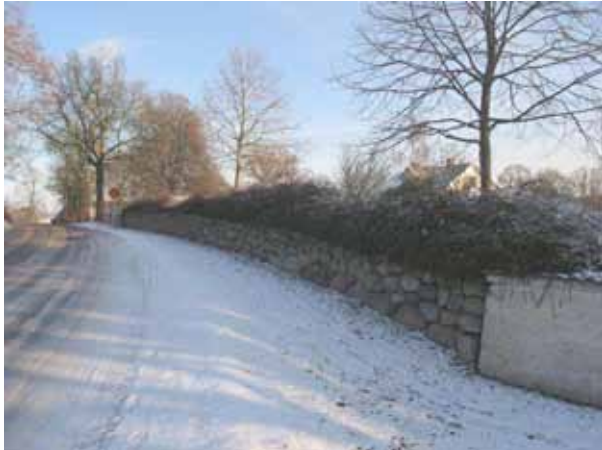
Olika typer av murar omgärdar gamla och nya delen (KI Förlösa kyrkog 064)

Ett urngravsområde är ordnat i nordvästra hörnet av gamla, kvarter 1, och även på den nya delen av kyrkogården. Söder om vapenhuset står ett solur i kalksten.