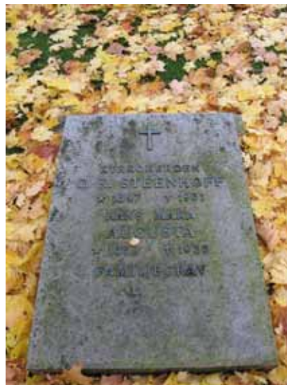
Liggande vård över kyrkoherden Steenhoff och hans maka i kvarter 6 (KI Förlösa kyrkog 018)