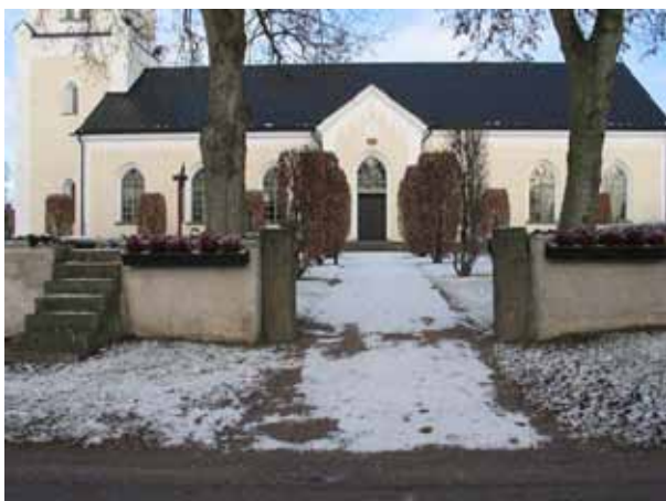
Ingången från söder. Observera trappan över muren (KI Förlösa kyrkog 086)