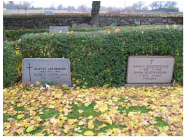
Tidstypiska vårdar från 1960- och 70-talet. Stort antal vårdar i kvarter 1-7 är från den här tiden (KI Förlösa kyrkog 031)

I kvarter 5 har man behållit en del av de tidigare så vanliga grusgravarna och gravplatserna omgärdas också av små låga buxbomshäckar. En av de mest påkostade gravplatserna har också pollare av grå granit och en svartmålad gjutjärnskedja. Gravvården är rest över grosshandlare E Th Ludvigsson från Förlösa. I övrigt finns endast ett fåtal stenramar bevarade i kvarteren.