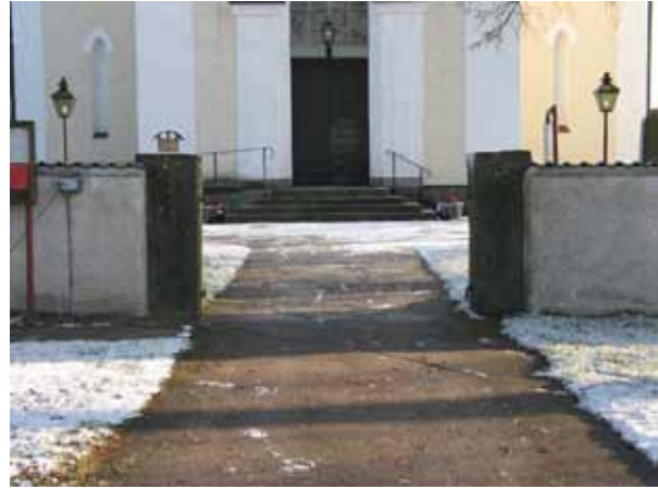
Ingång mot vapenhuset från väster (KI Förlösa kyrkog 061)