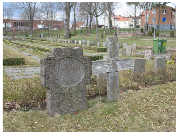
Kvarter 2 med två äldre gravvårdar som blivit kvar då kvarteret nyplanerades vid 1900-talets mitt. Den rustika korsformiga vården är daterad 1924. Träkorset är kyrkogårdens enda bevarade. (KI Oskarshamn ga kyrkog 034)