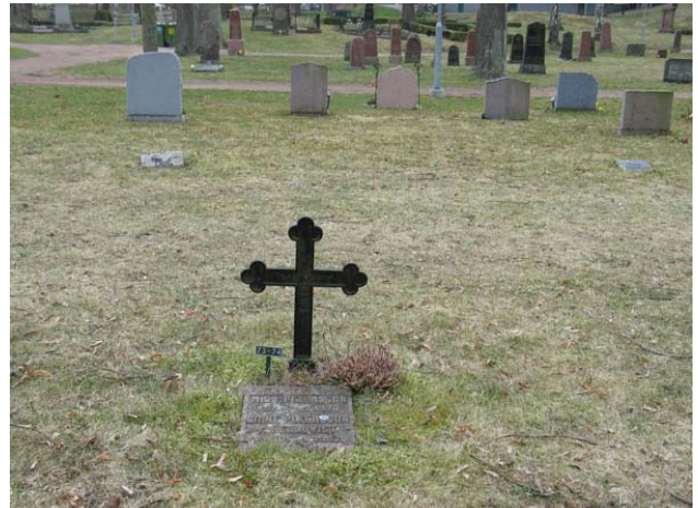
Kvarter 4 mot väster med en äldre vård som står kvar sedan tiden före kvarteret gjordes om för urngravar. Sannolikt är gjutjärnskorset från 1903 en rest av ett linjegravssystem. (KI Oskarshamn ga kyrkog 091)