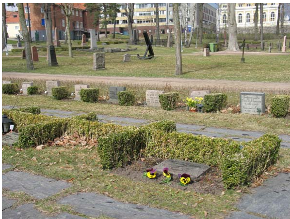
Kvarter 1 med sin strikta struktur av liggande och stående vårdar och buxbomhäckar. (KI Oskarshamn ga kyrkog 033)

Kvarter 1-3 rymmer omkring 430 urngravsplatser och är ett område med låg profil och enkel och tydlig struktur. Kvarteren omgärdas vart och ett av en låg häck av liguster. I kvarter 1 finns låga häckar av buxbom som sidohäckar mellan varje gravplats, i kvarter 2 och 3 bildar häcka av buxbom rygghäck åt de mittersta raderna, vilka också avslutas med flankeringshäck av buxbom. Vårdarna är placerade i gräs. I kvarteret finns gångplattor av skiffer.