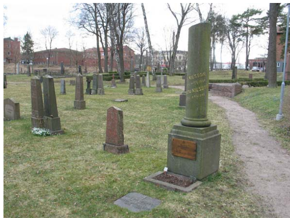
Kvarter 6 mot sydväst. Här syns flera av kvarterets höga och äldre gravvårdar. Den ståtliga avbrutna kolonnen, en symbol för ett avbrutet liv, är daterad 1904. (KI Oskarshamn ga kyrkog 080)