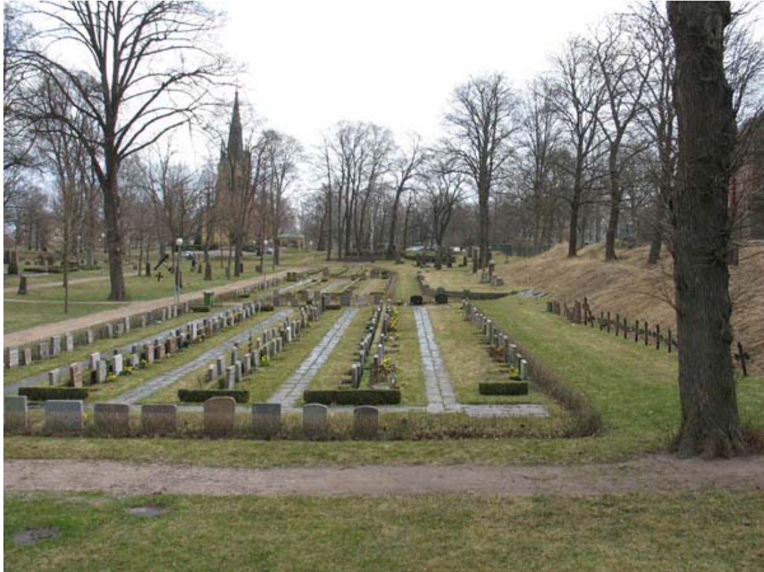
Kvarter 3 mot öster med sin låga profil och strikt ordnade rader. I fonden syns kyrkans torn. (KI Oskarshamn ga kyrkog 024)