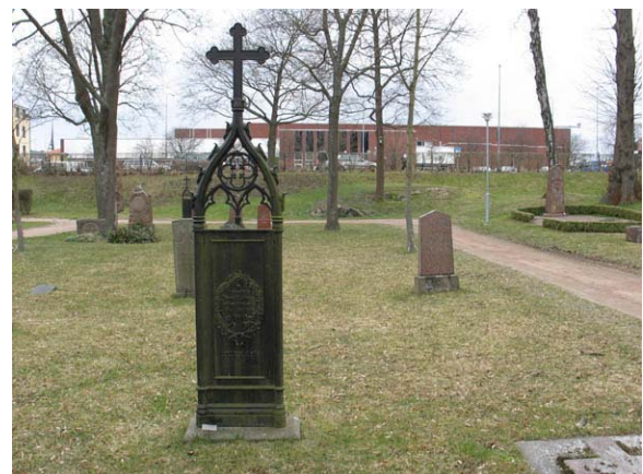
Kvarter 5 mot väster. Här med en av de nygotiska gjutjärnsvårdarna i bildens mitt. (KI Oskarshamn ga kyrkog 102)