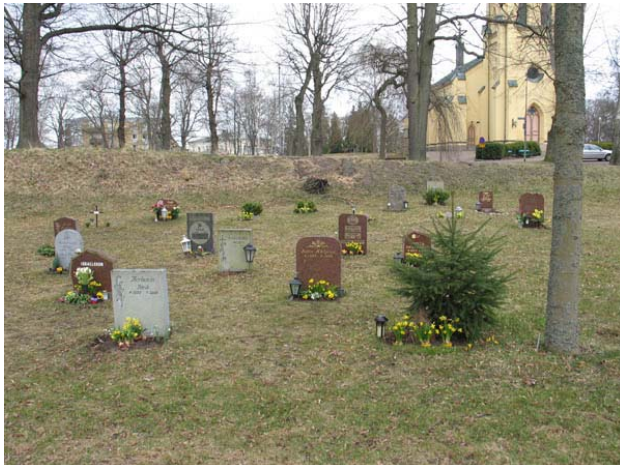
Kvarter 4 mot öster med blandade vårdar av modernt snitt. (KI Oskarshamn ga kyrkog 092)

Vårdarna är av olika stenmaterial och olika typer. Röd och ljus grå granit dominerar dock. Några är enkelt rektangulära till sin form, medan många har en asymmetrisk och friare form. Några naturstenar finns också. Gravvårdarna är daterade från 1986 och framåt. Vanliga motiv på stenarna är blommor och fåglar. Den dödes yrkestitel anges på några få vårdar, såsom riksdagsman, mästerlots och advokat. Vid några gravplatser finns små plantor av buxbom planterade. I områdets södra del finns tre gravvårdar från 1900-talets första år bevarade. Det handlar om två små stenar och ett litet gjutjärns kors, det senare över Elsa Hellqvist d. 1903. Detta bör vara rester från allmänna gravar som fanns i området tidigare.