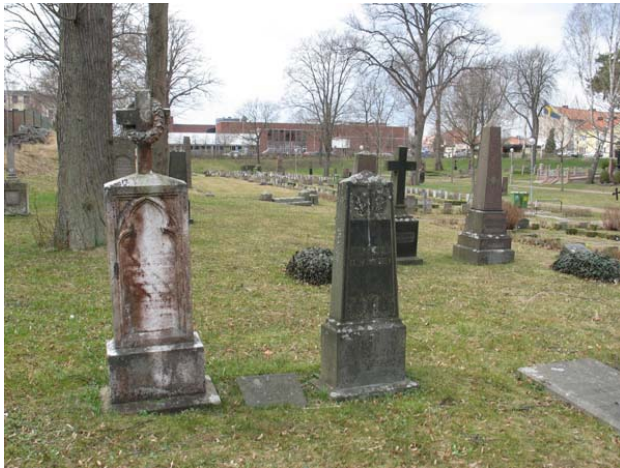
Kvarter 8 mot väster. Här syns bland andra en marmorvård daterad 1876. (KI Oskarshamn ga kyrkog 107)

Den dödes yrkestitel anges på ett stort antal gravvårdar i båda kvarteren. Exempelvis förekommer rådman, löjtnant, disponent, fotograf, apotekare, överstelöjtnant, garverifabrikören, redaktör, sjökaptän, advokat, kakelfabrikör, grundläggare och häradshövding.