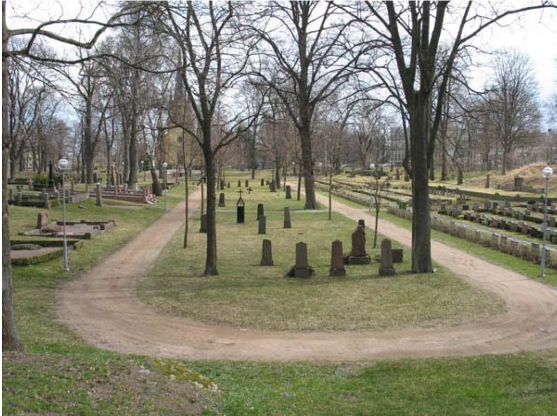
Kyrkogårdens mittersta och lägsta belägna del med kvarter 5 avgränsat av trädkantade gångar. Bild mot öster. (KI Oskarshamn ga kyrkog 022)

Kvarter 5 och 6 ligger i kyrkogårdens inre delar. Båda omgärdas av gångar. I kvarter 5 finns många stora träd. Strukturen är enkel och densamma i båda kvarter, med äldre gravvårdar placerade med ojämna avstånd i gräsmatta. I kvarter 5 är sannolikt samtliga gravplatser återlämnade till församlingen och här finns få gravstenar med tanke på ytan. I kvarter 6 är det tätare mellan vårdarna, i något parti så tätt att man kan tänka sig att stenarna en gång blivit hopflyttade. I kvarter 6 finns ännu sådana gravplatser som vårdas av anhöriga till den döde, men de flesta platserna saknar plantering och troligen är återlämnade. I båda kvarteren är merparten av vårdarna stående och jämförelsevis höga. I kvarter 5 är ett stort ankare placerat, sannolikt som åminnelse om stadens maritima historia.