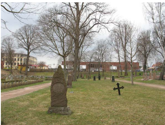
Kvarter 5 mot öster med några av de glest placerade vårdarna. (KI Oskarshamn ga kyrkog 101)