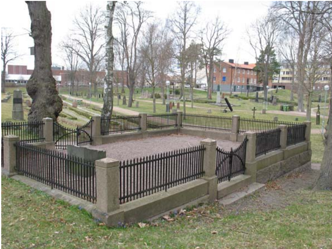
Kvarter 8 mot nordväst. Här en av de mer påkostade gravplatserna över en borgmästare från 1920-talet. (KI Oskarshamn ga kyrkog 110)

Många av gravplatserna har en mycket stor yta till förfogande. Som exempel kan nämnas konsul Wijkströms gravplats i kvarter 7 vilken upptar 21 gravplatser. Platsen är grusad och omgärdas av en stenram. Huvudstenen är av oblistkyp av röd granit. På platsen finns också några liggande stenar, fem murgrönskullar samt tre formklippta tujor. I kvarter 8 finns ett terrasserat parti, avgränsat av en stödmur av granit och med trappor av granit, vilket rymmer tre familjers gravplatser. På gravplatsen finns hela 45 gravplatser markerade. Tre familjers gravstenar markerar platsen som numera är insådd med gräs. Gravvårdarna är av grå och svart granit, en mycket bred och klassicerande till sitt uttryck, en i form av en obelisk och en kraftig, hög och rustik i sin yta.