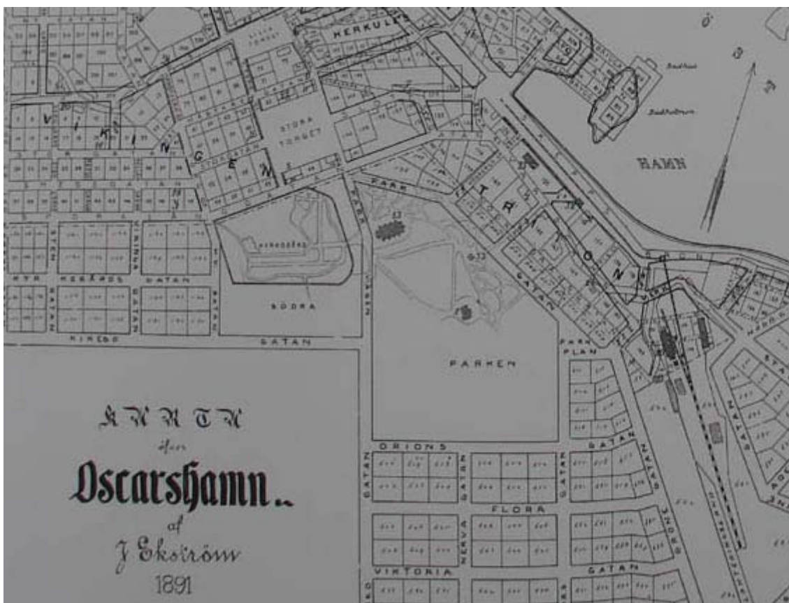
Del av stadskarta från 1891. Kyrkogården är redan vid denna tid genomplanerad med gångsystem och begravningsytor.