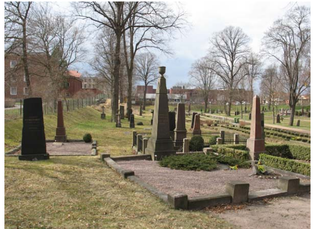
Kvarter 8 med några av de påkostade och äldre gravplatserna. (KI Oskarshamn ga kyrkog 108)