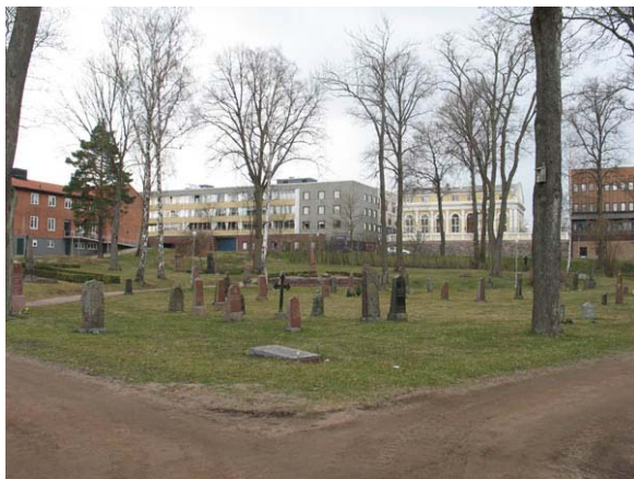
Kvarter 6 mot nordväst. KI Oskarshamn ga kyrkog 097)