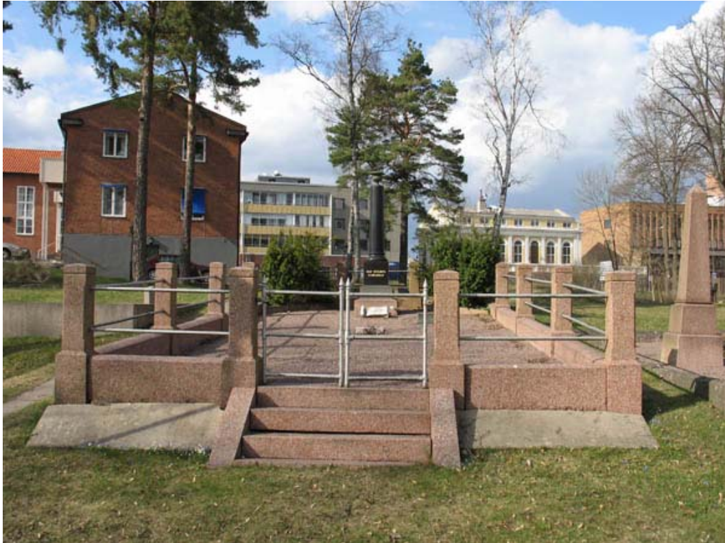
Kvarter 7 mot norr med en av de mer påkostade familjegravplatserna. Tegelhuset i bakgrunden är församlingshemmet. (KI Oskarshamn ga kyrkog 068)

Kvarter 7 och 8 ligger i kyrkogårdens yttre områden, kvarter 7 i nordväst och norr och kvarter 8 i söder. Båda kvarteren ligger på ytor som är något förhöjda jämfört med övriga kyrkogården. I kvarteren finns främst familjegravar varav många är av monumental art. Här finns många kraftiga och påkostade stenarbeten, både i form av gravstenar och som omgärdningar till gravplatser. I kvarter 8 finns ett mindre område med gravstenar i gräsmatta i rader som löper i nord-sydlig riktning. I övrigt är de flesta gravplatserna placerade på kyrkogårdens yttre kant med gravvårdar vända ned mot kyrkogården. De flesta av gravplatserna är anlagda under 1800-talets slut och 1900-talets första decennier.