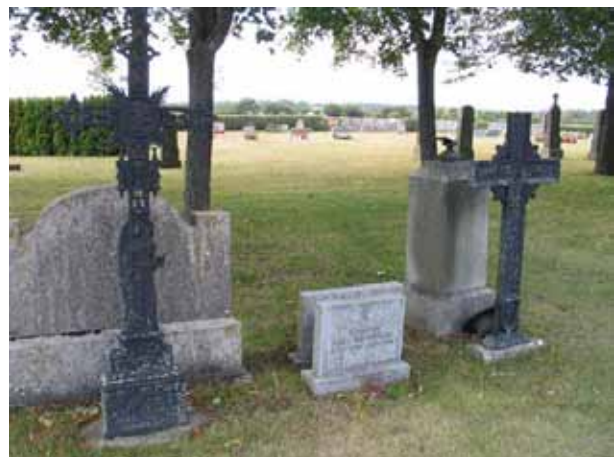
Två gjutjärnskors i kvarter B. Det vänstra korset bärs upp av dödens ängel, ibland tolkad som ärkeängeln Mikael. Vårdarna är från 1865 respektive 1874.