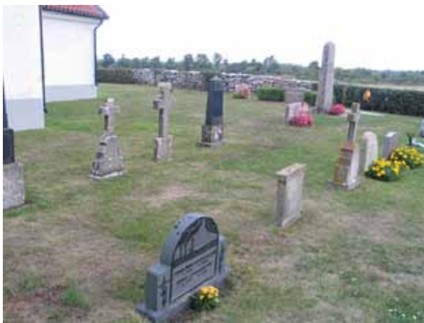
Kvarter C från sydost. På bilden syns tre av de äldre kalkstens Kors som finns på kyrkogården. (KI Gårdby kyrkog 036)