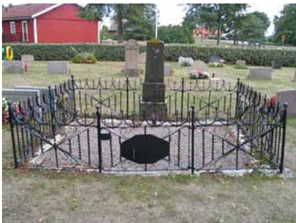
Gravplats omgärdad av smidesstaket och belagd med grus i kvarter B. Detta är det enda exemplet på denna typ av gravplatsutsmückning som finns kvar på Gårdby kyrkogård. På den platta som sitter på grunden har tidigare funnits data om den döde men dessa är idag borta. (KI Gårdby kyrkog 022)