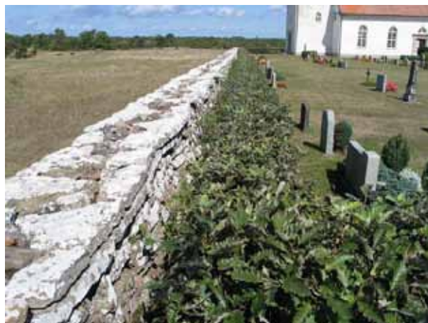
Kyrkogårdsmuren i väster och innanför muren häckar av oxel. (KI Gårdby kyrkog 003)