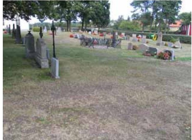
Kvarter B från sydväst. (KI Gårdby kyrkog 019)