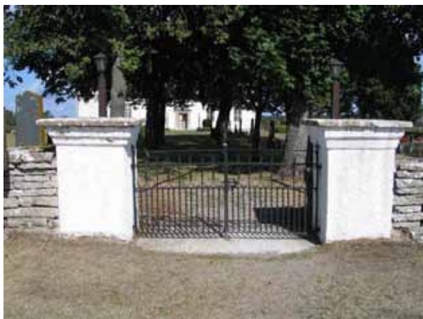
Kyrkogårdens ingång i söder. (KI Gårdby kyrkog 001)

I söder finns ingång med dubbla smidesgrindar mellan putsade stolpar som avfärgats i vitt. Grindarna är av en typ som är mycket vanlig på Öland. De är troligen tillverkade av en smed på Öland vid tiden för den stora ombyggnaden av kyrkan. Ytterligare en ingång finns i öster. Även här finns putsade, vita stolpar. Grinden, vilken är lik den i söder, har flyttats längre österut i liv med den mur som omger församlingshemmet. Från grinden fram till kyrkogårdens portstolpar finns en gång med häckar av oxel på båda sidor.