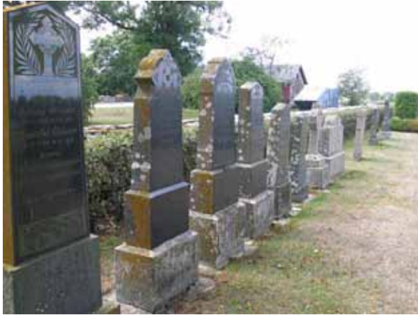
Gravvårdar som tagits bort från kyrkogården står uppställda utmed kyrkogårdsmuren i söder. (KI Gårdby kyrkog 016)