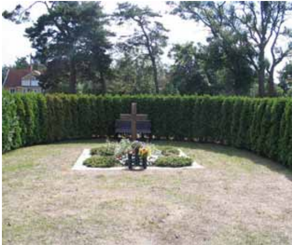
Minneslund (KI Gårdby kyrkog 042)

Gravvårdarna har under 1900-talets andra hälft fortsatt att vara låga och rektangulära. Det sistnämnda draget blir alltmer utpräglat under 1960-70-talen. Vanliga dekorelement är kors och blommor. Under 1970-talet blir talldungen populär som dekor. Idag kan man se en trend mot alltmer individuellt utformade vårdar. Förr var det vanligt att man på gravvården angav den dödes yrkestitel. Titlarna försvann under 1900-talets andra hälft men idag kan vi se dem komma tillbaka i form av dekor som visar på ett yrke eller ett personligt intresse. På gravvårdarna på Gårdby kyrkogård är det också relativt vanligt att man anger från vilken by eller gård den döde kommer.