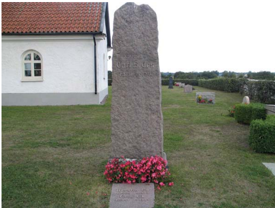
Kustvakten Carl Eks familjegravvård av kalksten i nationalromantisk stil. (KI Gårdby kyrkog 034)

Gårdby kyrkogård har en för Ölands landbygdskyrkogårdar typisk utformning. Kyrkogården är inte anlagd efter en bestämd plan utan gravkvarterens struktur har vuxit fram under årens lopp. När nya företeelser har blivit populära har de anammats och ersatt äldre traditioner. Gravvårdarna utgör idag en blandning av olika typer av gravvårdar som varit vanliga från mitten av 1800-talet fram till idag. Två gravplatser har kvar omgärdning i form av smidesstaket respektive buxbomshäck. Denna typ av gravplatsutsmyckningar var tidigare vanliga på våra kyrkogårdar och de som finns kvar på Gårdby kyrkogård bör därför bevaras som en viktig del av kyrkogårdens utvecklingshistoria. En för Öland typisk företeelse är de många gravvårdarna av kalksten som berättar om stenbrytningens betydelse för ön. Gravvårdar från mitten av 1800-talet samt vårdar av gjutjärn och gravstaketet av smide ska föras in på församlingens inventarieförteckning. Detta gäller även vårdar som står uppställda.