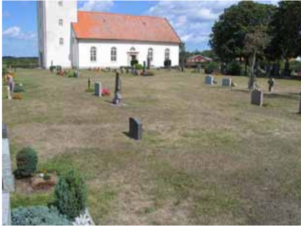
Kvarter A från sydväst. (KI Gårdby kyrkog 010)