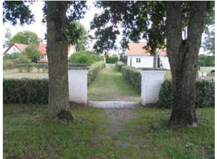
Kyrkogårdens ingång i öster med gången till vaktmästeriet. (KI Gårdby kyrkog 006)