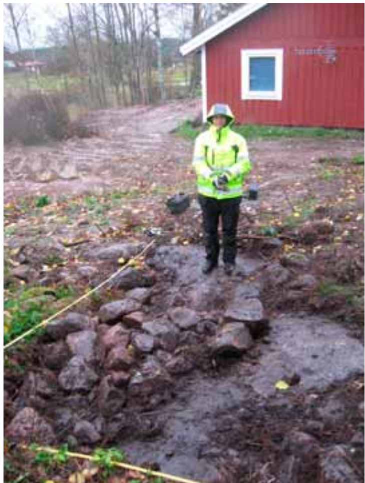
Undersökningsobjektet efter rensning. Från O.

kunde också konstateras att lämningen var mer oregelbunden än som syntes före framrensningen. Stenarnas storlek varierade från halvt knytnävsstora upp till 0,5 meter. Stenarna var upplagda utan något synligt mönster och som mest i lager av tre skikt. I botten av anläggningens mitt påträffades också ett träfragment med målarfärg på. Det kunde då med största säkerhet fastställas att lämningen var ett upplag med odlingssten.