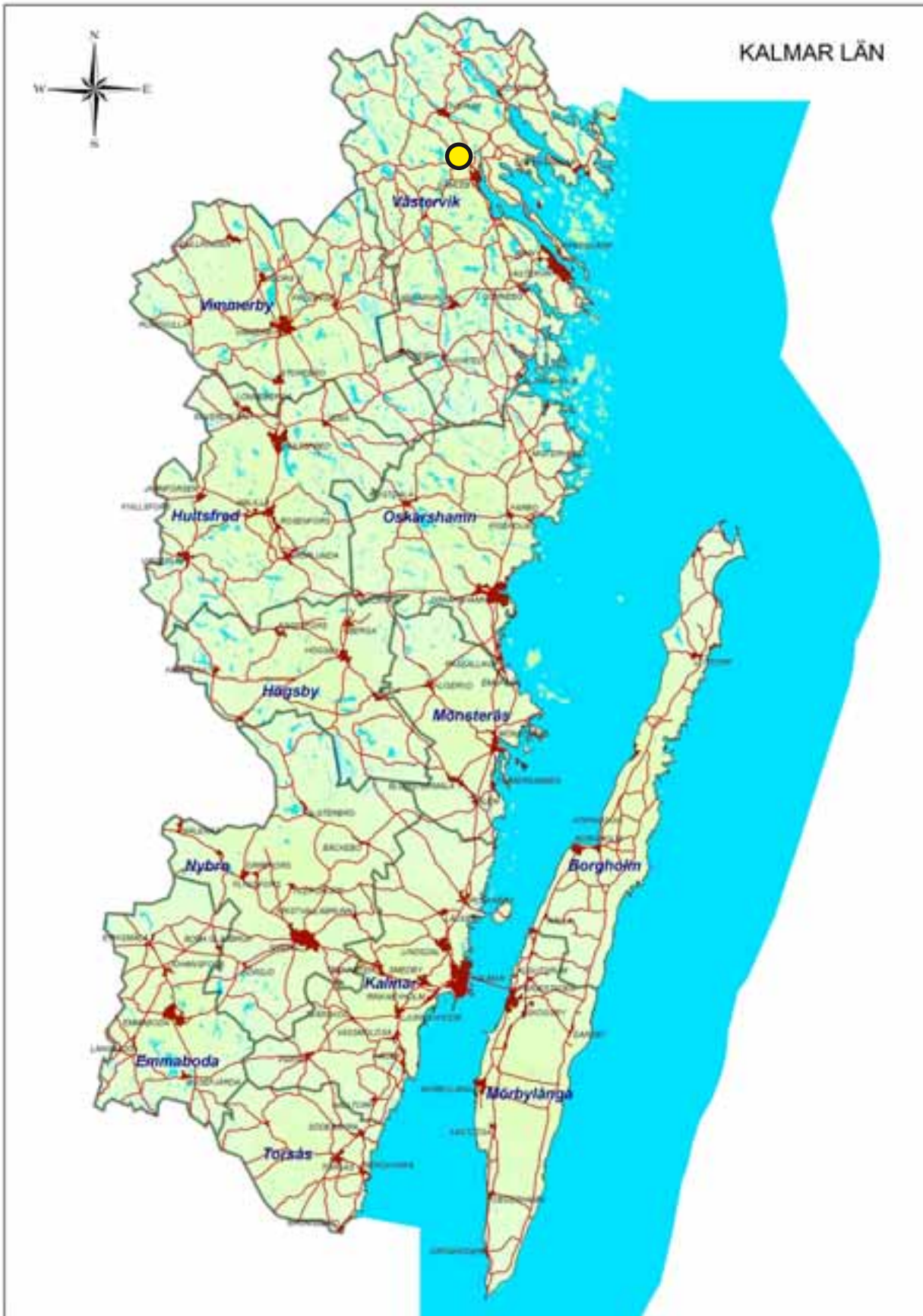
Karta över Kalmar län med undersökningsområdet markerad.