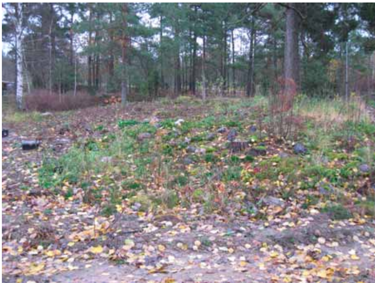
Undersökningsobjektet före rensning. Från S.

Det aktuella förundersökningsobjektet är som ovan nämnts en osäker stensättning. Den ligger på kanten av en låg bergsrygg mellan ett högre skogklätt bergsparti och ett lägre liggande åkerområde. Lämningen beskrivs som rund, 7 meter i diameter och 0,3 meter hög. Fyllningen består av stenar av storlek 0,3-0,4 meter stora. I mitten finns en grop som mätte 0,5 meter i diameter och 0,2 meter djup. Vid besiktningstillfället 1944 var lämningen delvis överväxt med lövsly och täckt med grenris varför den var svårbedömd till storlek och utförande. Därför bedömdes den som något osäker.