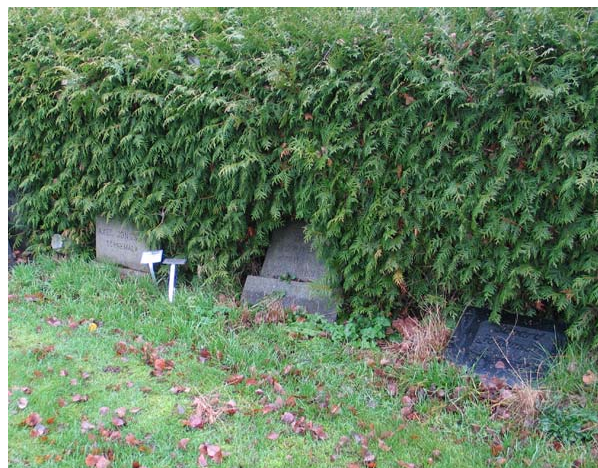
Kvarter G med några av ensamgravarna som blivit överväxta av tujahäcken. Vårdarna är små, vilket är vanligt bland ensamgravar. (KI Gullabo kyrkog 101)