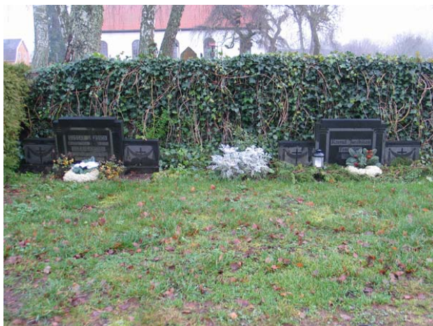
Kvarter G med två familjegravar i klassicerande stil mot muren mot vilken växer murgröna. (KI Gullabo kyrkog 105)