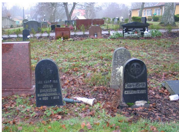
Del av kvarter E med några tidstypiska linjegravvårdar från 1930-talet. (KI Gullabo kyrkog 127)