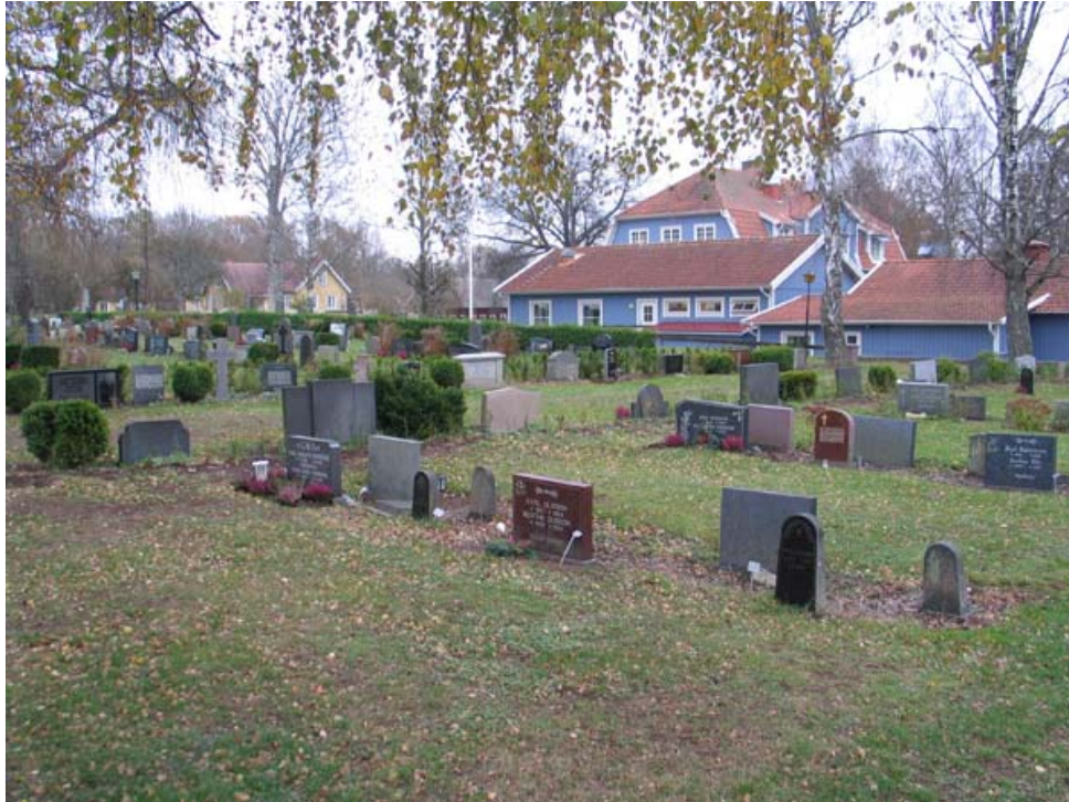
Kvarter E mot sydost. Rester av linjegravsystem närmast i bild. Skolbyggnaden syns i bakgrunden. (KI Gullabo kyrkog 018)