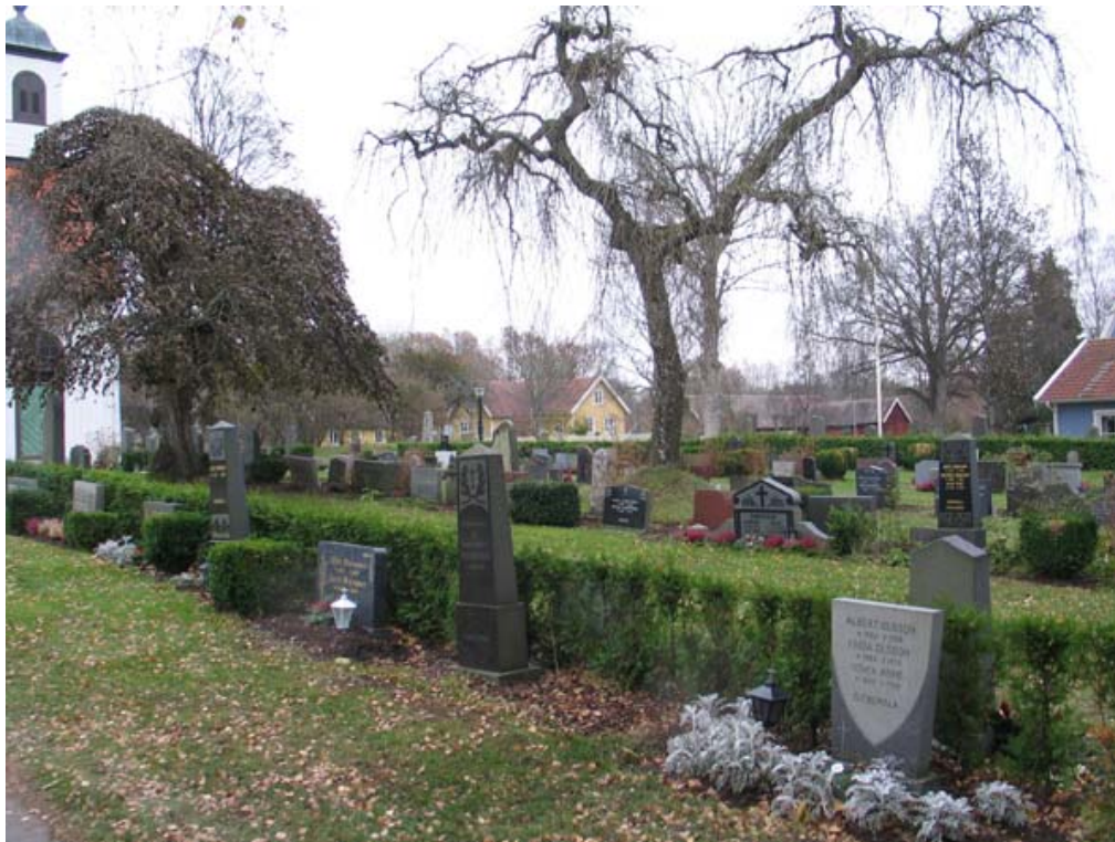
Del av kvarter C mot nordost. Notera blandningen av vårdar och det karaktärsfulla solitärträdet. (KI Gullabo kyrkog 014)

Kvarteren utgör tillsammans den gamla kyrkogården som togs i bruk från 1870-talet och framåt. Kvarter A och B är mycket små kvarter, belägna sydost om respektive norr om kyrkan. I kvarteren finns omkring 15 vårdar vardera, i kvarter A placerade i korta rader och i kvarter B mer ordnat med vårdar vända åt olika håll. Kvarter C och D utgör tillsammans en stor yta framför kyrkans långhus i sydväst. Kvarteren avdelas av mittgången som går över hela kyrkogården. Båda kvarteren är ordnade med vårdar som står i långa rader, merparten mot rygghäckar av tuja, ölandstok eller blandade perenner. Mellan många av gravplatserna finns små buskar av buxbom. Vårdarna är av varierande typer. I kvarter C står två solitärträd, en hängask och en paraplyalm.