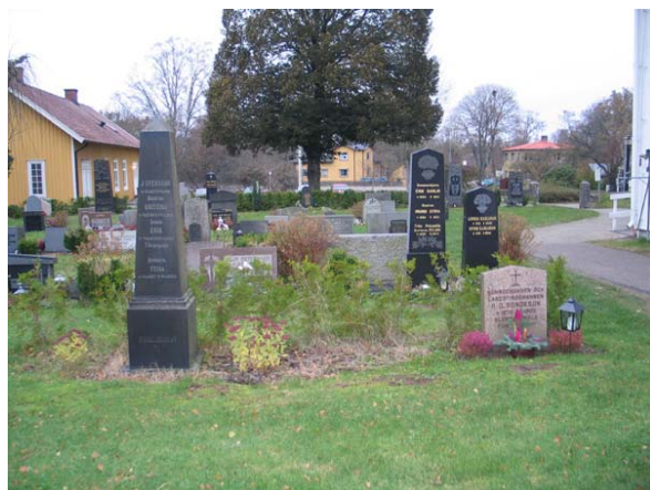
Kvarter D mot nordväst med vårdar av olika typer. Den höga vården till vänster har formen av en obelisk och är daterad 1909. (KI Gullabo kyrkog 053)