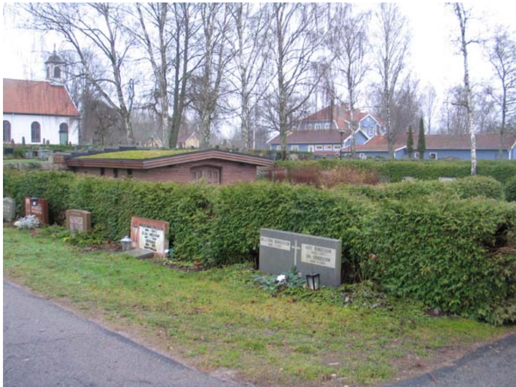
Översikt över kvarter H med bårhuset som diskret sticker upp ovan tujahäcken. Vårdar av olika typer syns också på bilden. (KI Gullabo kyrkog 089)

Bruket av allmänna gravar, eller linjegravar som var gratis eller upplåts till en mycket ringa kostnad började försvinna vid tiden kring 1900-talets mitt. I stället började man upplåta enkelgravar.