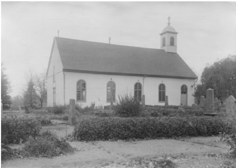
Den sydvästra delen av kyrkogården, sannolikt någon gång i början av 1900-talet. Gravplatserna är grusade och omges av låga häckar.

I läns museets och riksantikvarieämbetets arkiv finns några få äldre bilder från Gullabo kyrkogård. Samtliga bilder är odaterade och visar den sydvästra delen av kyrkogården. På bilderna syns att gångarna var belagda med grus eller sand och att även gravplatserna hade samma ytbeläggning. Häckar och, i något fall, staket av järn omgärdar de enskilda gravplatserna. Vid många av gravplatserna finns höga vårdar av svart eller grå granit – en typ som blev vanlig i 1800-talets slut då den industriella tillverkningen av gravvårdar tog fart. Troligen fanns på den gamla kyrkogården en uppdelning av köpta och allmänna gravar. Av dagens struktur kan man sluta sig till att det fanns både familjegravar och allmänna gravar i kvarter C och D under 1900-talets första hälft.