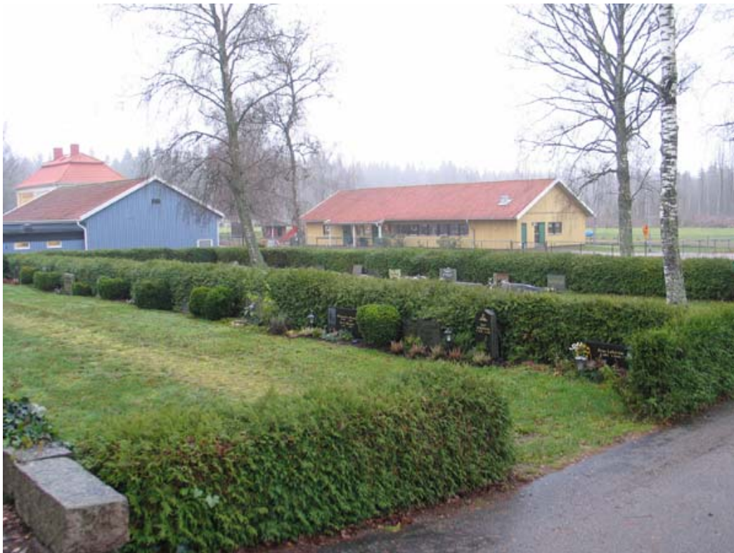
Kvarter G mot söder. Tujahäckar delar in området. (KI Gullabo kyrkog 111)

vårdarna placerade längs denna mur samt, i övrigt mestadels, längs kraftiga tujahäckar som delar in området i olika delar. Mellan många av gravplatserna finns små buskar av buxbom. I kvarter H utgör bårhuset centrum kring vilka vårdarna är placerade. Även här indelas dock området av kraftiga tujahäckar. Häck av måbär finns längs med murarna i kvarterens sydvästra delar.