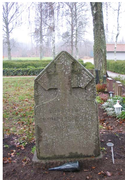
Vården över kyrkoherden Gunnar Lagerquist i kvarter E. (KI Gullabo kyrkog 128)