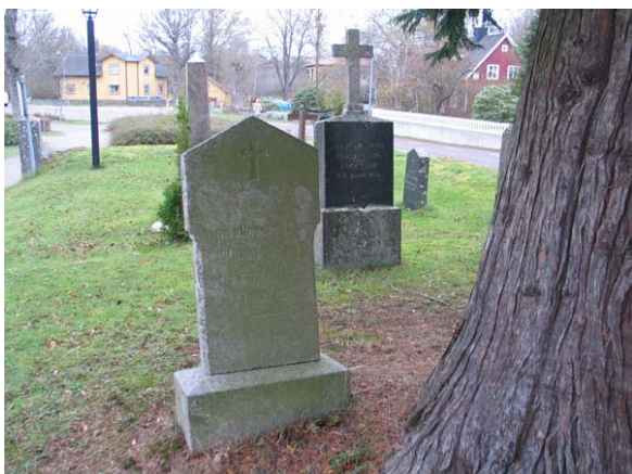
Del av det lilla kvarteret B. Vården främst i bild är rest över "Kyrkoverden" P Gummesson, död 1884. (KI Gullabo kyrkog 034)