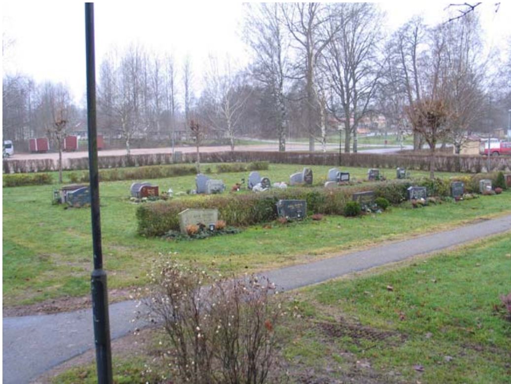
Översikt över Nya kyrkogården mot nordväst. (KI Gullabo kyrkog 076)

Områdes struktur liksom gravvårdarnas utseende är tidstypiska för slutet av 1900-talet. En utveckling mot mer individualiserad syn på gravvårdarnas utformning kan skönjas, vilket är typiskt för 1900-talets slut. Minneslunden är ett tillägg som är typiskt slutet av 1900-talet.