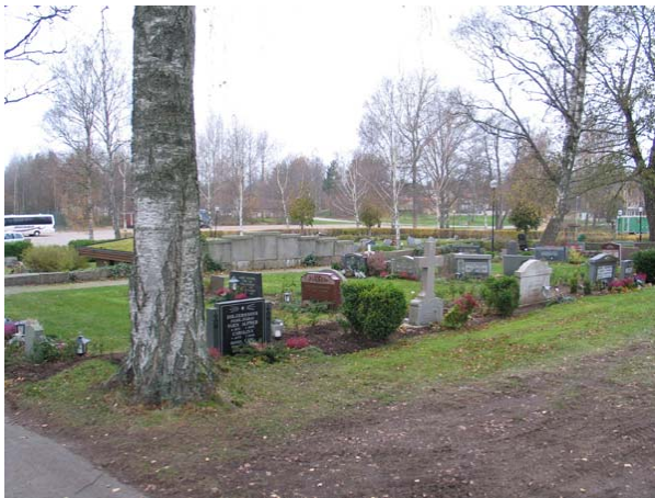
Översikt över kvarter F mot nordväst. (KI Gullabo kyrkog 017)