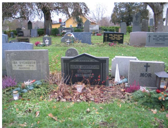
Ett parti av kvarter C. Vården i svart granit och den lilla till höger med texten "MOR" är troligen linjegravvårdar från 1940-talet (KI Gullabo kyrkog 041)