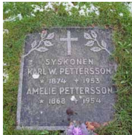
En av de liggande vårdarna i området (KI Hagby kyrkog 083)