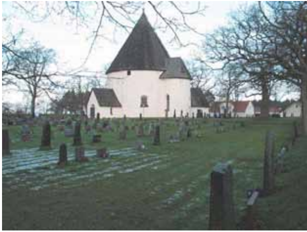
Översikt över södra delen från sydöst (KI Hagby kyrkog 010)