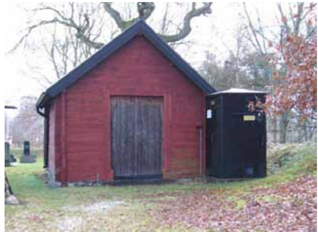
Förrådsbyggnad inne på kyrkogården från väster (KI Hagby kyrkog 015)