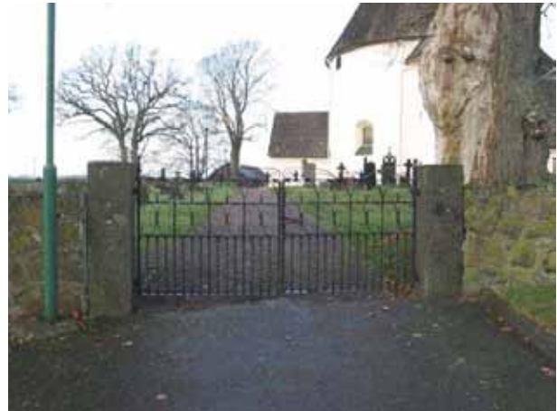
Ingång i öster. Svartmålade smidesgrindar (KI Hagby kyrkog 001)