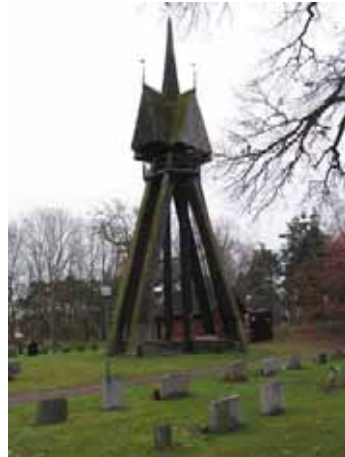
Klockstapeln står på den södra delen av kyrkogården (KI Hagby kyrkog 098)