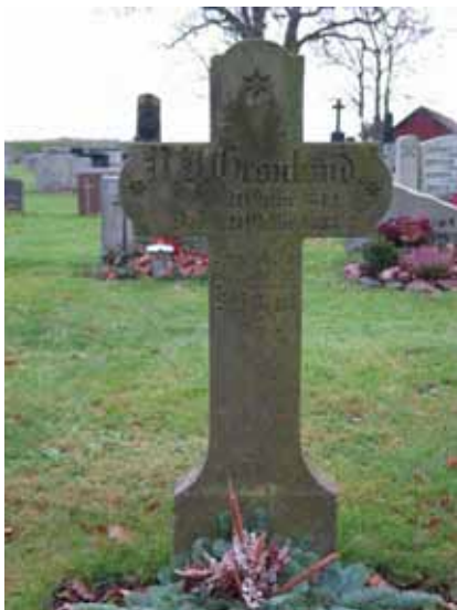
En korsformad vård i sandsten från 1857 (KI Hagby kyrkog 075)

Södra delen består av ungefär 550 platser och ligger söder om kyrkan. Området avgränsas i norr av en grusbelagd gång. I öster, söder och väster finns kyrkogårdsmuren. I västra delen av området finns en grusbelagd gång som leder från vapenhuset fram till f d bårhuset i det sydvästra hörnet. I kvarteret finns klockstapeln liksom före detta bårhuset och en förrådsbyggnad i den södra delen. Vårdarna är vända mot öster och väster. Området är gräsbesått. Man kan tydligt se var den tidigare grusbågen från klockstapeln mot öster har gått för här finns luckor i gravraderna just där gången tidigare gick fram. De äldsta gravvårdarna står längs den grusade gången i norra delen av området.