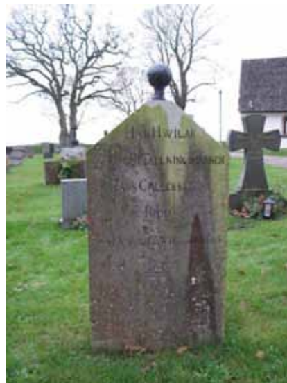
Kyrkogårdens äldsta vård rest över kronbefallningsmannen Callerström 1805 (KI Hagby kyrkog 076)