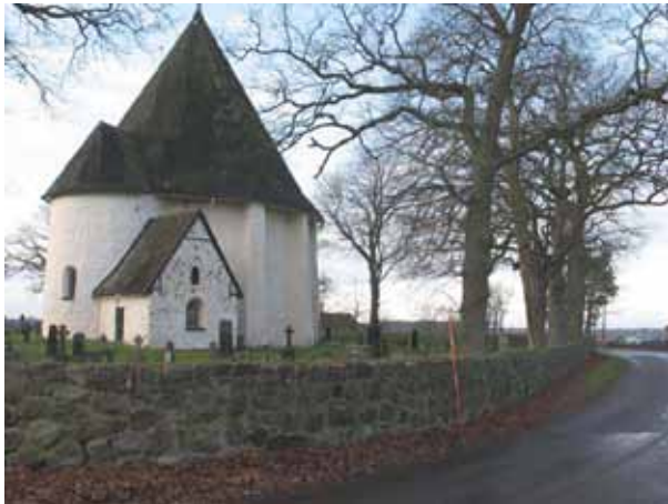
Stenmuren som omgärdar kyrkogården (KI Hagby kyrkog 037)

Hagby kyrkogård är en liten kyrkogård och omgärdas av en vallmur. På insidan av muren finns en trädkrans av ekar och lönnar. Gravplatserna finns runt om kyrkan och det finns ingen kvartersuppdelning av kyrkogården. För att underlätta rapportskrivandet har kyrkogården delats upp i norra respektive södra delen (se gravkarta). På båda delarna är gravvårdarna ordnade i rader i gräsmatta. Gravvårdarna utgörs av ett blandat material. Öster om kyrkan finns flera av kyrkogårdens äldsta gravvårdar. Intrycket domineras av dessa höga resta vårdar i mestadels svart granit. Södra delen är mer likartad med sina låga rektangulära vårdar.