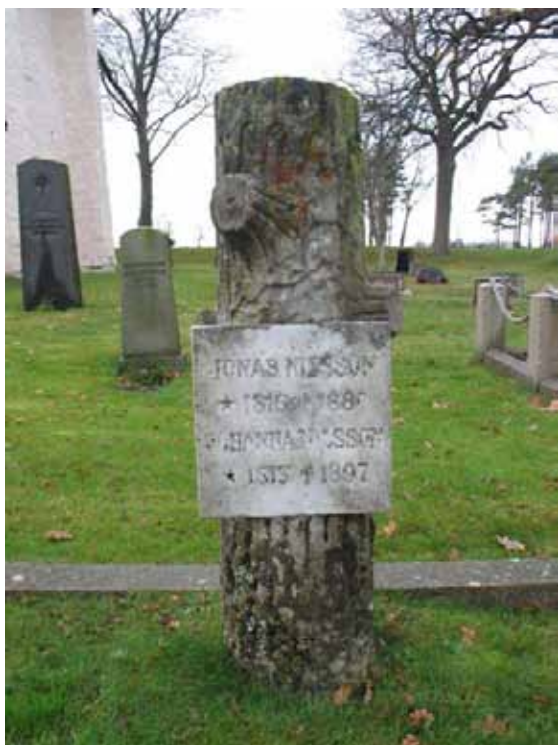
Stamformad vård i granit med marmortavla rest 1880 över Jonas Nilsson och hans hustru (KI Hagby kyrkog 057)

Norra delen består av cirka 304 platser och ligger väster, norr och söder om kyrkan. Området avgränsas åt söder av en grusbelagd gång och i övriga väderstreck begränsas området av kyrkogårdsmuren. Närmast kyrkan i öster finns en gång av kalkstensplattor. Intrycket av området domineras av de höga vårdarna, flertalet blankputsade svarta i granit som finns omedelbart öster om kyrkan. Många platser rymmer familjegravar som brukats av samma familj under en lång tid. Vårdarna är vända mot öster eller väster. Området är gräsbesätt.