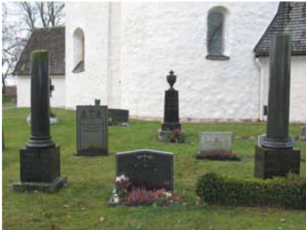
Olika typer av vårdar i norra kvarteret (KI Hagby kyrkog 061)

Den dödes yrkestitel finns angiven på ungefär hälften av alla vårdarna. Vanligast är lantbrukare men titlar som åldermannen, skepparen, sjökaptenen, garvaren, tandteknikern, rektorn, brevberaren, mjölnaren, kantor, förskoleläraren, byggmästaren, pälsdjursuppfödaren, skräddarmästaren, målarmästaren och kronolänsmannen förekommer också. Ortnamn förekommer ofta på gravvårdarna.