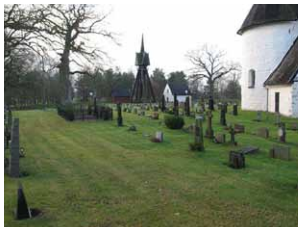
Översikt över norra delen, öster om kyrkan (KI Hagby kyrkog 031)