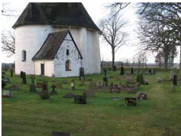
Översikt över norra delen från öster (KI Hagby kyrkog 030)