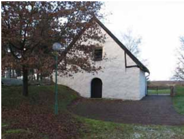
Sockenmagasinet och f.d bårhuset från öster (KI Hagby kyrkog 014)

Ett före detta sockenmagasin, som under en period användes som bårhus, finns i det sydvästra hörnet av kyrkogården. Byggnaden är medeltida och uppförd i natursten och vitkalkad, taket är lagt av svarta tegelpannor. Bårhuset har ingen kylanläggning och det används idag som förråd. Intill sockenmagasinet finns ett rött trähus också det med svart tegeltak. Det har tidigare varit stiglucka vid ena kyrkogårdsporten fram till år 1837 då det flyttades till sin nuvarande plats. Byggnaden används som förråd och här finns också en centraldammsugare till kyrkan installerad. Klockstapeln, uppförd 1693, finns även den i södra delen av kyrkogården.