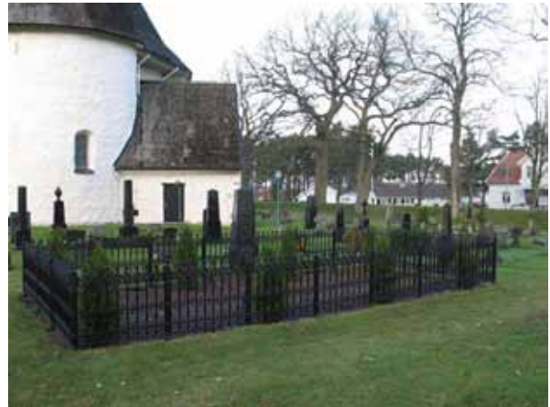
Familjen Olssens gravplats som renoverades under 2005(KI Hagby kyrkog 033)