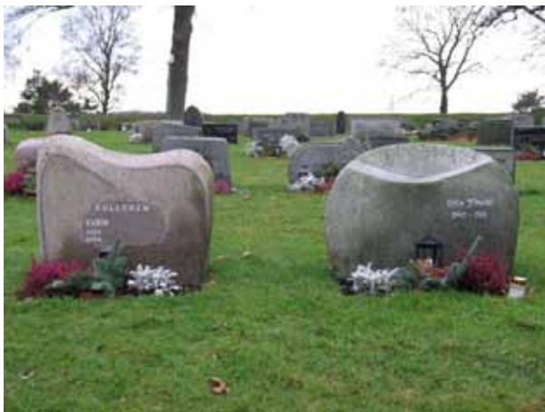
Modernt utformade vårdar (KI Hagby kyrkog 080)

I kvarteret anges den dödes yrkestitel på en mindre andel av vårdarna. De titlar som förekommer är handlaren, mjölnaren, skepparen, sjökaptenen, sjömannen, banvakten, skomakaremästaren, apotekaren, kyrkvaktmästaren, lantbrukaren, källarmästaren, smedmästaren, hammmästaren, trädgårdsmästaren, fjärdingsmannen och kronbefallningsmannen. Den dödes hemort anges på flertalet av gravvårdarna.