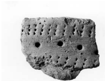
Fig. 3. Keramikskärva funnen på 1960-talet vid fastigheten Solhöjden.

och Raä 272 ligger i villakvarteren strax norr om hamnområdet och utgörs av fyndplatser för två stenyxor. Här råder lite oklarheter i källorna eftersom det finns ytterligare uppgifter om fynd i arkivmaterialet som inte medtagits i FMIS. Sannolikt rör det sig dock om ytterligare fynd från samma plats, d.v.s. Raä 272. På 1960-talet hittades på fastigheten Solhöjden, i samband med planeringsarbete på tomten, en del av en stenysa samt en keramikskärva från stenålderns gropkeramiska kultur. Vid samma tid höll även grannen på med markarbeten och påträffade 3 st trindyxor, samt några kvarts- och kvartsitavslag. Fastighetsägaren hade även observerat ”spår av en grop med ett par smärre stenar i”. Fyndplatserna besiktigades av fil dr Harald Stale men några anläggningar eller kulturlager kunde då inte observeras (Stale 1962 mfl).