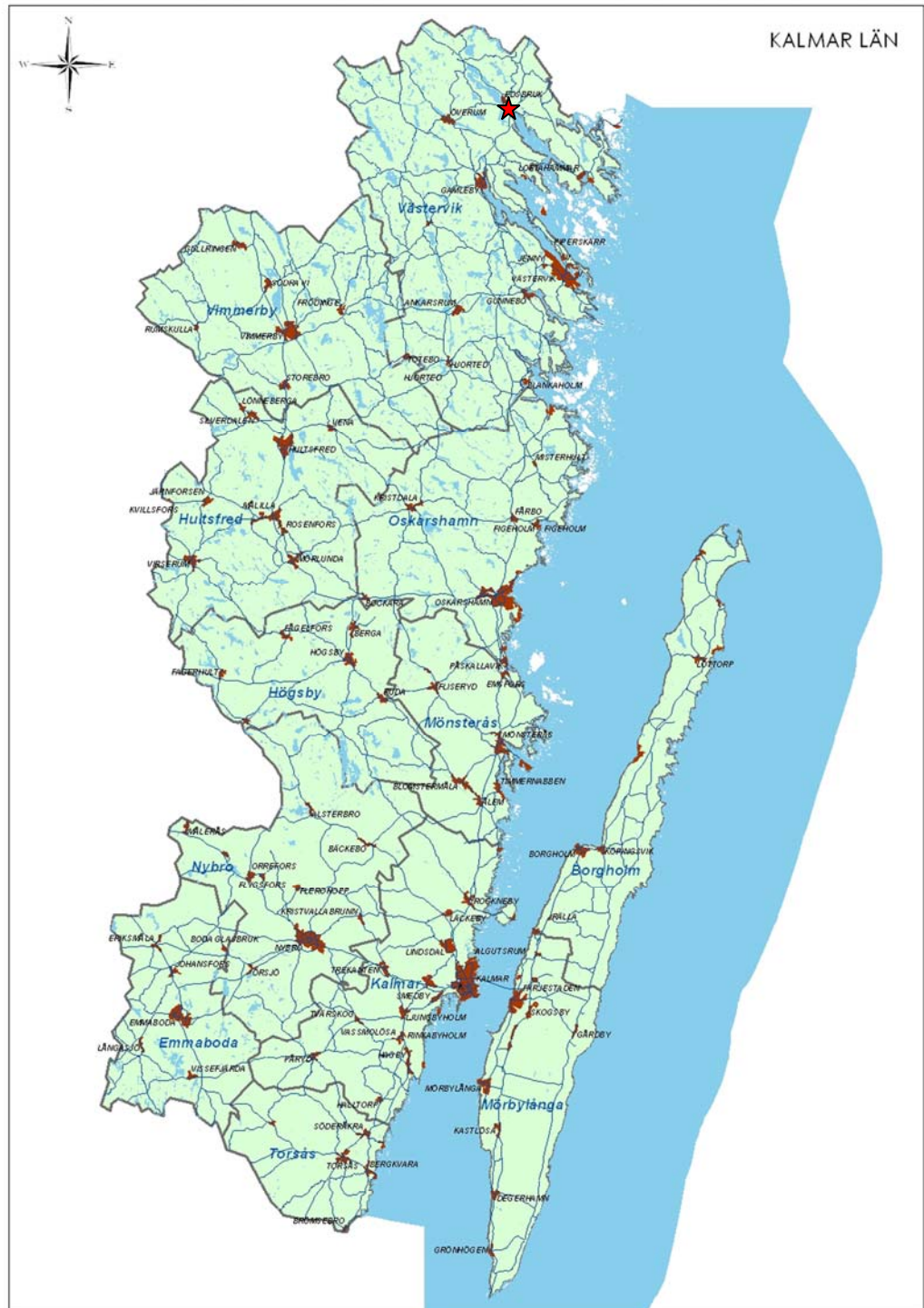
Fig. 1. Karta över Kalmar län. Hälgenäs markeras med röd stjärna.