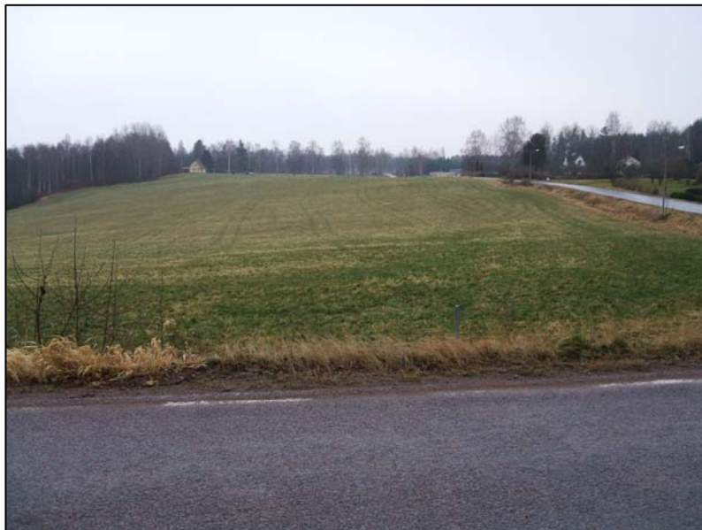
Fig. 4. Vy över delen av planområdet som ligger utanför hamnen. I förgrunden finns boplatssytan Raä 80:2.