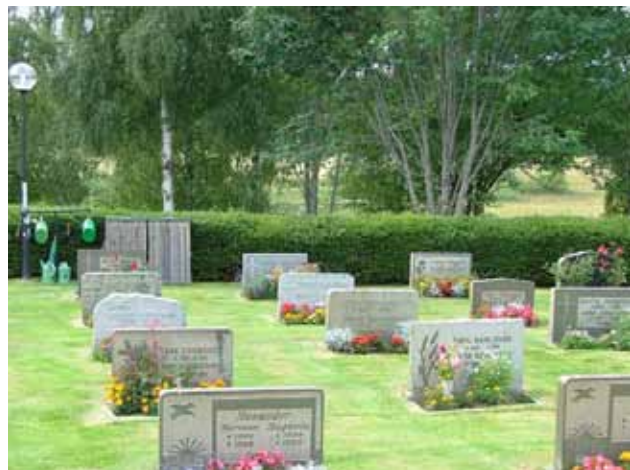
Låga, rektangulära gravvårdar i kvarteret blåsippan. Bakom träden kan man ana Maden som breder ut sig nedanför kyrkogården i anslutning till Vapenbäcksån. (KI Hälleberga kyrkog 049)