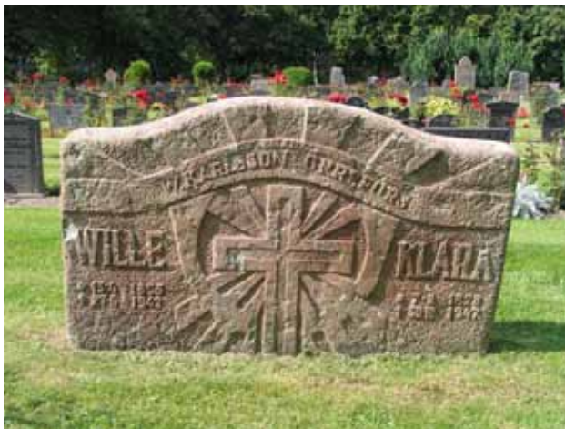
Gravvård av kalksten i kvarter B. (KI Hälleberga kyrkog 096)

I de västra delarna av kvarter C ska flera av de sockenbor som avled i spanska sjukan ha begravts. Flertalet av dessa stenar har tagits bort men enstaka finns kvar. Gravvårdar från denna tid kan också återfinnas bland köpegravarna i västra delen av kvarter D.