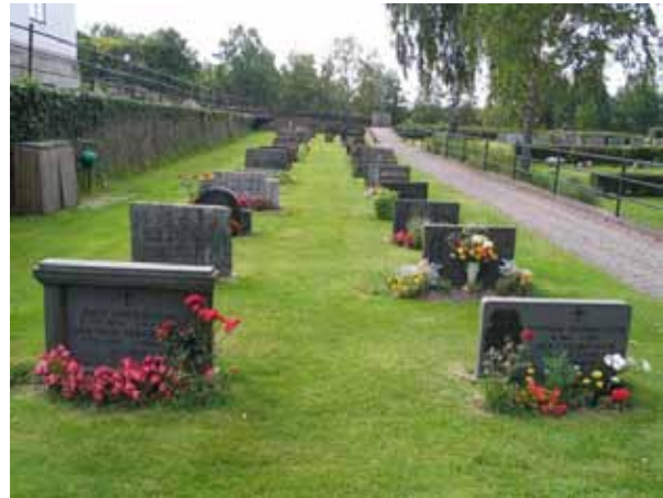
Kvarter I från öster. (KI Hälleberga kyrkog 108)