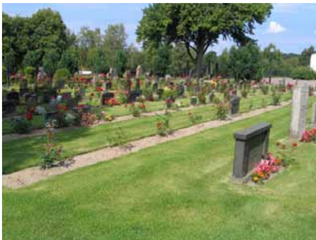
Linjegravsområde i kvarter B från sydost. (KI Hälleberga kyrkog 095)

De fyra kvarteren är placerade i kyrkogårdens sydvästra hörn. Samtliga kvarter rymmer eller har rymt kyrkogårdens linjegravsområden. Kvarter B, C och D har alla tre varit utformade med köpta gravplatser i kvarterens ytterkanter och linjegravsområden i mitten. I kvarter C kan man idag bara ana resterna av denna struktur medan den i kvarter B och D ännu är klart utläsbar. Ett mindre antal köpta gravplatser mitt i västra delen av kvarter B bryter mönstret i detta kvarter. Kvarter E saknar ramen av köpta gravplatser. Här har istället iordningställt ett antal köpta gravplatser i västra delen av kvarteret. Kronologiskt går det att följa linjen från spridda rester i kvarter C, vidare till kvarter D, B, och slutligen E. Bland köpta gravplatserna i de tre äldre kvarteren finns rester av omgärdningar och grusbeläggningar kvar som berättar om kvarterets historia.