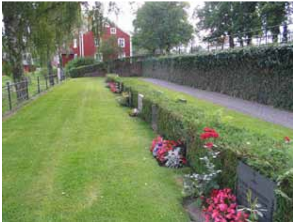
Kvarter L från norr. (KI Hälleberga kyrkog 110)