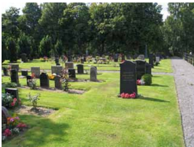
Köpta gravplatser i kvarterets ytterkant och innanför dessa linjegravsområde. Kvarter D från nordost. (KI Hälleberga kyrkog 098)