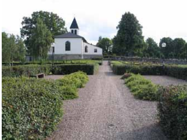
Grusgången som delar blomsterkvarteren i en östlig och en västlig del. (KI Hälleberga kyrkog 117)