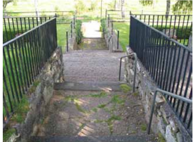
Trappor som sammanbinder terrasserna på östra sidan av kyrkan. ( KI Hälleberga kyrkog 107)