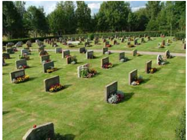
Kvarteren konvaljen och blåsippan från sydost. (KI Hälleberga kyrkog 029)