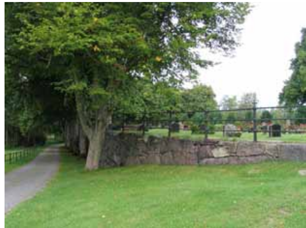
Stödmur, gjutjärnsstaket och trädkrans i söder. (KI Hälleberga kyrkog 060)