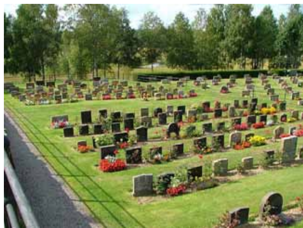
Linjegravsområdet i kvarter E från sydost. (KI Hälleberga kyrkog 023)