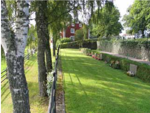
Kyrkogårdens gräns i öster. ( KI Hälleberga kyrkog 074)

antiken. Det kan t.ex. handla om symmetriskt uppställda vårdar med kolonner eller pilastrar. Denna typ av gravvårdar var vanlig på 1930- och 40-talen. Dekor i form av lagerkransar och urnor hör också till typiska klassicistiska stildrag. Ett mindre antal av dessa gravplatser är belagda med grus och försedda med omgärdningar. På de nya delarna av kyrkogården dominerar låga, rektangulära gravvårdar som varit vanliga sedan 1930-talet. Urngravsområdet i kvarter violen utmärker sig. Här finns endast liggande gravvårdar och flera av dem är av natursten.