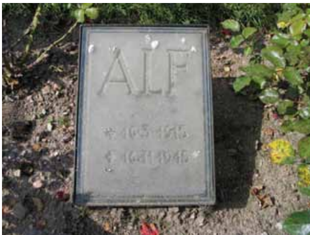
Närheten till flera glasbruk märks på kyrkogården. Här en av de tre gravvårdarna i form av en graverad glasskiva på en lutande ställning av smide. Denna vård återfinns i kvarter B. (KI Hälleberga kyrkog 094)