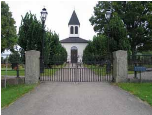
Ingång till kyrkogården i söder. (KI Hälleberga kyrkog 059)

I öster: Enkel, svartmålad smidesgrind och granitstolpar. Trappa som leder upp till kyrkans södra ingång. Stegen av granit och avsatserna belagda med kalkstensplattor. Svartmålat smidesräcke.