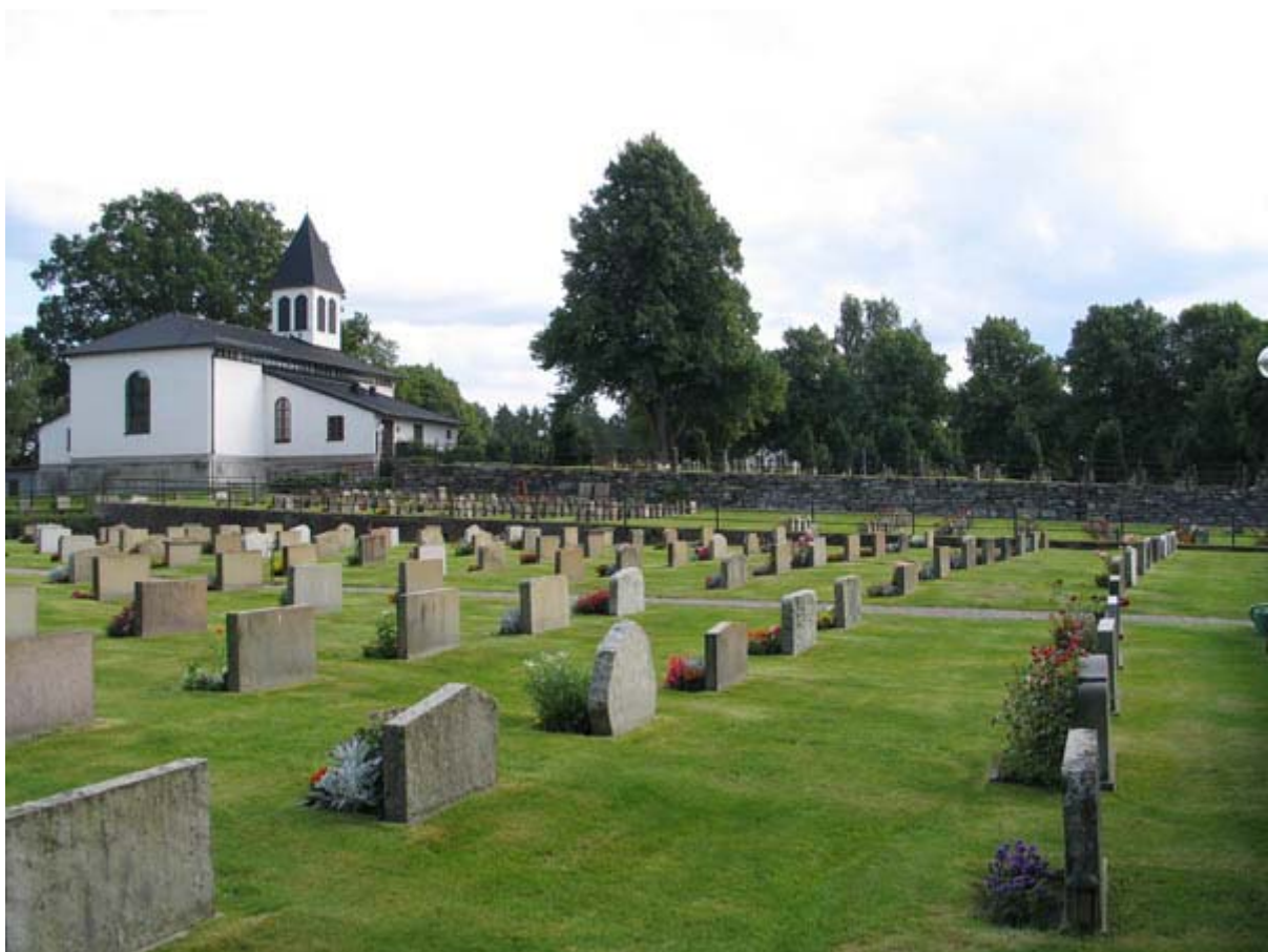
KI Hälleberga kyrkog 119

Kulturhistorisk inventering av kyrkogårdar/ begravningsplatser i Växjö stift 2005