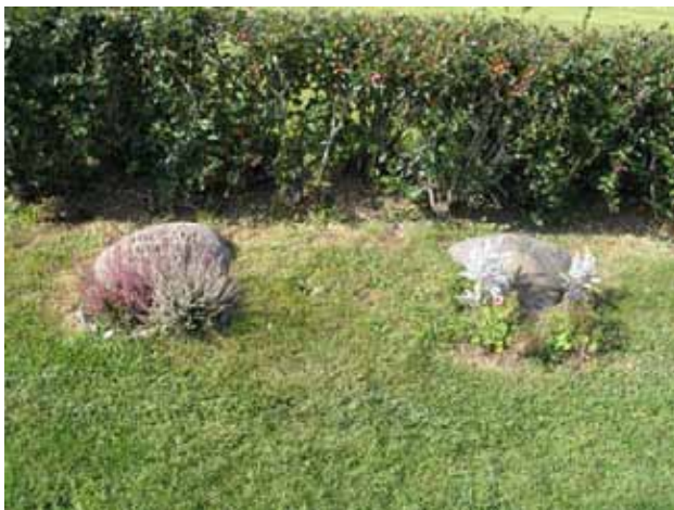
Gravvårdar i urlunden, kvarteret violen. (KI Hälleberga kyrkog 114)