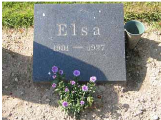
Linjegravvård i kvarter D. På flera gravvårdar anges endast förnamn och årtal eller den dödes ålder. (KI Hälleberga kyrkog 102)