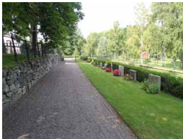
Kvarter H från söder. (KI Hälleberga kyrkog 106)