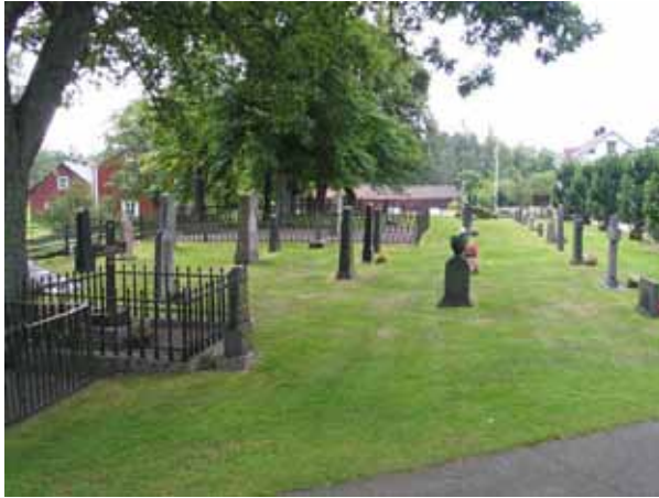
Kvarter A från norr. (KI Hälleberga kyrkog 079)