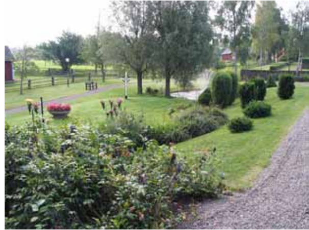
Minneslundan från norr. (KI Hälleberga kyrkog 070)