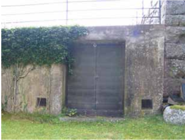
Bisättningskällare i gränsen mellan den gamla stödmuren av kanthuggen natursten och den nya stödmuren av cement. (KI Hälleberga kyrkog 064)