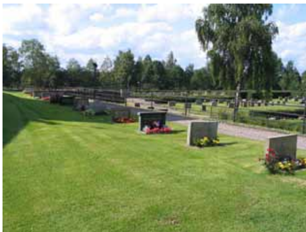
Kvarter F från öster. (KI Hälleberga kyrkog 104)

Kvarteren tillhör de områden som tillfördes kyrkogården i samband med utvidgningen på 1940-talet. De är anlagda på långsmala terrasser som stöds av murar av cement. Antalet gravplatser är begränsat. Det största kvarteret är kvarter I som rymmer 72 gravplatser. Kvarter F och I är belägna norr om kyrkan och övriga fyra öster om kyrkan. I kvarter F och I är samtliga gravvårdar vända mot öster. De övriga kvarteren har ryggställda gravvårdar vända mot öster eller väster. Mellan raderna av gravvårdar är häckar av tuja planterade. Från kyrkans östra sida leder en trappa i flera avsatser ner till kyrkogården östra gräns. Utmed varje kvarter finns en grusad gång. Vid stödmurarna av cement är murgröna planterad. I södra delen av kvarter L finns en mindre oxelhäck i kyrkogårdens omgärdning och i södra delen av kvarter H står två träd av sorten benved.