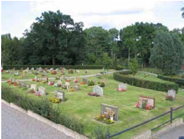
Kvarteren violen och blåklockan från sydväst. Till höger i bilden syns urlunden. (KI Hälleberga kyrkog 115)

glasmålare, gravvör. Utöver dessa finns titeln kyrkoherde i kvarteret blåsippan. Den dödes hemort anges på majoriteten av gravvårdarna.