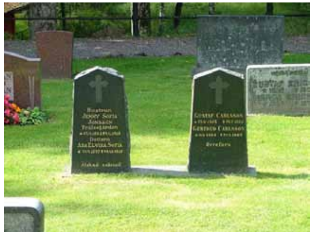
Gravvårdar i kvarter C. Den västra stenen har rest över mor och dotter som troligen dog i spanska sjukan 1918 med några få dagars mellanrum. Den gravvården utgör idag en rest av linjegravsområdet i kvarter C. (KI Hälleberga kyrkog 010)