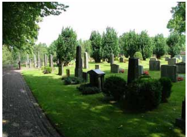
Gravvårdar på köpta gravplatser. Kvarter C från sydväst. (KI Hälleberga kyrkog 008)

Linjegravvårdarna i kvarter B, D och E är placerade i rader med öppen jord. Mellan gravvårdarna har röda rosor planterats. Majoriteten av gravvårdarna är vända mot öster. Ett mindre antal gravvårdar har vänts mot väster p.g.a. gångsystemet. Mellan kvarter B och C på ena sida och kvarter D på den andra går en av de gångar som markeras av knuthamlade almar. I kvarter D står en stor lind.