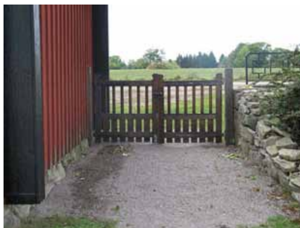
Grinden intill stigluckan mellan gamla och nya delen (KI Halltorp kyrkog 096)