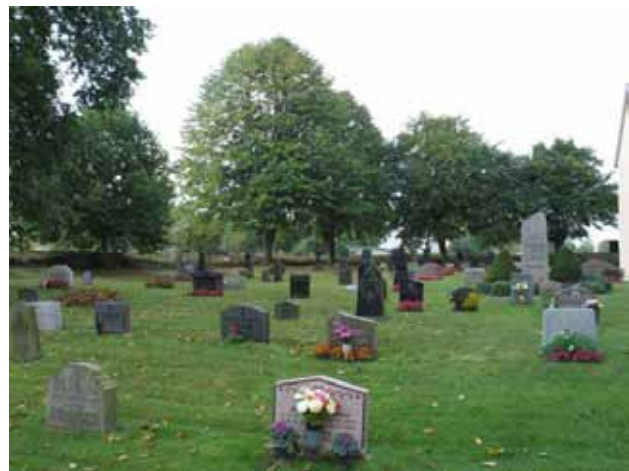
Översikt över kvarter B från nordost (KI Halltorp kyrkog 039)