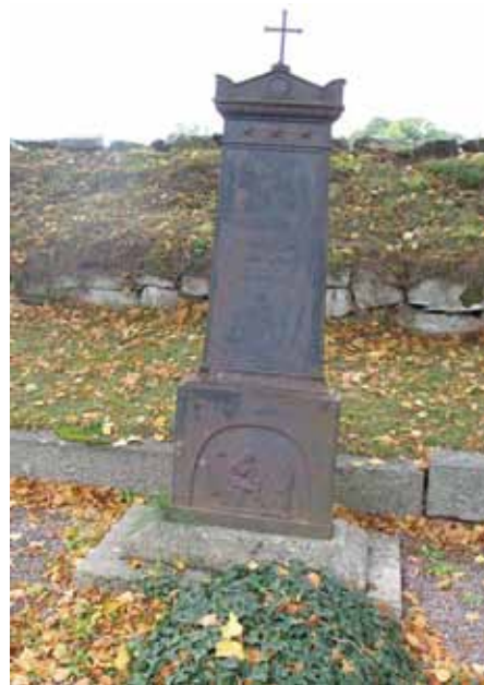
Äldsta gravvården i kvarter E, är en gjutjärnsvård inom den Mannerskantzka gravplatsen. Vården restes 1849 över Carl Flyth (KI Halltorp kyrkog 087)