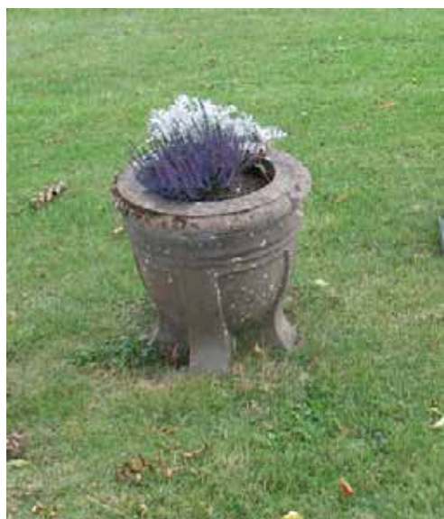
Gravvård av granit, utan inskription, i form av en urna, kvarter E (KI Halltorp kyrkog 069)

I kvarteret finns många olika typer av vårdar från hela 1900-talet. Här finns ett stort antal stående höga stenar men också lägre rektangulära vårdar och ett mindre antal liggande vårdar. Materialet är företrädesvis svart och grå granit men även röd förekommer. Ett par gravvårdar är i kalksten och en i marmor. En vård är utformad som en stor urna i grå granit och har ingen inskription. Två vårdar av gjutjärn står längs kyrkogårdsmuren i väster och i kvarteret finns även en modern gjutjärnsvård. Flertalet av vårdarna i sten är formade som kors. En del vårdar har klassicistiska stildrag med kolonner, lagerkransar och tempellika gavelpartier.