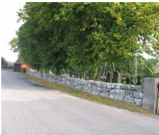
Omgärdningen i väster, notera stigluckan till vänster i bild (KI Halltorp kyrkog 005)

finns en trädkrans av ek, lönn, ask och alm. Kvarter A och B ligger i söder, C i öster och D och E i norr. Området i norr, Nya kyrkogården, utgör en tydlig utvidgning med urlund och mer vegetation än den övriga kyrkogården. I alla kvarteren är gravvårdarna ordnade i rader i gräsmatta och på nya delen står vårdarna mot en rygghäck. Vårdarna är vända mot öster eller väster. Som beskrevs i historiken genomgick kyrkogården en stor förändring under 1960- och 70-talen då samtliga grusgravar såddes in med gräs och gravplatsernas omgärdningar avlägsnades. Idag är det svårt att se några spår av kyrkogårdens tidigare utformning, fränsett det insådda gångsystemet. Klockstapeln nordost om kyrkan och stigluckan i väster bidrar till att rama in kyrkogården. Kyrkan och kyrkogården har ett vackert läge i landskapet med utsikt över åkermark och med prästgården, församlingsgården i närmaste omgivningarna.