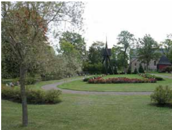
Nya kyrkogården från norr (KI Halltorp kyrkog 101)

Nya kyrkogården ligger norr om den gamla och invigdes 1966. I den sydöstra delen finns kyrkogårdens urngravsområde. Nya kyrkogården är utformad som en ellips med många gröna ytor. Runt om på den västra och norra sidan löper en vallmur av natursten. Vallmuren mellan den gamla och nya kyrkogården i söder har bibehållits. I öster avgränsas kyrkogården kallmurad mur i natursten. På murarna växer coteanaster, och ölandstok. Urngravarna avgränsas mot den äldre delen med liguster. I mitten av området är en gräsmatta runt vilken en grusgång löper. I norra delen av gräsmattan är en plantering av rosenbuskar och i söder, i avgränsningen mot den äldre kyrkogården, finns en tujahäck med ett antal granlika tujor som låtit växa höga. Gravarna är placerade i rader på ömse sidor av gräsytan. Vårdarna är vända åt öster, väster, norr och söder. Träd som lönn, blodlönn, silverpil, ek och ask finns planterade som trädkrans.