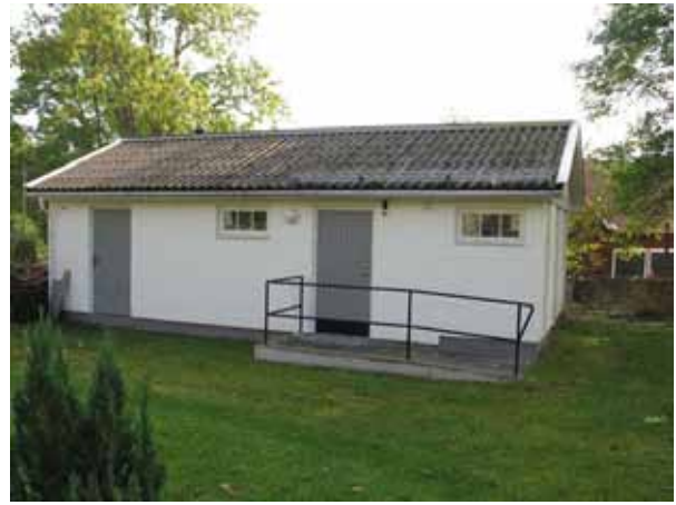
Ekonomibyggnad i det sydöstra hörnet av kyrkogården (KI Halltorp kyrkog 013)