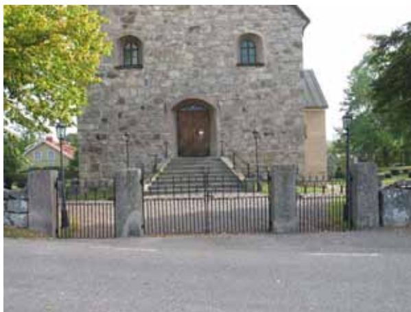
Ingången mitt för kyrkans västra ingång (KI Halltorp kyrkog 004)