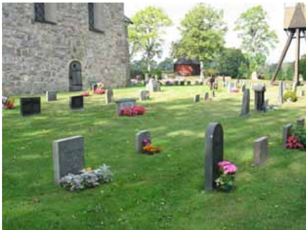
Översikt över kvarter C från sydost (KI Halltorp kyrkog 048)

Kvarteren C och D är belägna öster och delvis norr om kyrkan och rymmer enligt gravkartan närmare 320 gravplatser. Kvarteren omgärdas av kyrkogårdsmuren i öster, medan kyrkan och grusgångar inramar området i väster och i norr. I söder är det endast en remsa gräs, tidigare en grusbelagd gång, som avskiljer kvarteren mot kvarter B. Inget markerat gångsystem finns men tidigare har det funnits en gång i kvarter D. I områdets nordöstra del står klockstapeln. Hela området är besått med gräs och vårdarna står i rader, vissa ryggställda, vända mot öster och väster.