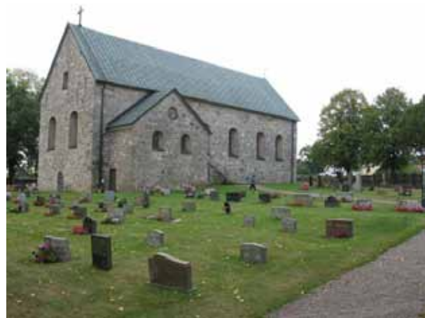
Översikt över kvarter D från nordost (KI Halltorp kyrkog 050)