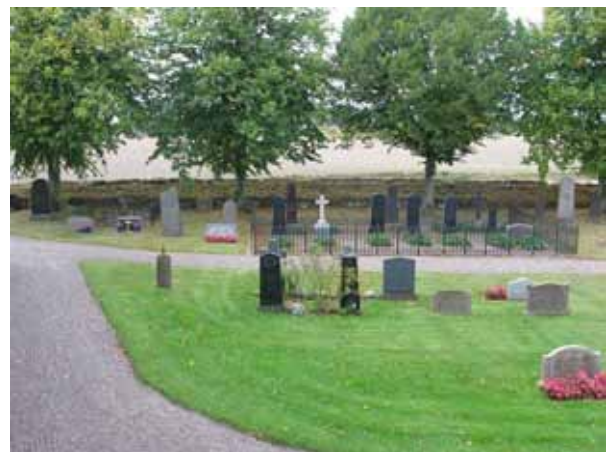
Översikt över den södra delen av kvarter E från öster (KI Halltorp kyrkog 061)