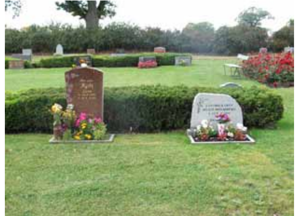
Vårdar från 2000-talet på nya kyrkogården (KI Halltorp kyrkog 103)