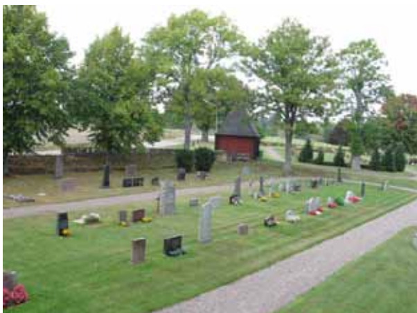
Översikt över kvarter E från sydost (KI Halltorp kyrkog 060)

Kvarter E är beläget nordväst om kyrkobyggnaden och består enligt gravkartan av ungefär 190 gravplatser. Kvarteret avgränsas i väster av kyrkogårdsmuren och åt alla andra väderstreck av grusgångar. I norr finns rester av den gamla kyrkogårdsmuren, som idag är gräns mot den Nya kyrkogården. Genom kvarteret löper en grusgång i nordost-sydvästlig riktning. Gravvårdarna står i rader i gräsmatta. Vårdarna är vända åt öster eller väster.