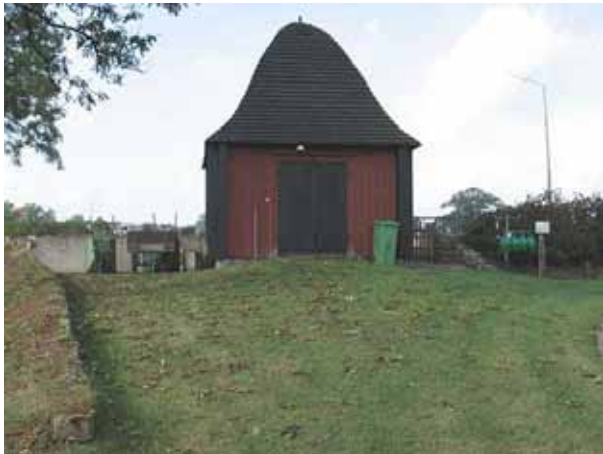
Stiglucka i den västra muren. Stigluckan används idag som förråd. Notera gamla kyrkmurssträckningen till vänster i bild (KI Halltorp kyrkog 008)

Halltorp kyrkogård har ingen minneslund de församlingsbor som önskar gravläggas i minneslund hänvisas till Arby kyrkogård.