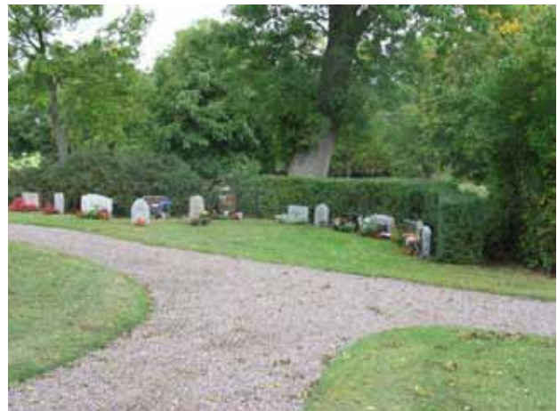
Urngravsområdet från sydväst (KI Halltorp kyrkog 094)