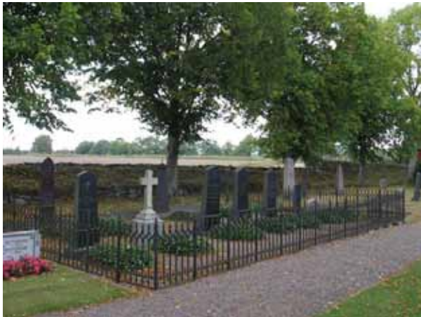
Familjen Mannerskantz gravplats omgärdas av ett gjutjärnsstaket och innanför staketet är 11 gravvårdar resta (KI Halltorp kyrkog 079)