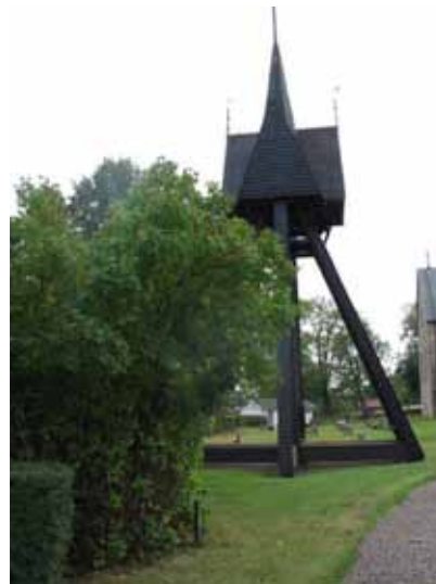
Klockstapelns uppförd på 1725 (KI Halltorp kyrkog 106)