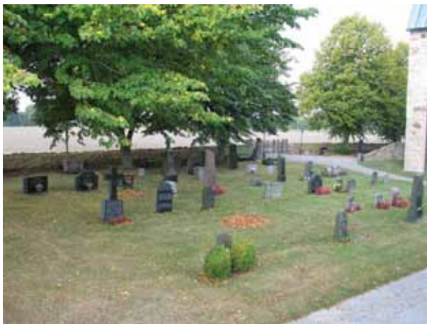
Översikt över kvarter A från sydost. (KI Halltorp kyrkog 018)

Kvarteren ligger söder om kyrkan och rymmer 337 gravplatser. Kvarteren avgränsas av kyrkogårdsmuren mot söder och väster. I öster är en gräsmatta, som tidigare var en grusbelagd gång, mot kvarter C. I norr ligger kyrkan. Kvarteren delas av den kalkstensgång som leder från ingången i söder till kyrkans södra ingång. I kvarteret står rader av gravvårdar i gräsmatta. I alla rader står vårdarna vända mot öster utom de gravplatser som ligger vid kalkstensgången. De är vända mot gången det vill säga mot väster.