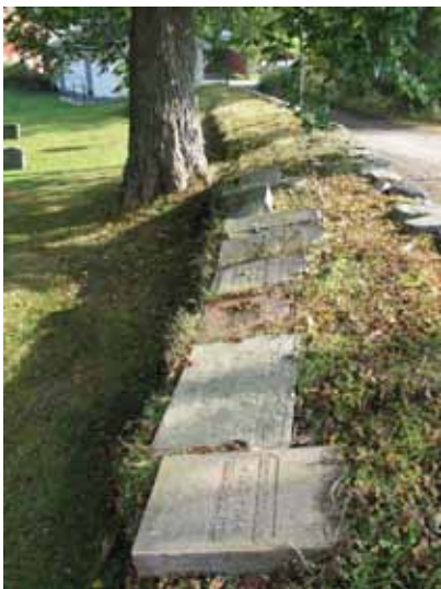
Vårdar tagna ur bruk ligger i den södra vallmuren (KI Halltorp kyrkog 016)

En bred grusad gång leder från ingången i väster fram till kyrkans västra ingång. Grusgången går sedan runt om hörnen till respektive långsida. I söder ansluter den till den kalkstengång som kommer från den sydvästra grinden mot vapenhuset. I övrigt finns det inga gånger i söder. På norra sidan går grusgången fram till sakristian. I övrigt löper två grusgångar i NNO-SSV riktning och ansluter till gångsystemet på den nya kyrkogården. Förbi klockstapelns i östvästlig riktning går en grusgång ut genom kyrkogårdsmuren fram till prästgården. På nya delen finns en grusgång som går runt området.