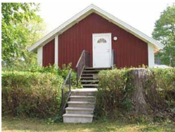
En trappa leder över östra kyrkogårdsmuren och in till församlingsgården (KI Halltorp kyrkog 012)

Kyrkogården omgärdas av en vallmur i söder, väster och i norr. I öster är en hög kallmurad stenmur. Mellan gamla och nya delen kan man se rester efter den gamla vallmuren.