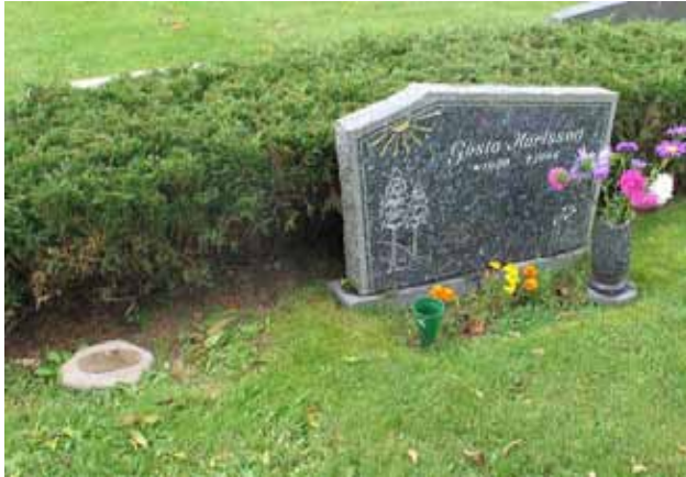
Vårdar på nya kyrkogården. Notera den enkla lilla vården till vänster (KI Halltorp kyrkog 105)