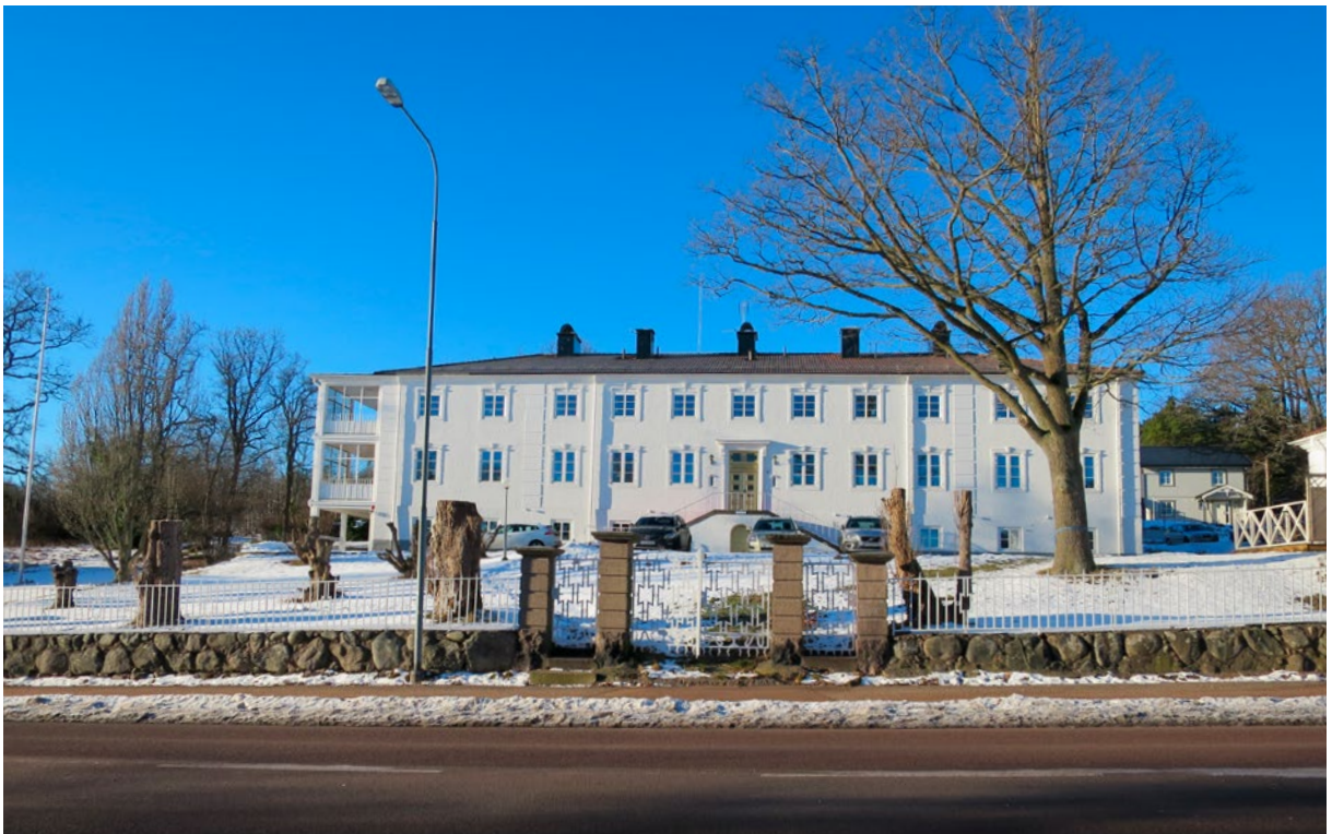
Mot söder är en terrassering med trappor, stig och järnräcke, lövträd och buskar.