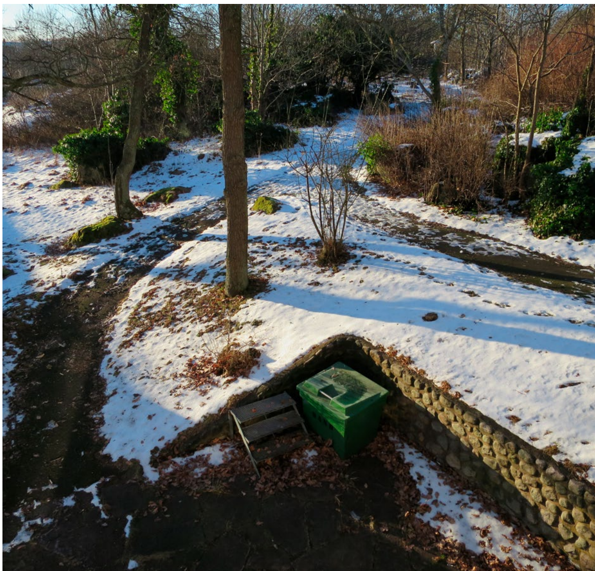
Den gamla sjukhusparken.

par på en låg stenmur. Framför huvudbyggnaden finns en asfalterad plan och gräsmattor med karaktärsskapande gamla träd bl.a. pelarpopplar. Sydväst om huvudbyggnadens finns rester av den gamla sjukhusparken med stig, lövträd, marktäckande växter, buskar och berg. Mot söder är en terrassering med trappor, stig och järnräcke, lövträd och buskar. Norr om huvudbyggnaden finns en parkeringsyta, mindre, moderna ekonomibyggnader och gräsmatta med lövträd.