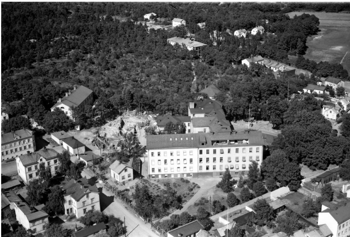
Oskarshamns första lasarett med tillbyggnad och epidemisjukhuset i bakgrunden.

de större omvandlades till infektionskliniker kopplade till lasaretten.