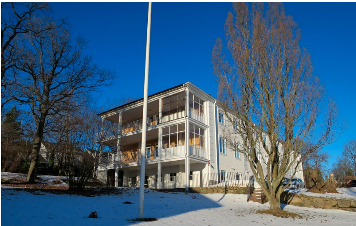
Järnstaket med grindar och stenstolpar på en låg stenmur, plan och gräsmattor med karaktärsskapande gamla träd.