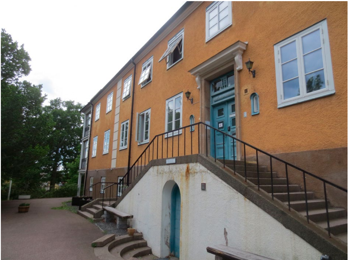
Fasad mot öster med gul kulör innan dagens vita färgsättning.