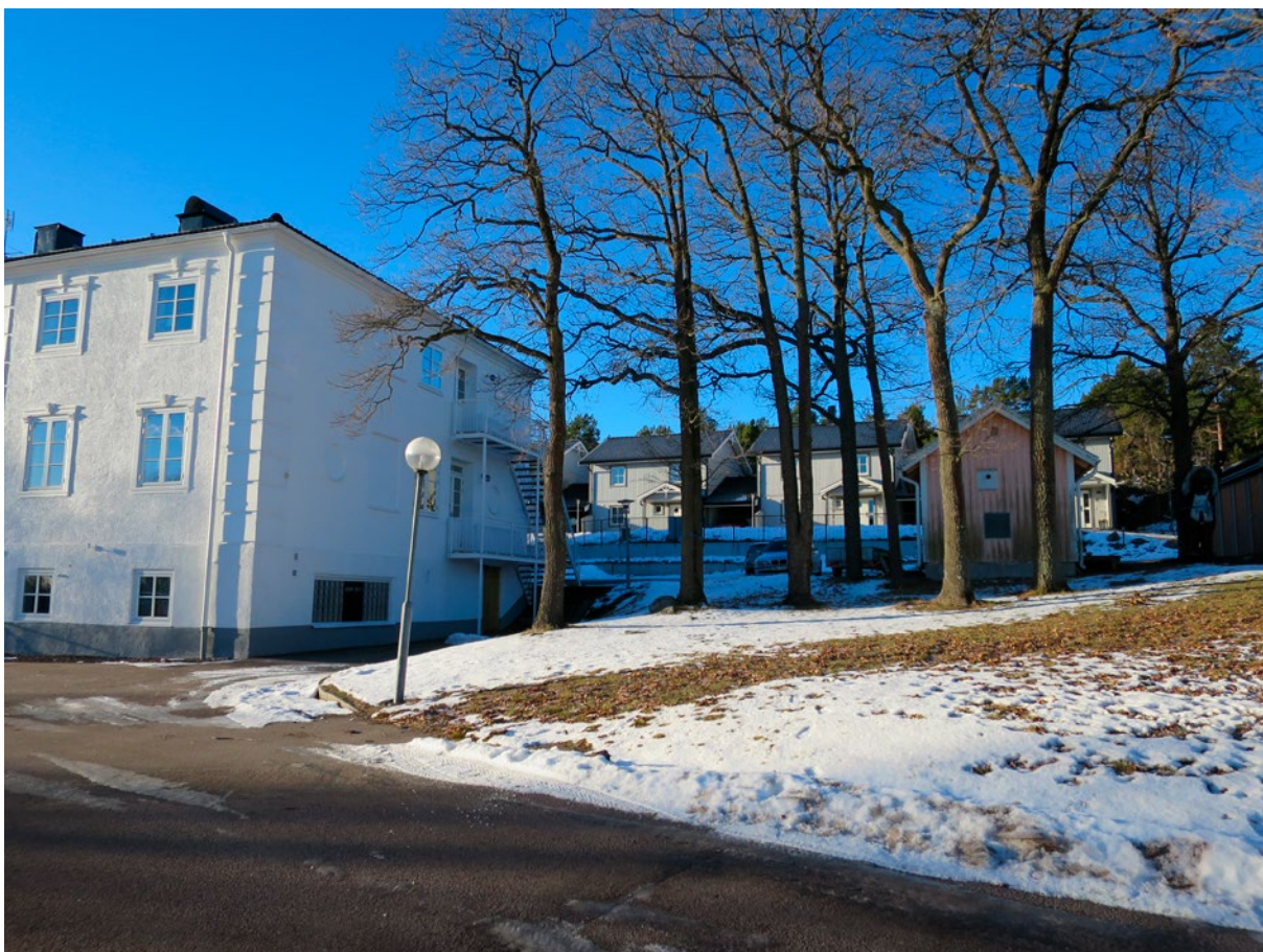
Norr om huvudbyggnaden är en parkeringsyta, mindre moderna ekonomibyggnader och gräsmatta med lövträd.