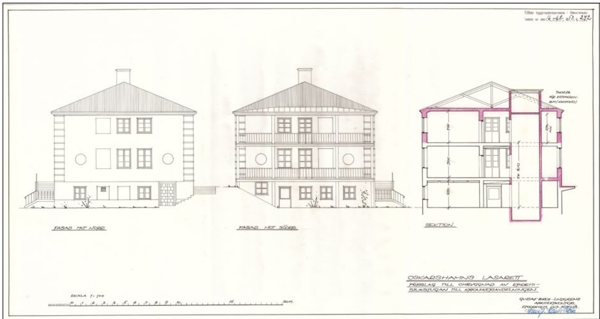
Ritning på huvudbyggnadens östra fasad/huvudfasad från 1953.

Huvudbyggnadens karaktär präglas av sin långsmala form, höga grund med markplan och överbyggnad i två våningar med putsad fasad, markerat entréparti med fritrappan,