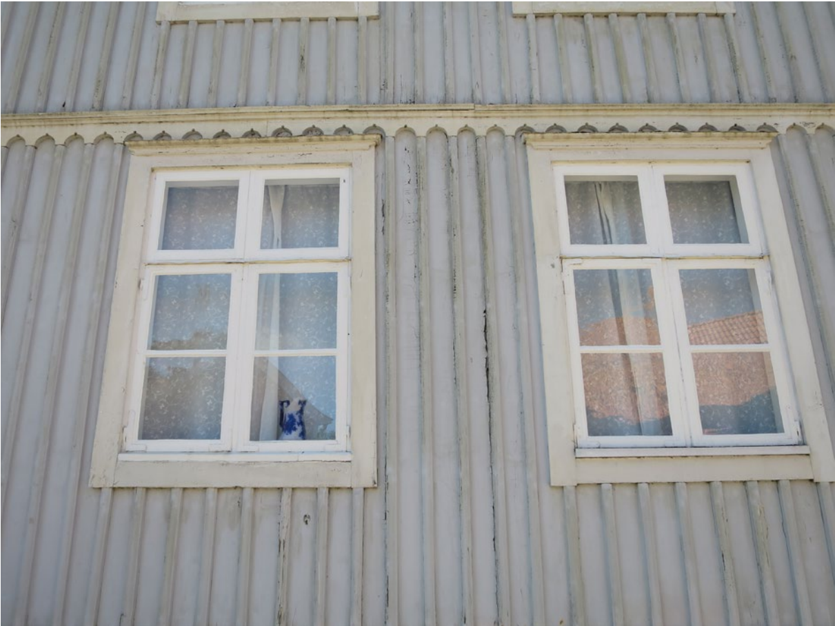
Harbergsgården före åtgärd