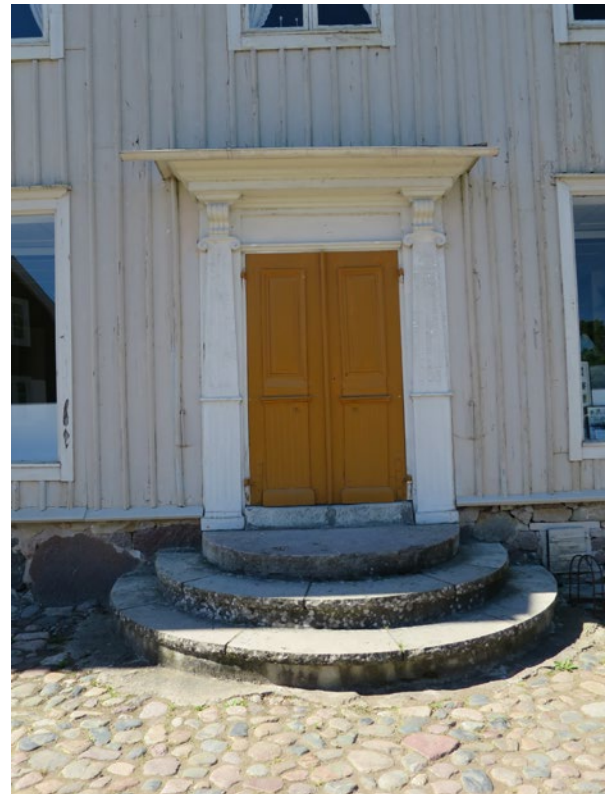
Hullgrensgården före åtgärd.