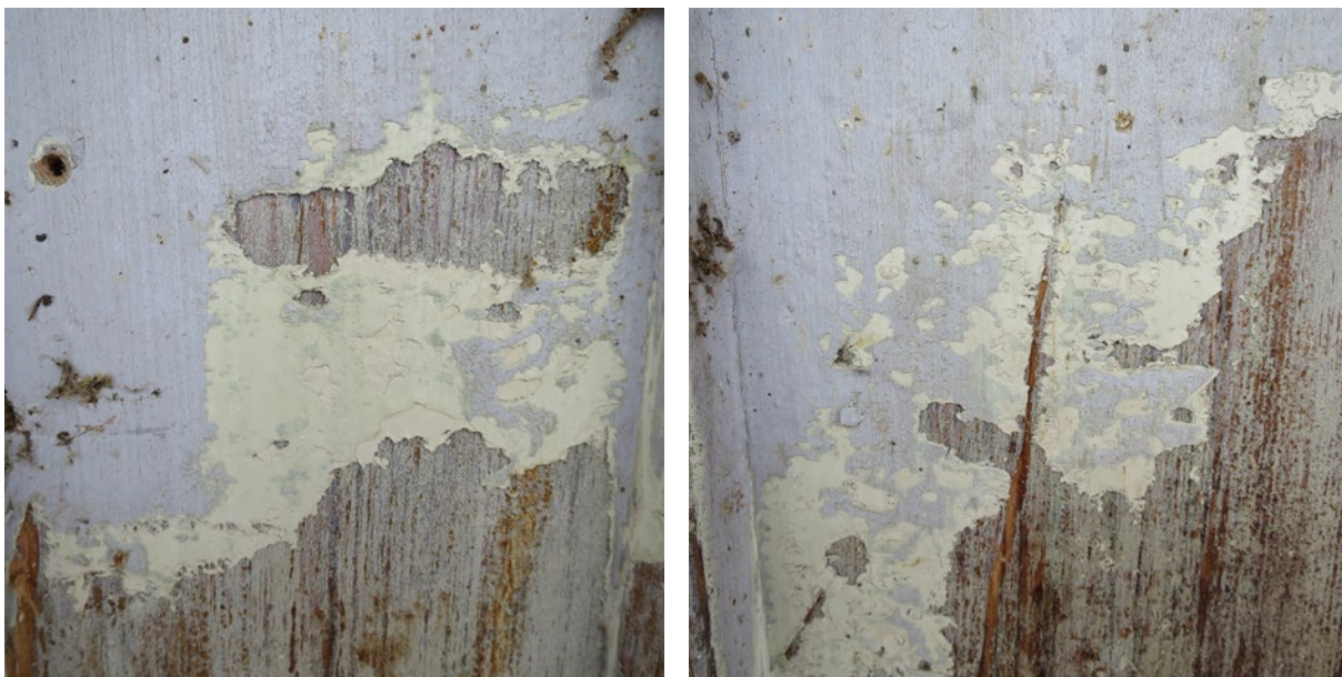
Harbergsgårdens färglager på fasadpanelen.