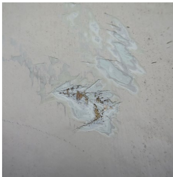
Hullgrensgårdens färglager på fasadpanelen.