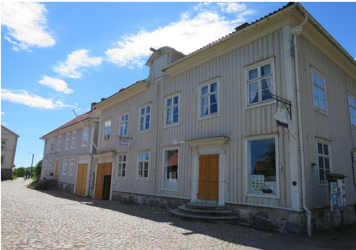
Fasader före åtgärd.