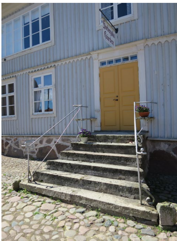
Harbergsgården före åtgärd

Omfattningar, listen mitt på Harbergsgårdens fasaden, takfot och knutar samt hängrännor och stuprör har målats i ljus bruten vit kulör, grön umbra S1002-Y.