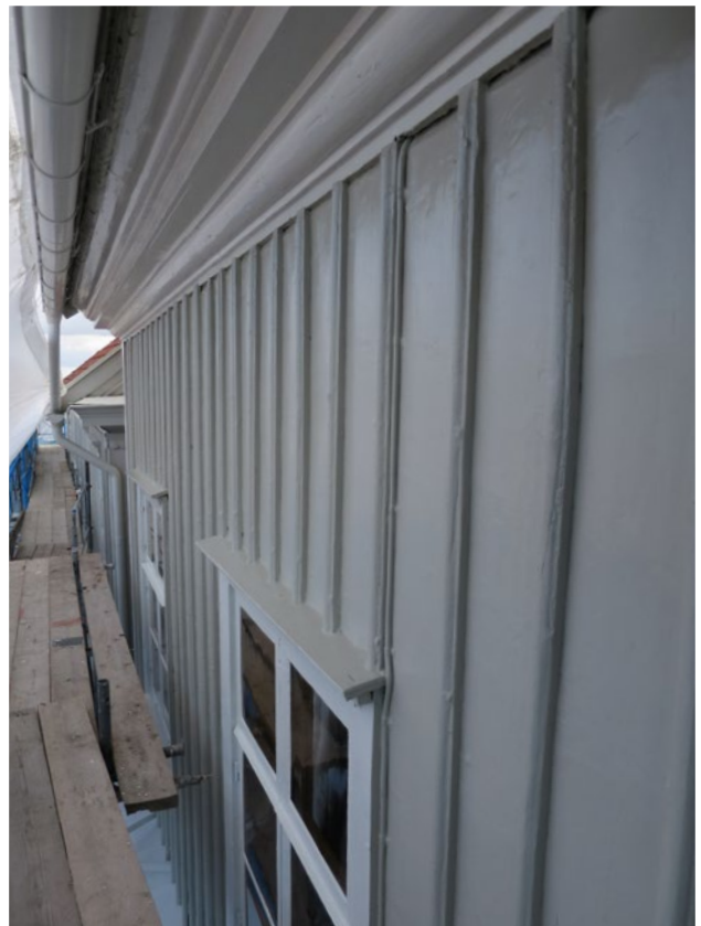
Hullgrensgården efter ommålning.