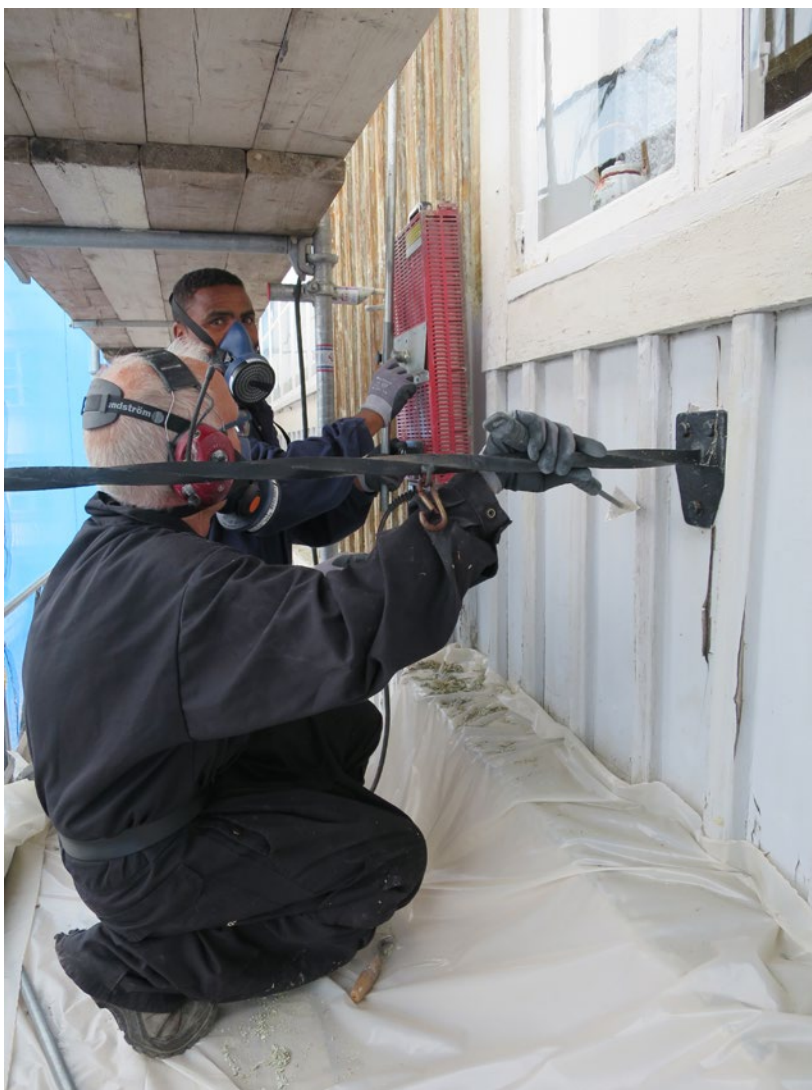
Borttagning av färg.