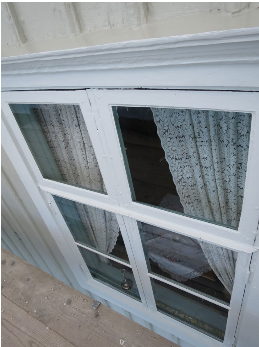
Ommålade fönsterbågar och fönsterkarmar på Hullgrensgården.