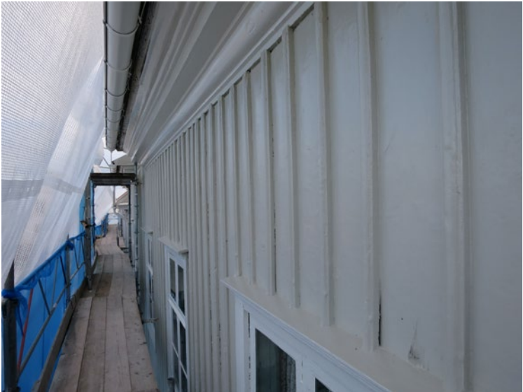
Hullgrensgården efter ommålning.