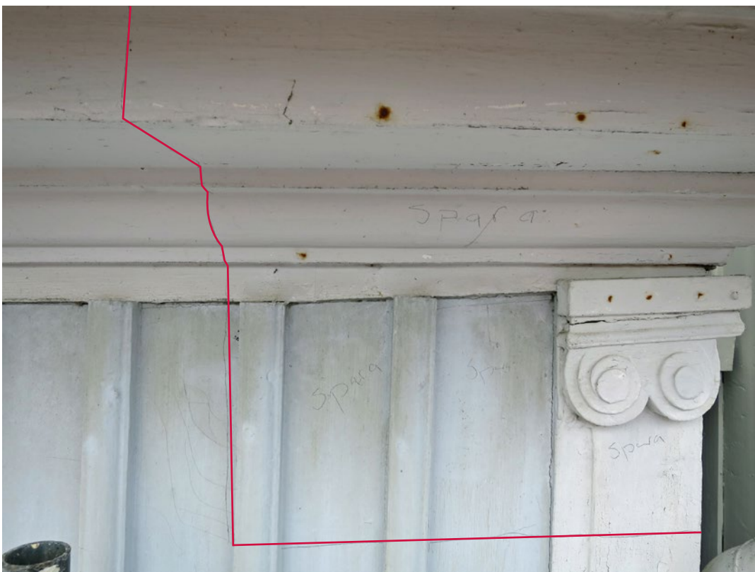
Referensyta på Hullgrensgården.