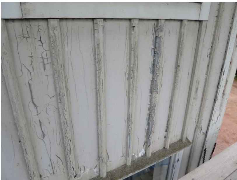
Hullgrensgården före åtgärd.