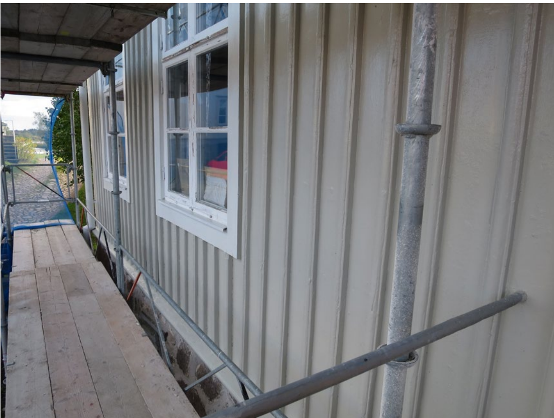
Harbergsgården efter ommålning.