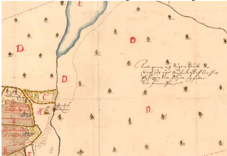
Undersökningsområdet ( utsnitt ) från en geometrisk avmätning år 1685.

En geometrisk avmätning från år 1685 visar det inventerade området som utmark till Hörestadhult. År 1799 är området fortfarande betesmark med något enstaka trädinslag.