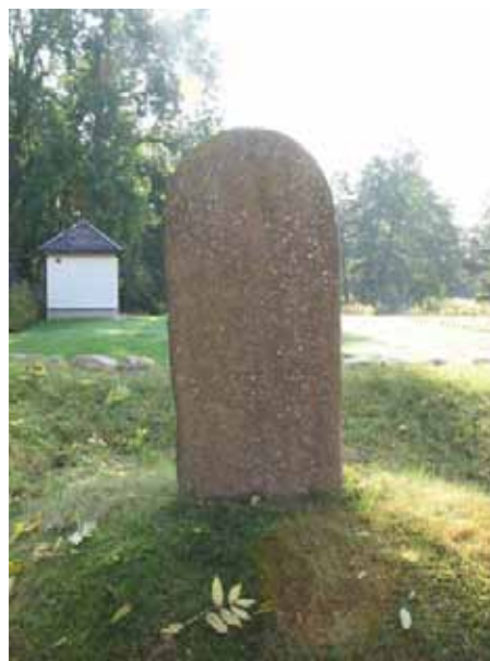
Gravvården rest över justitiekanslern, landshövdingen över Calmar län och Öland, ståthållaren och riddaren Claes Ulric Nerman död 1852. Vården står på en liten kulle (KI Hossmo kyrkog 055)