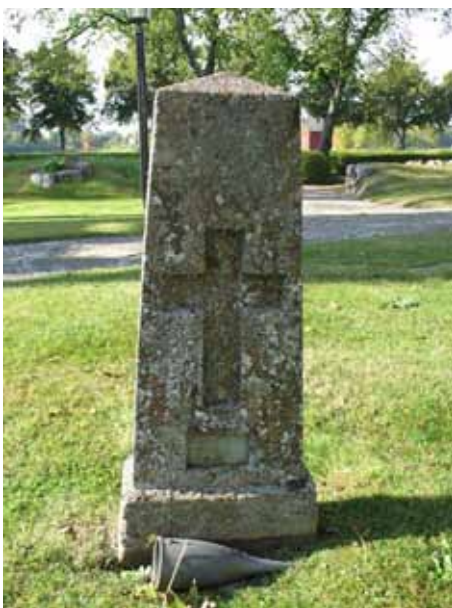
Vård med inhugget kors och glas (KI Hossmo kyrkog 043)