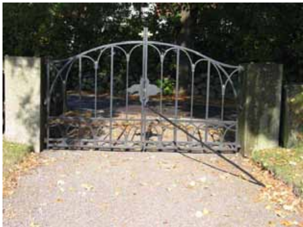
Gjutjärngrinden i norr in till Nya delen (KI Hossmo kyrkog 078)

Huvudingången är genom stigluckan i norr. På västra sidan om stigluckan finns det en trappa som leder in på kyrkogården över muren. Man kan se att den är gjord av gamla gravhällar. I det nordöstra hörnet av kyrkogården finns en liten trappa som leder över muren in på kyrkogården. Den skall enligt uppgift ha varit en trappa för prästen.