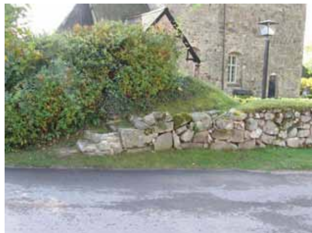
Trappan över kyrkogårdsmuren i nordöstra hörnet. (KI Hossmo kyrkog 029)