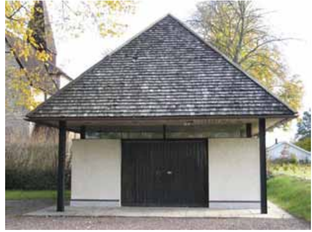
Bårhuset uppförd på Nya delen 1965. Ritat i samma stil som stigluckan (KI Hossmo kyrkog 105)