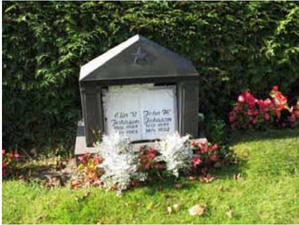
Gravvård i svart granit med bok i marmor. Rest på Nya delen 1965 (KI Hossmo kyrkog 014)