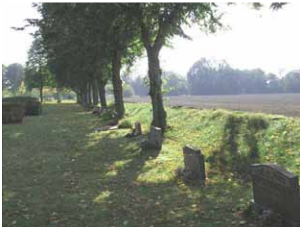
Familjegravar längs västra kyrkogårdsmuren på Nya delen (KI Hossmo kyrkog 020)