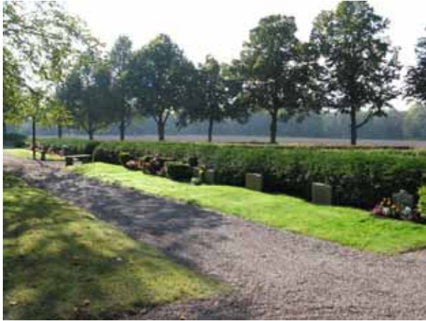
Översikt från nordost över Nya delen (KI Hossmo kyrkog 011)