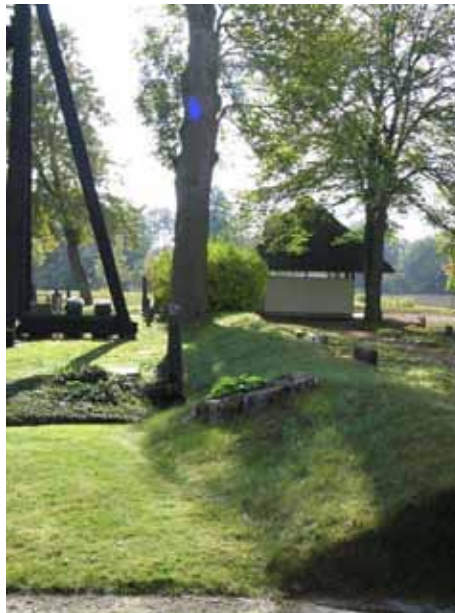
Gamla kyrkogårdsbegränsningen fick vara kvar vid utvidgningen 1927 (KI Hossmo kyrkog 033)