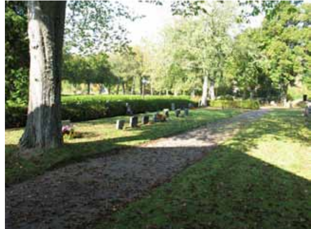
Översikt från sydost över Nya delen. Bevarade linjegravvårdar (KI Hossmo kyrkog 017)