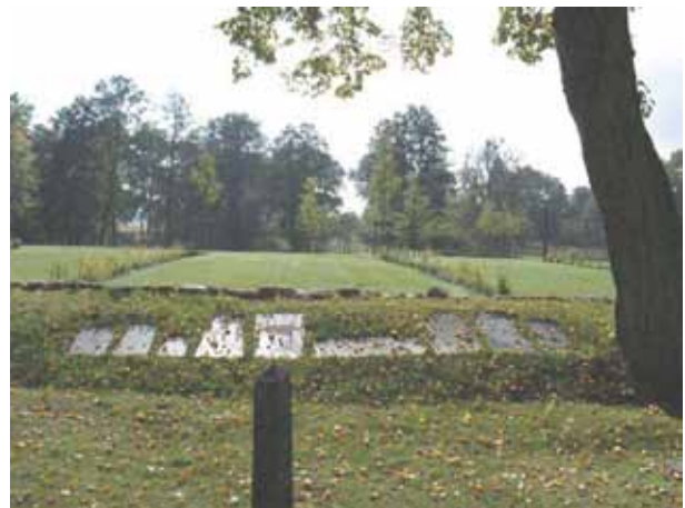
Vårdar tagna ur bruk har lagts på södra vallmuren (KI Hossmo kyrkog 034)

Väster om kyrkan står klockstapeln uppförd 1666. Konstruktionen är av trä och delvis spånklädd samt helt tjärad. På huvens fyra hörn sitter spiror med små flaggor av metall. Även