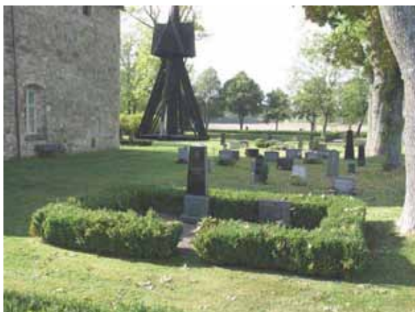
Översikt över norra sidan av kyrkan, Gamla delen. Foto från nordost (KI Hossmo kyrkog 040)

Gamla delen är naturligtvis den del av kyrkogården som ligger närmast kyrkan. Gravplatserna finns på alla sidor och rymmer ungefär 120 gravplatser. Området omgärdas av den gamla kyrkogårdsmuren i norr och öster. I väster finns den Nya delen och i söder finns den nya tillkomna delen, Södra delen. Den gamla vallmuren har sparats mellan den Gamla delen och de båda utvidgningarna. Vid en del gravplatser är det planterat tuja och buxbom intill gravvårdarna. Den Gamla delen skiljs i två hälfter av den kalkstensgång som leder från stigluckan till vapenhusets ingång. En gång av lagda kalkstensplattor följer längs långhusets norra sida fram till sakristian. Vårdarna är vända åt väster och öster. Klockstapeln är belägen väster om kyrkan intill den gamla mursträckningen.