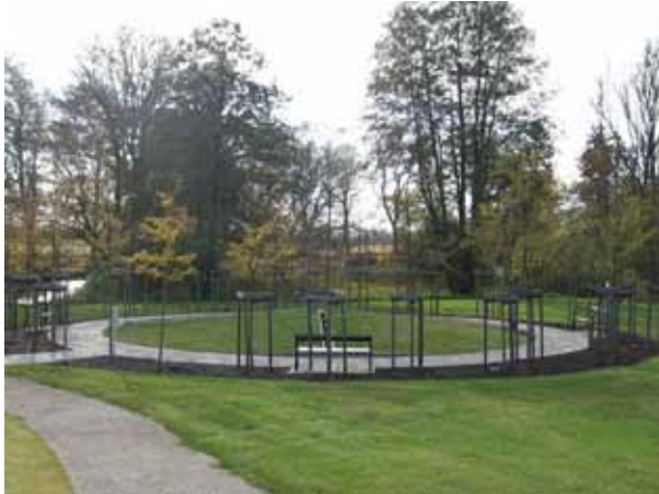
Minneslundan uppförd i samband med utvidgningen av Södra delen 2003 (KI Hossmo kyrkog 108)