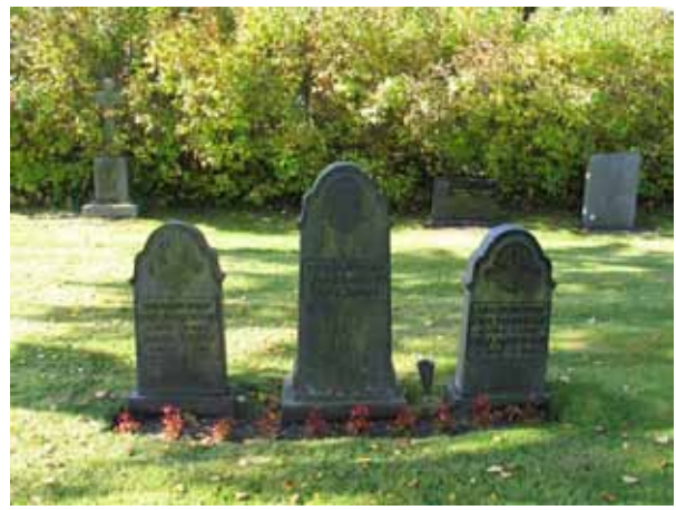
En familjegrav med tre likadana gravvårdar över tre smedmästare (KI Hossmo kyrkog 066)