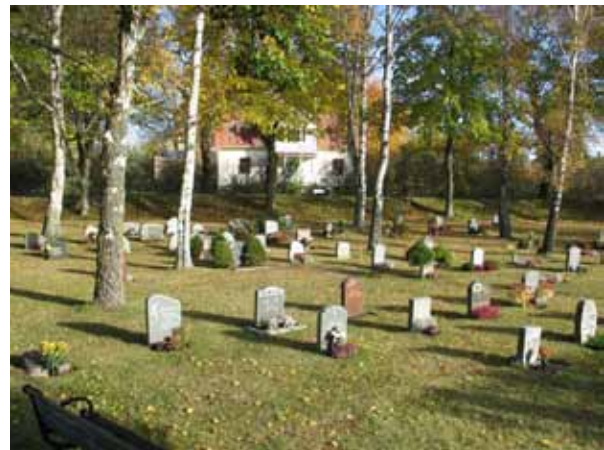
Översikt över urngravskvarteret, Nya delen (KI Hossmo kyrkog 087)