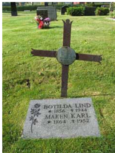
Två vårdar med samma inskription. Vården av sten har sannolikt kommit till senare (KI Hossmo kyrkog 047)