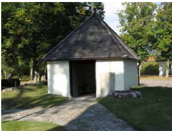
Stigluckan i norr. Uppförd 1639 (KI Hossmo kyrkog 073)

Kyrkogården består av Gamla delen, den äldsta delen runt om kyrkan. Öster om den Gamla delen tillkom 1927 den Nya delen och 2003 utvidgades kyrkogården med Södra delen. På södra delen finns en minneslund. På 1970-talet anlades ett urngravsområde i björkhagen på den Nya delen. Den Gamla delen rymmer naturligtvis de äldsta delarna av kyrkogården och vårdarna står inte strikt i raka rader utan strukturen har växt fram under en lång tid. Nya delen är stramt utformad med rygghäckar, jämna rader mellan raderna och inom kvarteren lika långa rader. På Södra delen har minneslundens tagits i bruk men inte området i övrigt. Övervägande delen av vårdarna är orienterade i öst-västlig riktning men det finns även de som är vända mot söder eller norr. En trädkrans av olika lövträd omger stora delar av kyrkogården. Mellan Gamla delen och de båda nyare är den gamla vallmuren bevarad.