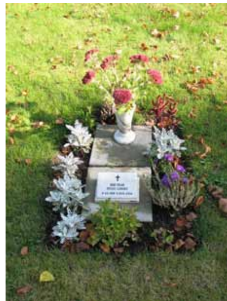
Modern enkel vård i marmor (KI Hossmo kyrkog 027)