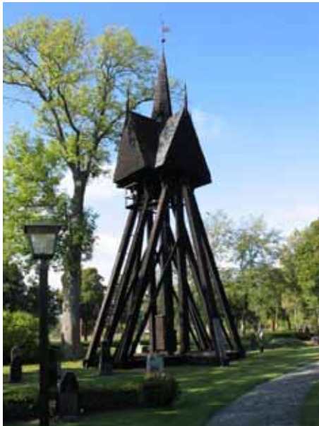
Klockstapeln i trä uppförd 1666 (KI Hossmo kyrkog 074)

En stiglucka leder in på den Gamla delen. Den är uppförd 1639 och vitkalkad. Taket är av tjärat träspån. Tidigare fanns det en ingång även i östra väggen.