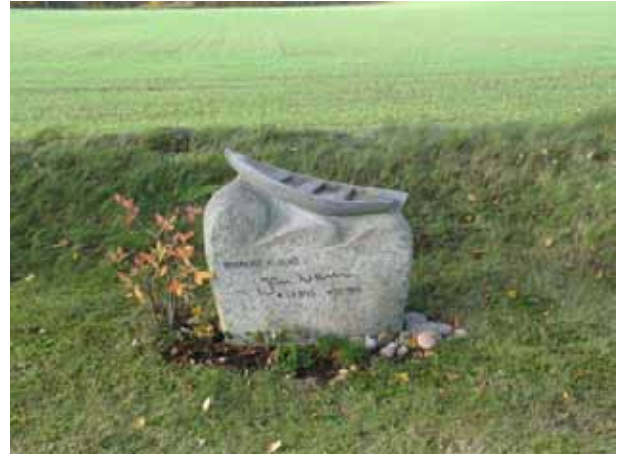
Skulptören Edwin Böck har gjort gravvården i med en båt längs upp (KI Hossmo kyrkog 102)