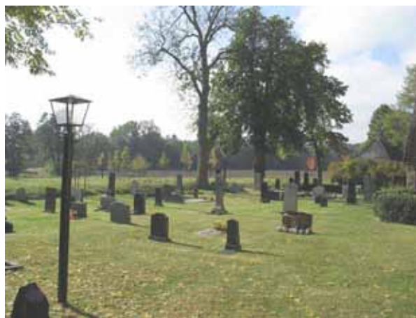
Översikt över södra sidan av kyrkan, Gamla delen. Foto från nordost (KI Hossmo kyrkog 053)