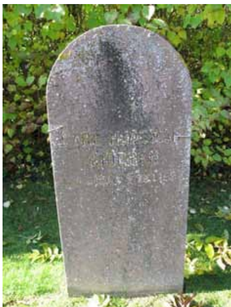
Områdets äldsta vård från 1833 rest över Carl Hjalmar Sjögren. (KI Hossmo kyrkog 067)

Precis intill kyrkväggen strax öster om vapenhuset är familjen Holmströms familjegrav. Gravplatsen omgärdas av en halvmeterhög buxbomshäck och innanför finns det murgrönskullar.