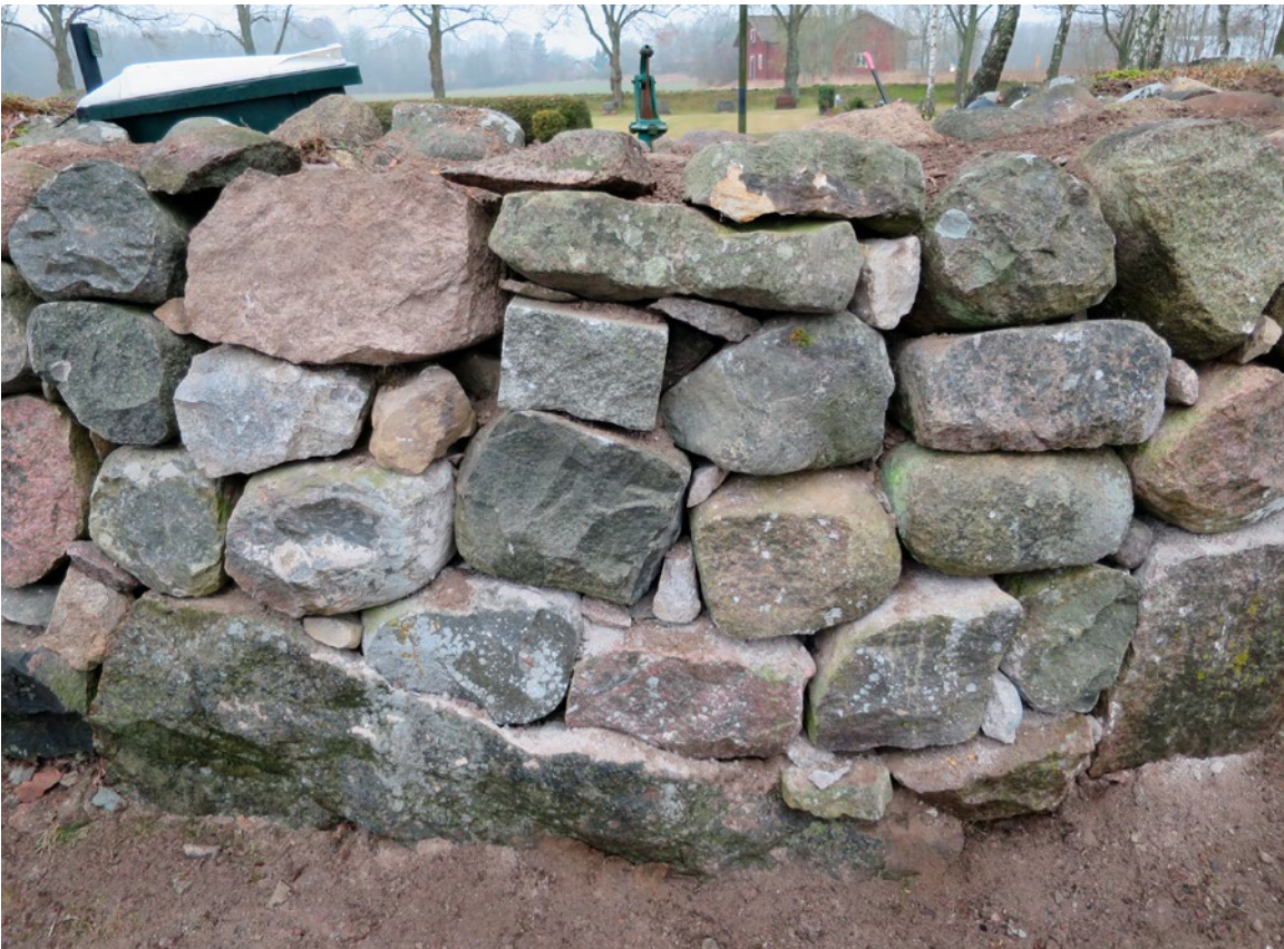
Det rundade partiet med skalmur efter restaurering/borttagning av dryckeshon.