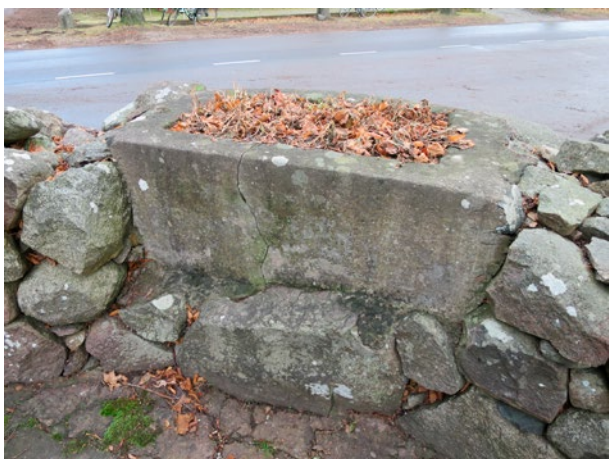
Dryckeshon, från kyrkogården.