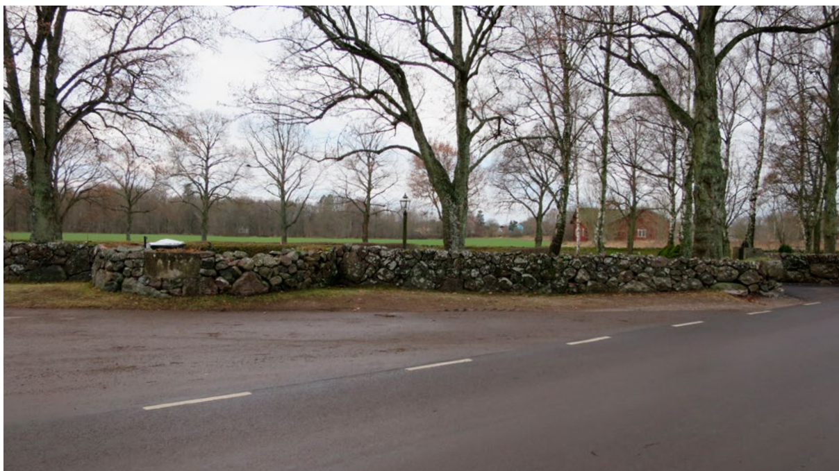
Kyrkogårdsmuren före restaurering.

sten av blandade format. Runt brunnen finns en kallmurad skalmur med två synliga sidor i en rundad form. Partiet har en kärnfyllning i mitten och kilsten. Här fanns en inmurad betonggjuten dryckesho. Murens stenmaterial är obearbetad och kluven fältsten av varierande storlek. Ostadigt parti med stora stenar på för små sten. Den nu aktuella delen av kyrkogårdsmuren var i dåligt skick med nedrasade partier.