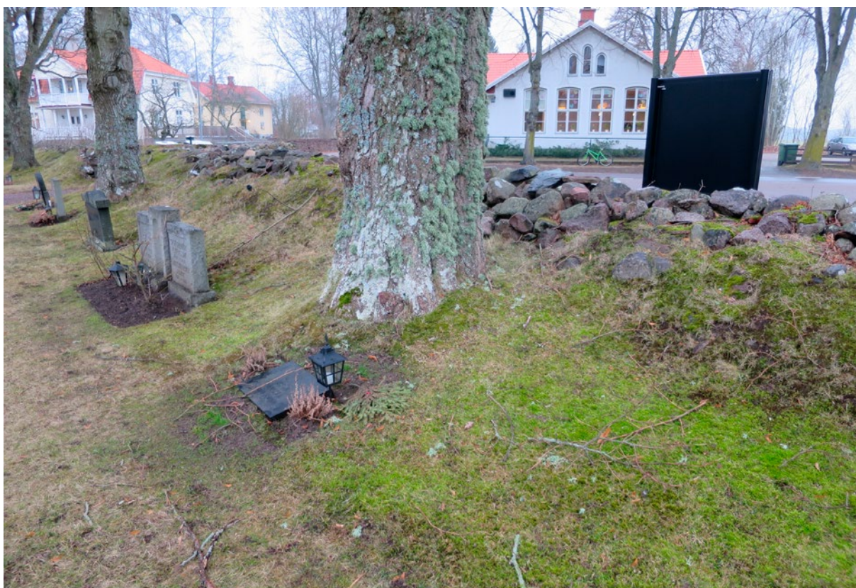
Kyrkogårdsmuren efter restaurering.