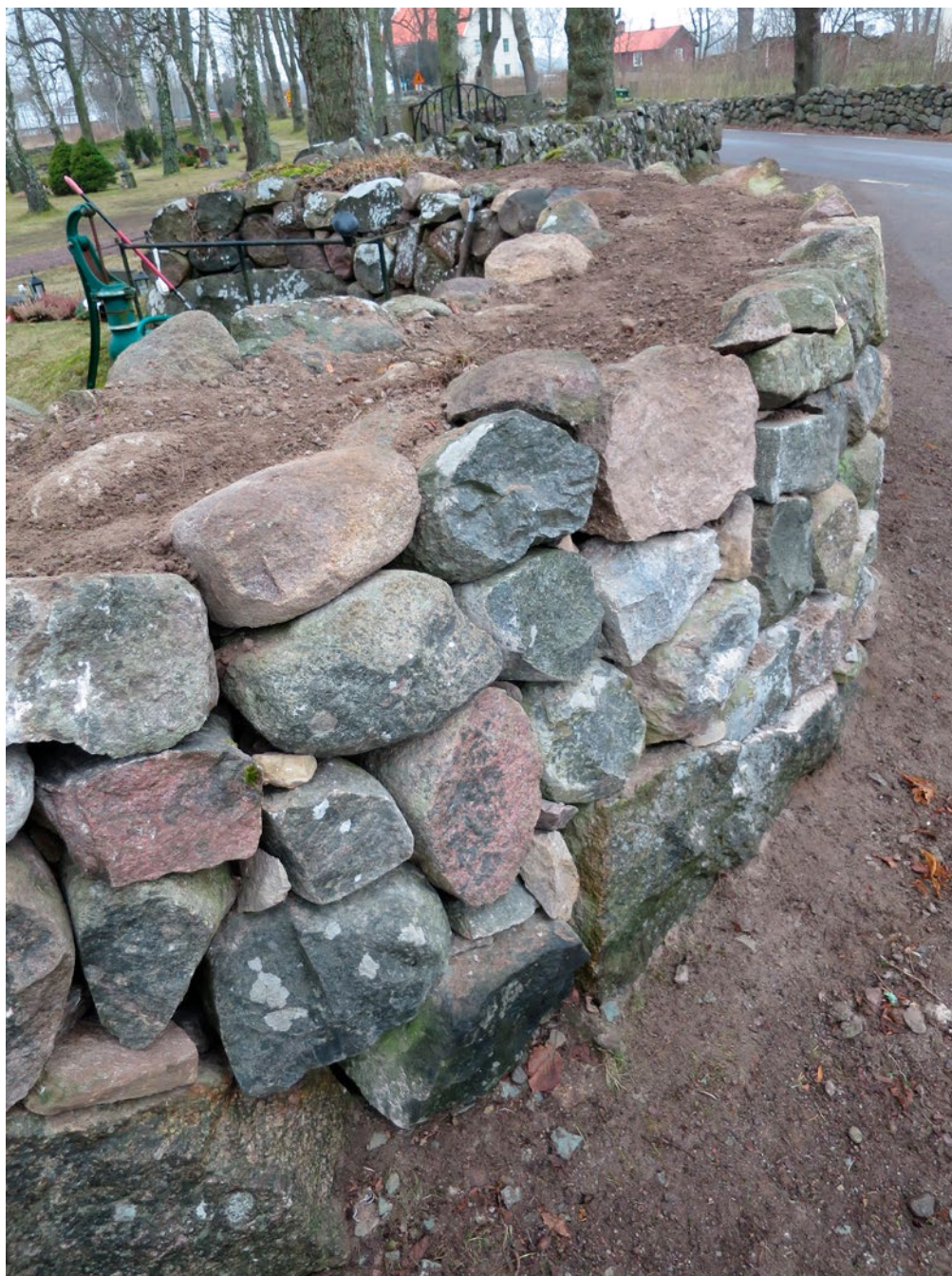
Det rundade partiet med skalmur efter restaurering/borttagning av dryckeshon.