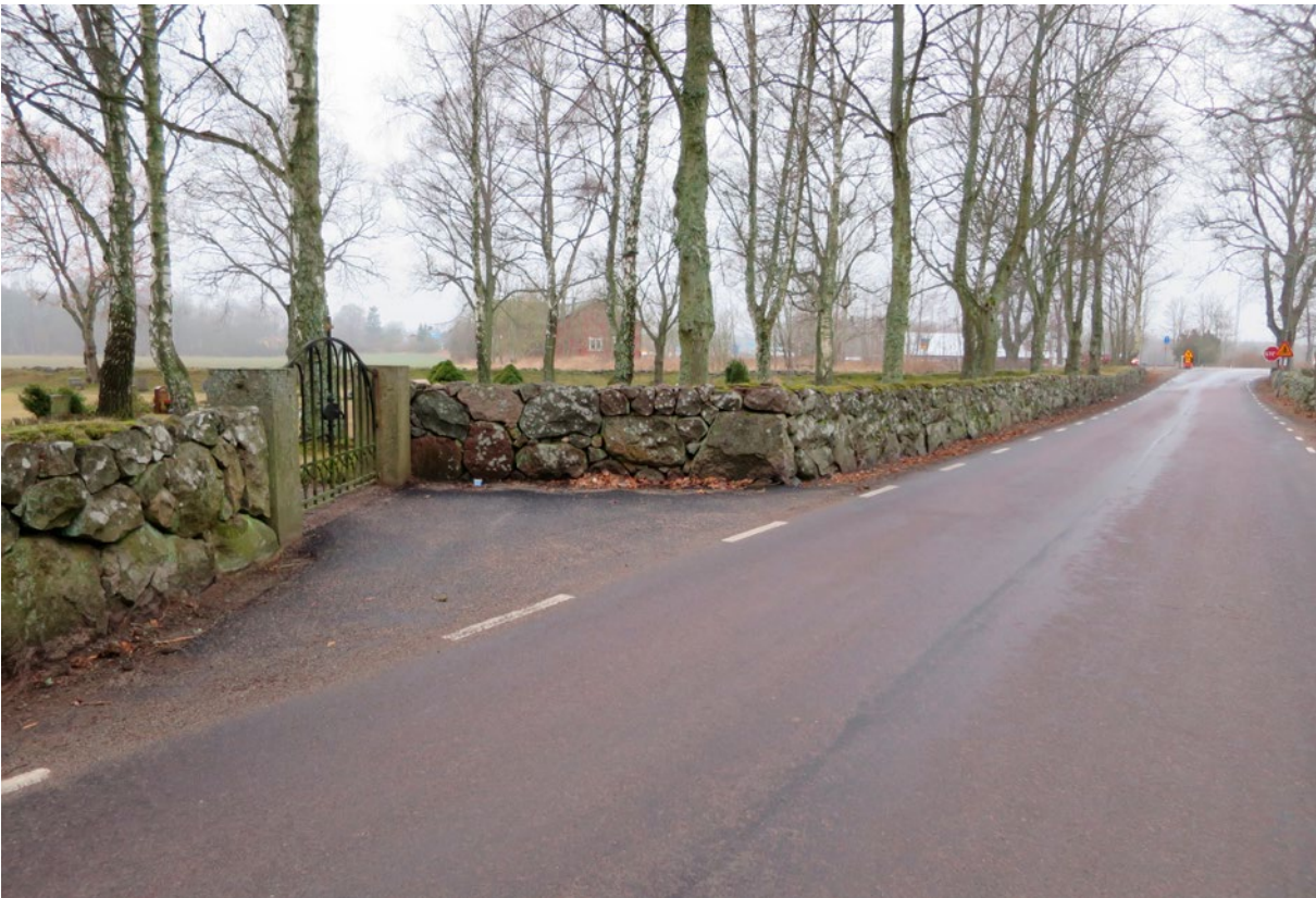
Kyrkogårdsmuren efter restaurering.