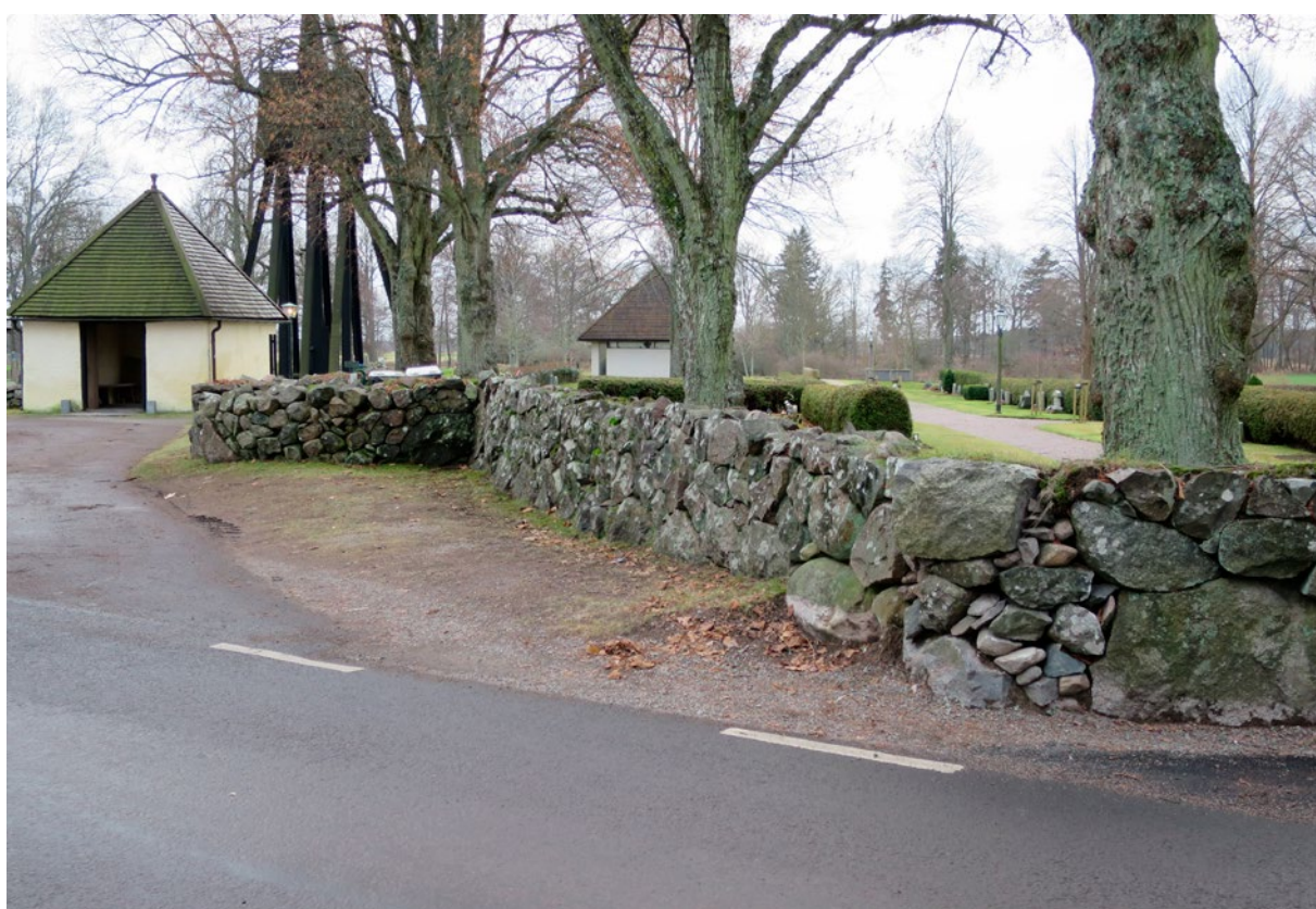
Kyrkogårdsmuren före restaurering.