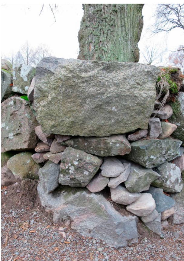
Hörn med ostadigt parti.