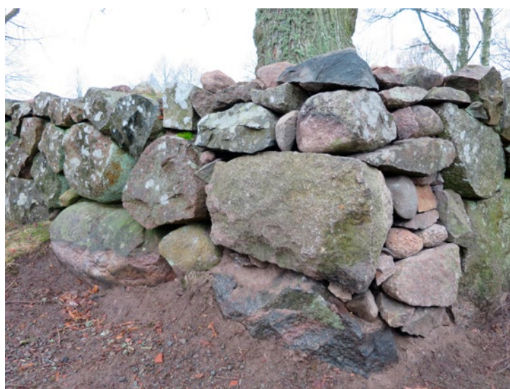
Hörn med ostadigt parti efter justering