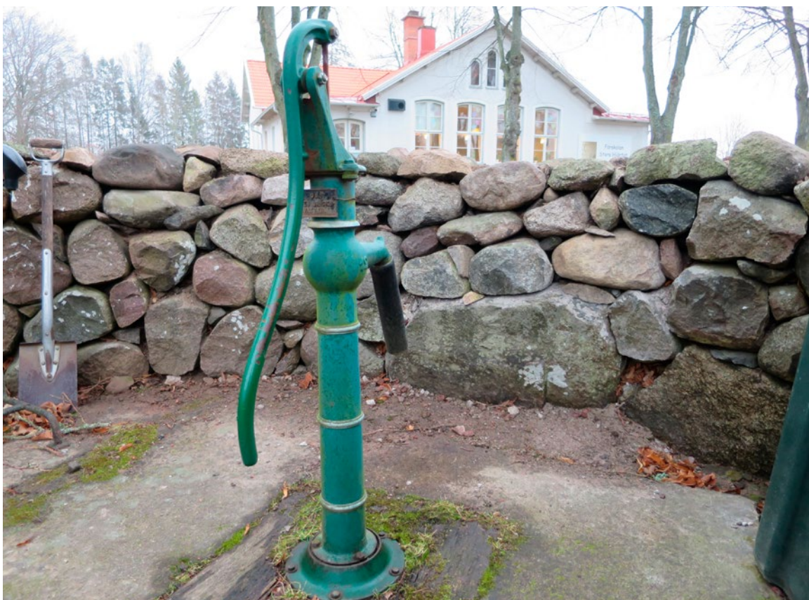
Det rundade partiet med skalmur efter restaurering/borttagning av dryckeshon.