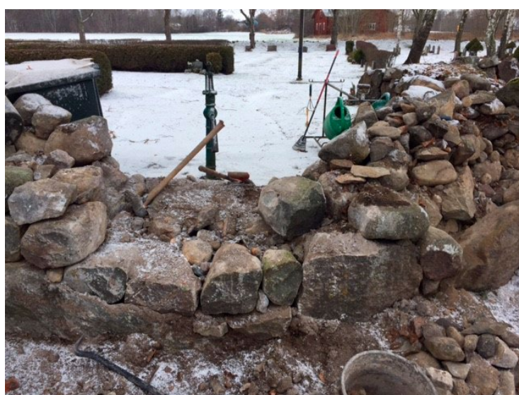
Rundat parti med skalmur under renovering, dryckeshon borttagen.