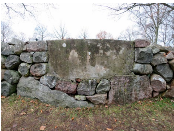
Dryckeshon, från vägen.