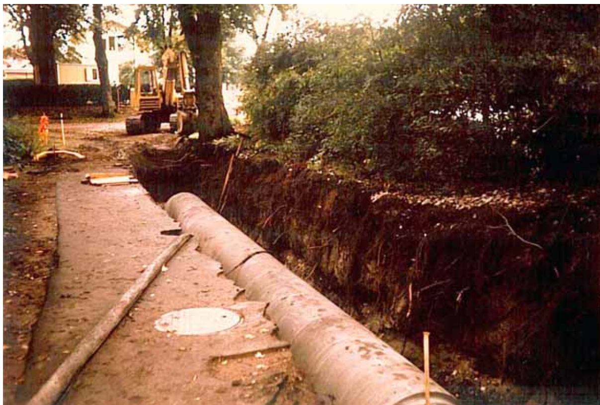
Nordligaste delen av Stadsparken.