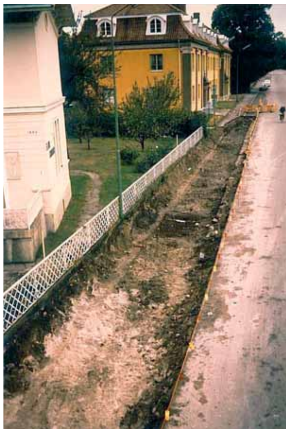
Järnvägsgatan avbanad.

Utifrån fotografier och spridda fältanteckningar går det att konstatera att det vid Järnvägsgatan i väst påträffades en cementserad mur under vägen. Det är mest sannolikt att denna fungerar som ett förstärkningsfundament åt den tungt trafikerade vägen till och från Tjärhovet. På baksidan av ett fotografi som föreställer muren finns angivet att ett ”stolphål” skall finnas intill.