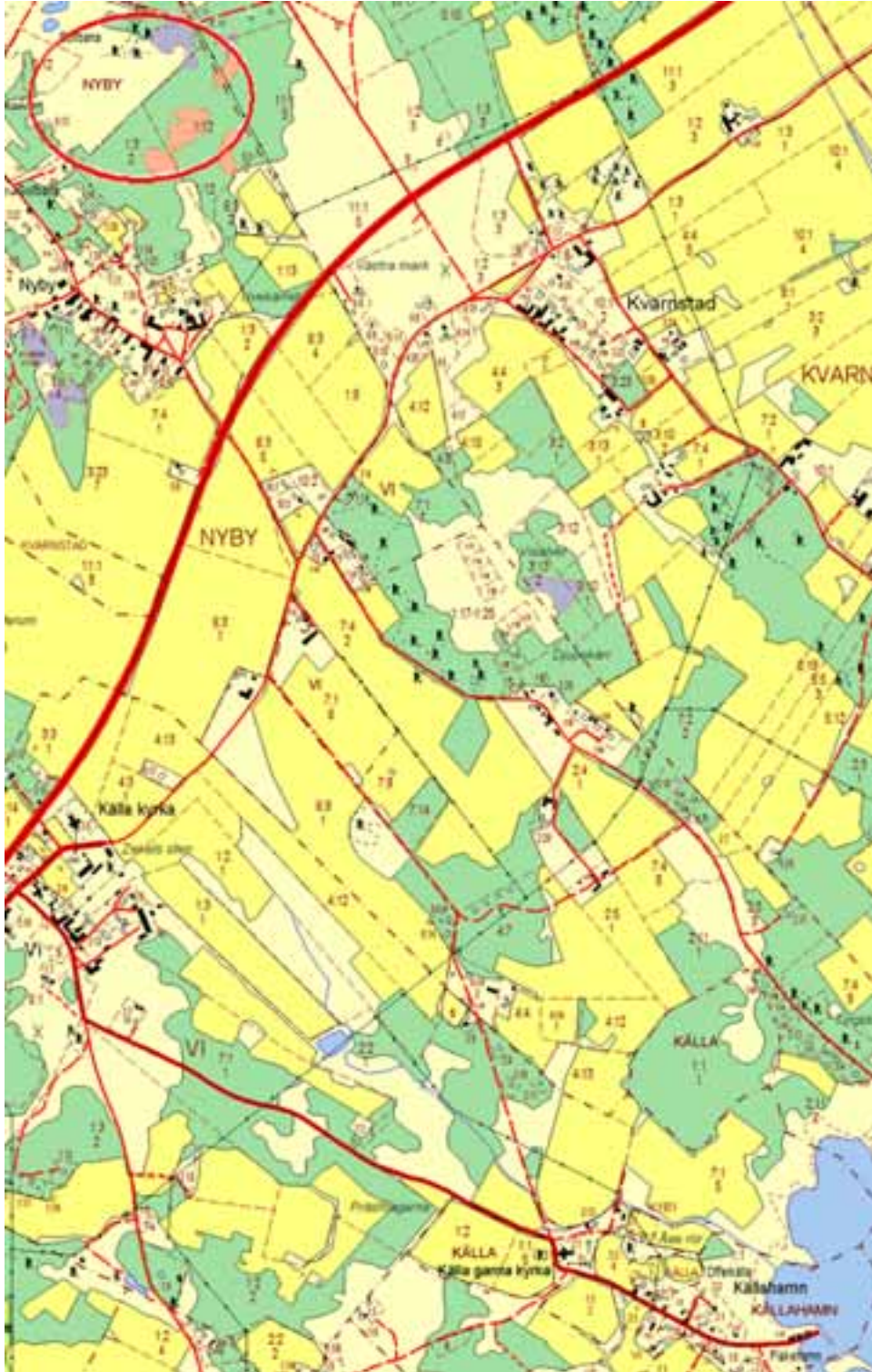
Fig. 1. Fastighetskartan med det aktuella undersökningsområdet markerat med röd cirkel. Allmänt kartmaterial från lantmäteriverket. Medgivande 507-98-2848.