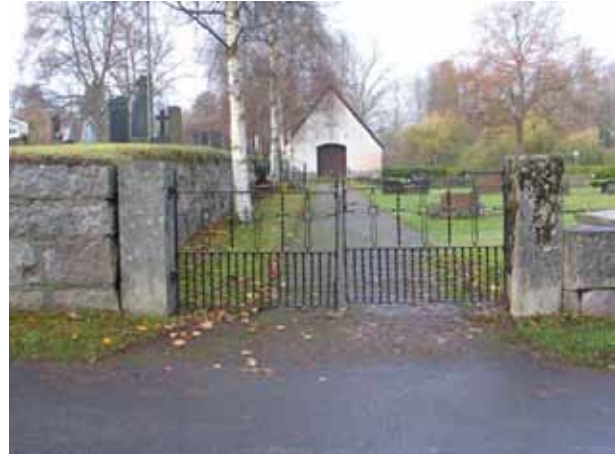
Ingång till den på 1930-talet utvidgade delen i norr med bårhuset i fonen. (KI Karlslunda kyrkog 025)