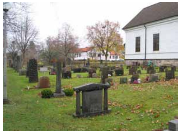
Kvarter II mot sydost. I raden längst till väster syns lite mer påkostade stenar och i mitten en tydligt lägre profil. (KI Karlslunda kyrkog 062)