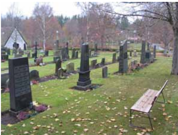
Kvarter II mot nordväst. Notera de äldre, höga gravvårdarna i kvarterets första rad mot öster. (KI Karlslunda kyrkog 058)

Kvarter II ligger längs kyrkans norra långsida och rymmer omkring 300 gravplatser. Kvarteret avgränsas av kyrkogårdsmur i öster och väster. I norr finns gamla kyrkogårdsmuren som numera ligger mellan den gamla kyrkogården och den utvidgade delen, kvarter III. Inga grusgångar finns i eller kring kvarteret. På det gräsbevuxna området är gravvårdar placerade i rader. Längs ytterkanten i öster, norr och väster finns en enkel rad med vårdar som är anlagd som en "ram" kring det inre området. Här är alla vårdar vända mot öster. Innanför "ramen" finns ryggställda rader, där varannan rad har vårdar vända mot öster och varannan mot väster. I dessa sammanlagt sju rader står gravstenarna i jordremсор. På gravkartan syns att här tidigare funnits rygghäckar mellan de ryggställda raderna. I den yttre ramen av gravvårdar finns påfallande många höga, äldre gravvårdar från 1900-talets början, medan profilen mestadels är lägre i kvarterets mitt. Framförallt gäller det i den västra hälften. I kvarterets mitt finns rester av linjegravssystem från 1920-40 talen, men det finns också enstaka äldre gravvårdar.