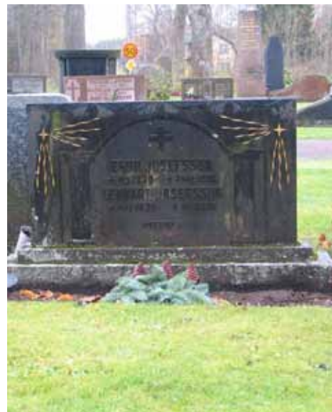
Exempel på en relativt vanlig typ av gravsten, rektangulär och med klassicerande dekor. Denna är från 1930-talet. (KI Karlslunda kyrkog 037)