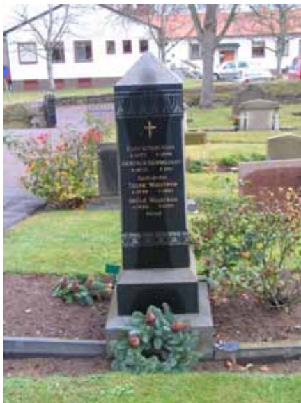
En utmärkande gravsten med vacker dekor. Daterad till 1869, men stenen kan möjligen vara från 1910-talet. (KI Karlslunda kyrkog 038)