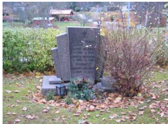
En solfjädersliknande form på en gravvård från 1940-talet. KI Karlslunda kyrkog 097)