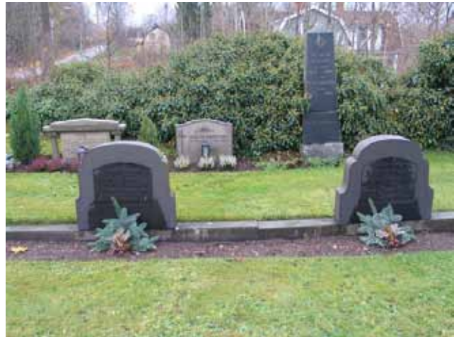
Två smedsmästare från samma familj, familjen Berg, begravda 1925 respektive 1933. De låga stenramarna som vårdarna är fästa i berättar att hela gravplatsen tidigare varit omgärdad av stenramar och belagd med grus. KI Karlslunda kyrkog 053