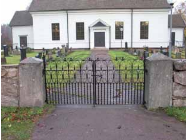
Ingång i söder. Ena grindstolpen märkt 1871. (KI Karlslunda kyrkog 009)