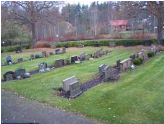
Den västra hälften av kvarter III. Bild mot nordväst. Rader av relativt låga gravvårdar, mestadels linjegravvårdar. (KI Karlslunda kyrkog 092)

platserna i kvarteret. Elof Nilsson var lantbrukare i Känagärde. En annan gravvård med en speciell form är en solfjäderslik sten av grå granit med inskription gjord i brons. Denna är från 1940-talet. Linjegravvårdarna är mestadels tydligt mindre än familjegravvårdarna och kan följas i tidsordning från 1947-62. Många av vårdarna bär klassicerande drag. I kvarteret finns nästan uteslutande gravvårdar från 1930-60-talet. Titlar anges i detta kvarter mycket sällan på gravvårdarna. De som förekommer är konditor, fabrikör och sjöman (2). Gårds- eller bynamn anges dock på merparten av vårdarna.