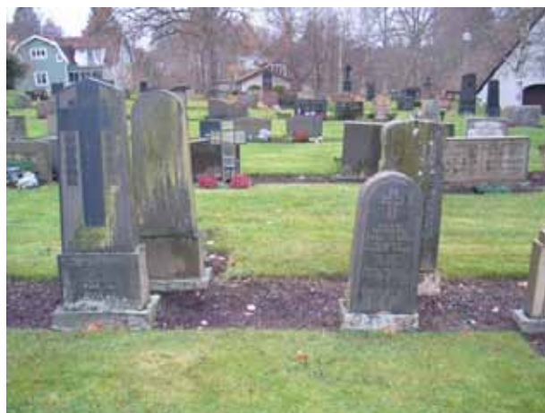
Några av de lite högre, äldre gravvårdarna inne i kvarteret. Till väster är vården över en kantor (oläsligt namn) d. 1928 och till höger syns vården över kyrkovärden P. Olsson med maka d. 1908 ( KI Karlslunda kyrkog 078)