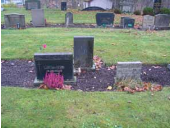
Små linjegravvårdar i kvarter II från 1941. (KI Karlslunda kyrkog 084)