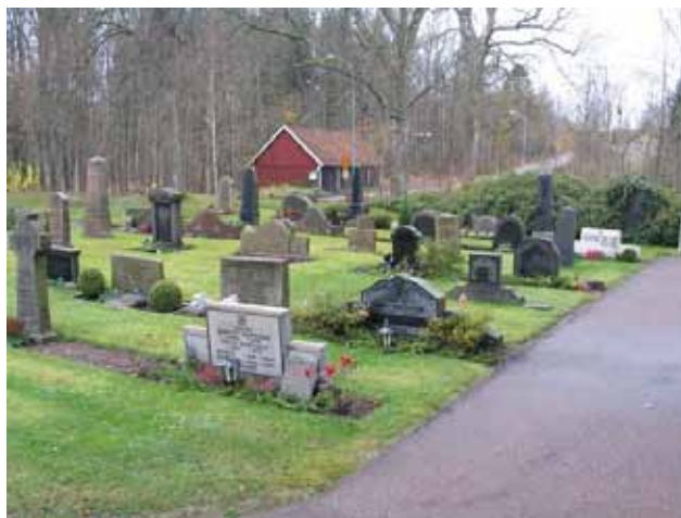
Den västra hälften av kvarter I med olika typer av vårdar. På bilden syns några av de riktigt breda gravvårdarna, typiska för 1940-50-talet. I fonden syns de gamla kyrkstallarna. (KI Karlslunda kyrkog 040)