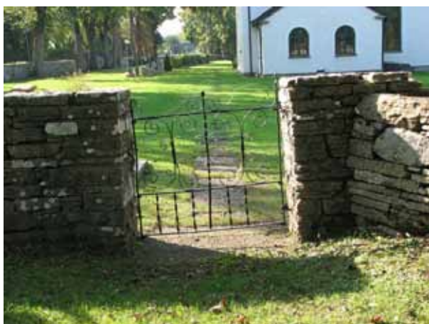
Ingången i norr är en enkel smides grind (KI Kastlösa kyrkog 015)

Längst i norr på den östra muren är en modern svartmålad järngrind. Man har bara tagit upp en ingång i muren och det saknas portstolpar. Även här leder fyra trappsteg ner från nivån där landsvägen går.