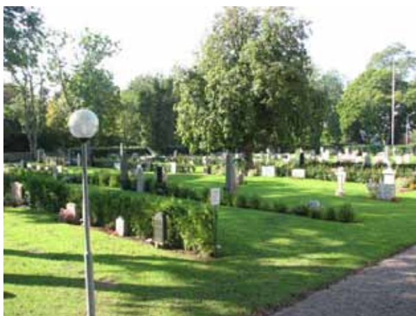
Översikt överkvarter A och D från nordost (KI Kastlösa kyrkog 031)

Kvarter A-D omfattar området söder om kyrkan där kvarter B och C ligger längs murarna i öster respektive söder. Området delas i två delar av den gräsyta där en tidigare grusgång gick, i nord- sydlig riktning, från den södra ingången fram till kyrkan. Området omgärdas i öster, söder och väster av kallmurade kyrkogårdsmuren och i norr finns kyrkan. Den södra delen av kyrkogården rymmer ca 500 gravplatser. Generellt är det de höga resta vårdarna som ger området dess karaktär. Alla gravvårdarna står i rader vända mot öster, norr eller väster. Vissa rader av vårdar är ryggställda mot tuja, ölandstok eller häckoxbär. Hela området är insått med gräs och inga spår efter de tidigare så vanliga omgärdningarna finns i området. Intill brunnen i kvarter A är en kastanj planterad.