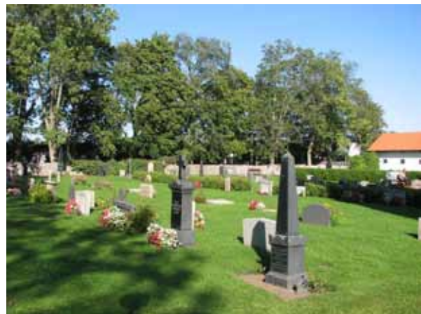
Kvarter F med kvarter D i bakgrunden från sydväst (KI Kastlösa kyrkog 123)