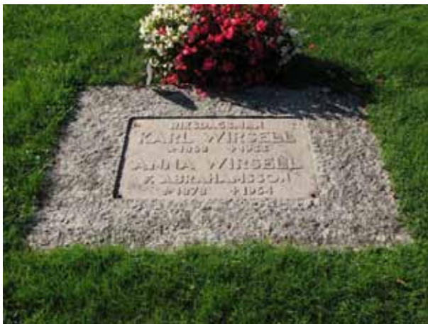
Liggande kalkstensvård över riksdagsman Karl Wirsell (KI Kastlösa kyrkog 132)