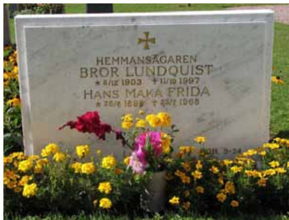
Marmorvård från 1968 (KI Kastlösa kyrkog 079)