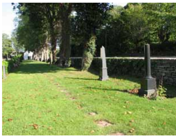
Översikt över kvarter B från söder (KI Kastlösa kyrkog 059)