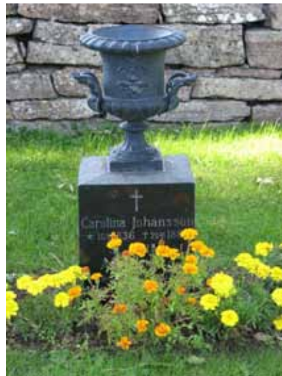
Gjutjärnsurna på granitsockel från 1880-talet (KI Kastlösa kyrkog 122)