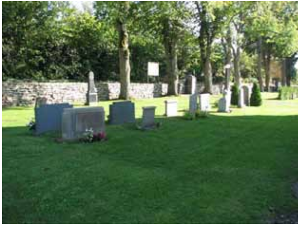
Kvarter H öster om kyrkan från norr (KI Kastlösa kyrkog 150)