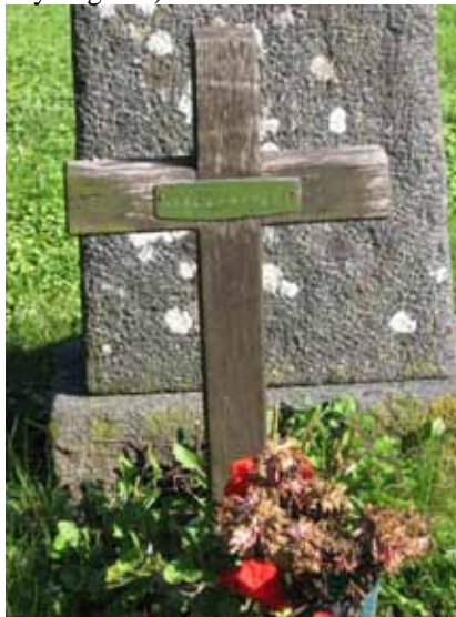
En enkel trävård med kopparplatta. (KI Kastlösa kyrkog 137)

Yrkestitlar förekommer på mindre än hälften av gravvårdarna i kvarteren. Den vanligaste titeln är lantbrukaren. Övriga som förekommer är handlanden, kyrkovärden, hemmansägaren, direktören, ingenjören, kyrkoherden, kontraktsprosten, nämndemannen, smedsmästaren, kronolänsmannen, båtsmannen, rättsaren, riksdagsmannen, häradsslagare, tapetserare, sjökaptenen, styrmannen, prostens, kaptenen, läraren, kantorn, lärarinnan och kronofogden. Den dödes hemort anges på majoriteten av gravvårdarna.