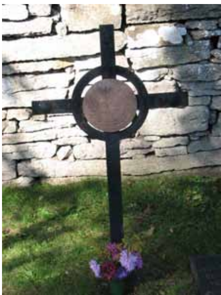
En järnvård med textplatta av kalksten från 1925 (KI Kastlösa kyrkog 146)