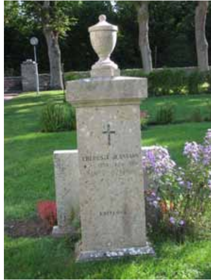
Kakstensvård med urna rest 1928 (KI Kastlösa kyrkog 042)