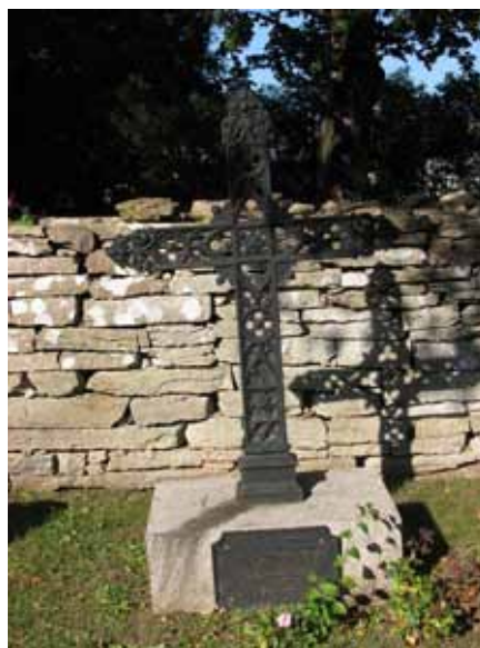
Ett genombrutet gjutjärnskors med texten på en gjutjärnsplatta på stensockeln, från 1864 (KI Kastlösa kyrkog 145)