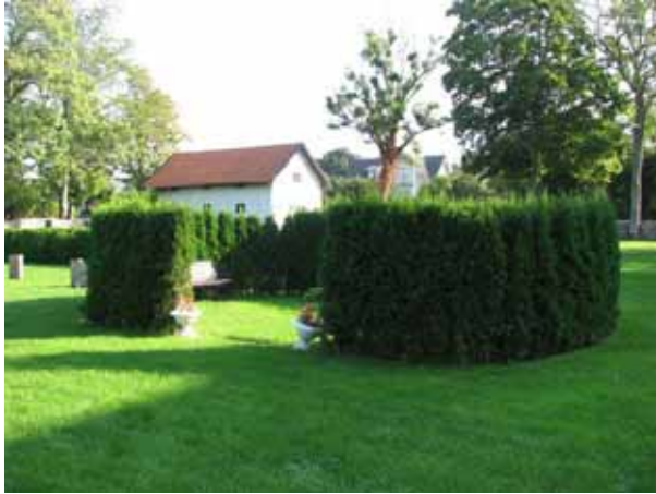
Minneslund invigd 2000 (KI Kastlösa kyrkog 028)

Minneslundan invigdes 2000 och är anlagd på den norra sidan av kyrkan. Den avgränsas av en cirkelformad häck av tuja med en öppning i väster. Från början hade den en öppning på var sida åt norr och söder, med det planterades igen för att få ett mer slutet rum. I den östra delen av lunden finns en plantering och ett äldre kalkstenskors. Framför planteringen är också ett ställ för blomvaser. Till vänster står en bänk där man kan sitta ner.