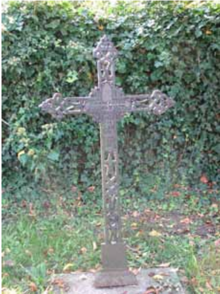
Genombrutet gjutjärnskors rest 1859 kv C (KI Kastlösa kyrkog 065)

majestätiska flottan och riddare av svärdsorden, Ölands båtskompani. På övervägande delen av vårdarna nämns den dödes hemort.