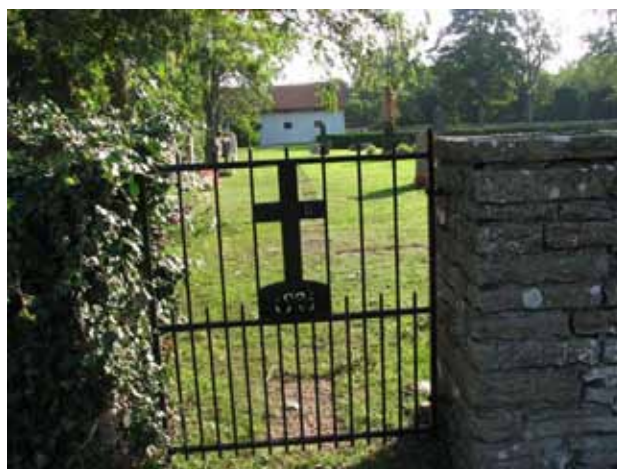
Grind från 1926 i det nordvästra hörnet (KI Kastlösa kyrkog 021)