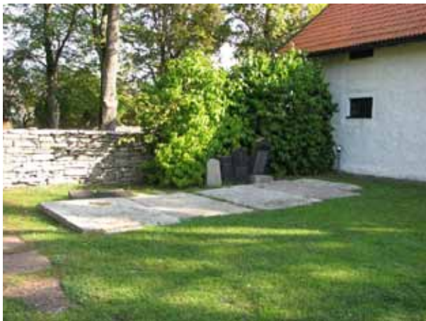
Äldre vårdar och hällar förvaras intill materialboden i nordost (KI Kastlösa kyrkog 023)

I det nordöstra hörnet som en del av kyrkogårdsmuren ligger en äldre materialbod, uppförd omkring 1805, med vitputsade fasader och tegeltak. Huset har under en period använts som bårhus men nu är det endast förråd.