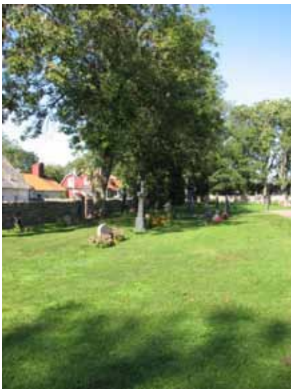
Kvarter E längs den västra muren från söder (KI Kastlösa kyrkog 100)

Kvarteren E-H är belägna väster, norr och öster om kyrkan och består enligt gravkartan av drygt 300 gravplatser. Området avgränsas i söder av kyrkan och i alla andra väderstreck av kyrkogårdsmuren. I det nordöstra hörnet finns den gamla materialboden. Precis norr om kyrkan är minneslundan. Alla gravvårdarna står i rader i gräsmatta och en del står mot rygghäckar av tuja. Vårdarna är vända åt öster, väster, eller söder.