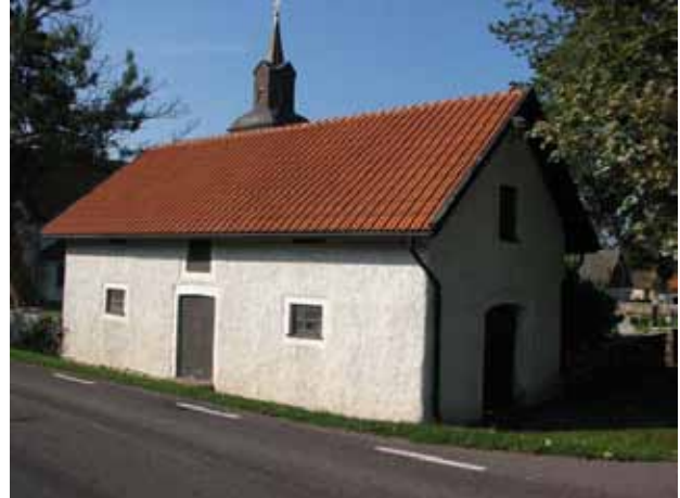
Materialbod i det nordöstra hörnet (KI Kastlösa kyrkog 014)