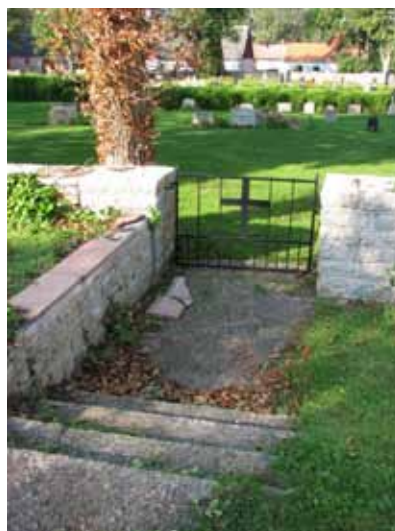
Modernare grind i öster (KI Kastlösa kyrkog 013)