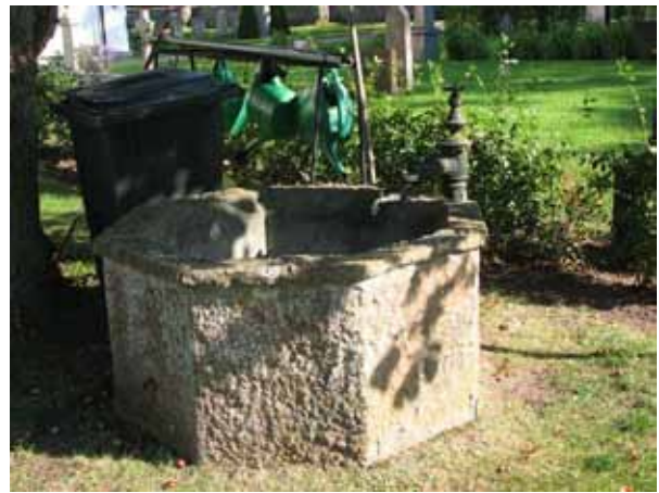
En brunn av kalksten finns i kvarter A (KI Kastlösa kyrkog 036)