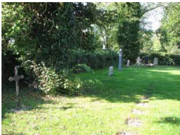
Översikt över kv C från öster (KI Kastlösa kyrkog 063)