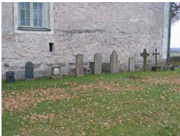
Äldre vårdar tagna ur bruk står uppställda längs norra långhusväggen (KI Kläckeberga kyrkog 078)

Äldre gravvårdar som tagits ur bruk har ställts upp intill norra långhusväggen.