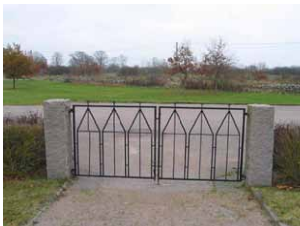
Norra ingången till nya kyrkogården (KI Kläckeberga kyrkog 146)