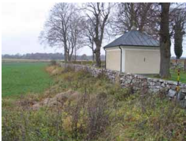
Kyrkogårdsmuren i söder. Innanför muren syns det Jegerhjemska gravkoret (KI Käckberga kyrkog 048)

Se vidare i de enskilda kvartersbeskrivningarna.