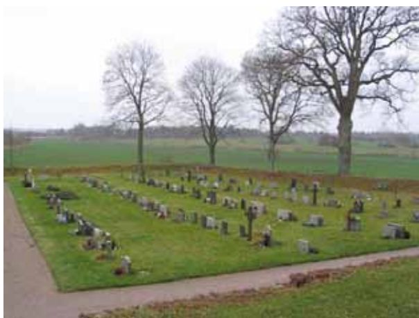
Översikt över kvarteret Skansen från nordost (KI Kläckeberga kyrkog 007)

Kvarteren Skansen, Klockstapeln och Kyrkan ligger runt om kyrkan på den gamla kyrkogården. Kvarteren rymmer 328, 164 respektive cirka 180 gravplatser. Kvarteren avgränsas i ytterkanterna av kyrkogårdsmuren och mellan kvarteren är grusade raka gångar. I kvarteren finns gravvårdar från mitten av 1800-talet och fram till 2000-talet. Höga, stående, mer påkostade gravvårdar finns närmast koret. Ett gravkor och två större familjegravar med omgärdning finns i kvarteren. Gravvårdarna står i rader och en del är ryggställda utan rygghäckar. Vårdarna är vända mot öster, väster och norr. Området är gräsbesätt.