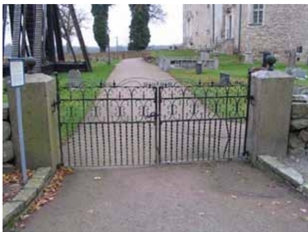
Ingång till gamla kyrkogården. Svartmålad smidesgrind (KI Kläckeberga kyrkog 049)