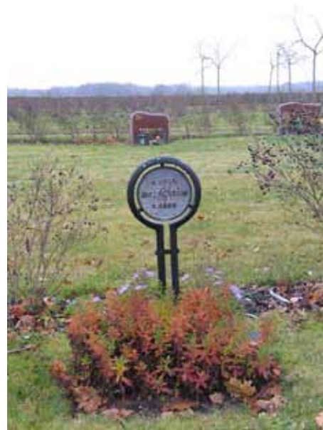
Ovanlig form på gravvård i järn (KI Kläckeberga kyrkog 145)