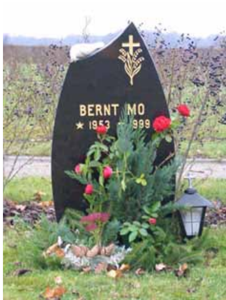
Modern gravvård i svart granit (KI Kläckeberga kyrkog 144)

Merparten av vårdarna i området är medelstora och stående. Materialet är övervägande av grå granit men även svart och röd förekommer. Naturstenar förekommer i några få fall. Här finns även tre kors av kopparplåt samt en vård i järn. Första gravplatsen togs i bruk 1985. Inte på någon vård anges den dödes titel och endast på två gravvårdar nämns hemorten.