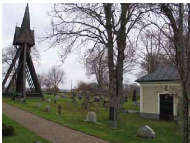
Översikt över kvarteret Klockstapeln från sydost (KI Kläckeberga kyrkog 052)