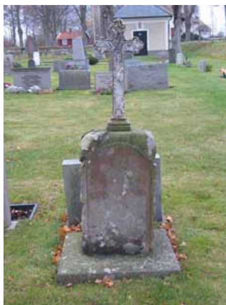
En gravvård i kalksten med ett litet gjutjärnskors från slutet av 1800-talet (KI Kläckeberga kyrkog 014)