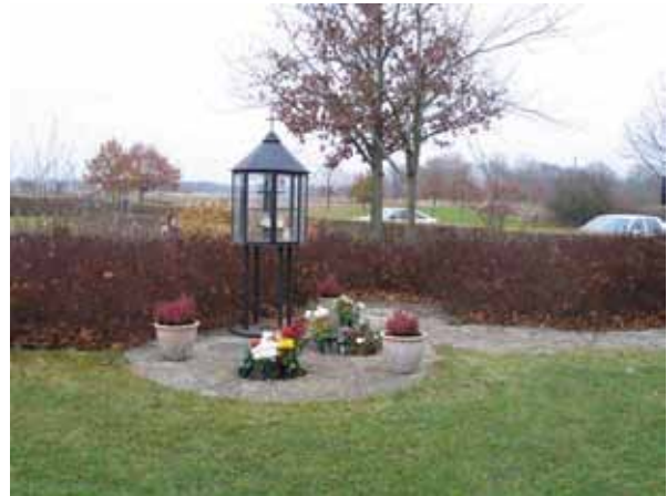
Minneslundens invigdes 1992 (KI Kläckeberga kyrkogård 128)