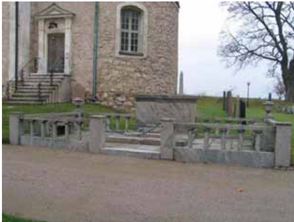
Familjen Malmborgs gravplats (KI Kläckeberga kyrkogård 088)

Gravvårdarna på Kläckeberga kyrkogård kännetecknas av stor variationsrikedom både vad det gäller ålder, material och form. Svart och grå granit är det vanligaste materialet, men här finns också ett stort antal kalkstensvårdar av vilka flertalet också hör till kyrkogårdens äldsta vårdar. Kyrkogården rymmer också ett par exempel på vårdar från mitten och slutet av 1800-talet i form av gjutjärnskors och marmorvårdar. De äldsta vårdarna finns alla av naturliga skäl i kvarteren närmast kyrkan. Många gravvårdar bär klassicerande formspråk. Det kan innebära att själva stenen fått en form som efterliknar ett tempel från antiken, eller att kolonner, lagerkransar och dylikt ingår i motivet. Två större omgärdade familjegravar finns på kyrkogården. Sydöst om koret är familjen Malmborgs gravplats och i Kvarteret Klockstapeln är familjen Le Grands familjegravplats. I samma kvarter finns även det Jegerhjelmiska gravkoret.