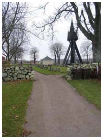
Passage mellan gamla och nya delen. Muren omgärdar den gamla delen. I bakgrunden syns klockstapeln och Jegerhjelmiska gravkoret (KI Kläckeberga kyrkog 125)