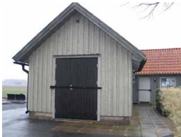
Förråd och personalutrymmen i nordvästra hörnet av gamla kyrkogården (IMG_4817)