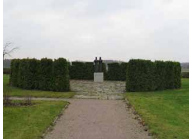
”Centralplats” med statyn Lovsång föreställande två korister (KI Kläckeberga kyrkog 134)