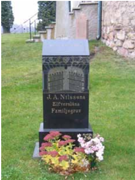
Svartpolerad klassicerande gravvård i Kv Kyrkan (KI Kläckeberga kyrkog 096)

och skelettet daterades till 1200-1400-tal. Den långa spännvidden på dateringen gör det svårt att dra några slutsatser om den döde gravlagds i och med kyrkans uppförande eller i ett senare skede.