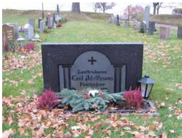
Svart granitvård i klassicerande stil, typisk för 1930-40-talen (KI Kläckeberga kyrkog 086)