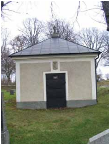
Jegerhjelmiska gravkoret från slutet av 1800-talet (KI Kläckeberga kyrkog 054)

I kyrkogårdens nordvästra hörn ligger en personal- och förrådsbyggnad. I dessa utrymmen är också kyrkobesökarnas toalett inrymd. Byggnaden är uppförd i vinkel och dess äldsta delar är troligen från slutet av 1960-talet, då en gammal redskapsbod revs. Personal- och förrådshuset har sedan byggts till i etapper.