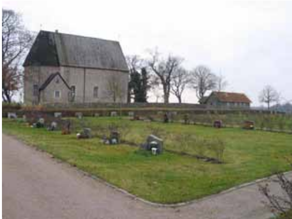
Översikt över nya delen från nordost (KI Kläckeberga kyrkog 132)