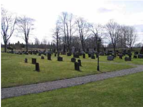
Område 1 från nordost. Bortom område 1, till höger i bild, område 2 (KI Kråksmåla kyrkog 024)

mindre antal gravvårdar av avvikande material finns i område 2. Det är två gravvårdar av sandsten varav en är ett mindre kors, en gjutjärnsurna på stensockel samt en trävård med