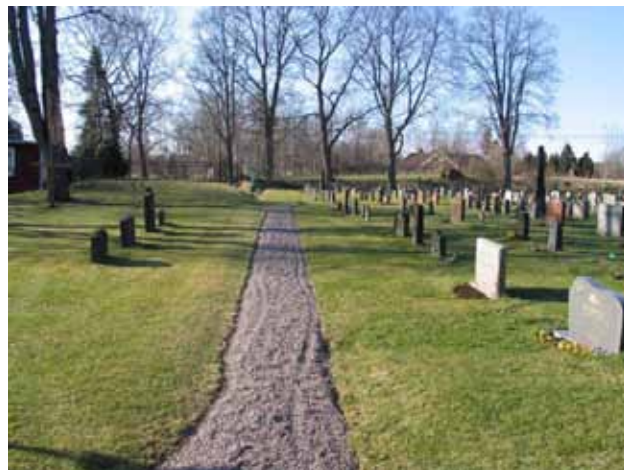
Grusgång mellan område 1 och 2. I bakgrunden anas ett svartmålat smidesräcke som skydd vid stödmuren som här är mycket brant. Där är bisättningskällaren belägen. (KI Kråksmåla kyrkog 008)