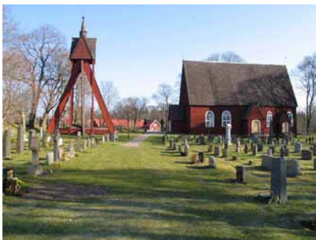
Insådd gång mellan område 4 till vänster och 3 till höger. (KI Kråksmåla kyrkog 010)

Område 3 och 4 är belägna i södra delen av kyrkogården. De båda områdena anlades i samband med utvidgningen av kyrkogården under 1900-talets första decennier. Mellan de båda områdena gick tidigare en grusad gång. Denna är idag insådd med gräs. Båda områdena avgränsas i söder samt öster respektive väster av kyrkogårdens stödmur. I norr avgränsas område 3 av en grusgång och område 4 av område 5. Enligt gravkartan rymmer de båda områdena ca 225 respektive 110 gravplatser. Majoriteten av gravvårdarna är vända mot öster. Undantaget är den västligaste raden i område 3 som är vänd mot väster. Den äldsta gravvården i område 3 är från 1913 och i område 4 från 1914. De yngsta gravvårdarna är från 2003 respektive 2001. I område 3 dominerar två tidperioder, 1920-1940 samt 1970-1990. Den dominerande perioden i område 4 är 1910-1920. De äldsta gravvårdarna i område 3 står i den västra delen. Från mitten av området och österut kan man följa en äldre kronologisk tillväxt av kvarteret från 1920 till 1926. Kanske var det här gränsen mellan de båda utvidgningarna i början av 1900-talet gick. Titlar förekommer, men sparsamt. De flesta finns i område 4. Vanliga titlar är lantbrukare, hemmansägare, och kyrkvärd. Därutöver förekommer titlar som bruksförvaltare, maskinist, sjuksköterska, nämndeman, kvarnägare och kammarskrivare. Den dödes hemort anges på majoriteten av gravvårdarna.