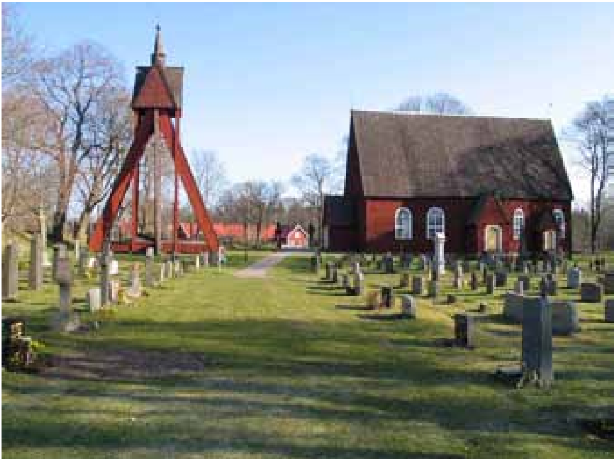
KI Kråksmåla kyrkog 010

Kulturhistorisk inventering av kyrkogårdar/ begravningsplatser i Växjö stift 2005