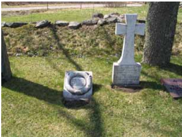
De båda marmorvårdar i område 4. I synnerhet den pulpetställda vården har en ovanlig utformning. (KI Kråksmåla kyrkog 033)

De båda områdena 3 och 4 tillkom vid utvidgningarna av kyrkogården under tidigt 1900-tal. Den gång som ursprungligen gick mellan de båda områdena är idag igensådd men områdena har fått behålla sin struktur med rader av gravvårdar som företrädesvis är vända mot öster. Flera av gravvårdarna rymmer lokalhistoriska värden. Hos enstaka gravvårdar finns också hantverksmässiga värden. I det fortsatta bruket är det viktigt att ta vara på områdenas karaktär. Detta gäller framförallt område 4 där de höga stående gravvårdarna dominerar vilket ger området en ålderdomligt uttryck.