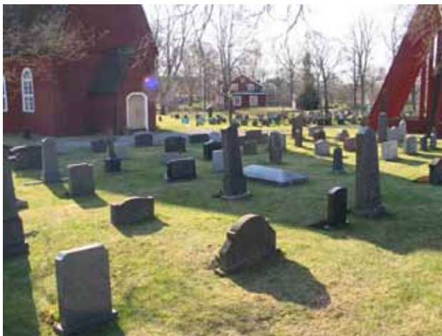
Område 6 från nordväst. (KI Kråksmåla kyrkog 012)

Intrycket i områdena 5 och 6 domineras av de höga stående gravvårdarna varav flera är mycket ålderdomliga. Materialet är företrädesvis grå och svart granit men även röd granit förekommer. Flera av de äldre gravvårdarna är dock tillverkade av ovanliga material. Fyra gravvårdar är av sandsten varav en i form av ett kors. Av de övriga fyra är en dekorerad med uthuggna pinjekottar. I område 6 står två gjutjärnskors. Ytterligare ett kors av metall står i området. Det förefaller vara gjort av svartmålad järnrör som i ändarna försetts med silvermålad knoppar. En platta av plåt ger upplysningar om den döde. Här finns också en