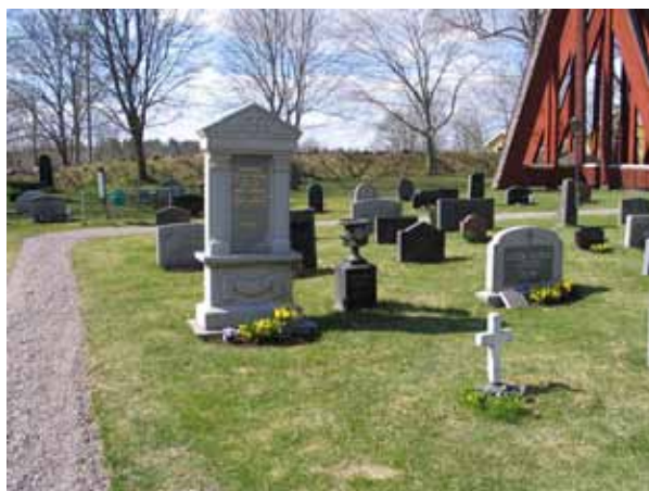
Kyrkvärden C. E. Petterssons, Torshult, familjegrav i område 2. (KI Kråksmåla kyrkog 029)