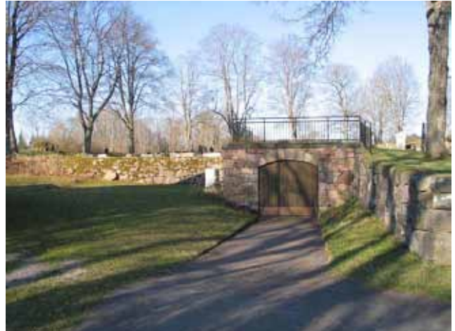
Bisättningskällaren placerad under kyrkogården i en vinkel i stödmuren. (KI Kråksmåla kyrkog 005)

Inrymt under kyrkogårdens stödmur i öster. Här installerades för några år sedan en likkyl. Bisättningskällarens ytterfasad är av kallmurad, kanthuggen granit. Dörrarna är brunbetsade med skyddande plåt av koppar.