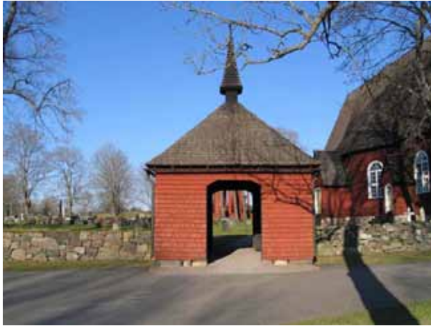
Stigluckan vid kyrkogårdens östra ingång. (KI Kråksmåla kyrkog 001)