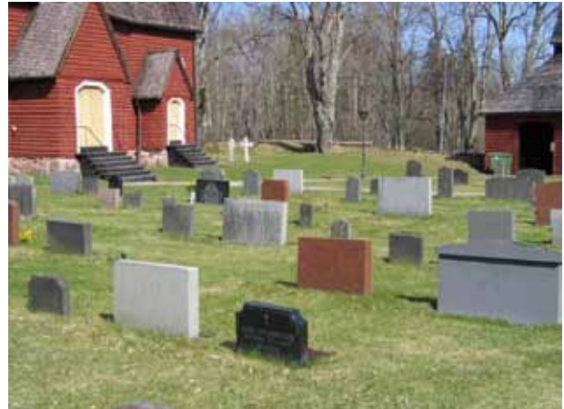
Låga stående gravvårdar i område 2. Samtliga gravvårdar är vända mot öster. Bilden är tagen från sydväst och visar att två gravvårdarna har återanvänts. (KI Kråksmåla kyrkog 036)

sniderier och avtäckt med kopparplåt daterad 1944. I södra delen av område 2 finns två höga äldre gravvårdar med utmärkande utformning. En av dem är av grå granit med klassicerande stildrag i form av pilastrar och tempelportik. Den andra har en obeliskform och står på kyrkogårdens enda grusbelagda gravplats vilken omgärdas av stenpollare och kätting.