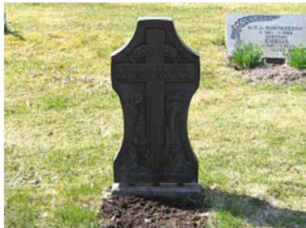
Polerad gravvård med blomstermotiv i område 3. Gravvårdar av svart granit med polerad dekor är vanligt, men formen och motivet på denna vård är ovanligt. (KI Kråksmåla kyrkog 031)