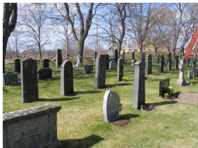
Stående, höga gravvårdar i område 4. (KI Kråksmåla kyrkog 032)