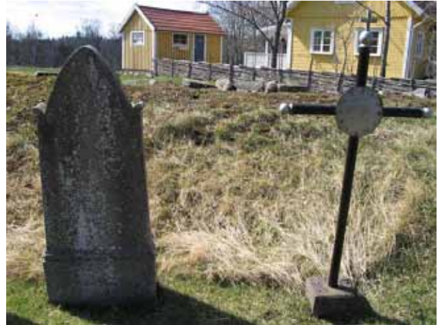
Sandstensvård från 1873 och gravvård av svartmålad järnrör från 1911. (KI Kråksmåla kyrkog 042)