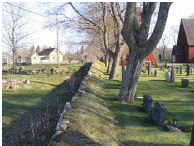
Kyrkogårdens stödmur och trädkrans i väster. (KI Kråksmåla kyrkog 011)

samt vårdar av marmor, sandsten, kalksten, trä eller gjutjärn. Ett mindre antal gravvårdar har återanvänts antingen genom en ny inskription på baksidan eller genom att stenen slipats om. Framför flera vårdar som markerar familjegravar har mindre stenplattor placerats som visar på sekundära begravningar på gravplatsen. Man kan också notera att antalet gravvårdar från slutat av 1950-talet och 1960-talet är litet. Detta sammanfaller med att den nya kyrkogården tas i bruk.