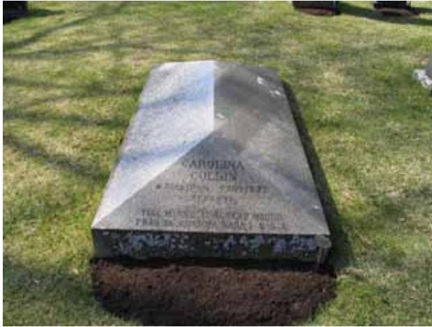
Minnesvården över Carolina Collin och hennes make från barnen i USA. (KI Kråksmåla kyrkog 044)