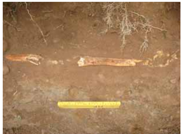
Graven under vapenhuset.