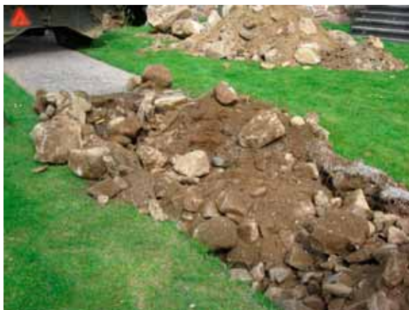
Schakt C. Stenfylld mark.

Schaktet följde gången från södra vapenhu- set mot stigluckan. Längs denna sträcka var marken stenfylld med upp till 0,4 meter stora block. Fyllningen nådde 1 meter ner där under- grunden utgjordes av lerig blockmorän. Inga rester eller spår efter äldre och medeltida gra- var syntes.