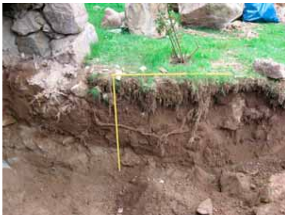
Schakt A. Omrört lager.

Schaktet grävdes delvis i en nordsydlig löpan- de gång. Inom detta område har begravningar gjorts fram till 1960. Fyllningen utgjordes av ett 1 meter tjockt, omrört matjordslager som följdes av blockrik morän. Ställvis minskades schaktdjupet på grund av ytligt liggande sten- block. I schaktet märktes inga rester av äldre eller medeltida begravningar.