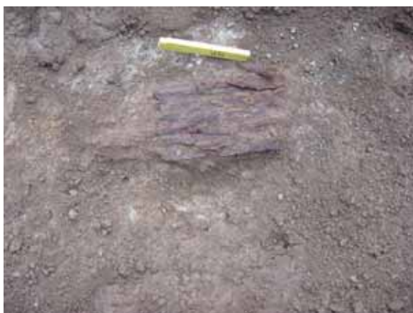
Kistfragment i schakt B.

Vid grävningen påträffades ett 0,5 meter tjockt matjordlager under grästorven. Fyllningen hade inslag av benfragment och kistdelar. Ett större kistfragment, (0,2 X 0,2) meter låg dikt an mot den sterila botten. För att upptäcka eventuella spår efter nedgrävningar grävdes ytterligare 0,2 meter ner i den sterila undergrunden. Trots detta syntes inga rester av äldre eller medeltida begravningar.