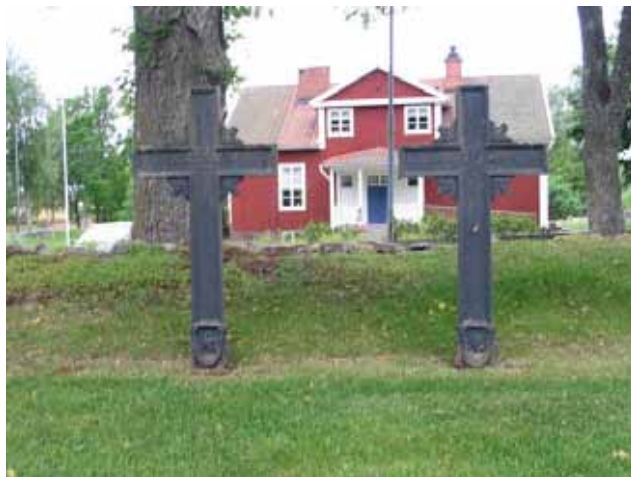
Uppställda gjutjärnskors i kvarter J. I bakgrunden f.d. skolhus som idag är församlingshem. (KI Kristvalla kyrkog 023)