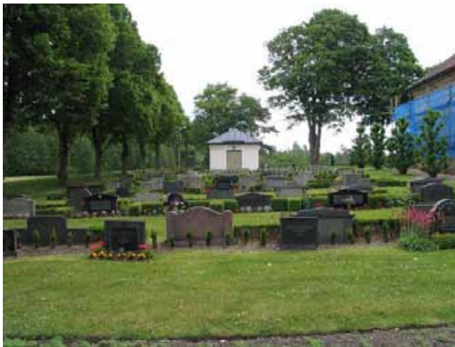
Kvarter F från väster samt gravkapellet. (KI Kristvalla kyrkog 044)

beskrevs för kvarter F, kvar. En del gravvårdar är därför vända mot nordost. Dessa gravvårdar är av äldre datum än de ryggställda gravvårdarna. Flertalet ska enligt uppgift stå på ursprungsplats, men några är uppställda. I kvarter K som är det senast anlagda området på Kristvalla kyrkogård är samtliga gravvårdar ryggställda med häckar av buskrosor planterade emellan raderna. Den äldsta gravvården i kvarter F är från 1930 och den yngsta från 1999, i kvarter J från 1823 respektive 2003 samt i kvarter K från 1990 respektive 2003. Gravvårdar från perioden 1960-70 dominerar i kvarter F och i kvarter J är perioden 1970-80 mest framträdande. Yrkestitlar är tämligen vanliga. Här finns hemmansägare, lantbrukare, nämndeman, mjölnare, entreprenör, byggmästare, handlanden, häradsdomare, köpman, inspektor, kyrkvård, konstnär och bonde. På majoriteten av gravvårdarna anges den dödes hemort.