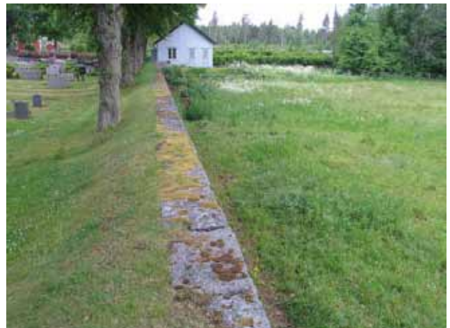
Del av kyrkogårdsmuren i norr samt byggnad för förråd och pannrum. (KI Kristvalla kyrkog 010)