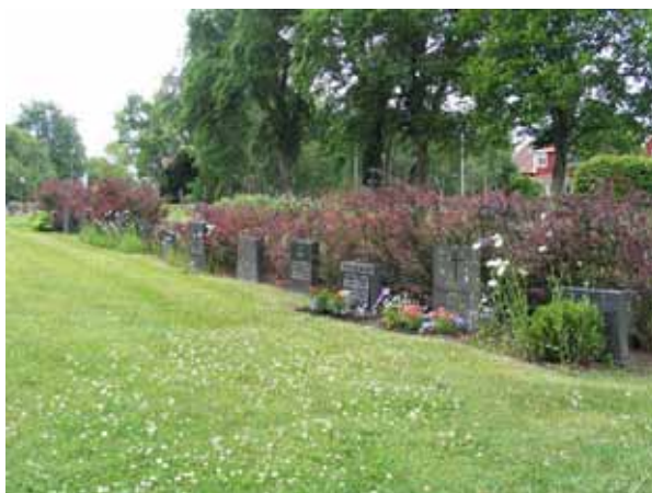
Linjegravvårdar i kvarter G. (KI Kristvalla kyrkog 050)