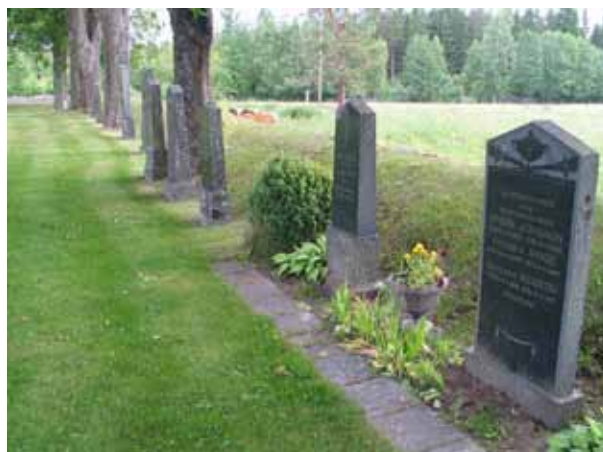
Höga stående gravvårdar på köpta gravplatser i östra delen av kvarter D. (KI Kristvalla kyrkog 040)