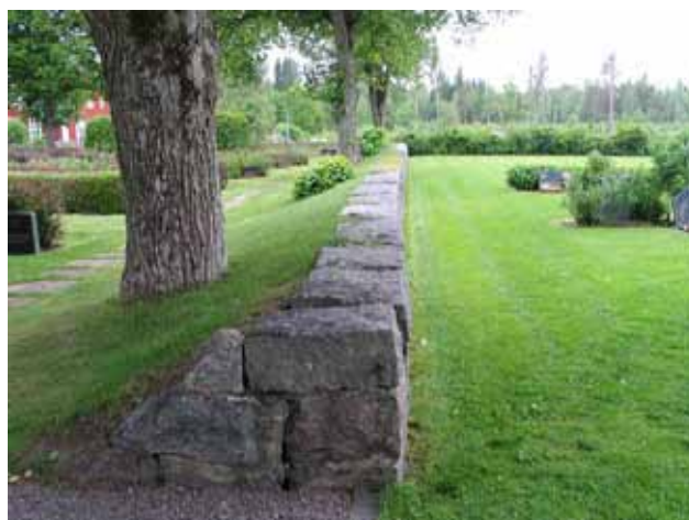
Tidigare gräns för kyrkogården. Idag gräns mellan 1935 och 1983 års utvidgningar. (KI Kristvalla kyrkog 016)