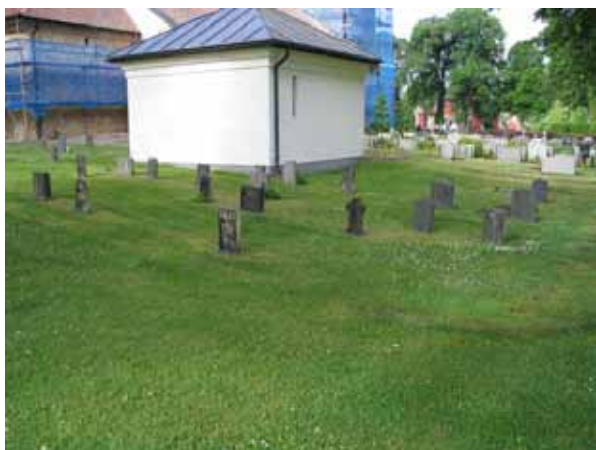
Kvarter E från nordost. (KI Kristvalla kyrkog 042)

hemmansägare, orgeltrampare, gästgivare, trotjänarinna, trädgårdsmästare, kyrkväktare och åkare. Den dödes hemort anges på majoriteten av gravvårdarna.