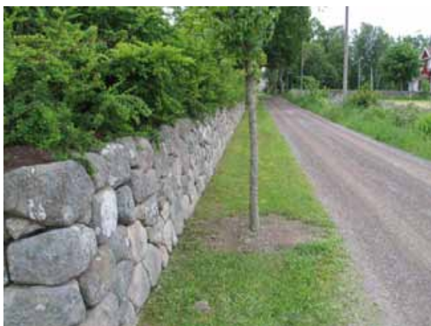
Del av kyrkogårdens stödmur i söder lagd 1983. (KI Kristvalla kyrkog 014)

Kristvalla kyrkogård har brukats under lång tid vilket avspeglar sig i gravvårdarna. Inom de äldre gravkvarteren finns en stor variation av gravvårdar från olika tider. Intrycket domineras dock av de höga, stående gravvårdarna. På de modernare områdena norr om kyrkogården dominerar låga, stående gravvårdar. Dessa vårdar är av två typer. På köpegravplatserna har många av gravvårdarna klassicerande stildrag med motiv som liknar tempelportik eller kolonner medan linjegravsområden har små, låga vårdar typiska för linjegravsområden under 1900-talet. Delar av detta område har använts som linjegravsområde och vårdarna här är företrädesvis små, stående gravvårdar. Majoriteten av vårdarna är av grå eller svart granit. Ett mindre antal gravvårdar är tillverkade av andra material som t.ex.gjutjärn.