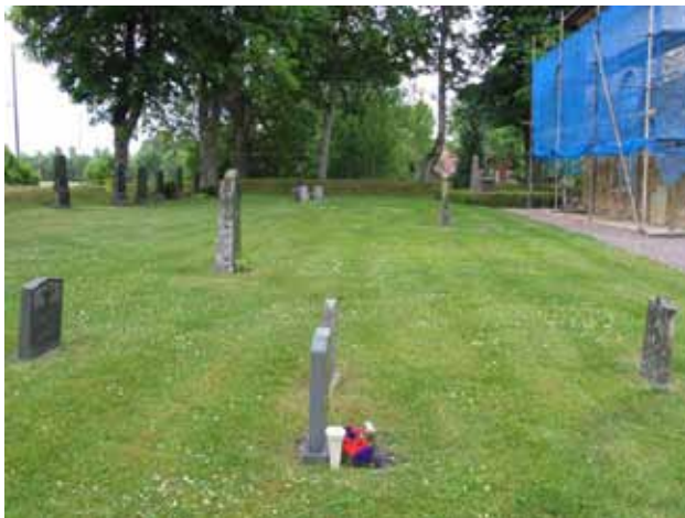
Kvarter C från norr. (KI Kristvalla kyrkog 039)

Kvarter B och C är belägna söder respektive öster om kyrkan. Var gränsen för kvarter C går i norr mot kvarter E är något oklar. En del gravvårdar som har inventerats som tillhörande kvarter C kan höra till linjegravsområdet i kvarter E. I kvarter B finns idag 12 gravvårdar av vilka flera är äldre köpegravar. Äldre köpegravar finns även i södra delen av kvarter C. Totalt finns 19 gravvårdar inom vad som förefaller vara kvarter C. Flera gravvårdar i kvarter C har plockats bort och här finns idag flera lediga gravplatser. Majoriteten av gravvårdarna är vända mot väster men enstaka gravvårdar i kvarter C är vända mot öster. Den äldsta gravvården från 1821 finns i kvarter B. I kvarter C är den äldsta gravvården från 1854. Den yngsta gravvården är i båda kvartererna från 1991. Gravvårdar från sent 1800-tal och tidigt 1900-tal dominerar i de båda kvartererna. Yrkestitlar är vanliga. Två kyrkoherdar och två pastorer är begravda i kvarteret. Dessutom finns titlarna organist, kantor, folkskollärare, Missionären i Ostindien, Kaptenen RSO (Riddare av första klassen av Svärdsorden), rusthållare, ålderman, kyrkvård och lantbrukare. På majoriteten av gravvårdarna anges den dödes hemort.