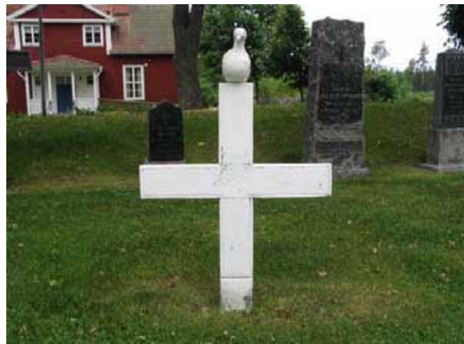
Trävård i kvarter J. (KI Kristvalla kyrkog 022)