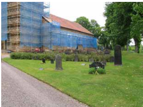
Kvarter A från väster. (KI Kristvalla kyrkog 027)

Kvarter A är beläget i sydvästra delen av kyrkogården, kvarter D längst i öster och kvarter H i väster i anslutning till kyrkogårdens västra ingång. Flest gravvårdar finns i kvarter A, ca 90 stycken. I kvarter H finns ca 30 gravvårdar och i kvarter D 17 stycken. I samtliga kvarter, men främst i kvarter H, finns lediga gravplatser. I kvarter A är den äldst gravvården från 1886, i kvarter D från 1890 och i kvarter H från 1903. De yngsta gravvårdarna är från 1988, 1976 och 1962. I samtliga tre kvarter dominerar gravvårdar från 1900-talets första decennier. I kvarter H finns två gravvårdar som är vända mot söder och en mot norr. Övriga gravvårdar i kvarter H står i glesa rader vända mot öster. I kvarter A finns fyra ryggställda rader med gravvårdar vända mot öster eller väster. Mellan raderna har häckar planterats, varannan rad ölandstok och varannan berberis. I kvarter D är samtliga gravvårdar uppställda utmed kyrkogårdens stödmur och vända mot väster. Yrkestitlar är mycket vanliga i kvarteret. Vanligast är titlarna hemmansägare, lantbrukare, kyrkvärd, folkskollärare och nämndeman. Därutöver finns titlarna barnmorska, förvaltare, skraddarmästare, kantor, kyrkvaktare, handlanden och stenhuggare. På majoriteten av gravvårdarna anges den dödes hemort.