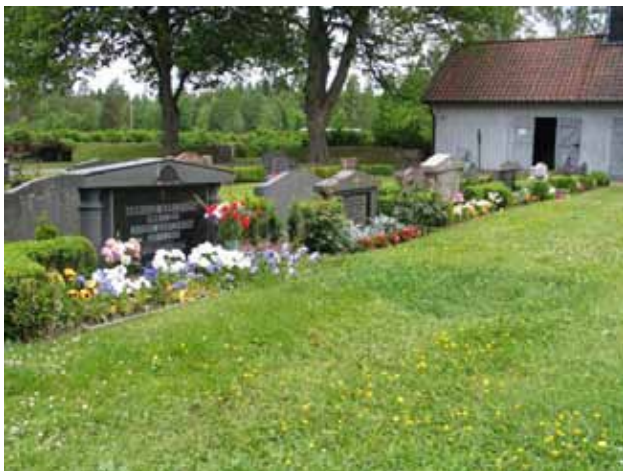
Gravvårdar med klassicistiska drag, kvarter F. (KI Kristvalla kyrkog 046)

Kvarteren F och K hör till de moderna kvarter som tillförts kyrkogården under 1900-talet. Kvarter J är ett äldre kvarter som under 1900-talet genomgått en omläggning. Flera av gravplatserna i kvarter F och J har tidigare varit belagda med grus och omgärdade. Idag vittnar de bevarade resterna av buxbomshäckar om detta. Denna form av gravutsmyckning var tidigare vanlig på våra svenska kyrkogårdar. De kvarvarande buxbomshäckarna bör därför vårdas som viktiga ledtrådar till kyrkogårdens historia. För samtliga kvarter är det viktigt att ta tillvara på kvarterens särdrag i det fortsatt bruket av områdena. Flera av gravvårdarna har såväl personhistoriska som lokalhistoriska värden. Enstaka gravvårdar har också hantverksmässiga värden. Det gäller främst de äldre gravvårdarna i kvarter J. De båda gjutjärnskorsen ska införas på församlingens inventarieförteckning och vårdas av församlingen. Detta gäller även de gravvårdar som är från mitten av 1800-talet.