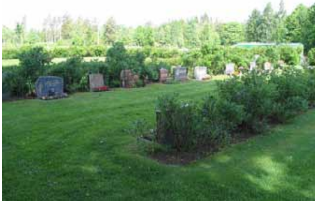
Kvarter K från sydost. (KI Kristvalla kyrkog 059)