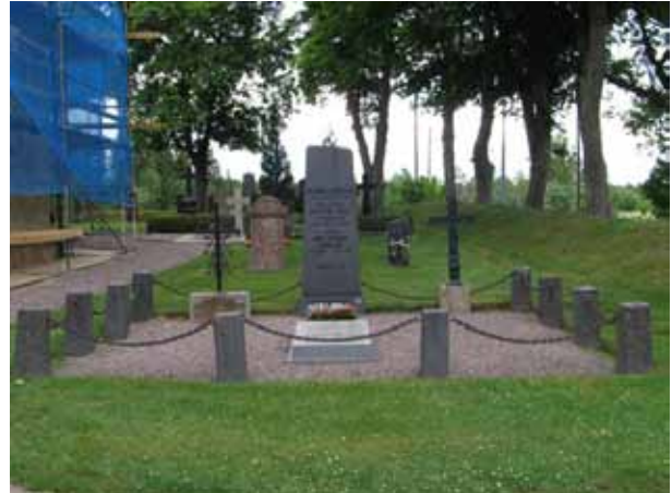
Kvarter B från väster. (KI Kristvalla kyrkog 031)