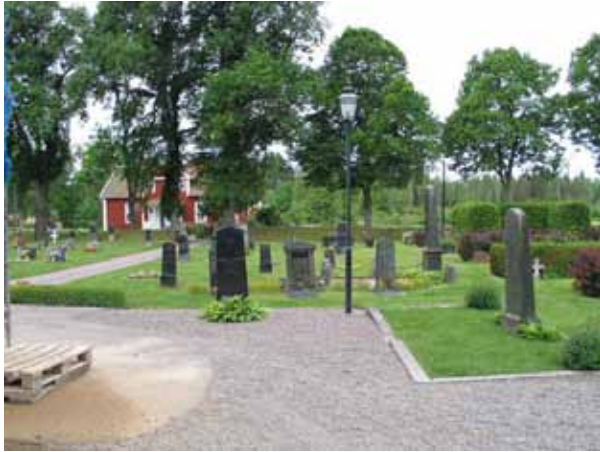
Kvarter H från öster. (KI Kristvalla kyrkog 058)