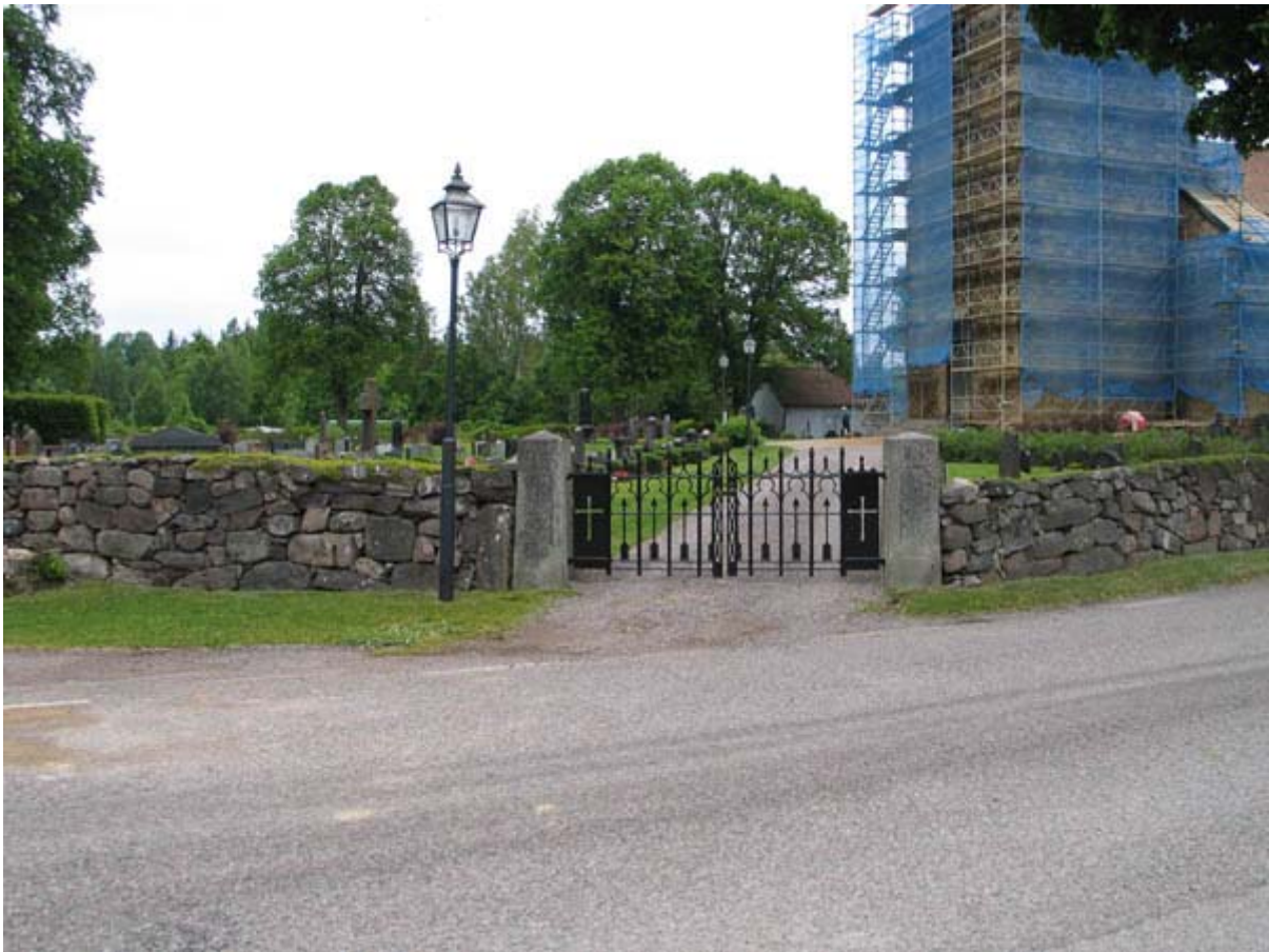
KI Kristvalla kyrkog 005

Kulturhistorisk inventering av kyrkogårdar/ begravningsplatser i Växjö stift 2005