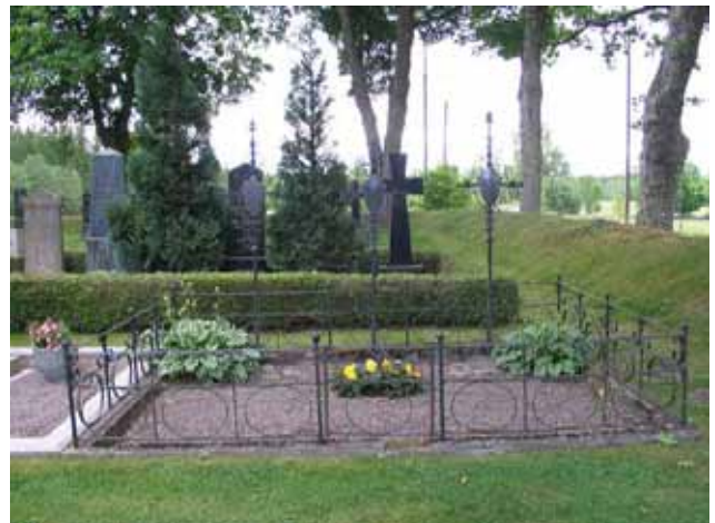
Familjen Blomstrands gravplats med tre smidda kors omgärdad av ett sirligt smidesstaket. (KI Kristvalla kyrkog 034)