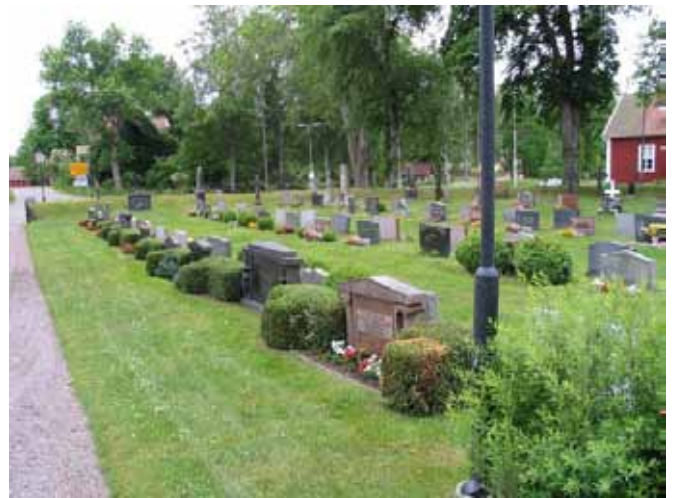
Kvarter J från nordost. (KI Kristvalla kyrkog 020)