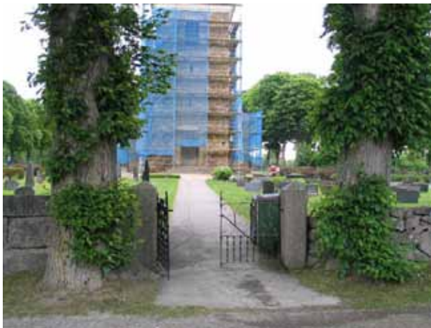
Kyrkogårdens ingång i väster. Vid inventeringstillfället pågick arbetet att renovera kyrkans fasad. (KI Kristvalla kyrkog 002)

Kyrkogården omgärdas i samtliga väderstreck av en stödmur av varierande ålder. De äldsta delarna av muren i väster, söder och öster är kallmurad och kanthuggen. Utvidgningen från 1930-talet omgärdas i väster, norr och öster av en kallmurad mur av rektangulärt huggna block. Kyrkogårdens yngsta del omgärdas i väster, norr och öster av en kallmurad stödmur av natursten som endast i undantagsfall har kanthuggits.