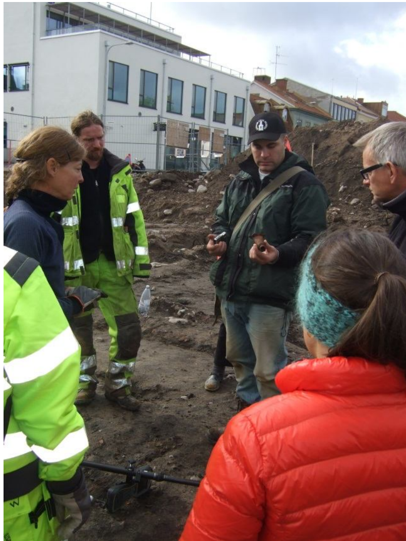
Visning för arkeologistudenter på utgrävningsplatsen i kvarteret Gesällen den 5 oktober.