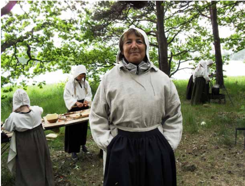
Lärare och elever under tidsresan "Lindö 1681".

var att leva på den tiden. Det är det som är meningen. Till exempel var det mobiltelefonförbud, vilket eleverna ifrågasatte, då förklarades det med att inga mobiltelefoner fanns på den tiden. Det kan vara nyttigt att ha mobilfritt. Jag har i alla fall en förhoppning om att eleverna får en förståelse om hur till exempel barn i deras ålder fick arbeta på den tiden. Dåtidens barn fick jobba med det som föräldrarna arbetade med, barnen hade inga andra val.