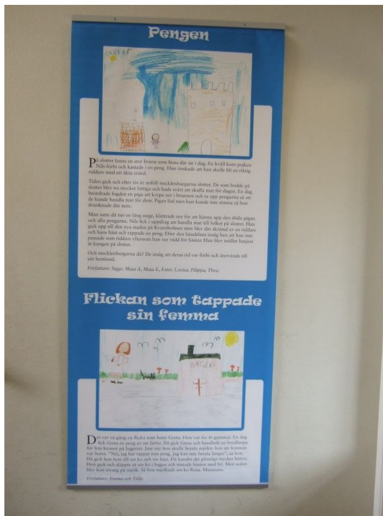
Bilder och texter arbetades fram av lärare och elever till vernissagen på Kalmar läns museum. Bilden visar delar av materialet som hänger i en trappuppgång på Lindöskolan.

ett föredrag av en representant för kommunen om utgrävningsplatsen. Lärare, elever och föräldrar fanns på plats vid vernissagen. Det gick ganska snabbt att titta igenom utställningen i hörsalen på museet, utställningen var inte så stor. Om man läste all text tog det förstås längre tid, men de gjorde de flesta inte. Hela Kalmar läns museum var öppet under vernissagen den 24 oktober 2012 och det var många besökare som passade på att besöka museets övriga utställningar.