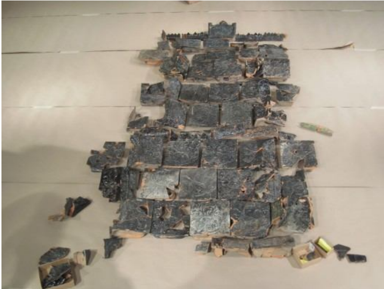
Kakelugnsbitar från en 1600-talskakelugn hittades under utgrävningar i kvarteret Gesällen och pusslades ihop och beskådades av besökare på Kalmar läns museum.

den var hopmonterad. Det började med att Annika och Per lade ut alla bitarna på golvet i ett av utställningsrummen. Det var fantastiskt roligt att se hur väl de kompletterade varandra med sina olika kunskaper och där Per som kakelugnsmakare var ovärderlig med sin kunskap om kakelugnars uppbyggnad i arbetet med att få ihop de olika delarna.