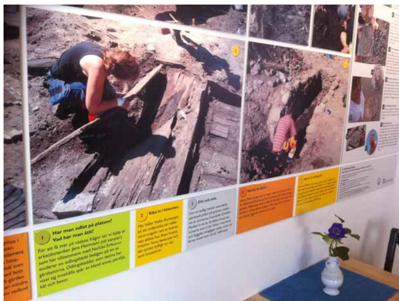
Delar av utställningen "Utgrävning pågick" i kafét på Kalmar läns museum.

ämbetets arkeologiska uppdragsverksamhet, UV Öst. Den visades i läns museets kafé så länge som utgrävningen pågick fram till den 4–5 april 2013.