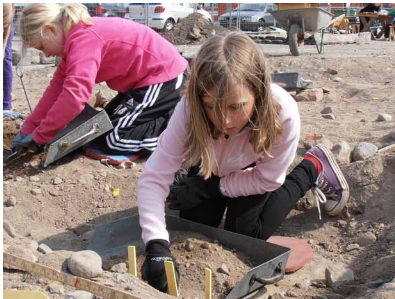
Barn från Lindöskolan gräver i kvarteret Gesällen.

Eleverna berättar att under grävdagen var det olika stationer; en station där man skulle gräva, sen silade man, sen sköljde man bort jord från fynden. Eleverna berättar om de arkeologiska fynden: Vi hittade djurskelett, krukskärvor, kritpipor, två dockhuvuden i porslin, en bit flinta och en tand. Eleverna minns att de vägde och mätte fynden och att de skrev upp vikt och längd. Det gjordes för att arkeologer i framtiden skulle kunna ta del av dokumentationen. Fynden förvarades i boxar och småpåsar för framtiden. Man skriver upp fyndmaterialet som exempelvis tegel, porslin och trä.