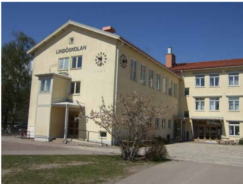
Lindöskolan i Kalmar.

En lågstadielärare var på ett första besök med sina elever på utgrävningsplatsen under pågående utgrävning och då visade en arkeolog upp fynd. Arkeologen visade hur fynden tvättas, vilket även eleverna fick hjälpa till med. Avslutningsvis pratade gruppen om var ifrån fynden kunde komma. En annan lågstadielärare minns att eleverna fick titta på när arkeologerna grävde på platsen. Det gjordes ett besök per klass i årskurs två och tre. Efter det fick en klass ett uppdrag om att skriva en berättelse utifrån ett av fynden som var en kritpipa. En annan klass skulle skriva om hur en dag i en arkeologs liv ser ut. Text- och bildmaterialet som arbetades fram i klasserna ställdes ut på vernissagen som avslutade det pedagogiska programmet. Berättelser och bilder trycktes på vepor till utställningen på Kalmar läns museum. Numera hänger de i trapp- och entrétrymmen på Lindöskolan.