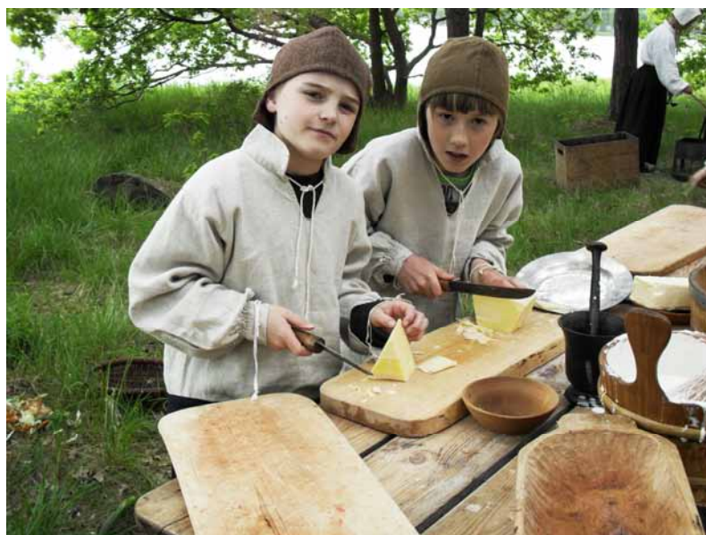
Barn från Lindöskolan deltar i tidsresan "Lindö 1681".

En pojke berättar vidare om tidsresan: Det var kul för att det verkligen kändes att det var den tiden. Jag skulle sy en säck och en av flickorna fick hjälpa mig med det. Det var verkligen ungefär som på 1700-talet; då männen kunde det ena, kvinnorna det andra och pojkarna och flickorna kunde det ena eller andra. När jag skulle hjälpa till med maten så puttade alla tjejerna undan mig så det blev verkligen som på den tiden. Jag fick göra smör istället, sen fick jag hjälpa till lite grann med soppan och efterrätten. Då stötte tjejerna bort mig igen... det kändes verkligen.