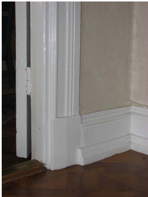
...troligen ursprungliga snickerier från ca 1898