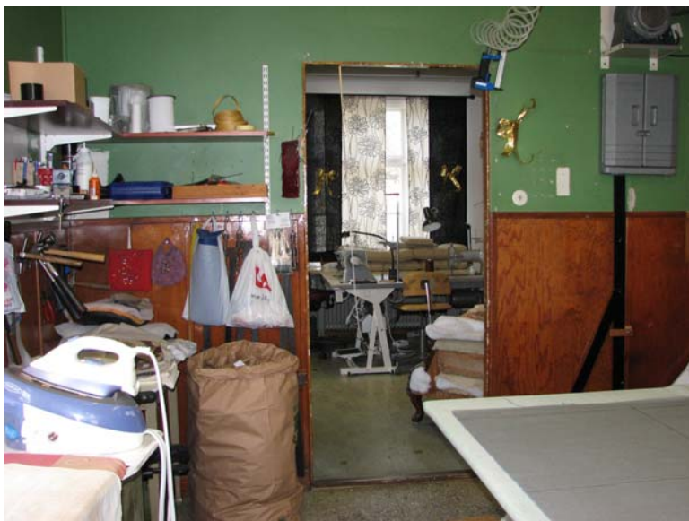
Expeditionsrummet in mot bagage/resgodsrummet.

Interiören i väntsalen, expeditionen och bagagerummet bär ännu tydliga spår av en modernisering på 1940-50-talet. Troligen är den utförd av SJ någon gång efter övertagandet av banan 1940. De flesta gamla profilerade foder, golvssocklar och en del spegeldörrar har då ersatts av nya släta. På väggarna har enkla släta bröstningspaneler av fernissat trä monterats. I lägenheten är mer av husets äldre karaktär bevarad med flera spegeldörrar och profilerade listverk. En mindre del av den ursprungliga byggnadskroppens norra fasad är inbyggd och synlig på vinden.