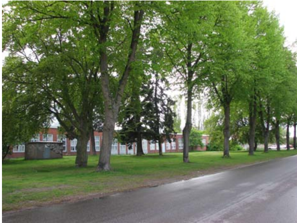
Lorensbergsparkens norra del med fd bussgaraget i bakgrunden.