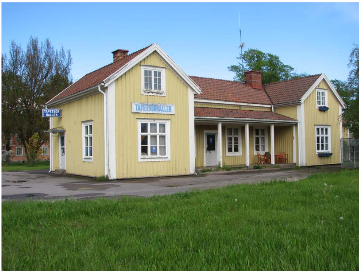
Ungefär samma vy 2006 visar att huset är sig likt men järnvägsspåren är borta.