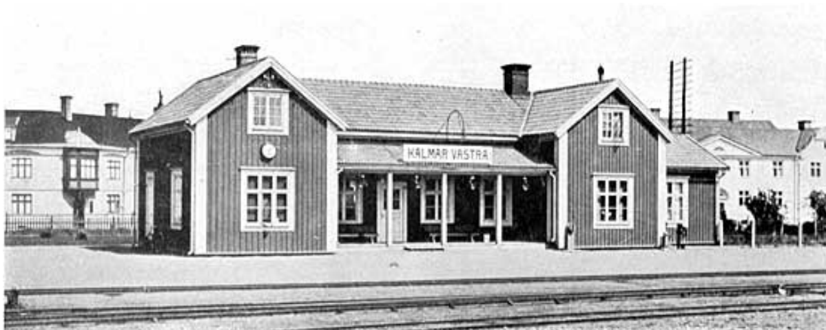
Kalmar Västra omkring 1924 då stationen nyligen hade byggts till med väntsal, expedition och bagage/resgodsrums. Gaveln till höger är en del av det ursprungliga huset, med det 1915 tillbyggda sovrummet längst till höger, jfr föregående sida. De radstående husen skymtar i bakgrunden.