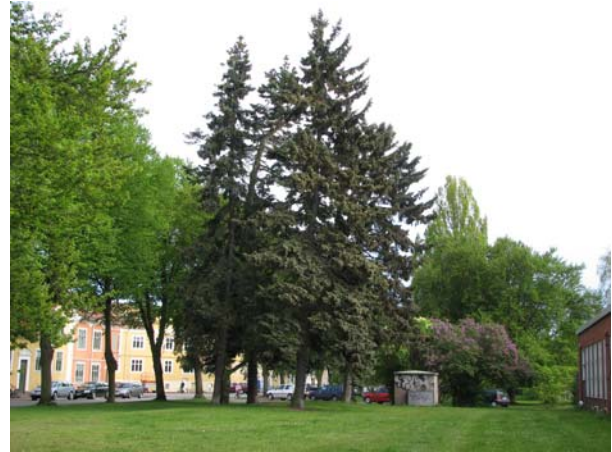
Samma parti från motsatt håll. Granarna går att känna igen på flygbilden på sidan 6.