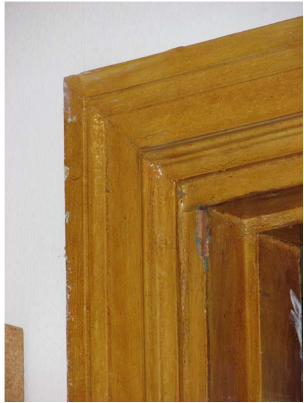
Dörrfoder från 1922 års tillbyggnad