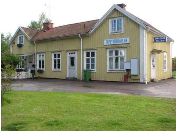
Järnvägsstationens fasad mot Nygatan med dörren till väntsalen.