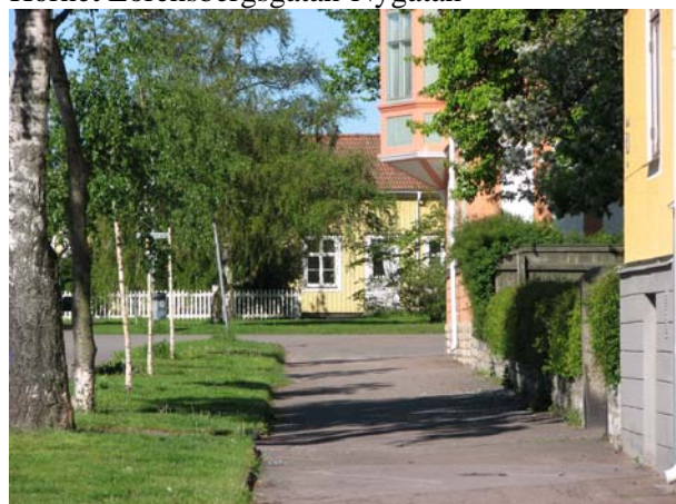
Gångbanan vid Nygatan leder mot fd väntsalen