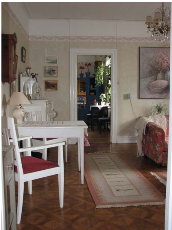
Vardagsrummet i lägenheten med...