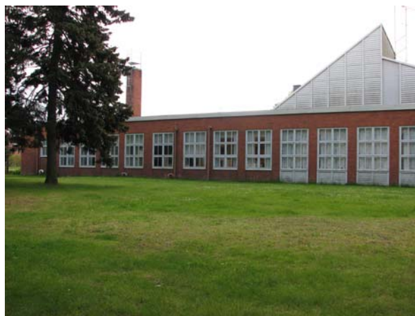
Fd bussgaragets fasad mot Lorensbergsparken. Vid närmare titt på fasaden ser man flera olika utbyggnadsetapper.