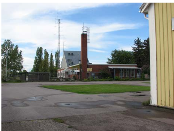
Fd bussgaraget mot norr med stationsbyggnaden till höger i bild.

Nuvarande Högskolans lokaler norr om stationsbyggnaden är uppförda i etapper troligen från 1940-talet. Den tidigare användningen som bussgarage och verkstäder är fortfarande avläsbar i fasadernas stora öppningar även om de har byggts om till fönsterpartier. Den stora öppna ytan på västra sidan har också kvar sin vackra och slitstarka beläggning med smågatsten. Det finns även ritningar på garage från 1924 och bilverkstäder från 1930, som har legat på samma plats men som sedan länge är rivna. Det har inte kunnat beläggas, men det är troligt, att dessa garage och verkstäder var ett resultat av bolagets satsning på alternativa och kompletterande transportmedel som tog sin början 1924 (se ovan). Vid ombyggnaden för Högskolans behov gjordes en påbyggnad på taket med en karaktärsfull siluett.