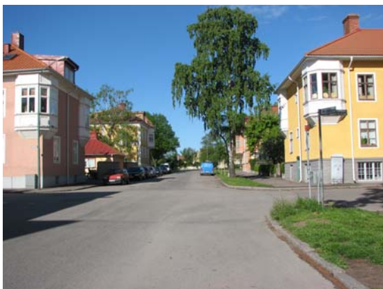
Nygatan med järnvägsstationen i fonden

Placeringen av stationen och järnvägen skar tvärs igenom den kvartersmark som hade föreslagits men ej genomförts i den då ännu gällande sk Öhneliska stadsplanen från 1876. Stationsbyggnaden placerades dock i förlängningen av den påbörjade Nygatan möjligen med avsikten att stationen skulle fungera som en fondbyggnad. Frågan om en ny stadsplan hade väckts i fullmäktige redan 1901 genom en motion från kapten W Jung som pekade på behovet av en ny och utvidgad stadsplan bl a med anledning av Bergajärnvägens tillkomst 4 . Den Hallmanska stadsplanen antogs 1906 och det var i denna plan som förutsättningarna för de radstående kvarteren "Kalmar Västra" lades fast. Det var också i denna plan som korsningen Lorensbergsgatan-Nygatan utformades som en platsbildning genom de avskurna kvartershörnen i kvarteren Grönsiskan och Lommen. De speciella förutsättningarna som änd- och hörnlägena gav har stadsarkitekt J Fred Olson tagit till vara vid utformningen av husen i såväl planlösning som fasadutformning, där framför allt burspråken på hörnen bidrar med sin karaktärsfulla utformning. De norra husen i kvarteret Grönsiskan respektive de södra husen i kvarteret Lommen tillhör den första gruppen radstående hus som byggdes i Kalmar. Stadsplanen anger en fortsättning av platsbildningen i parken, i form av motsvarande avskurna hörn, men de tycks aldrig ha blivit utförda. Däremot finns det ännu spår av stenläggning och en förlängning av den björkträdkantade Nygatan med avskild gångbana.