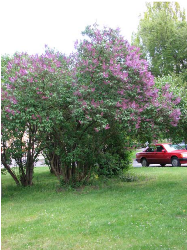
Syrenbuskar i parken