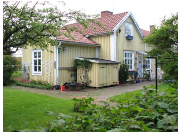
Stationen med den privata trädgården.

Interiören i väntsalen, expeditionen och bagagerummet bär ännu tydliga spår av en modernisering på 1940-50-talet. Troligen är den utförd av SJ någon gång efter övertagandet av banan 1940. De flesta gamla profilerade foder, golvssocklar och en del spegeldörrar har då ersatts av nya släta. På väggarna har enkla släta bröstningspaneler av fernissat trä monterats. I lägenheten är mer av husets äldre karaktär bevarad med flera spegeldörrar och profilerade listverk. En mindre del av den ursprungliga byggnadskroppens norra fasad är inbyggd och synlig på vinden.