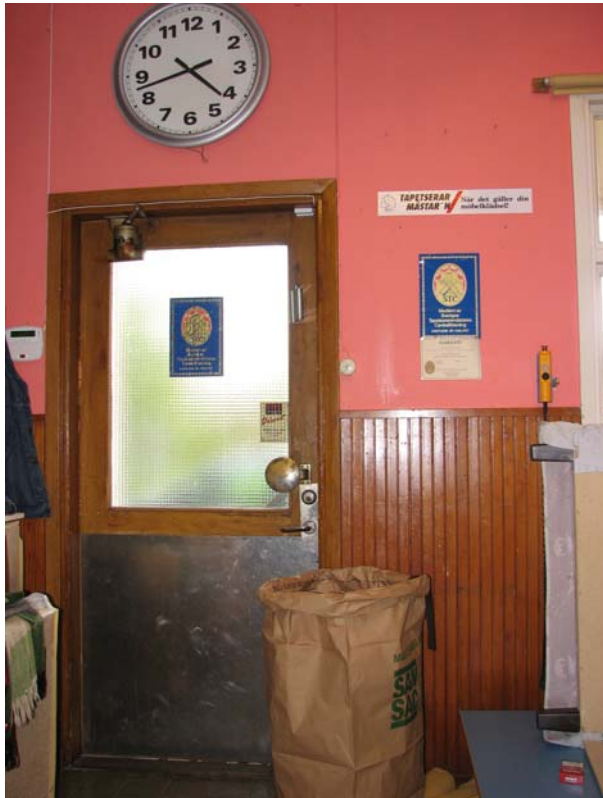
Dörren från väntsalen mot spåren