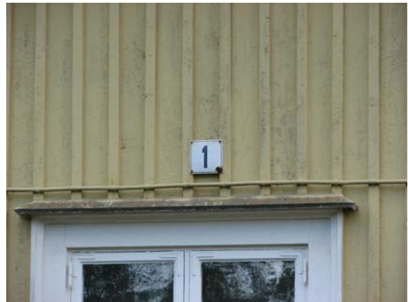
Kalmar-Bergabanans station nummer 1.