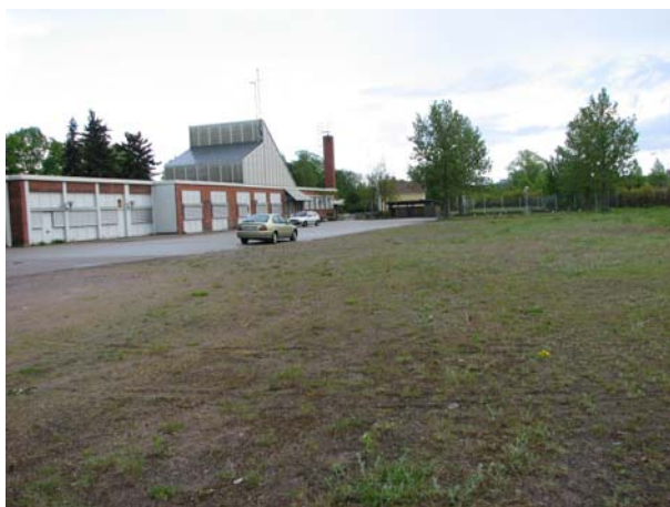
Fd bussgaraget mot söder med stationsbyggnaden skymtande i fonden. Järnvägsspåret följde den stensatta ytan vid bilen.