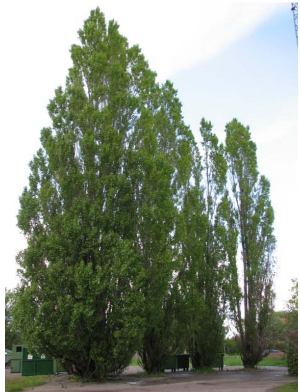
En grupp popplar följer i mjuk båge norra infarten till fd bussgaraget