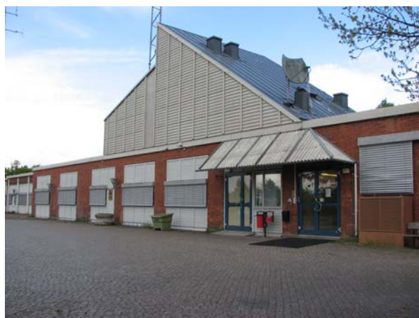
Entré till Högskolans medieutbildning. De fd garageportarna går fortfarande att skönja.