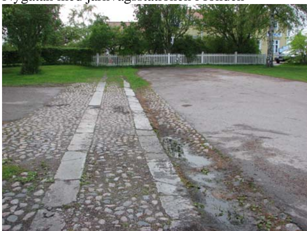
Gångbانهällar och kullersten upp mot stationen