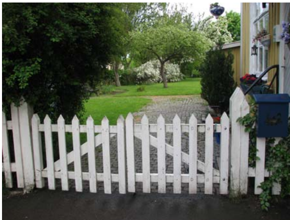
Grindarna in till stationsträdgården.