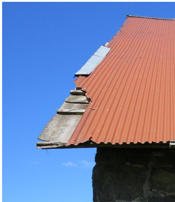
Detalj, ladugårdens södra takfall före åtgärd.

Sly intill väggen röjdes. Alla panelbrädor togs ner och sorterades. Skadade panelbrädor sorterades bort och bra panel återanvändes. Den bärande gavelkonstruktionen kompletterades med två stolpar på utsidorna mot norr och söder. Panelen kompletterades med ca 80 löpmeter, 10-8 tum breda nytillverkade brädor i gran lika befintliga med fasning och fjäder/spont. Virket fälldes i Vissefjärda och sågades i Muggetorp. Det hyvlades i Kvilla. Dåliga vindskivor och stormlister togs ner. Nya täcklister, lite bredare än de tidigare för bättre stabilitet monterades. Vindskivorna ersattes med nya, lika befintliga i gran. Ny plåt sattes på vindskivor och veks ner som stormlister. Gavelpanel och vindskivor målades med röd slamfärg Falu rödfärg förstärkt med lite Engvall och Claesson linolja. Takutsprånget lagades upp med furuvirke lika befintligt. Befintliga takplåtar ochnockplåt