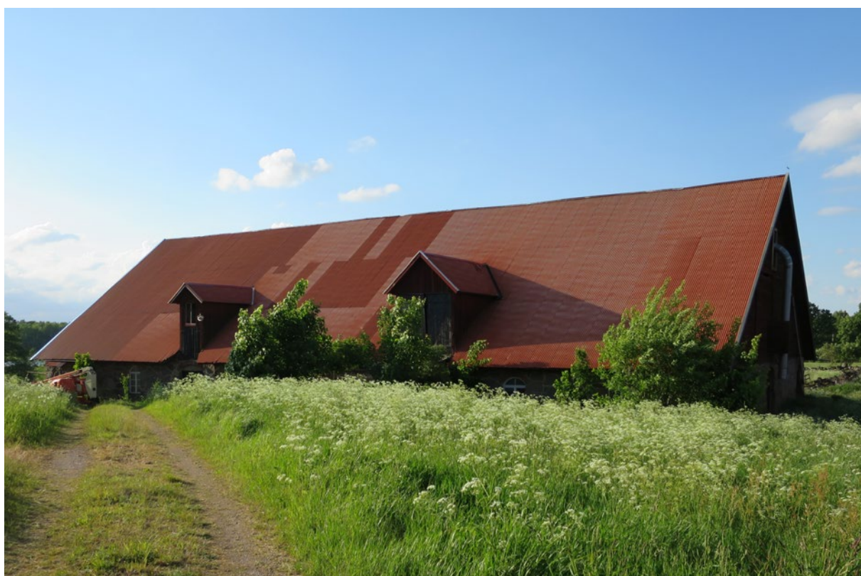
Ladugårdens södra takfall efter åtgärd.