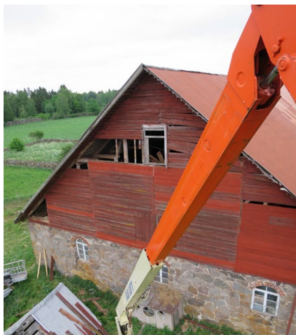
Panel under renovering.