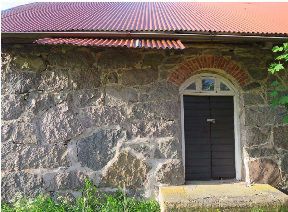
Plåttak över mjölkkrummet efter åtgärd.