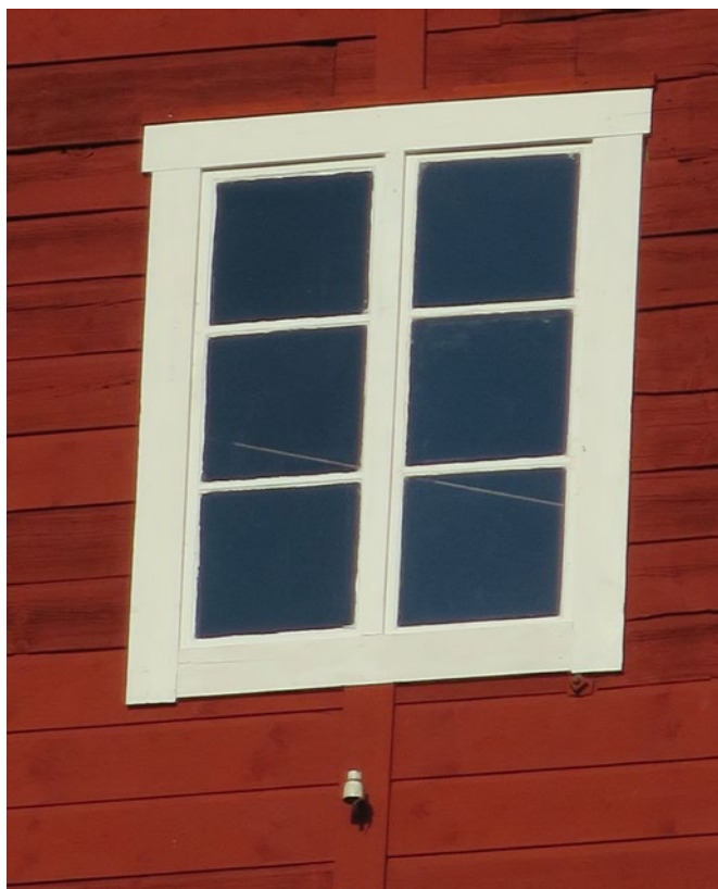
Gavelfönster efter byte av fönsterbåge och renovering.