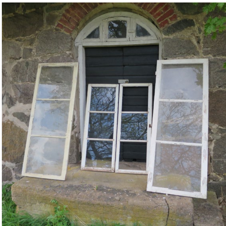
Nerplockade fönsterbågar i mitten och ersättningsbågar ytterst.