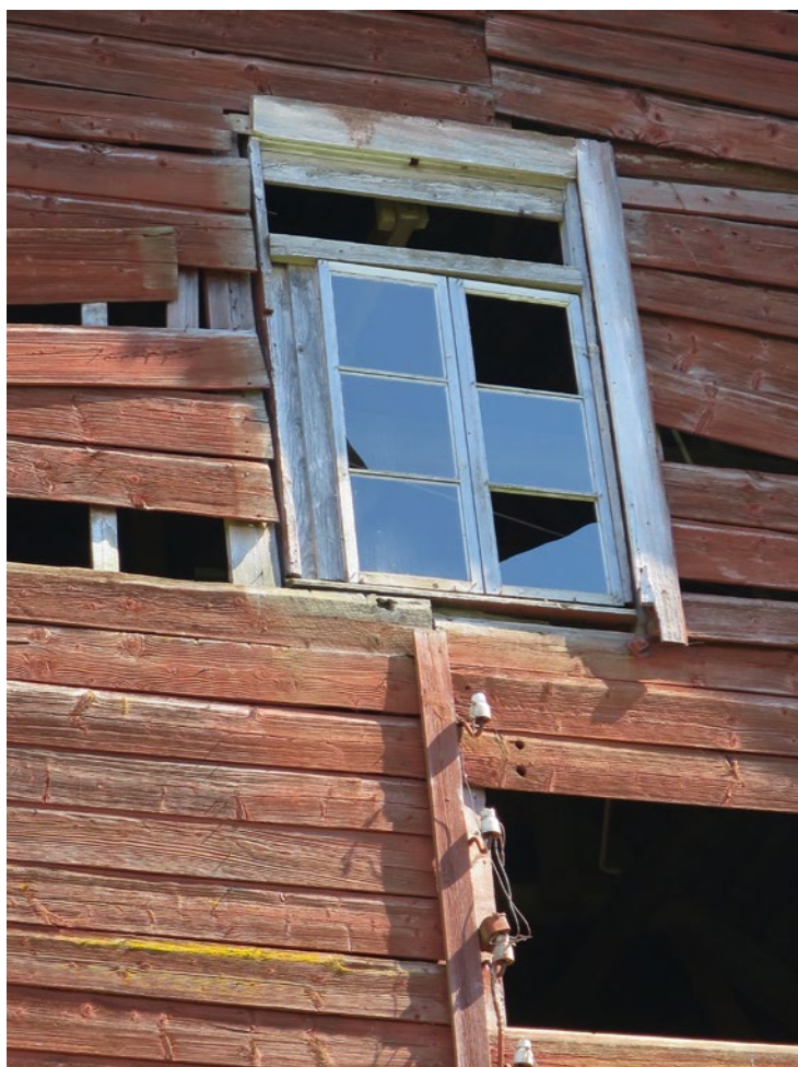
Gavelfönster före byte av fönsterbåge.