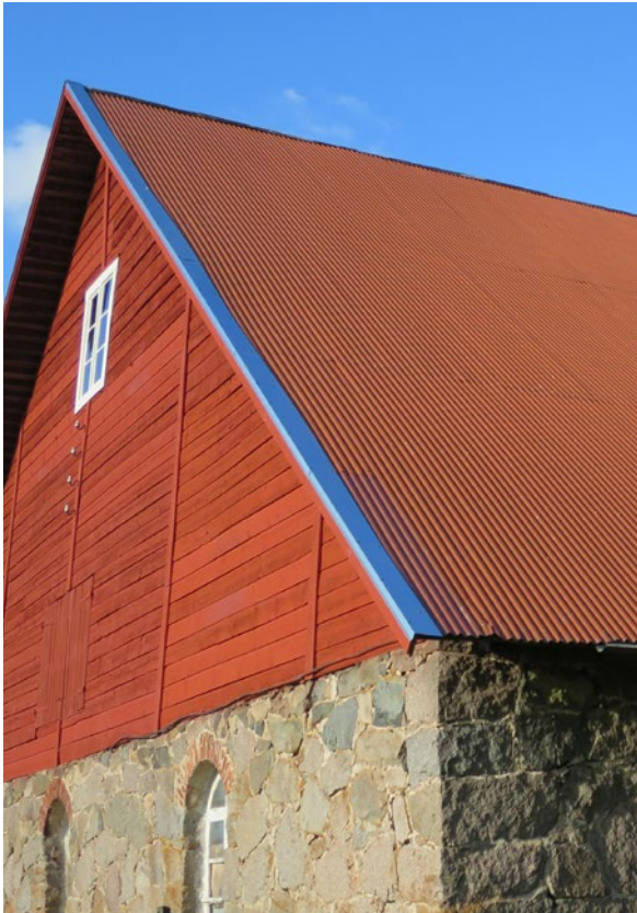
Detalj, ladugårdens södra takfall efter åtgärd.