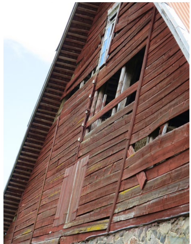
Ladugårdens västra gavel före åtgärd.