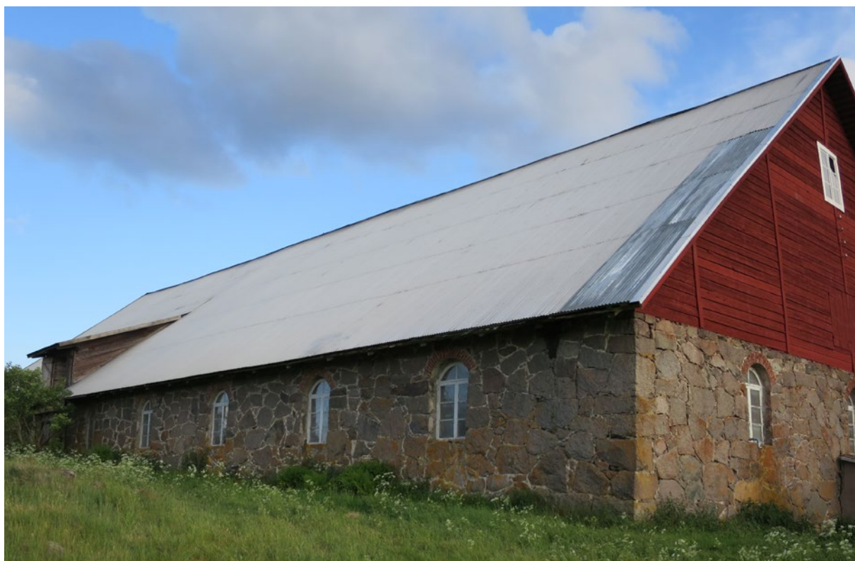
Ladugårdens norra takfall efter åtgärd.