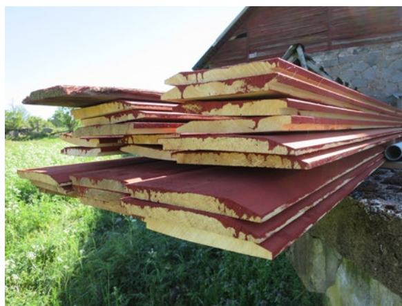
Nyttillverkad panel med fasning och spont lika originalet överst till vänster.