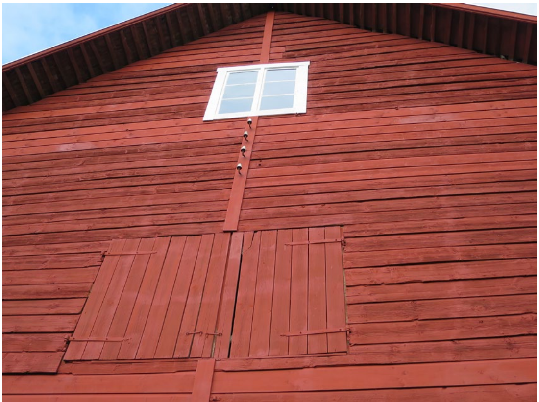
Ladugårdens västra gavel efter åtgärd.