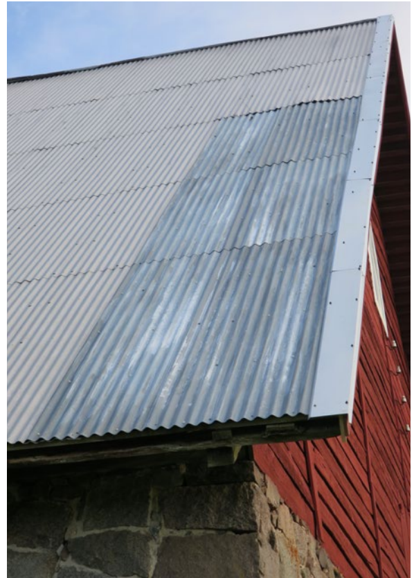
Detalj, ladugårdens norra takfall efter åtgärd.