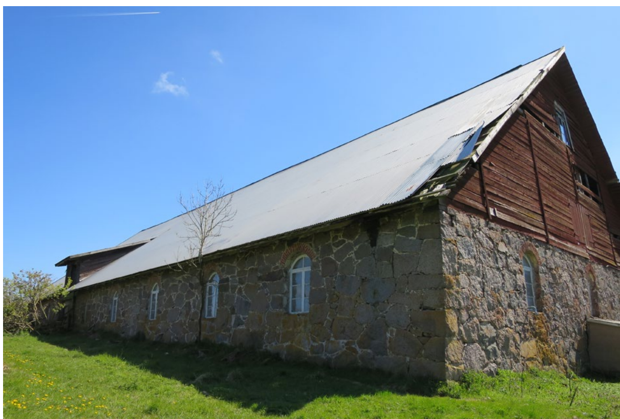
Ladugårdens norra takfall före åtgärd.