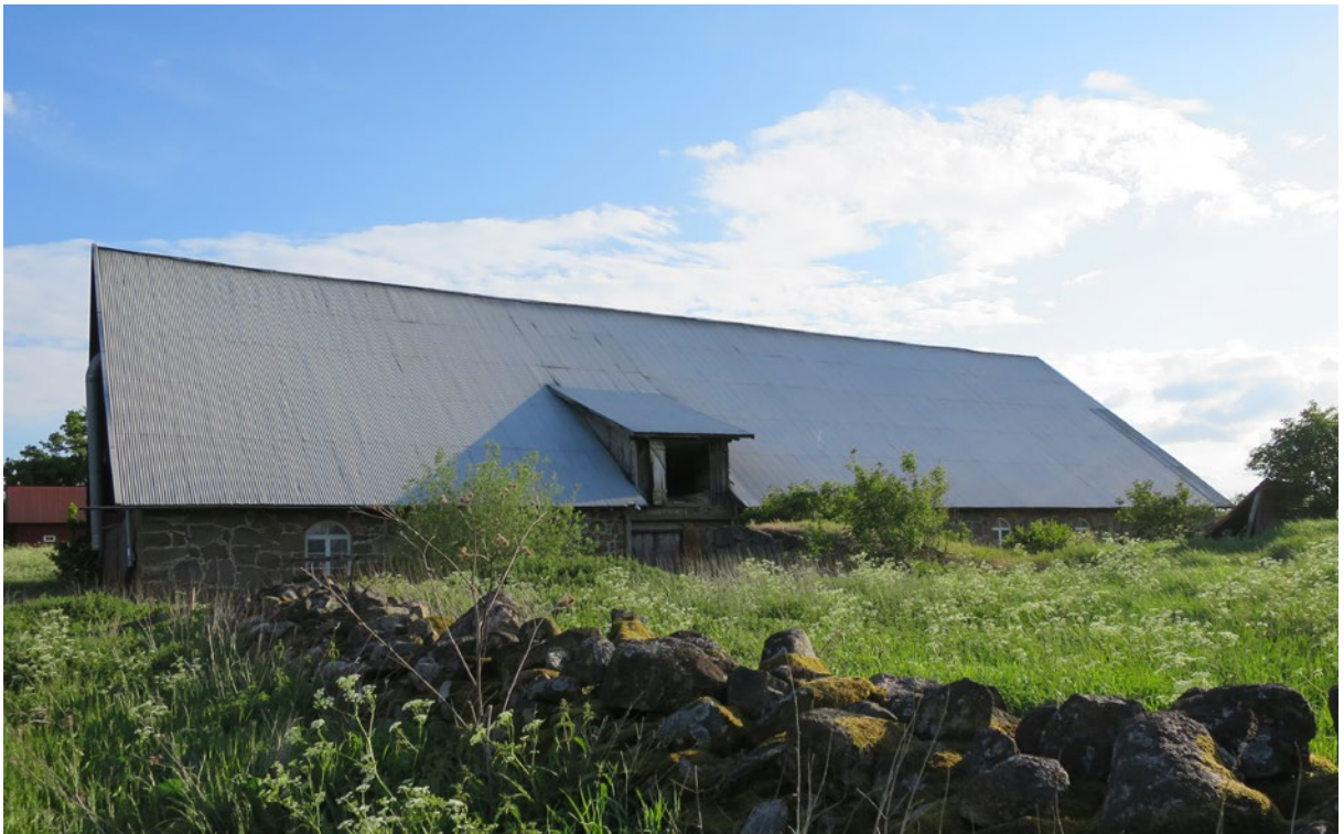
Ladugårdens norra takfall efter åtgärd.