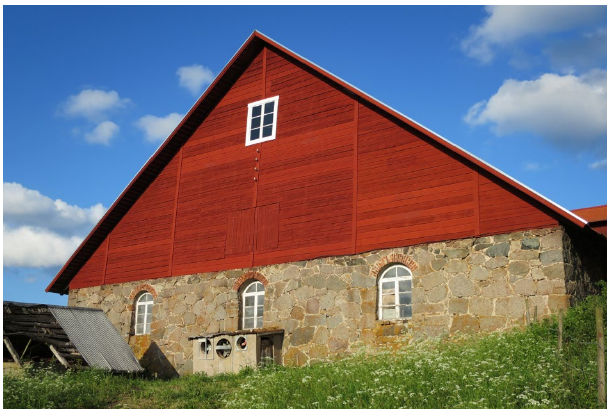
Ladugårdens västra gavel efter åtgärd.