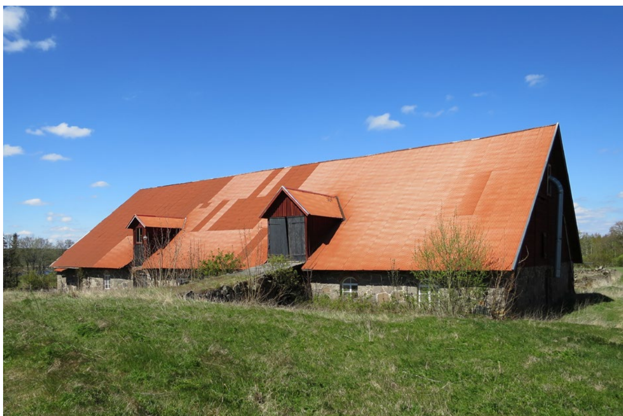
Ladugårdens södra takfall före åtgärd.