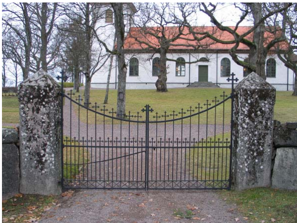
Huvudingången i söder (KI Långemåla kyrkog 133)

I norr: En enkel järngrind mellan granitstolpar.