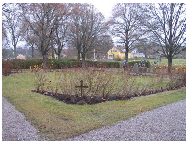
Minneslundan i ena hörnet syns minneskorsen över de tre personer som dog i en olycka vid Hornsö bruk på 1860-talet (KI Långemåla kyrkog 108)

Minneslundan invigdes 1996 och ligger centralt i den del som tillkom på 1950-talet och benämns kvarter N. Lundan utgörs av en rektangulär gräsmatta och den omges av en häck av spirea med en öppning mot i öster. Mitt på den västra sidan står en huggen grå granitsten med texten "minneslund". Runt om stenen är en liten planteringsyta.