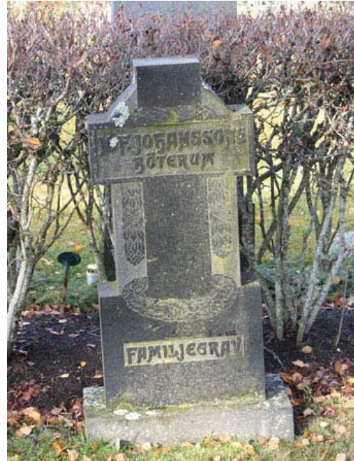
Klassicistisk vård i kvarter D från 1900-talets början (KI Långemåla kyrkog 034)