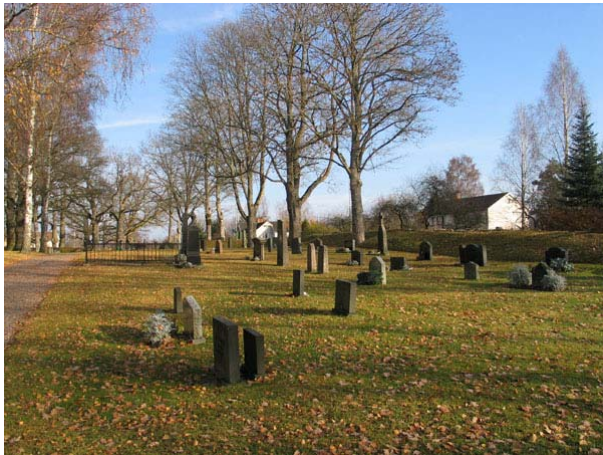
Översikt över kvarter F från söder (KI Långemåla kyrkog 046)