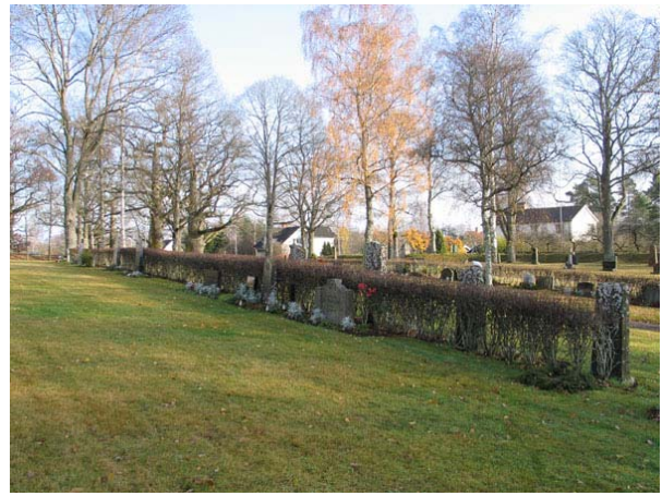
Översikt över kvarter D från sydväst (KI Långemåla kyrkog 027)