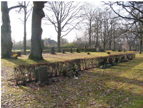
Kvarter A, närmast, och B från nordöst (KI Långemåla kyrkog 002)

Kvarter A och B ligger i den sydöstra delen utav kyrkogården. Kvarteren rymmer 47 respektive 61 gravplatser. Det faktiska antalet gravvårdar är mycket färre och flertalet gravvårdar har sannolikt på grund av ålder tagits bort. I kvarter A finns idag endast 15 och i kvarter B 10 gravvårdar. Kvarteren omgärdas i öster och söder av kyrkogårdsmuren. I väster finns en grusgång och i norr avgränsas området delvis av en grusgång samt gräsmatta. Vårdarna är vända mot norr och söder. Kvarter A består endast av två rader gravplatser där gravvårdarna är ryggställda med en häck av cotoneaster. I kvarter B finns gravvårdar längs kyrkogårdsmuren i söder och ytterligare en rad med ett fåtal vårdar. Hela området är idag insått med gräs. Inne på området växer två stora ekar.