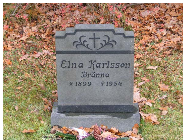
En av de första gravvårdarna på nya delen, kvarter M, rest 1954 (KI Långemåla kyrkog 087)

Kvarter J-P, R och S tillkom i och med utvidgningen i början av 1950-talet och ligger väster om kyrkan. En nivåskillnad finns mellan den gamla och den nya delen, där den nya delen ligger lägre än den gamla, detta löses genom en trappa. Kvarteren omgärdas i väster och norr av vallmuren som finns runt om hela kyrkogården. I öster är den gamla kyrkogårdsmuren