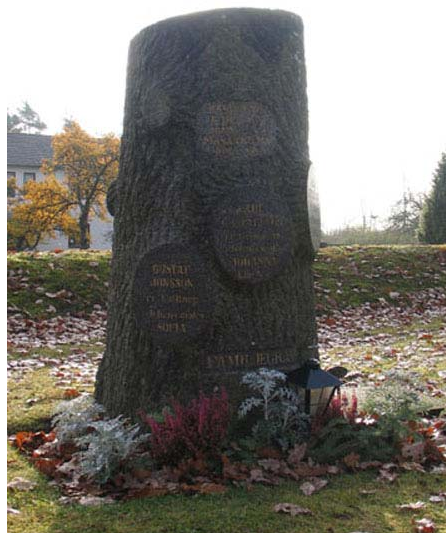
Karl-Emil Karlssons familjegrav Kvarter B (KI Långemåla kyrkog 009)