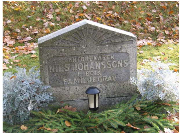
Mindre familjevård i kvarter F (KI Långemåla kyrkog 049)