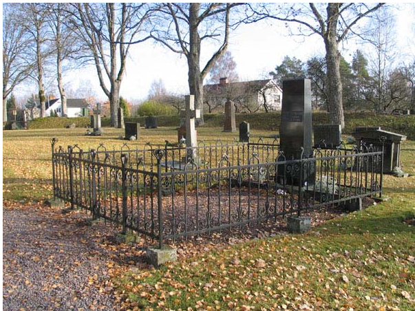
Gravplats omgärdad med smidesstaket i kvarter F. Familjegrav från tidigt 1900-tal (KI Långemåla kyrkog 049)