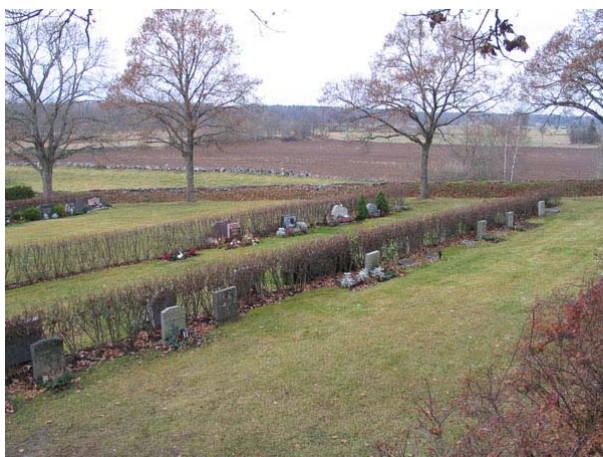
Översikt över kvarter M från sydost. Notera de små enkla linjegravvårdarna (KI Långemåla kyrkog 086)