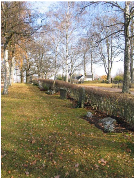
Översikt övar kvarter E från väster (KI Långemåla kyrkog 042)