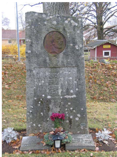
Granitvård med infällt porträtt i gjutjärn rest över häradshövding A.A. Engström, 1931 (KI Långemåla kyrkog 081)