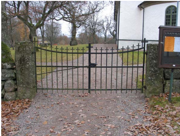
Ingången från parkeringen i öster (KI Långemåla kyrkog 131)