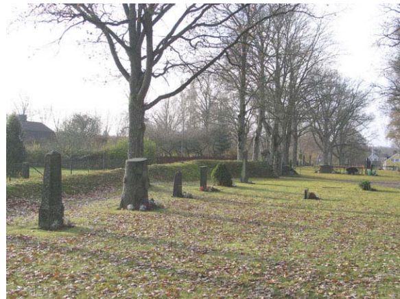
Höga stående gravvårdar längs muren i söder, kvarter B (KI Långemåla kyrkog 007)