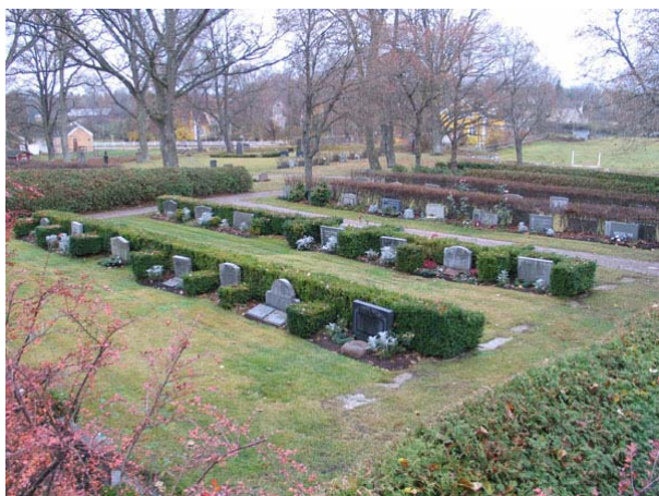
Översikt över kvarter L, O och S från nordost (KI Långemåla kyrkog 097)

bevuxen med berberis och i söder avgränsas den nya delen av häckar av tuja. Grusbelagda gångar avgränsar också de olika kvarteren. Kvarteren inramas av tujahäckar och längsgångarna är det lindträd planterade. Samtliga gravvårdar är placerade i rader och flertalet är vända mot öster eller väster. Cotoneaster eller buxbom har använts som rygghäckar. De flesta platser är planerade för kistgravar men här finns även ett urngravskvarter, kvarter R och en minneslund, kvarter N. Den äldsta gravvården i området är en linjegravvård från 1954, kvarter M. Kvarter M, K, L samt R togs i bruk under 1950-talet. Sedan påbörjades kvarter O på 60-talet följt av kvarter P och S på 70-talet och därefter på 80-talet kvarter M. Minneslund, kvarter N, invigdes 1997.