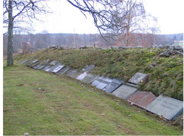
Vårdar tagna ur bruk förvaras längs muren i norr (KI Långemåla kyrkog 137)