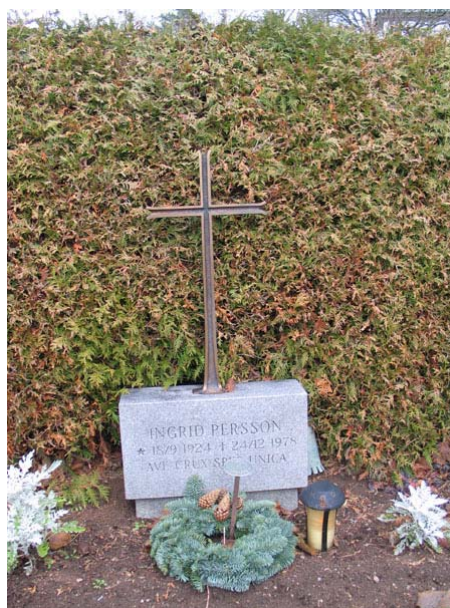
Modern vård i grå granit med kors av koppar i kvarter P. Rest 1978 (KI Långemåla kyrkog 117)