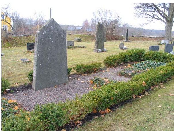
Kyrkogårdens äldsta gravvård, 1818, över "Lantmannen" N. Engström (KI Långemåla kyrkog 084)

I kvarteren fanns redan när den tidigare kyrkans stod på platsen påkostade familjegravar. Det vittnar till exempel "lantmannen" N. Engströms familjegrav bland annat om. Kvarteret har sedan brukats under hela 1900-talet och äldre gravplatser har utgått och ersatts av nya begravingar vilket skapat en stor variation av gravvårdar. Grusgraven vilken omgärdas av en låg buxbomshäck samt de övriga vårdarna från 1800-talet, som finns kvar i området utgör en viktig länk till kyrkogårdens historia och bör därför långsiktigt bevaras på plats.