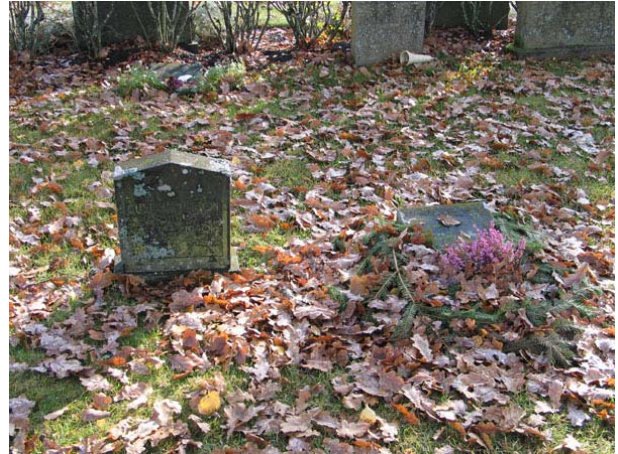
Linjegravvårdar i kvarter C (KI Långemåla kyrkog 017)