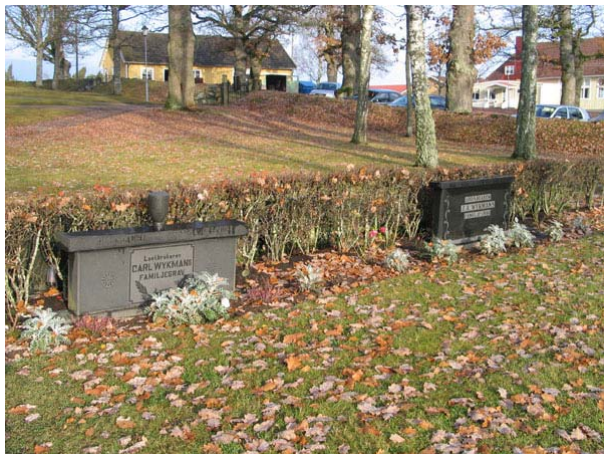
Klassicistiska vårdar i Kvarter A. Tidstypiska för perioden 1930-40-tal (KI Långemåla kyrkog 005)

i form av en kraftig trädstam, i kvarter B. De äldsta vårdarna i kvarteren är från 1906, i kvarter A, respektive 1902 i kvarter B. I kvarter A anges den dödes yrkestitel på hälften av vårdarna medan det i kvarter B inte uppges på någon vård. De titlar som finns i kvarter A är; kyrkvärden, byggmästaren, godsägaren, lantbrukaren och friherrinnan. På hälften av vårdarna nämns den dödes hemort.