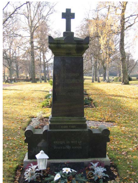
Kyrkvården C.A Löfgrens familjegrav i kvarter E rest 1926 (KI Långemåla kyrkog 037)