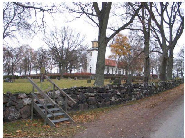
En enkel trappa leder in på kyrkogården i sydväst (KI Långemåla kyrkog 134)