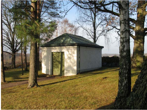
Kapellet i norra delen av kyrkogården (IMG_0968)