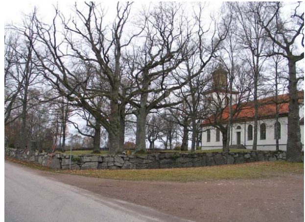
Omgärdning i form av kallmurad vallmur av natursten (KI Långemåla kyrkog 132)