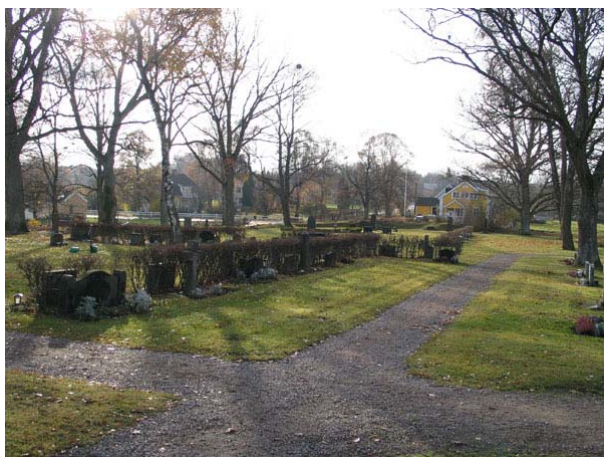
Översikt över kvarter G från nordost (KI Långemåla kyrkog 061)