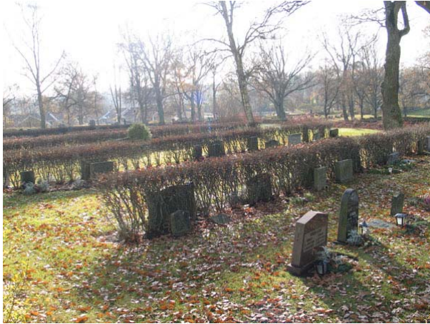
Översikt över kvarter C från nordost (KI Långemåla kyrkog 015)