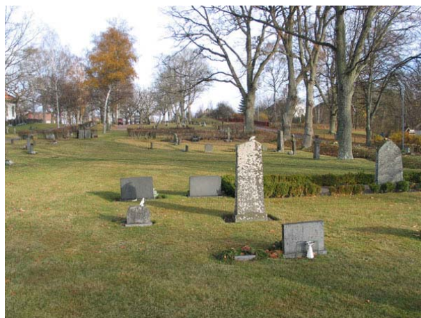
Översikt över kvarter H från väster (KI Långemåla kyrkog 073)