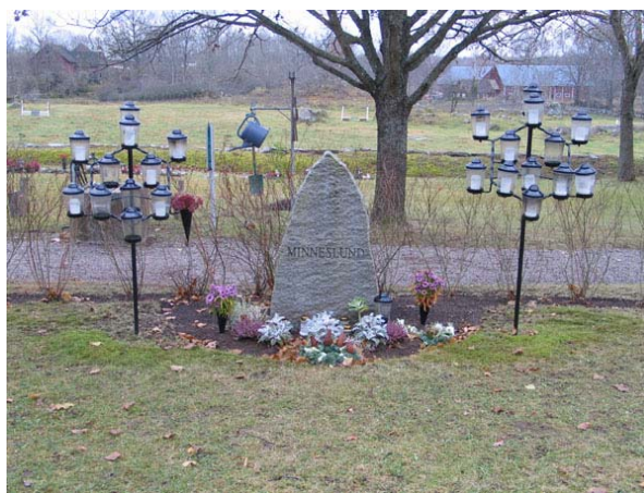
Granitstenen med inskriptionen "Minneslund" i minneslundan (KI Långemåla kyrkog 110)