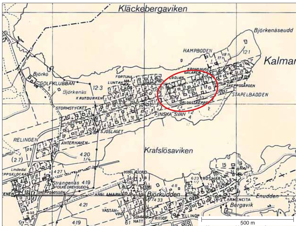
Fig 1. Utdrag ur ekonomiska kartan med undersökningsområden markerade med rött..

I mitten av 1980-talet skulle hela Björkenäsområdet, Kläckeberga socken, Kalmar kommun, Småland, bebyggas med permanentbostäder. Med anledning av detta skulle Kalmar kommun gräva för VA – ledning och utbyggnad av gatunätet. Kalmar läns museum genomförde därför en antikvarisk kontroll vid två tillfällen under 1985.