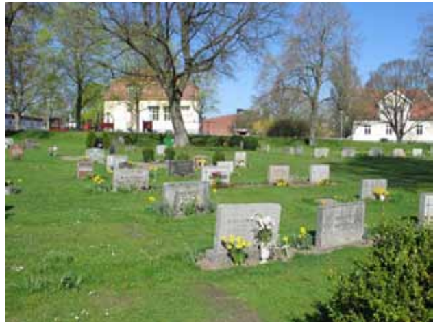
Gråa rektangulära vårdar är vanliga i kv C (KI Ljungby kyrkog 063)