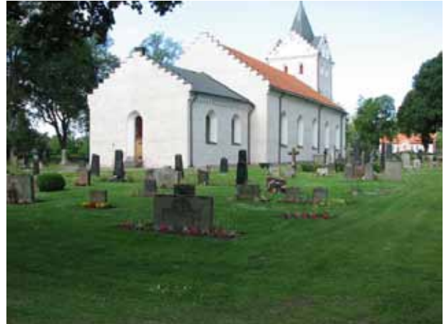
(KI Ljungby kyrkog 112)