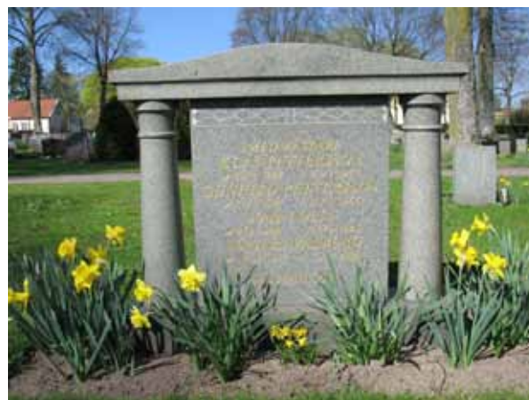
Klassicerande vård rest över smedmästare Petterssons familj (KI Ljungby kyrkog 077)