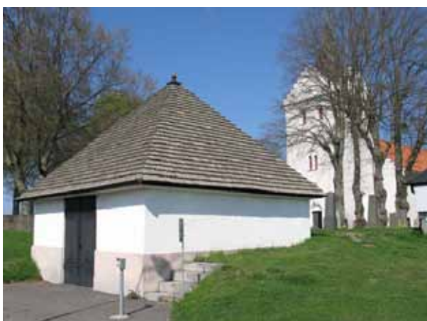
Bårhuset i SV hörnet, var tidigare vedbod som byggdes om på 1940-talet (KI Ljungby kyrkog 016)

Söder om bårhuset ligger förråd, garage och personalutrymmen i byggnader av trä med plåttak. När byggnaderna uppfördes är inte känt men de tillbyggdes på 1990-talet.