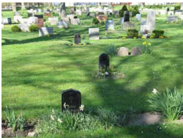
I kv D fanns rester efter ett linjegravsområde från slutet av 1920-talet till slutet av 1940-talet (KI Ljungby kyrkog 074)