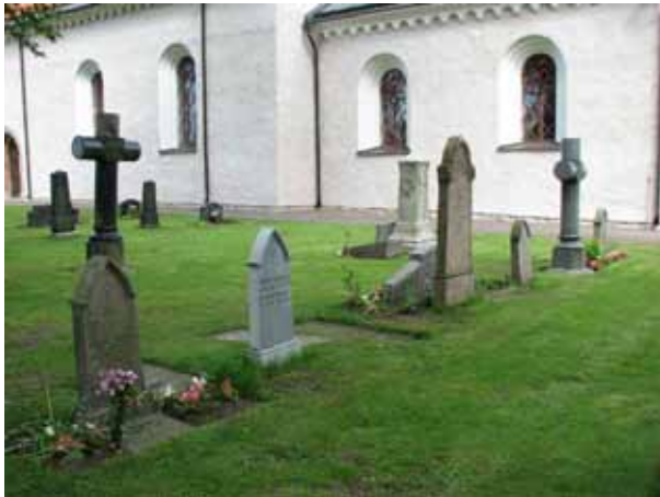
Fem kalkstensvårdar i samma rad söder om kyrkan kv H (KI Ljungby kyrkog 197)