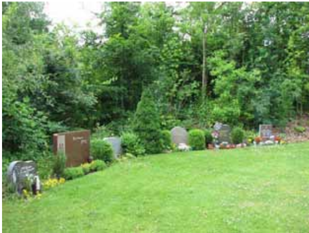
Urgravskvarteret, kv L (KI Ljungby kyrkog 239)