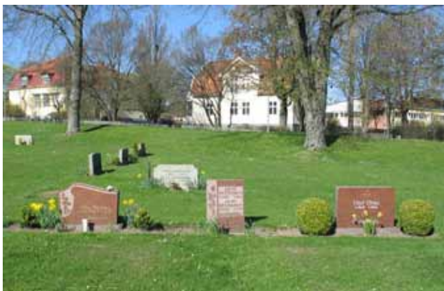
Vanlig typ av vårdar i kv A (KI Ljungby kyrkog 036)

De vanligaste vårdarna i kvarteren är låga rektangulära stenar. De fåtal vårdar som finns kvar i linjegravsområdet, från 1950-talet, är mindre, enkla svarta granitvårdar. Linjevårdarna från 1960-talet är lite större och oftare i grå granit. Grå granit men även röd är det dominerande materialet. I urngravskvarteren, kvarter A, är alla utom en sten liggande. I kvarter B finns en, av de två platser, som fortfarande har grusad gravplan på kyrkogården. I övrigt är hela området besatt med gräs men vissa vårdar står i öppen rabatt.