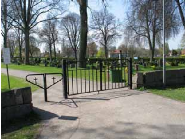
En modern grind där landsvägen gick före 1940-talet (KI Ljungby kyrkog 002)