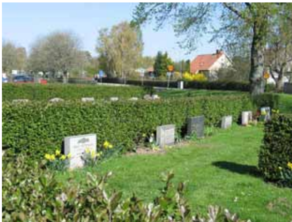
Del som utvidgats ev omlagts i ett senare skede. Familjegravar mot rygghäckar av häckoxel (KI Ljungby kyrkog 049)

Vattenarrangemang samt nytillkomna delar med häckar av ölandstok