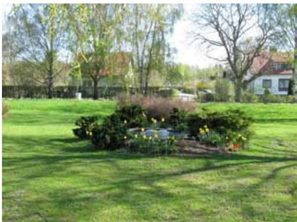
I kv B fanns en liten fontän omgiven av buskar (KI Ljungby kyrkog 044)

Se vidare i de enskilda kvartersbeskrivningarna.