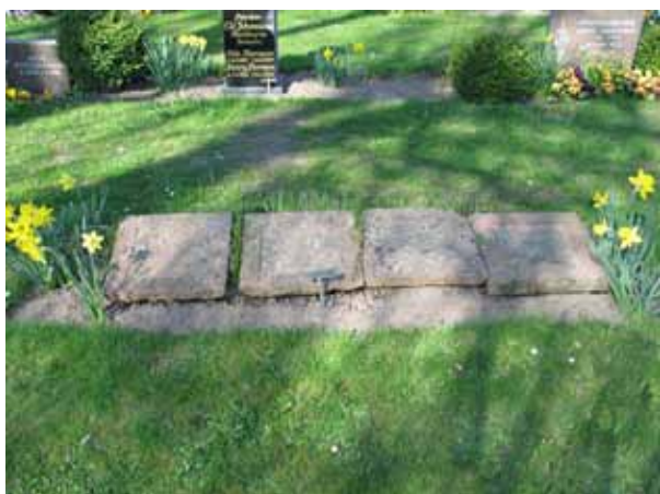
Liggande vårdar av kalksten, kv D (KI Ljungby kyrkog 072)