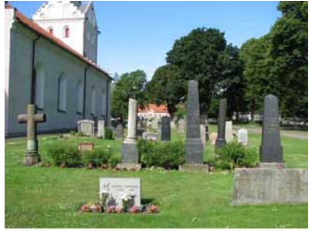
Många av vårdarna runt kyrkan är stående (KI Ljungby kyrkog 121)