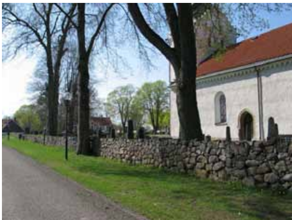
Muren mellan gamla och nya delen är lagd med mindre natursten (KI Ljungby kyrkog 028)

Den nya kyrkogården kringgärdas av naturmark, förutom i väster där den angränsar till prästgårdsparken.