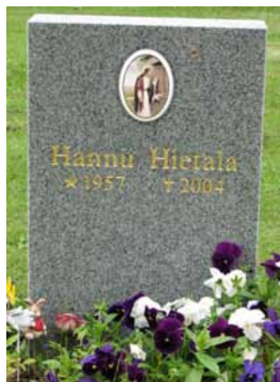
En modern vård med bild av Jesus (KI Ljungby kyrkog 217)

Att ange den dödes yrkestitel är mycket vanligt framförallt på de lite äldre vårdarna. Titlarna visar på högre tjänstemannatitlar som till exempel; häradshövdingen, konsulent, kronfogden, tullförvaltaren, kapten vid kungliga Jönköpings regemente, biskop, rådmannen, kyrkoherden, kontraktsprosten samt borgmästaren och översten. Den vanligaste titeln är dock lantbrukaren. Övriga titlar som visar på näringar och yrken i trakten är: majoren, handlaren, lärarinnan, mejeristen, assessorn, gjutaren, sjökaptenen, nattvakten, rättaren, snickaren, handelsresanden, hemmansägaren, godsägaren, smedmästaren, agronomen, maskinisten, krigsrådet, fabrikören, taktäckaren, virkeshandlanden, åldermannen, kyrkvården, hembygsvårdaren och läraren, trädgårdsmästaren, murarmästaren, disponenten, överstelöjtnanten, förlagsdirektören, sjuksystemen, stationsföreståndaren, folkskolläraren, kantorn, kyrkvaktaren, slöjdaren, lokföraren, rektorn, skeppsredaren, läroverksadjunkten, trotjänarinnan, stationsinspektören, mästerlotsen, kvarnägaren, civilingenjören, provinsialläkaren och coopverdie captenen (gammalt namn för sjökaptenen).