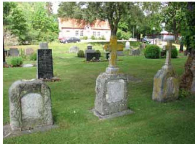
Tre likadana vårdar med kors i marmor. Den längst till vänster har tappat sitt kors (KI Ljungby kyrkog 171)