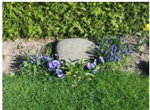
Liggande vård i urngravsområdet i kv A (KI Ljungby kyrkog 039)