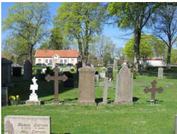
Tidigare hade familjegraven en omgärning, kv E. Släktingar till Olof Palme (KI Ljungby kyrkog 085)