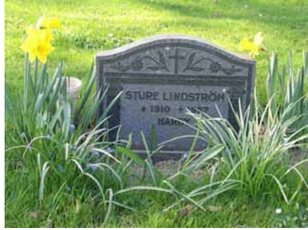
Tidstypisk linjegravvård från 1950-talet, kv B (KI Ljungby kyrkog 046)