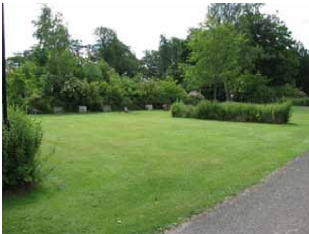
Översikt över delar av nya kyrkogården (KI Ljungby kyrkog 222)

Den nya delen anlades och togs i bruk i slutet av 1990-talet. Området är beläget omedelbart söder om den äldsta delen av kyrkogården. I söder och sydost begränsas området av Ljungbyån och i öster ligger prästgården. Mot söder vidtar en blandad lövskogsvegetation av bland annat ek, bok och ask. Tre av kvarteren används för kistbegravningar och kvarter L är ett urngravskvarter. Här finns också en minneslund, kvarter M, i öster. Hela området är besätt med gräs. Måbärsbuskar har använts för att skapa de olika rummen i området. Nya delen har bara delvis tagits i bruk.