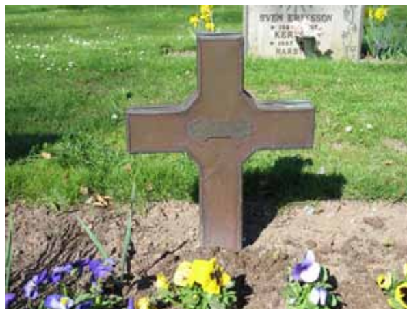
Vård av plåt. Rest 1985 över Tyra Karlsson (KI Ljungby kyrkog 058)