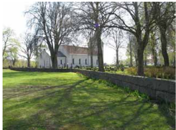
Muren runt de nyare delarna är lagd av huggen sten (KI Ljungby kyrkog 003)