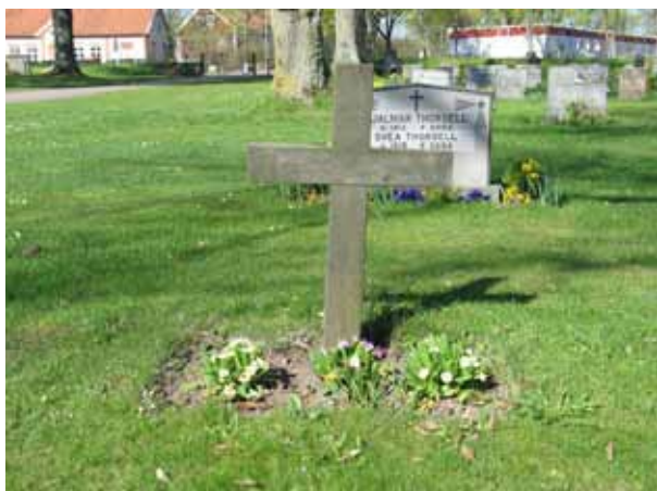
Trävård, rest 1963, i kv C (KI Ljungby kyrkog 057)

Kvarter C och D ligger också norr om kyrkan och tillkom i samband med utvidgningen 1904. Kvarteren avgränsas i öster och väster av kyrkogårdsmuren och i söder av en asfalterad gång. I norr utgör häckar av tuja gräns mot kvarter A och B. Mellan kvarter C och D går en asfalterad gång. Hela kvarteret är insått med gräs och vårdarna står antingen i gräs eller i öppna rabatter. Kvarteret användes från början till linjegravar och spår kan ännu ses efter ett linjegravsområde i kvarter D. Vårdarna är vända mot öster, väster eller söder.