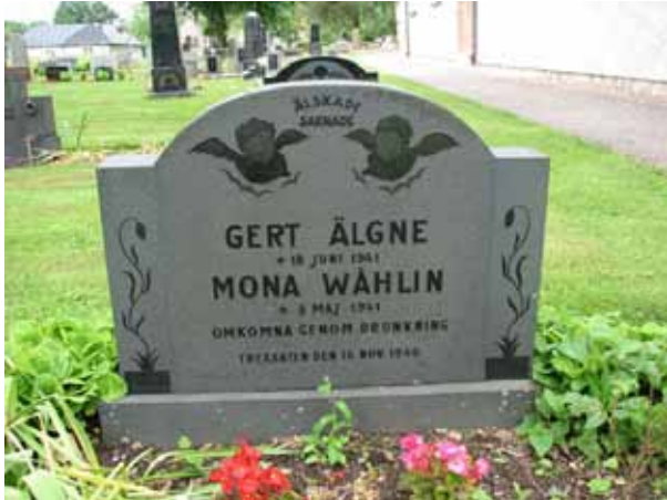
En tragisk händelse i socknen på 1940-talet (KI Ljungby kyrkog 206)