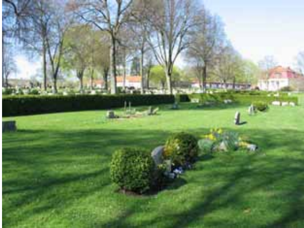
I kv B fanns tidigare ett linjegravsområde. Nu är de flesta vårdarna av denna typ borttagna (KI Ljungby kyrkog 045)

På övervägande delen av vårdarna anges vilken by eller gård som varit den dödes hem. Titlar förekommer på en mindre andel av vårdarna, men inte på någon i den del som är urngravsområde. Titlar som finns är: hemmansägaren, lantbrukare, möbelsnickaren, sjöman, folkskolläraren, fabrikör, länsskogvaktare, småskollärare, kyrkvård, agronom, rektorn o kantorn, lärarinnan, kommunalråd, linjemästaren, båtsmannen, järnvägsmannen, trädgårdsmästaren och rörentreprenören.