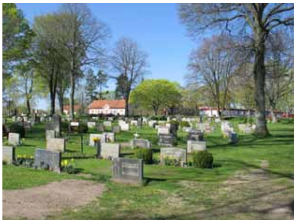
Översikt över kv C från SV (KI Ljungby kyrkog 053)