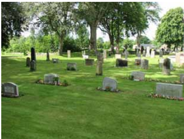
Översikt över kv H (KI Ljungby kyrkog 180)