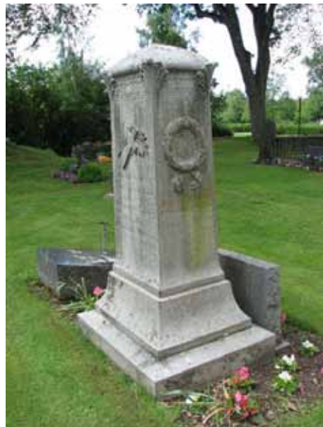
Ovanlig vård rest 1923, kv H. Inskriptioner finns på alla sidor (KI Ljungby kyrkog 205)