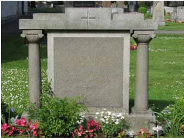
Vård klassicistisk stil i kv F (KI Ljungby kyrkog 117)

På övervägande delen av vårdarna har man skrivit ut den dödes hemort.