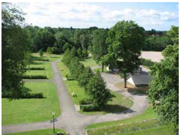
Gångsystemet på den nytillkomna delen är lite mjukare än på de äldre delarna (KI Ljungby kyrkog 164)