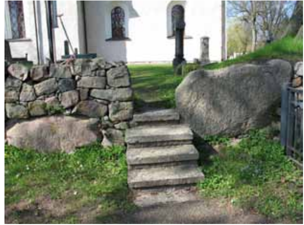
Liten trappa genom kyrkogårdens södra mur (KI Ljungby kyrkog 027)

I norr finns endast en ingång. Mellan stolpar av granit är en svartmålad dubbel järngrind.