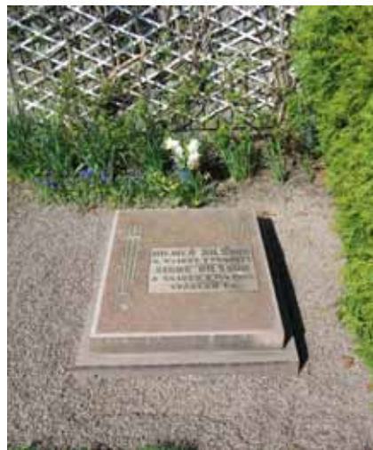
Liggande gravvård med grusad gravplan. En av två grusade gravplatser på kyrkogården, kv B (KI Ljungby kyrkog 050)