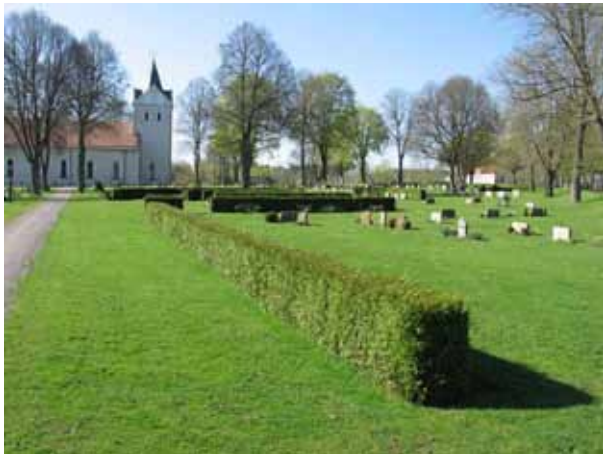
Översikt över kvarter A från S (KI Ljungby kyrkog 033)

Kvarter A och B ligger norr om kyrkan, på den del som utvidgades på 1940- talet. Kvarteren omgärdas av kyrkogårdsmuren i öst, väst och norr. I söder avgränsar häckar av buxbom mot de övriga kvarteren. Kvarteren är indelade i ”rum” med hjälp av häckar av tuja eller häckoxel. I den nordöstra delen finns även ett vattenarrangemang och buskar av ölandstok. Området delas av en asfalterad gång i nord – sydlig riktning. Vårdarna är vända åt norr, söder, öster eller väster. I kvarter B finns det rester efter ett linjegravsområde från 1950-1960- tal. Området har inte använts fullt ut.