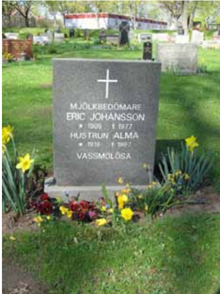
Ovanlig titel på vård från 1970-talet i kv C (KI Ljungby kyrkog 062)