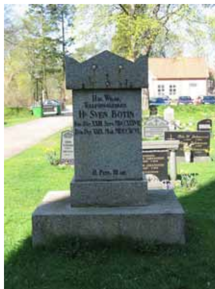
Kyrkogårdens äldsta bevarade vård finns i kv E rest över Sven Botin år 1796 (KI Ljungby kyrkog 093)

Majoriteten av vårdarna är av svart eller grå granit men även röd förekommer. Det är också vanligt med vårdar av kalksten. Utöver dessa material finns tre vårdar av sandsten och marmor, fyra av marmor, varav en är en avbruten pelare, fem gjutjärnsvårdar, en modern vård av smide, samt en granitvård med textplatta av marmor. Flera av vårdarna är stora och korsformade. Det finns också vårdar med nationalromantiska influenser liksom en del med klassicistiska stildrag. Troligen har samtliga äldre familjegravplatser tidigare varit omgärdade och belagda med grus. Idag finns endast en av dessa kvar. Det är en gravplats omgärdad av ett smidesstaket runt om den liggande granitvården rest över, Oskar Trädgårdh och hans familj, år 1914. I hörnen på den liggande vården är det runda kopparhandtag. Kvarterens äldsta vård är den redan tidigare nämnda vården över tullförvaltaren från 1700-talet. I övrigt finns det 34 gravvårdar som dateras till 1800-talet. Den äldsta av dem är en kalkstensvård rest 1843 i kvarter E. Gravvårdar från 1930-40 samt 1980-talet dominerar för övrigt i området.