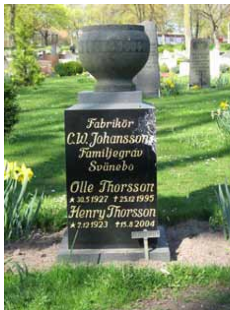
Sentida vård i äldre utförande alternativt återanvänd, kv D (KI Ljungby kyrkog 073)