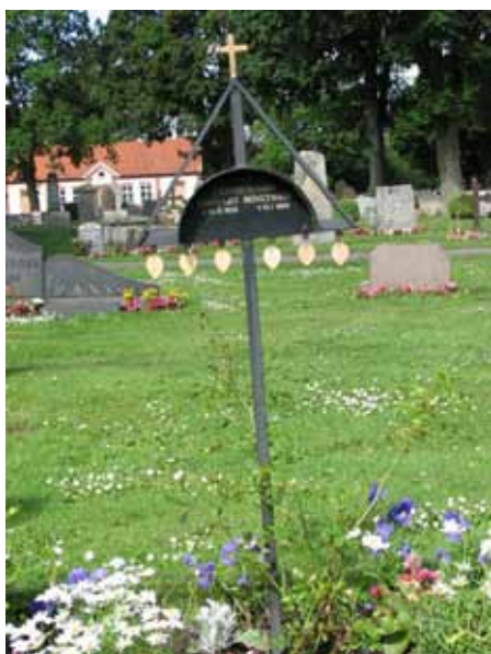
Modern vård i smide (KI Ljungby kyrkog 118)