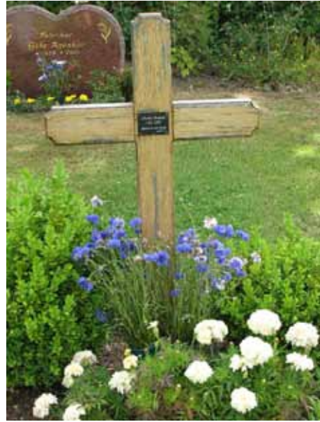
En vård är av trä med metallskylt (KI Ljungby kyrkog 232)