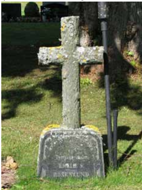
Korsformad vård som efterliknar en trädstam över trotjänarinnan Emelie S (KI Ljungby kyrkog 150)

Sandstensvårdarna med marmorkorsen samt en del av kalkstensvårdarna är i behov av översyn och konservering.