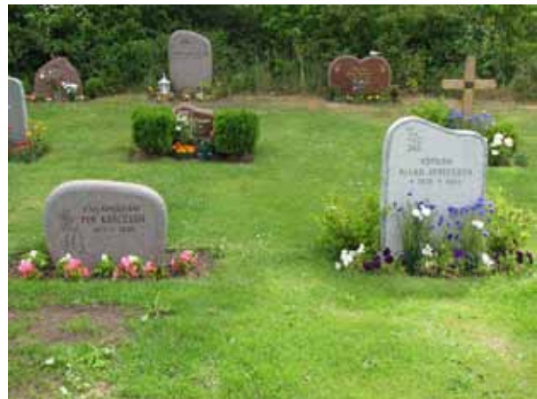
Olika typer av moderna vårdar (KI Ljungby kyrkog 231)