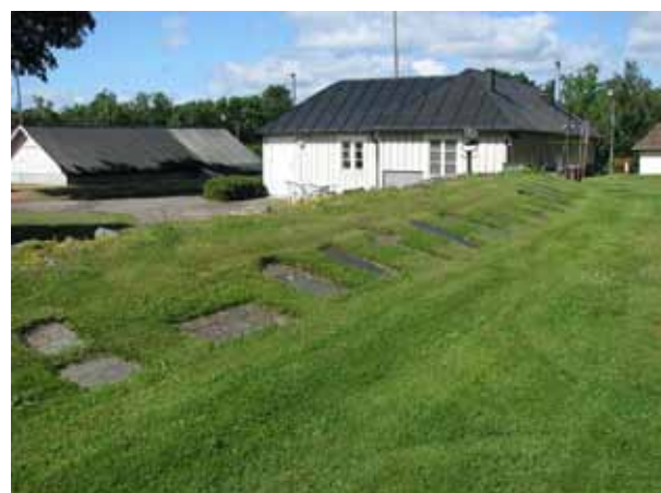
Gravvårdar tagna ur bruk ligger i vällen mellan den gamla och nya delen (KI Ljungby kyrkog 138)