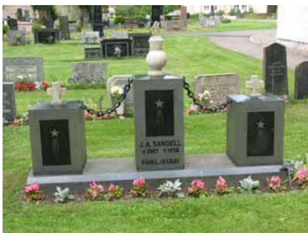
Vården har sannolikt varit omgärdad med kedja och pollare (KI Ljungby kyrkog 214)