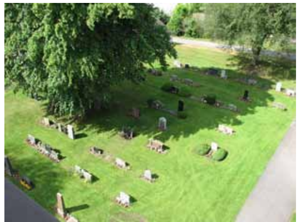
Översikt över den västra delen av kv G (KI Ljungby kyrkog 153)