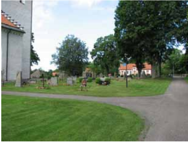
Översikt över kv E (KI Ljungby kyrkog 111)

landsvägen förbi kyrkan. Vid utvidgningen på tidigt 1900-tal införlivades den som en del av kyrkogården och vägen kom att flyttas. Kvarteren runt kyrkan utgjordes tidigare av grusgravområden med omgärdningar men idag är hela området insått med gräs och vårdarna står i gräs eller i öppna rabatter. De är vända företrädesvis mot öster eller väster men några enstaka är vända mot söder.