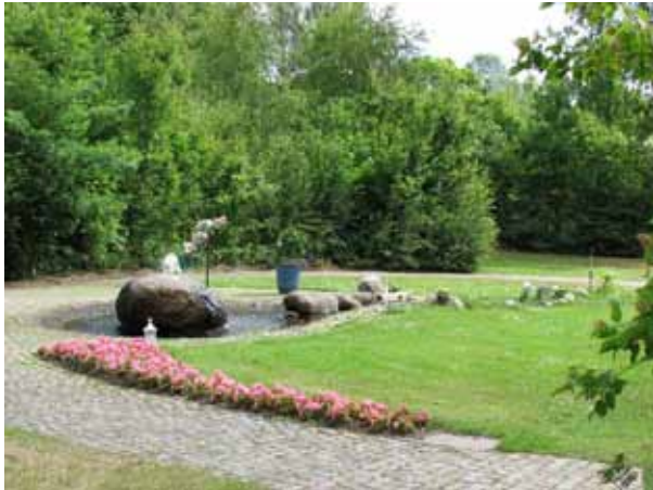
I minneslundan finns en springbrunn och en bäck (KI Ljungby kyrkog 234)