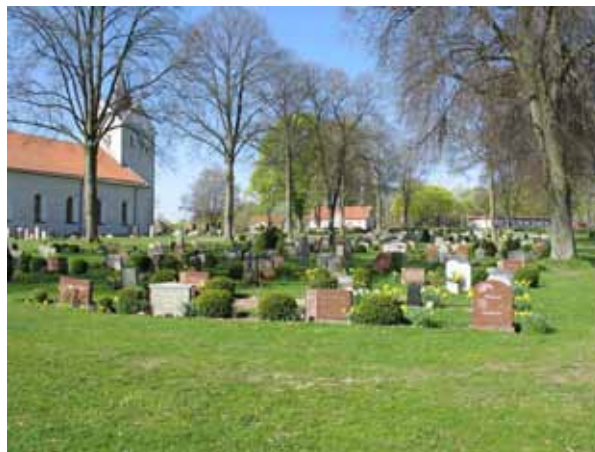
Översikt över kv D (KI Ljungby kyrkog 069)