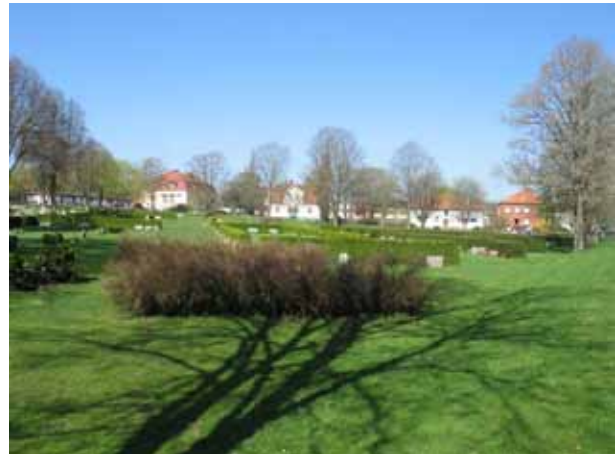
Översikt över kvarter B från SV (KI Ljungby kyrkog 043)