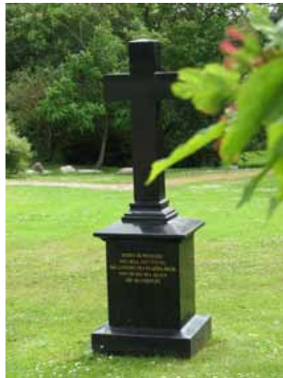
På en svart vård står i det sydvästra hörnet är bibelcitatet "Herren är min herde ..." ingraverat (KI Ljungby kyrkog 236)