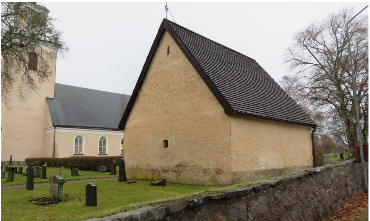
Bårhusets södra östra västra fasad före åtgärd.