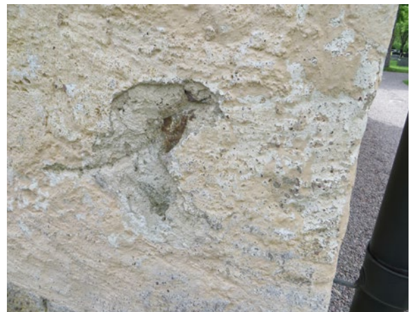
Bårhuset före åtgärd. Exempel på skador i putsen.

Bårhusets fasader är putsade med ett tjockt lager kalkbruk ovanpå ett lager med lerhaltigt bruk samt avfärgad i en ljus ockraton, samma som kyrkan. Det äldre bruket hade viss inblandning av tagel. Det fanns en del lagningar sedan tidigare renoveringar varav flera var utförda med cementhaltigt bruk. Sockeln är i betong sedan någon sentida renovering och avfärgad i en grå ton. Fasaderna har en speciell struktur med en slevdragen yta. Det fanns behov av renovering p g a partiellt putsbortfall och algpåväxt.