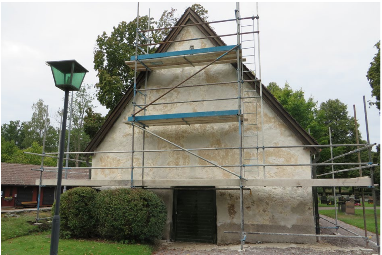
Bårhusets östra fasad under pågående åtgärd.