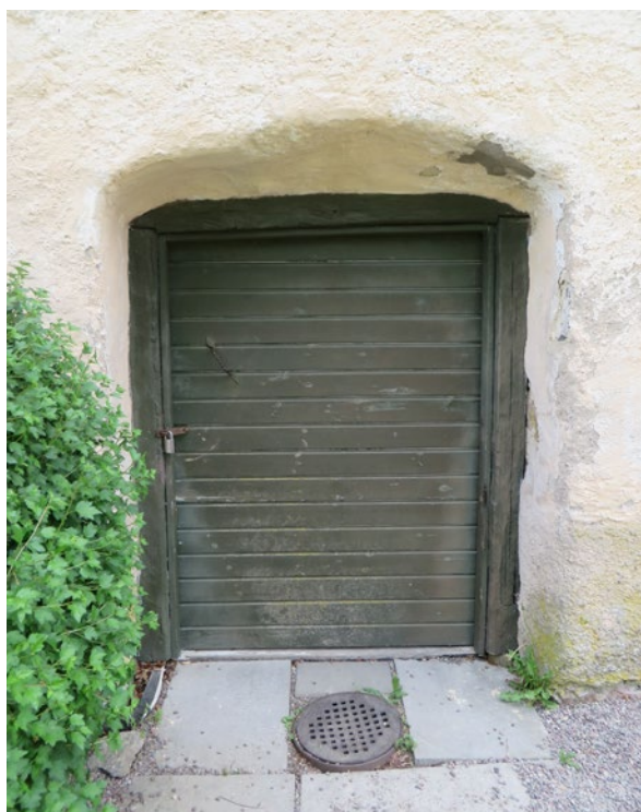
Porten in till bårhuset före åtgärd.