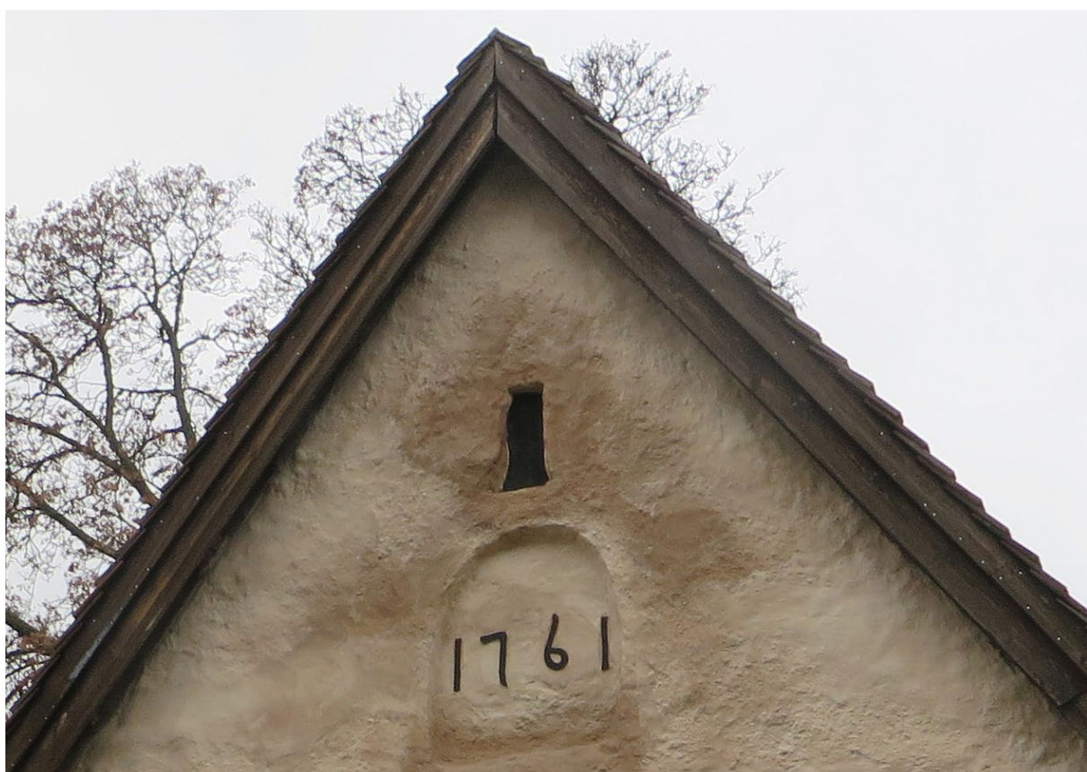
Luckan på östra gaveln med året 1761 efter åtgärd.