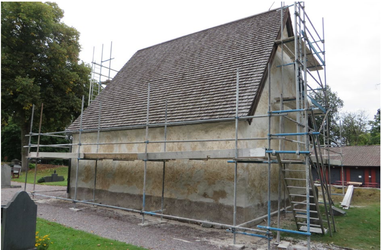
Bårhuset under pågående åtgärd. Här har putslagningar utförts på fasaderna.