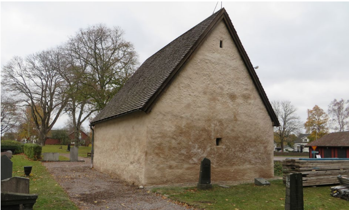
Bårhusets västra respektive norra fasad efter åtgärd.