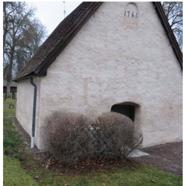
Bårhusets östra och södra fasader efter åtgärd.

Hängrännan av koppar mot söder var trasig. Denna löddes ihop.