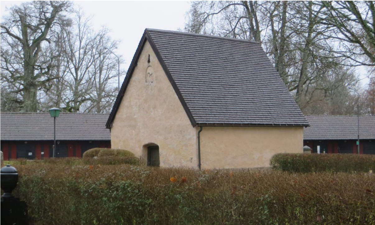
Bårhusets norra och östra fasad före åtgärd.