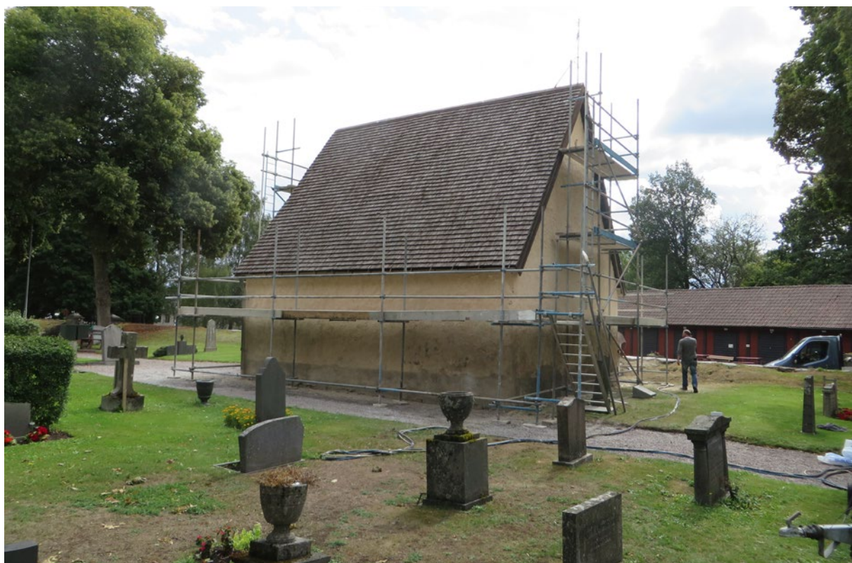
Bårhuset under pågående åtgärd. Ställningar är uppe, fasaden har rengjorts och lös puts har knackats ner.