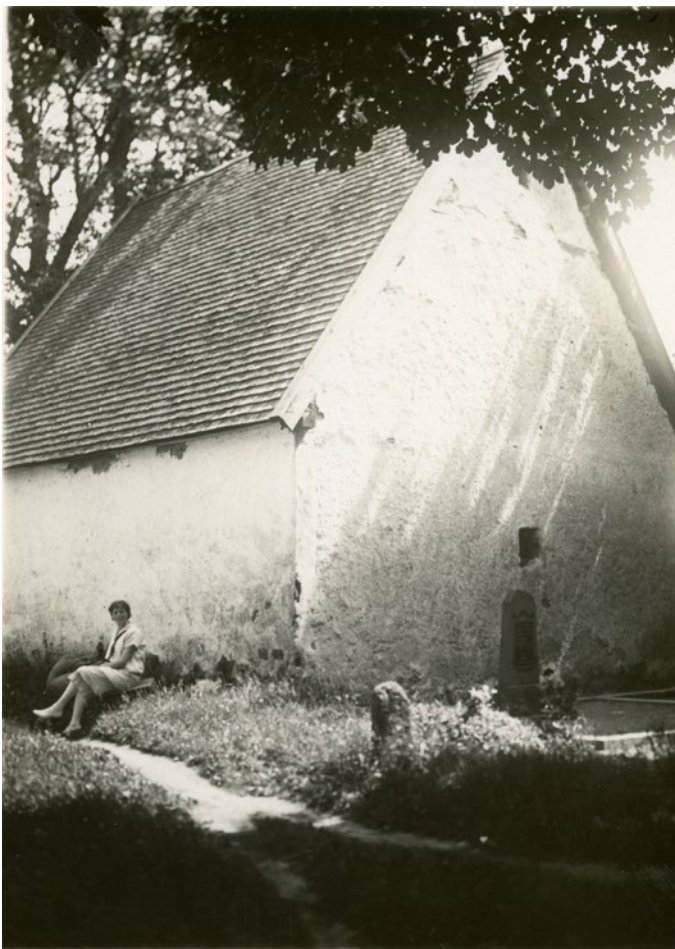
Bårhuset på Madesjö kyrkogård. Odaterat fotografi ur Kalmar läns museums arkiv.

Bårhuset skyddas av 4 kap Kulturmiljölagen.