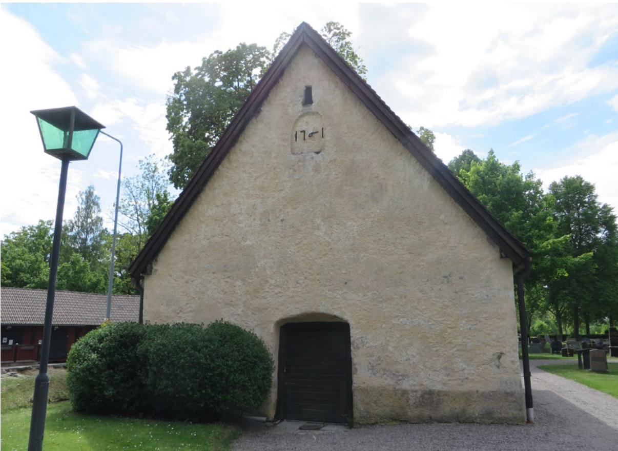
Bårhusets östra fasad före åtgärd.