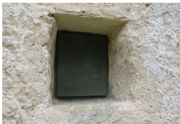
En av luckorna före åtgärd.