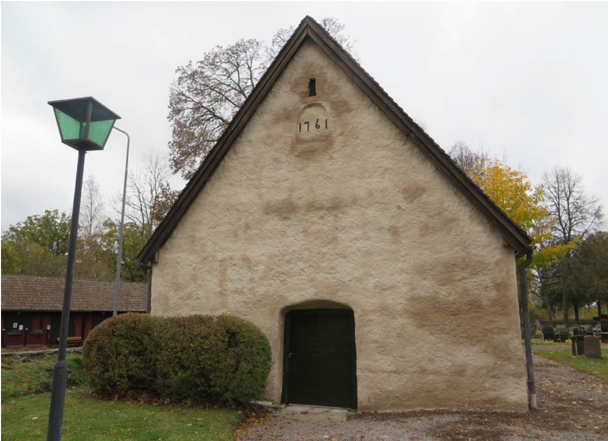
Bårhusets östra fasad efter åtgärd.