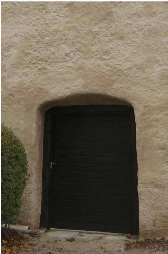
Porten efter ommålning.

Port, luckor, beslag, och gångjärn målades med linoljefärg från Engwall & Claesson en mörkt grön kulör (NCS S 8005-G80Y). Som grundfärg på beslag och gångjärn användes klassisk linoljebaserad blymönja från Introteknik AB. Träytor rengjordes, skrapades och slipades lätt. Trärena ytor grundmålades med linoljefärg i samma mörkgröna kulör som innan, förtunnad enligt tillverkarens anvisning. Mellanstrykning och färdigstrykning utfördes två gånger med oförtunnad linoljefärg.