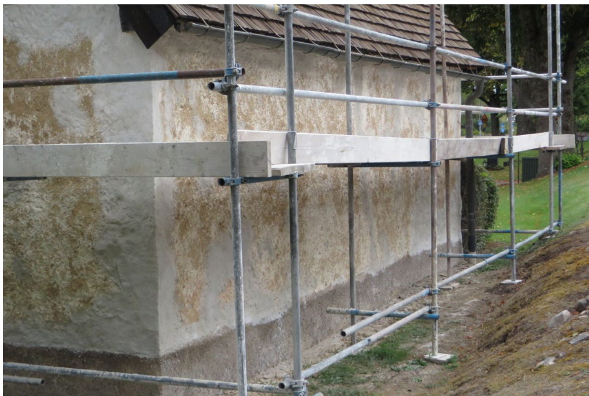
Bårhuset under pågående åtgärd. Utförda putsläggningar på södra fasaden.