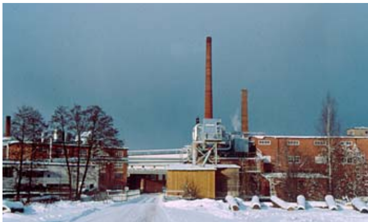
Bohman & Johansson/Blomstermåla Fanérfabrik/Kährs