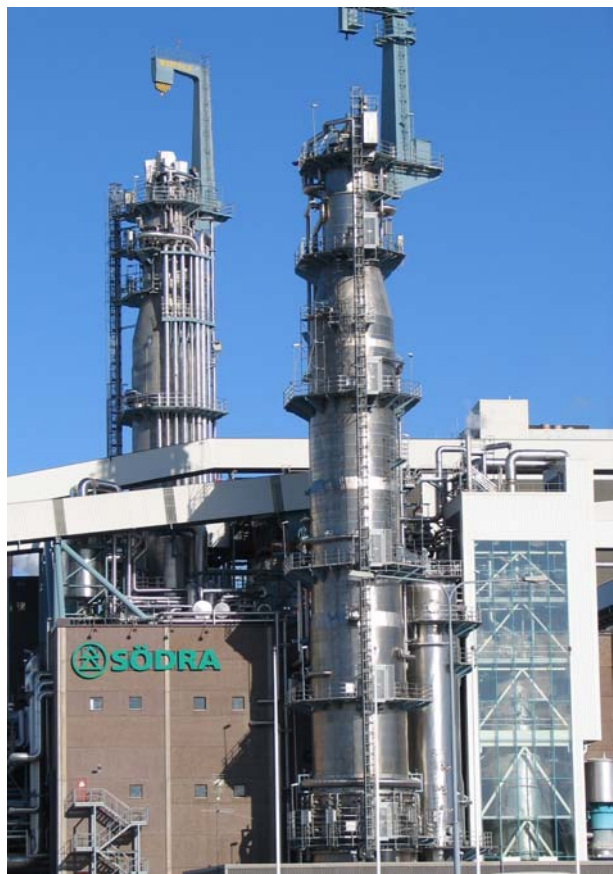
Mönsterås bruk (Södra Cell Mönsterås)

svårigheterna med att kulturhistoriskt värdera den moderna anläggningen och trots att fabriksmiljön inte kunnat besiktigas inom fältstudiens givna ramar. Det skulle vara värdefullt, för samtida planering och för framtiden, att industrins påverkan på landskapet beskrevs i en kulturhistorisk utredning och att olika kulturella aspekter av verksamheten dokumenterades fortlöpande.