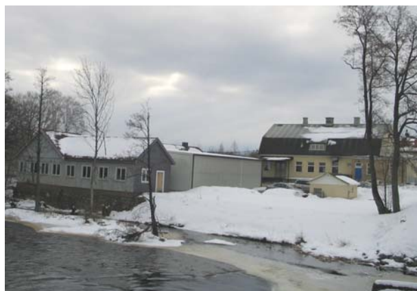
Ålems mejeri/Carrab mek.verkst.