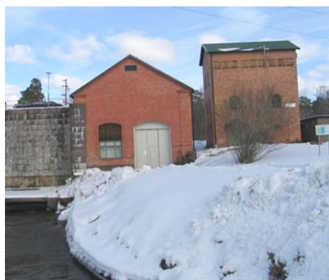
Finsjö nedre kraftstation