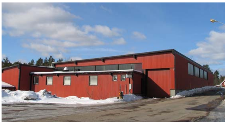
Finsjö pappersbruk (AB Papp)