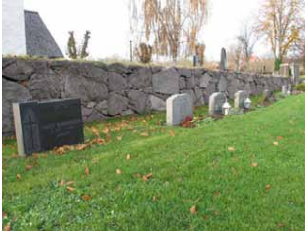
Gravvårdar längs gamla kyrkogårdsmuren mot väster. (KI Mortorps kyrkog 123)