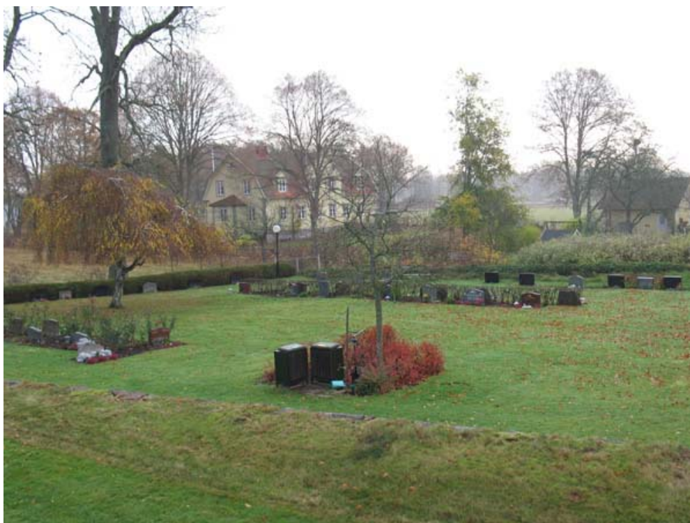
Kvarter C med den norra delen. (KI Mortorps kyrkog 042)

Kvarter C ligger tydligt avgränsat på kyrkogårdens östra del. I kvarteret finns platser planerade för omkring 250 kistgravar och ett 60-tal urngravar. Relativt många platser är ännu lediga. I kvarterets sydöstra hörn ligger minneslunden. Kvarteret omgärdas av den gamla kyrkogårdsmuren mot väster och av kyrkogårdsmur anlagd på 1950-talet mot söder, öster och norr. Ingång finns från gamla kyrkogården i väster samt mot de prästgårdsägorna i öster. Kvarteret uppdelas av ett tydligt gångstråk i mitten. (se kartan). På den södra delen står en gammal bok. Förutom boken finns häck av tuja i norr, murgröna som klänger på muren mot öster, en hängbjörk och en rönn, rygghäckar av cotoneaster, diverse buskar såsom schersmin samt lagerhägg kring minneslunden. Gravvårdarna är placerade i jordremсор i gräsmattan, vissa rader ryggställda med rygghäckar, andra enkla. Vårdarna är låga och relativt jämnstora.