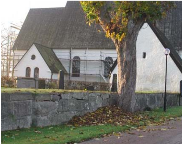
Kyrkan och kyrkogården mot sydost. Bårhuset till höger i bild. Notera skarven mellan två typer av murar vilket visar var 1924 års utvidgning av kvarter B börjar. (KI Mortorps kyrkog 031)

I öster: Från muren fristående trappa av ek från vaktmästarbyggnaden till kyrkogården.