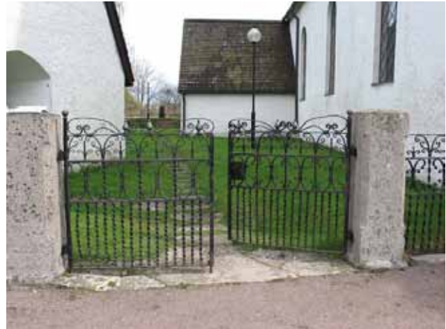
Grindparti mellan bårhus och kyrka i väster. Smidesgrindarna är av en typ som förekommer på flera kyrkogårdar i denna del av länet. (KI Mortorps kyrka 126)