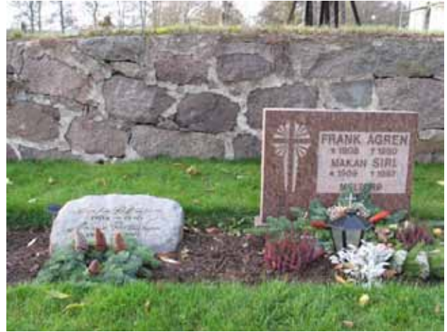
Urngravsområdet i söder med dess tätt placerade vårdar. Här från 1990-talet. (KI Mortorps kyrkog 122)