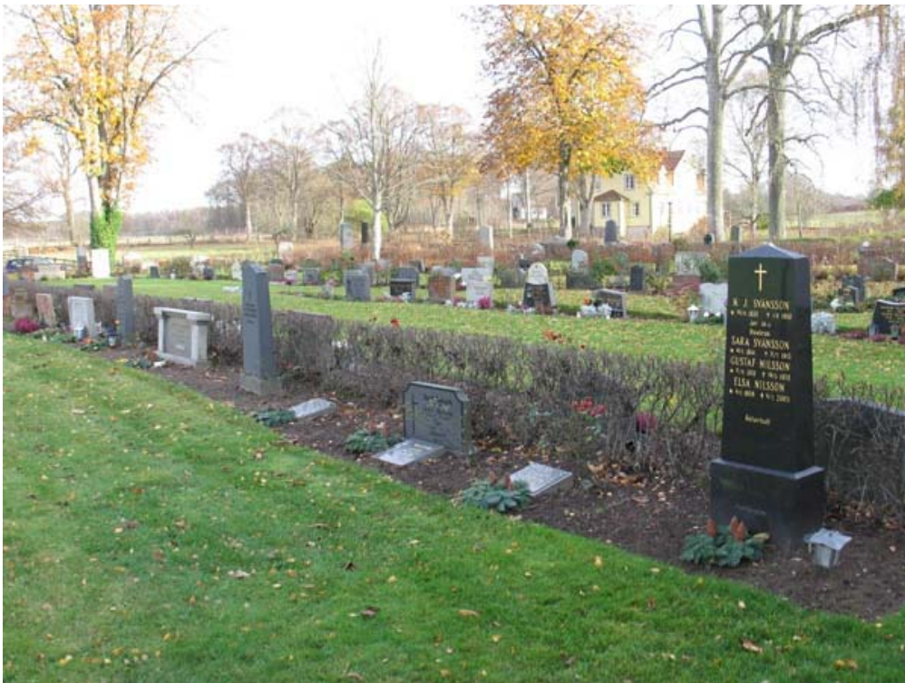
Kvarter B mot nordost. Prästgården i bakgrunden. (KI Mortorp kyrkog 067)

På majoriteten av gravstenarna anges by- eller gårdsnamn. På ett mindre antal vårdar, främst på familjegravarna, anges den dödes yrkestitel. Hemmansägare och lantbrukare är det vanligaste. Andra titlar som förekommer är handlande, kyrkovärden, folkskollärare, advokat, riksdagsman, kantor, kyrkoherde, skräddarmästare, stationsföreståndare, virkeshandlare, grosshandlare och byggmästare.