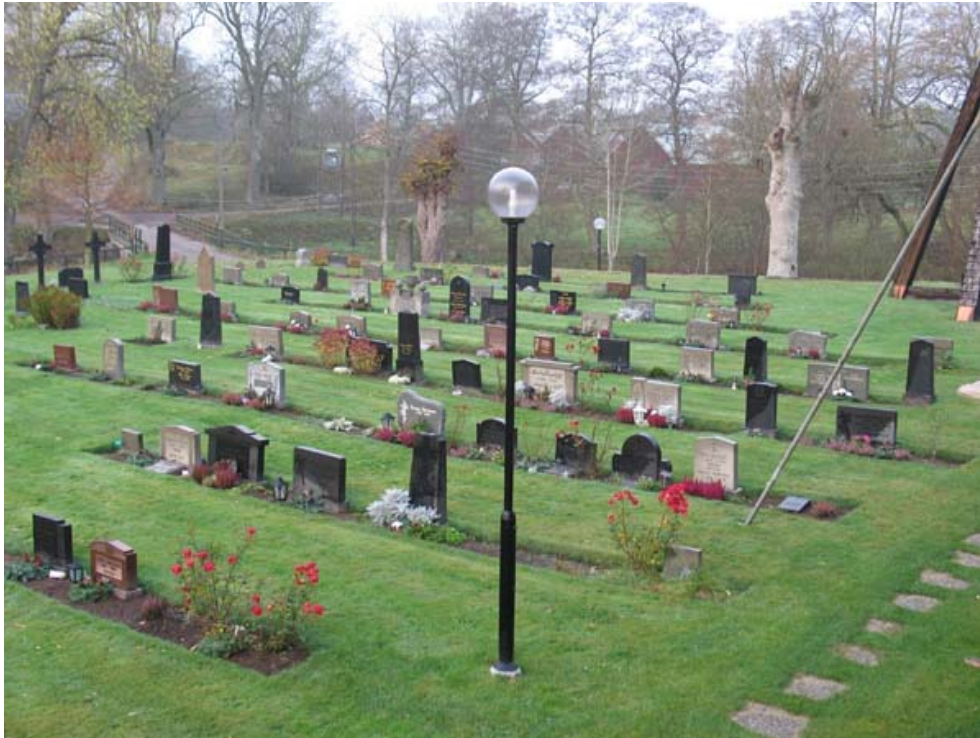
Kvarter A mot sydväst. Notera blandningen av gravvårdstyper. (KI Mortorps kyrkog 038)

raden av de två har sannolikt i ett skede hört till den tidigare nämna ramen. Gravvårdarna står i jordremсор i gräsmattan. I kvarterets mitt finns rester av ett linjegravssystem från 1920 talet, men det finns också enstaka äldre gravvårdar. På en av gravplatserna i öster finns två stora sockertoppsgranar planterade.