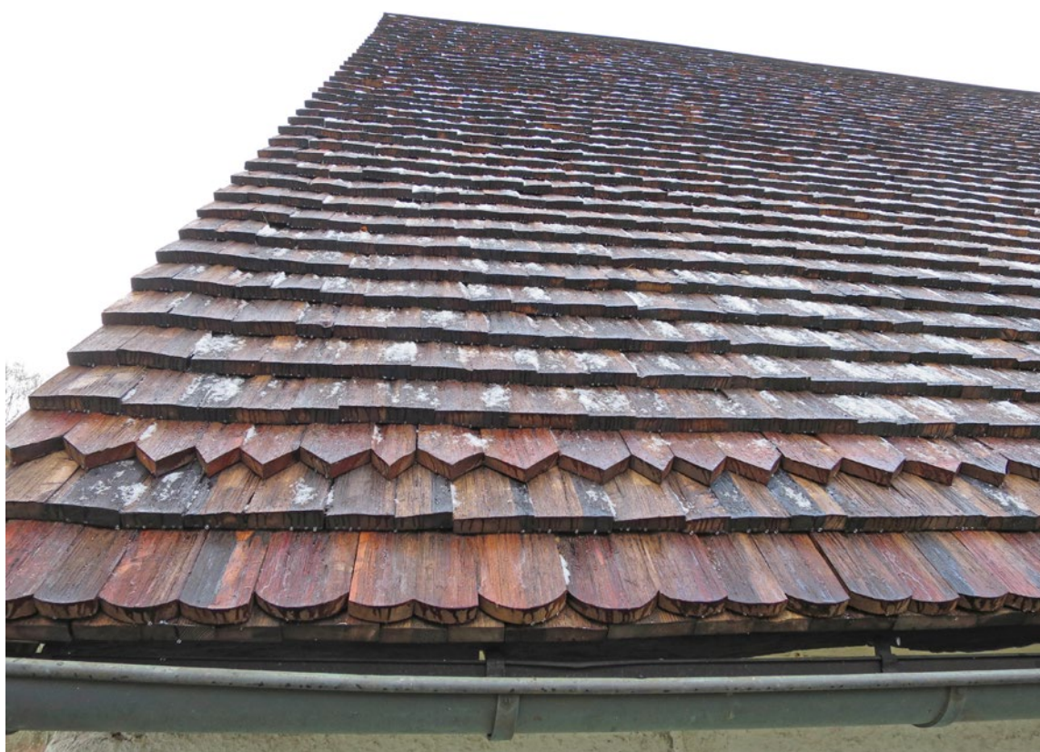
Spåntak på östra takfallet efter omläggning.