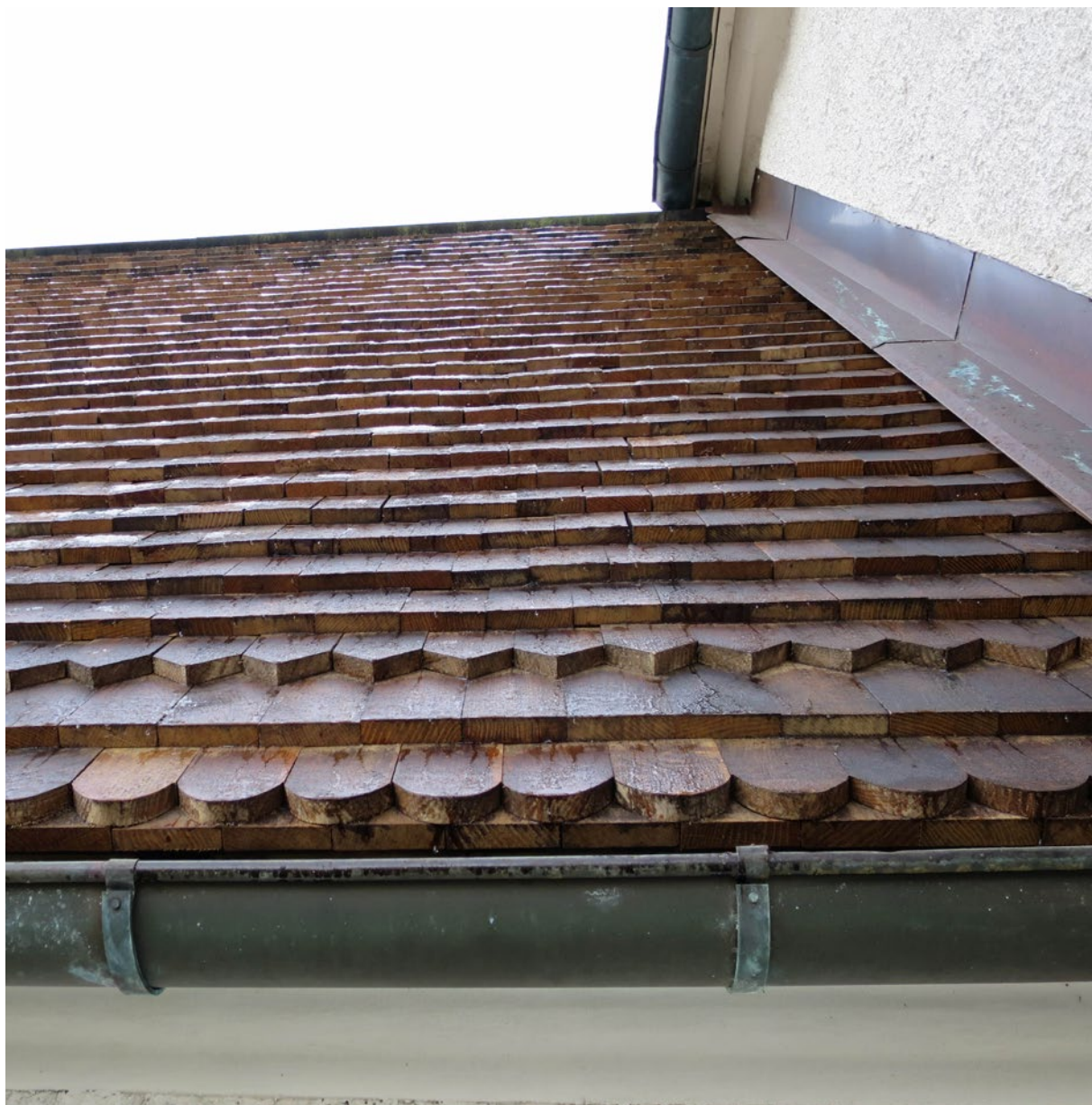
Nylagt spåntak, detalj.