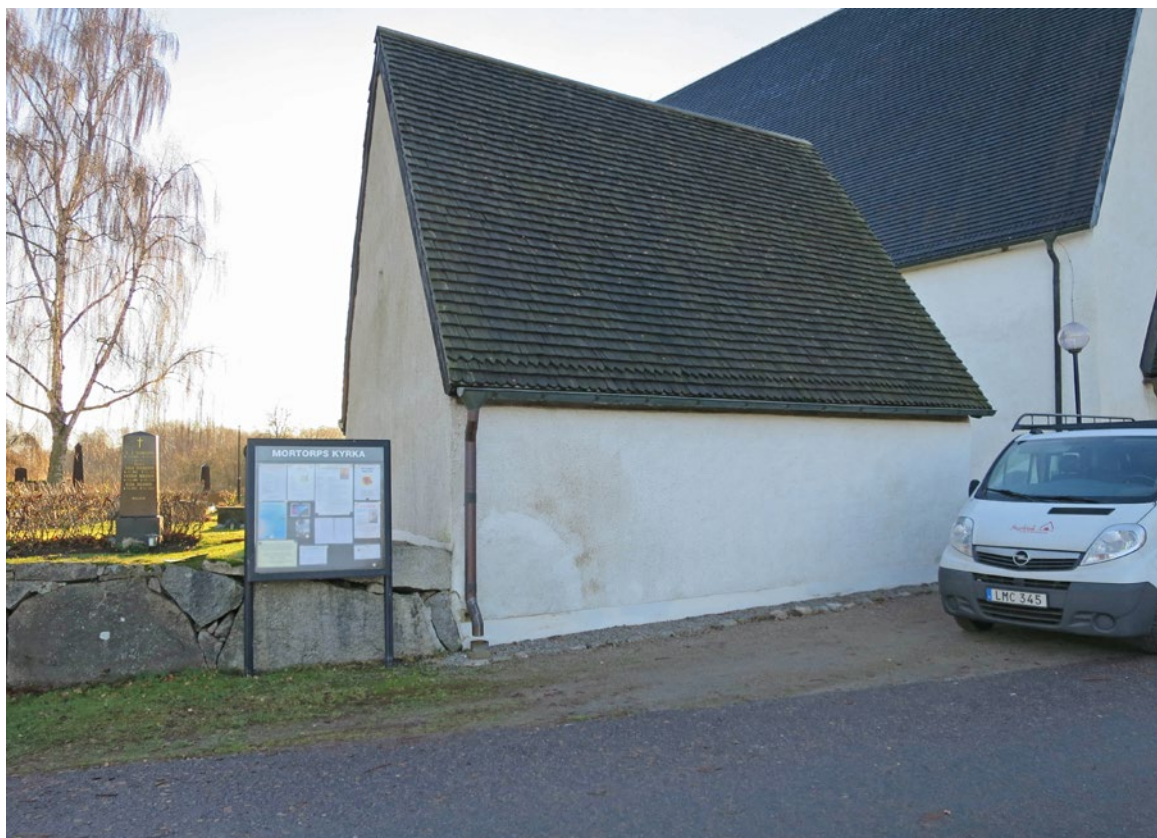
Spåntak på västra takfallet före omläggning.