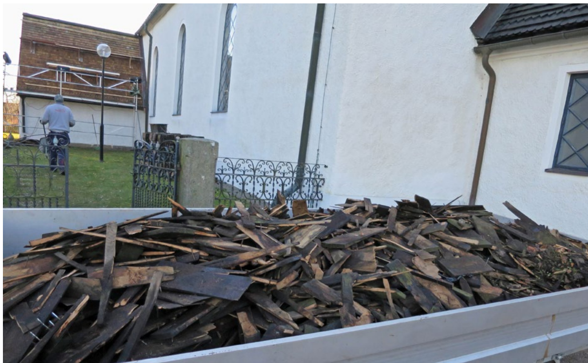
Nylagt spåntak. Kasserad spåntäckning i släpet.

De nu omlagda spåntaken ska tjäras med trätjära av hög kvalitet under år 2017. Tjärningen ska ske vid lämplig väderlek. Tjären ska vara varm då den påförs och arbetas in med pensel. Tillståndet innefattar även byte av enstaka spån på klockstapel och kyrka. Detta är inte utfört.