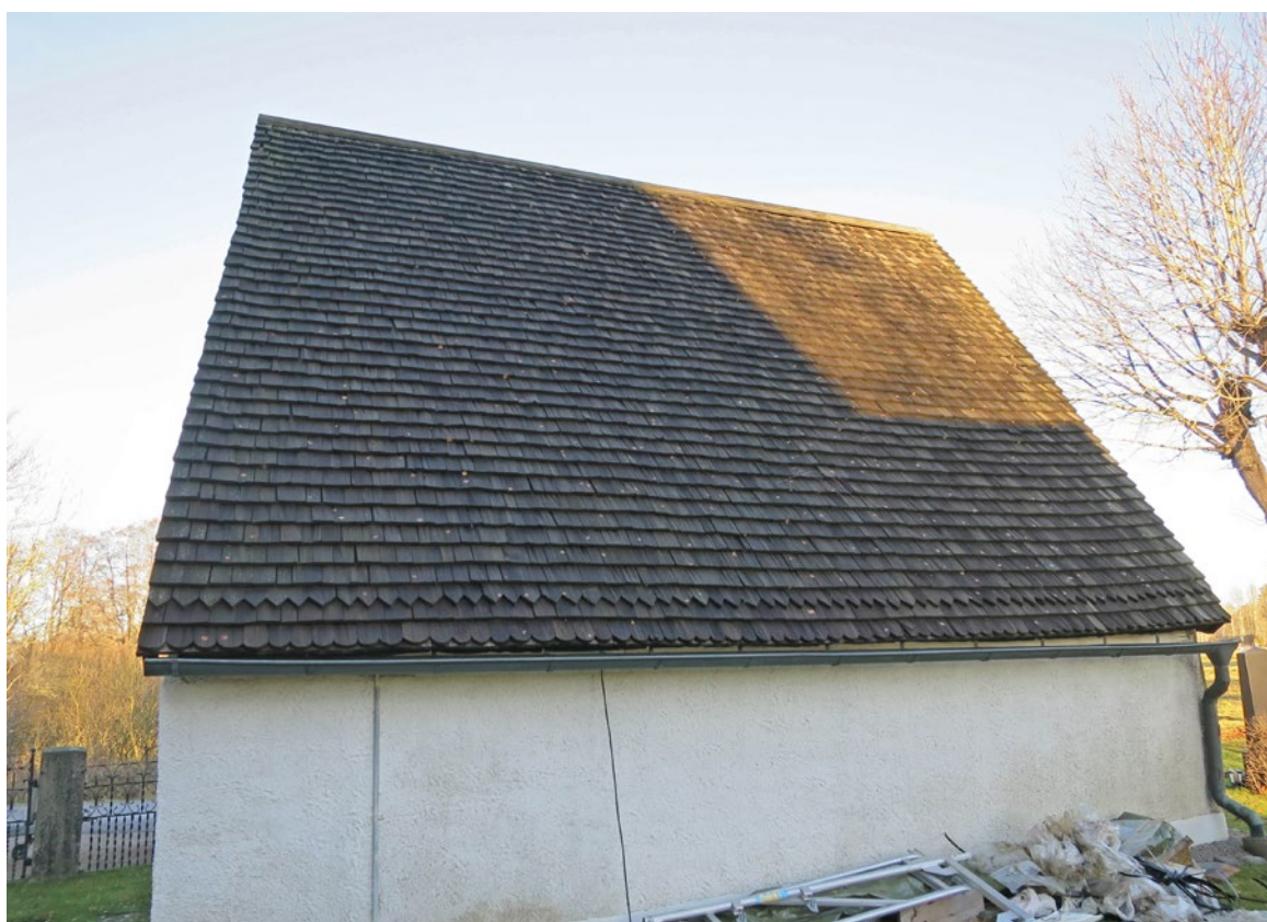
Spåntak på östra takfallet före omläggning.