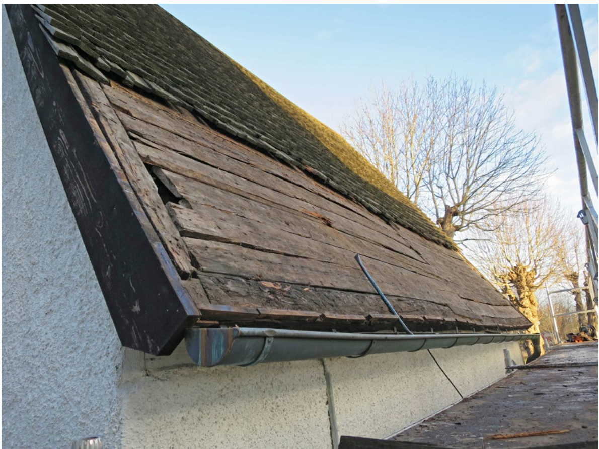
Nedtagning av spån på östra takfallet och synligt undertak.