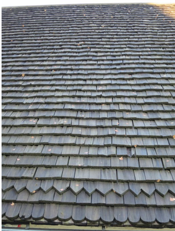
Spåntak på östra takfallet före omläggning.