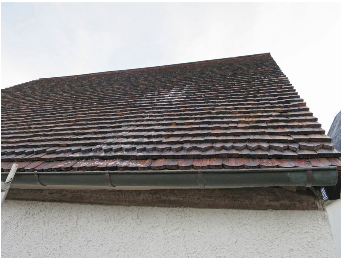
Spåntak på västra takfallet efter omläggning.