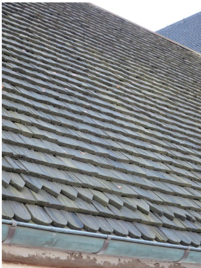
Spåntak på västra takfallet före omläggning.