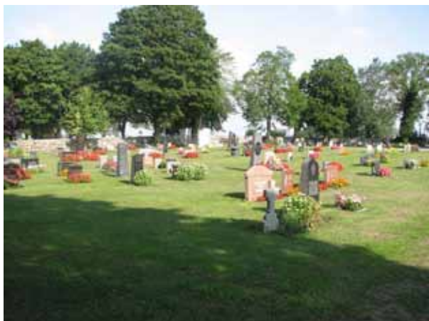
Kvarter A från sydost. (KI N Möckleby kyrkog 018)

Kvarter A och B är belägna söder om kyrkan och kvarter C runt kyrkan i övriga väderstreck. Flest gravplatser finns i de båda kvarteren söder om kyrkan. Gravvårdarna är placerade i rader och vända mot öster eller väster. I kvarter A är samtliga vårdar vända mot öster. Flera lediga gravplatser finns i samtliga tre kvarter. Kyrkogården är öppen och överskådlig med en blandning ålderdomligt av och modernt.