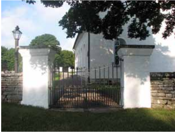
Kyrkogårdens ingång i öster. De dubbla smidesgrindarna bekostades av bönderna i den södra delen av socknen 1831. (KI N Möckleby kyrkog 004)