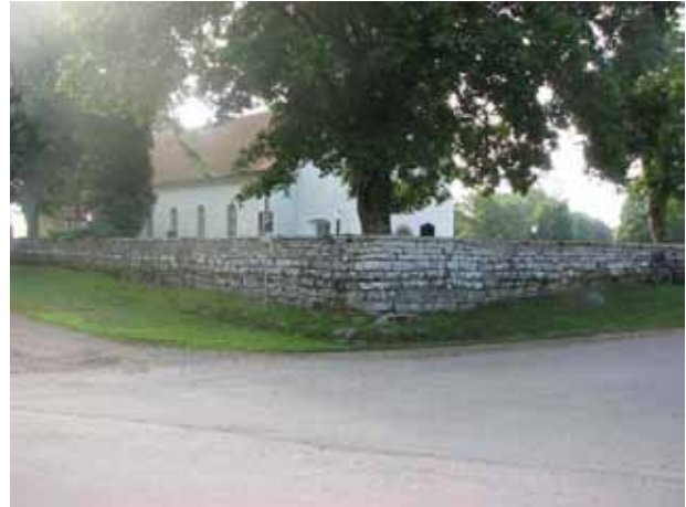
Kyrkogårdens mur från nordväst. (KI N Möckleby kyrkog 016)