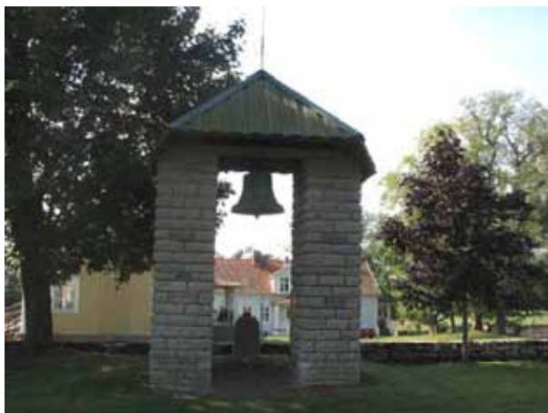
Klockstapeln för den spräckta klockan från 1600-talet byggdes på 1960-talet i södra delen av kvarter A. (KI N Möckleby kyrkog 025)

Under 1990-talet kan man se en uppluckring av bestämmelserna kring gravvårdarnas utformning. Idag är formerna mer varierande och ofta mjukare. Under 1900-talets första hälft var det vanligt att man omgärdade gravplatserna och belade dem med grus. På Norra Möckleby kyrkogård har funnits omgärdningar i form av häckar, stenramar och gjutjärnsstaket. Idag finns endast enstaka rester kvar av detta. Under 1900-talets första hälft var det också vanligt att ange den dödes yrkestitel på gravvården. På Norra Möckleby kyrkogård finns gravvårdar med titlar men inte i någon större omfattning. Titlarna försvann i det närmste i mitten av århundradet. Under senare år har en ny form dykt upp. Gravvården får en dekor som knyter an till den dödes intresse eller yrke, men detta har ännu inte blivit vanligt på Norra Möckleby kyrkogård. På landsortskyrkogårdar har det under hela 1900-talet varit vanligt att ange från vilken by eller gård den döde kommer. På Norra Möckleby kyrkogård finns det angivet på majoriteten av vårdarna.