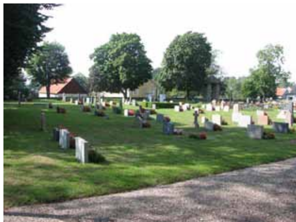
Kvarter B från nordost. (KI N Möckleby kyrkog 030)