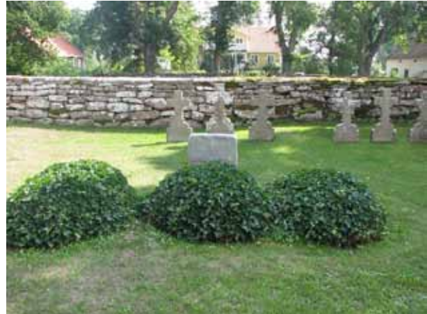
Fram till mitten av 1900-talet fanns flera gravkullar av murgröna på N Möckleby kyrkogård. På bilden syns tre av kyrkogårdens fyra bevarade gravkullar. I bakgrunden syns några av de ålderdomliga kalkstenskors som står uppställda utmed kyrkogårdens östra mur. De ska vara tillverkade av en stenhuggare Jansson från Långrälla. (KI N Möckleby kyrkog 051)