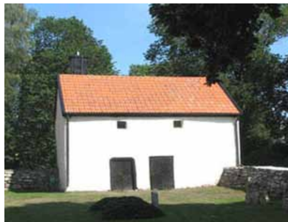
Den f.d. likboden som idag används som förråd. Golvet i byggnaden är lagt av gamla gravhällar. (KI N Möckleby kyrkog 068)