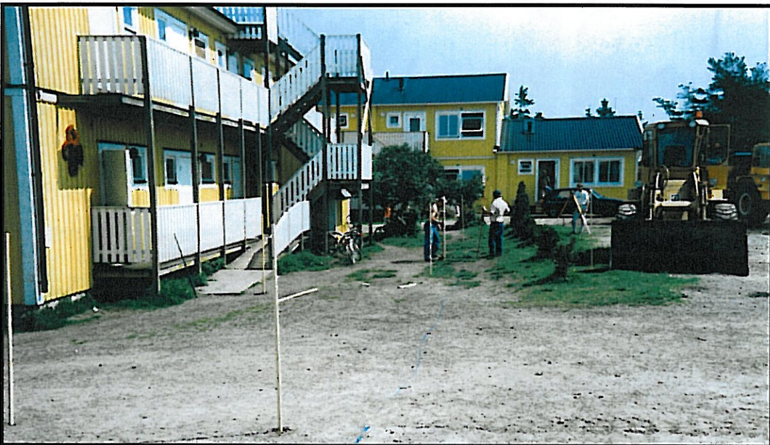
Framför ( söder ) om gamla pensionat- byggnaden. Stakning av området som ska asfalteras - läge för grophuset utmärkes. Från väster.