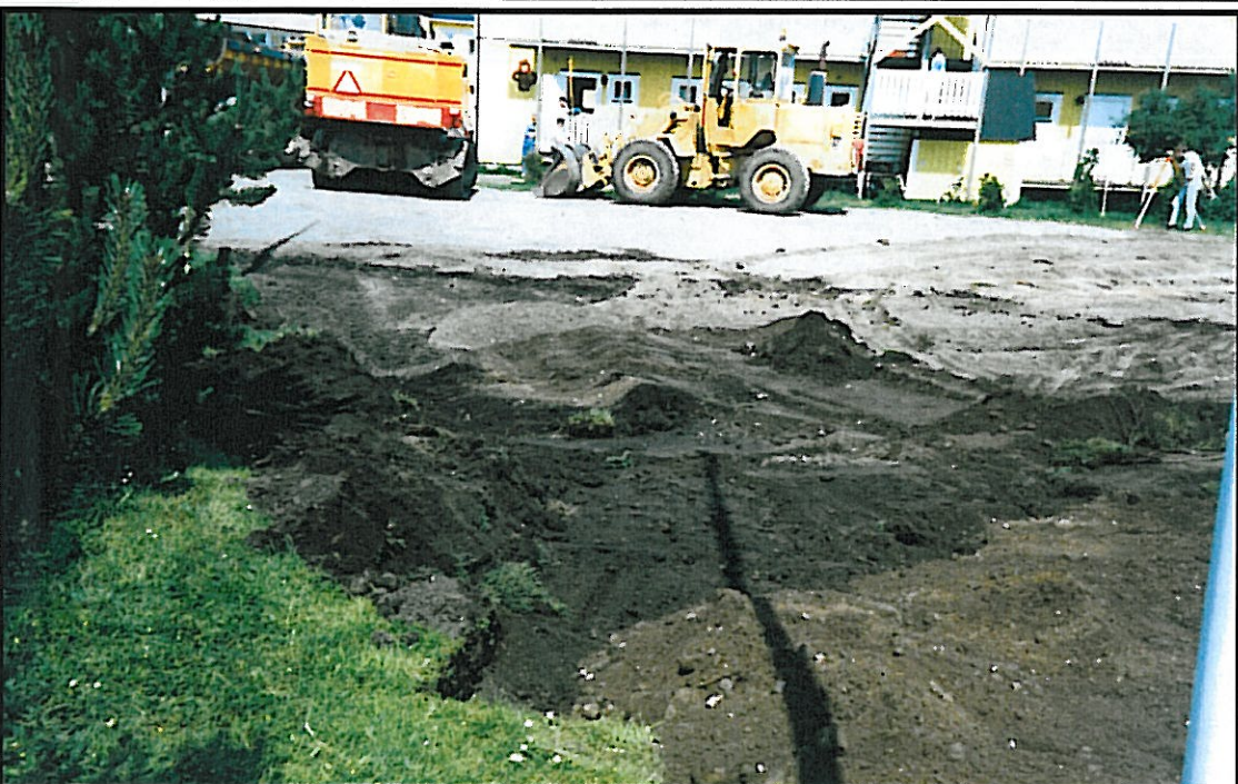
I södra tomtgränsen planeras ( P - platsen ), den gamla grus- fyllningen banas av. I förgrunden före detta grustäkt med dump- massor från arkeologisk undersökning. Från söder.