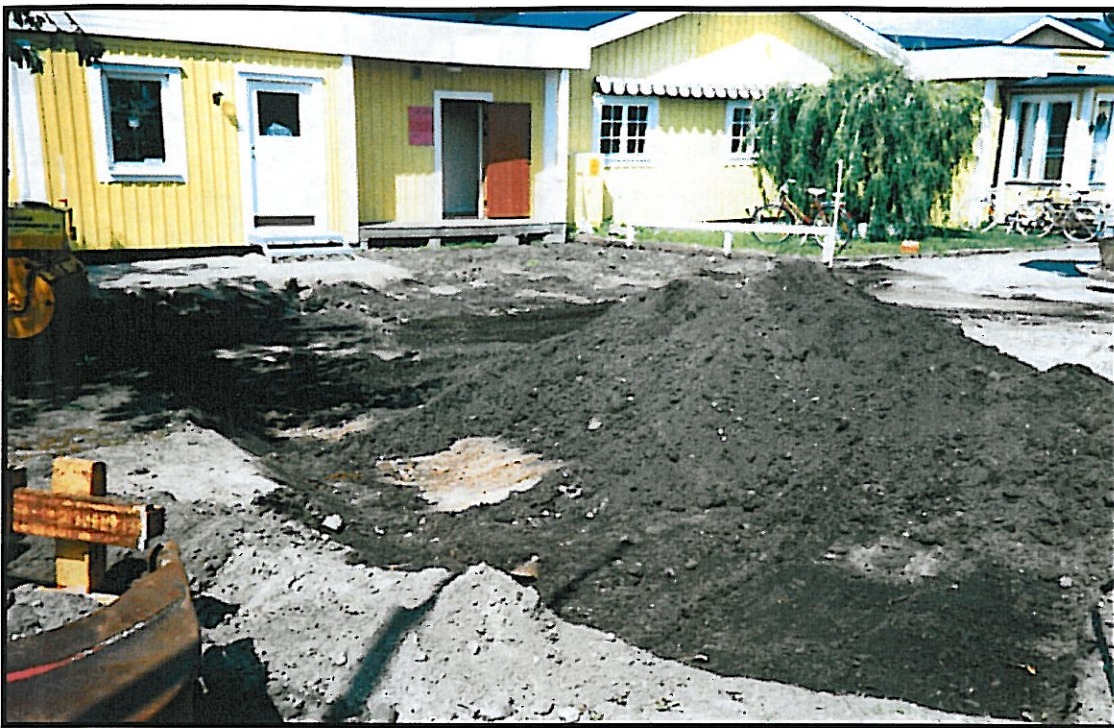
Sydost om restaurang- utbyggnaden. Pålagd grusfyllning och något av matjorden banas av. Här påträffades fynden. Från sydost.