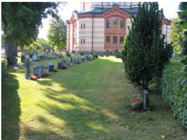
Kvarter A från nordväst. (KI Örsjö kyrkog 017)

Kvarter A omfattar 250 gravplatser norr och nordväst om kyrkan och den gången som leder till kyrkogårdens ingång i nordväst. I kvarterets södra del är fyra rader närmast gången med gravvårdar ryggställda med varandra. Mellan två av dessa rader är en häck av avenbok planterad tillsammans med en rad av knuthamlade almar. Gravvårdarna i de ryggställda raderna är vända mot norr eller söder medan de i övrigt är vända mot söder. Kvarteret har brukats kontinuerligt under hela 1900-talet. Den äldsta vården från 1893 är en av kyrkogårdens två äldsta vårdar. Kvarteret har brukats kontinuerligt under hela 1900-talet men flest gravvårdar finns från perioden 1950-79.