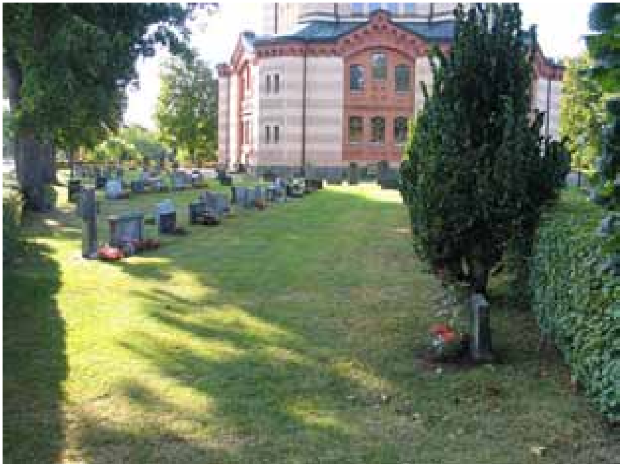
KI Örsjö kyrkog 017

Kulturhistorisk inventering av kyrkogårdar/ begravningsplatser i Växjö stift 2005