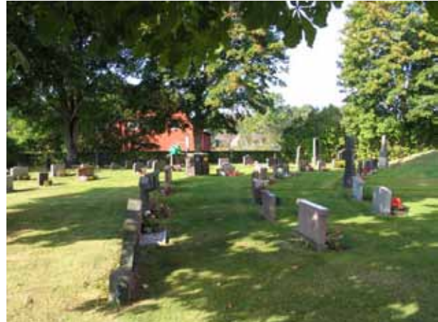
Kvarter B från öster. (KI Örsjö kyrkog 027)

låga och mycket breda. Man kan av deras utformning ana att de tidigare varit omgärdade. Denna typ av vårdar blev vanliga under 1930-40-talen. Materialet är främst grå och svart granit men även röd förekommer. Att ange yrkestitlar är relativt vanligt. De som finns är hemmansägare, kyrkvård, nämndeman, gästgivare, kantor, häradshövding, häradsdomare, fabrikör och stationsinspektör. Samtliga titlar får sägas höra hemma i socknens övre sociala skikt. På majoriteten av gravvårdarna är den dödes hemby eller gård angiven.