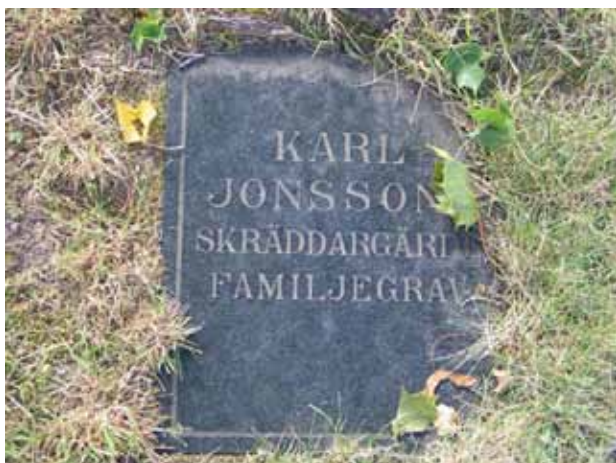
Bland gravvårdarna i kvarter B finns flera olika typer av vårdar. Denna enkla liggande gravvård finns i östra delen av kvarteret. (KI Örsjö kyrkog 028)