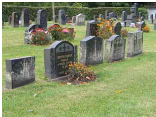
En del av linjegravsområdet i kvarter C. Gravvårdarna står tätt. I synnerhet på de yngre delarna av linjegravsområdet. Vårdarna närmast i bild är från 1939. (KI Örsjö kyrkog 039)