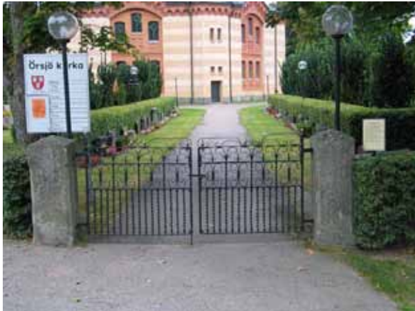
Ingång till kyrkogården i nordväst. (KI Örsjö kyrkog 001)

En minneslund finns på den nya kyrkogården som anlades nordost om kyrkan på 1980-talet.