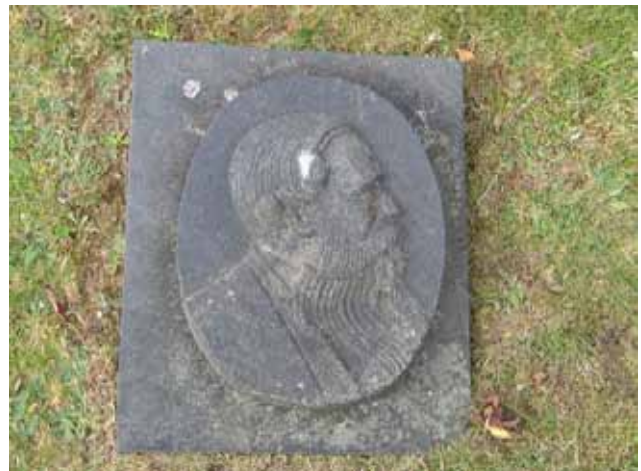
En ovanlig linjegravvård. Enligt uppgift ska den döde själv ha tillverkat vården med sitt porträtt. Vem han var har dock fallit i glömska och inga personuppgifter finns på vården. Den ligger bland de äldsta linjegravarna från 1920-talet i kvarterets södra del. (KI Örsjö kyrkog 044)