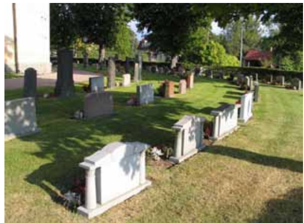
Kvarter A från öster. (KI Örsjö kyrkog 023)