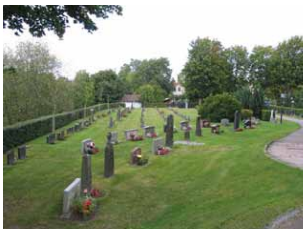
Kvarter C från öster. Närmast i bild några av kvarterets köpta gravplatser och därbakom linjegravsområdet. (KI Örsjö kyrkog 035)

Kvarteret är beläget väster och sydväst om kyrkan. Det omfattar 318 gravplatser. Närmast kyrkan är köpta gravplatser placerade i två bågformade rader vända mot kyrkan. I kvarterets norra del är gravvårdarna ryggställda mot en häck av avenbok. Här står också en rad med knuthamlade almar. Största delen av kvarteret upptas av ett linjegravsområde. De nordligaste raderna i detta område är ryggställda mot en häck av ölandstok. Majoriteten av gravvårdarna är vända mot norr. I linjegravsområdet finns enstaka lediga gravplatser. I kvarteret står den andra av kyrkogårdens två äldsta gravvård från 1893. Det är J. G. Pettersson från Kopparflys gravvård. Ett fåtal gravvårdar är från tidigt 1900-tal. Den äldsta linjegravvården är från 1924 och linjegravsområdet har därefter brukats kontinuerligt fram till 1955. Hela kvarteret har kontinuerligt brukats fram till idag.