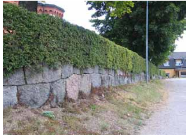
Stödmur och hagtornshäck som omgärdar kyrkogården i öster. (KI Örsjö kyrkog 006)