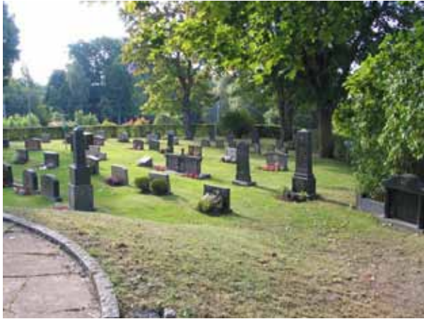
Kvarter B från väster. (KI Örsjö kyrkog 026)

Majoriteten av gravvårdarna i kvarteret är låga rektangulära gravvårdar med enkel dekor typiska för 1970- och 80-talen. De gravvårdar man först lägger märke till i kvarteret är dock de höga gravvårdar från tidigt 1900-tal utformade med klassicistiska influenser. Från samma tid finns även enstaka enkla gravvårdar. Det finns också ett mindre antal gravvårdar som är