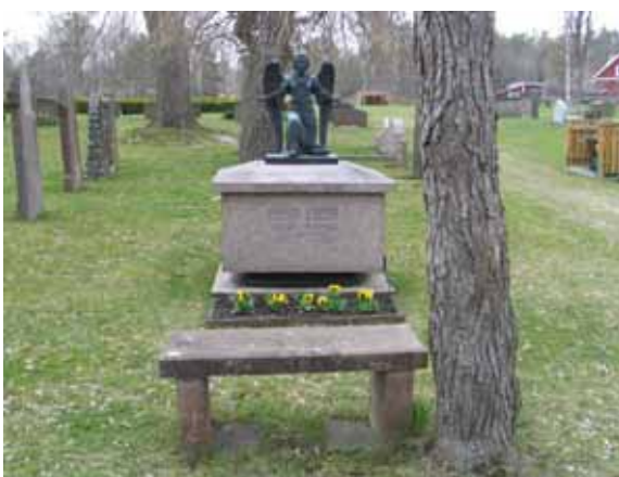
Tumba av granit krönt av bronsängel formgiven av Arvid Källström, kvarter 5 (KI Påskallaviks kyrkog 042)