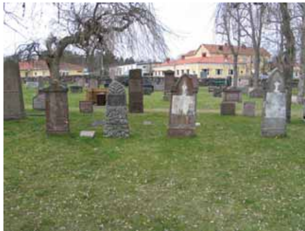
De äldsta gravvårdarna i kvarter 5 tillhör medlemmar av familjen Callerström. De är av sandsten och två av dem har plattor av marmor. (KI Påskallaviks kyrkog 041)