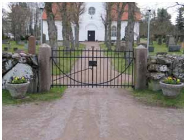
Smidesgrindar vid kyrkogårdens västra ingången (KI Påskallaviks kyrkog 001)