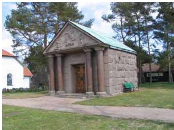
Familjen Örn's mausoleum (KI Påskallaviks kyrkog 062)