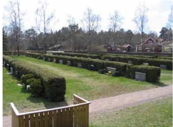
Kvarter B2 från nordost (KI Påskallaviks kyrkog 059)