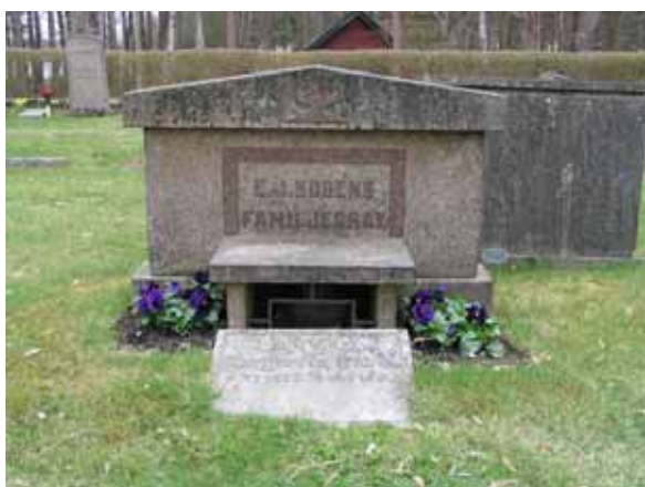
Gravvård med plats för urna, kvarter 3 (KI Påskallaviks kyrkog 034)