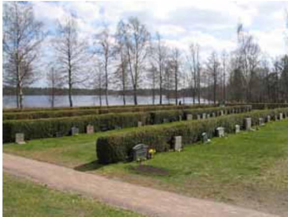
Kvarter B1 från nordväst (KI Påskallaviks kyrkog 060)

Kvarteren B1 och B2 ligger på den nya delen av Påskallaviks kyrkogård som anlades i slutet av 1950-talet. Denna del av kyrkogården är en representant för den tid när den ritades och skiljer sig på flera sätt från den äldre delen av kyrkogården. På denna del av kyrkogården speglas tidsandan som förespråkade funktion och social utjämning. I det fortsatta brukandet av område är det viktigt att ta hänsyn till områdets utformning med de ryggställda gravvårdarna och klippta tujahäckarna.