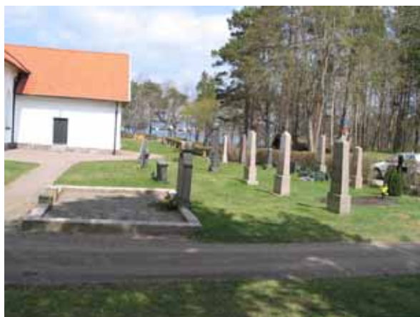
Kvarter 9 från söder med en av kyrkogårdens två grusbelagda gravplatser i förgrunden. (KI Påskallaviks kyrkog 052)

Konservatorn Gunnar Sjösten som utfört flera konservatorsarbeten i Påskallaviks kyrka är begravd i kvarter 3.