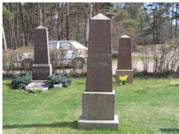
Höga gravvårdar av röd Väneviks-granit i kvarter 9. Den här typen av gravvårdar tillverkades vanligen av svart granit. (KI Påskallaviks kyrkog 053)