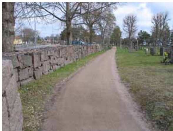
Kyrkogårdsmuren i väster av kvaderhuggen kallmurad granit. (KI Påskallaviks kyrkog 016)

Utöver dessa båda huvudingångar finns mindre öppningar i omgärdningarna t.ex. i anslutning till vaktmästeriet.