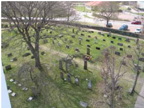
Utsikt över kvarter 4. Bakom trädet ansas kvarter 6. Närmast i bild kvarter 5. (KI Påskallaviks kyrkog 070)

Ett flertal av kvarterets vårdar är resta över medlemmar ur familjen Callerström. Familjen ägde tidigare Emsfors pappersbruk och stora jordegendomar i Påskallavikstrakten. Det var handlanden Nils Callerström som tog initiativet till byggandet av kyrkan och skänkte marken både till kyrkan och till kyrkogården. I kvarteret är också Påskallaviks förste komminister, Josef Hedberg, begravd.