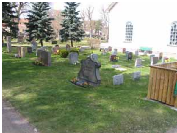
Kvarter 8 från sydost (KI Påskallaviks kyrkog 051)