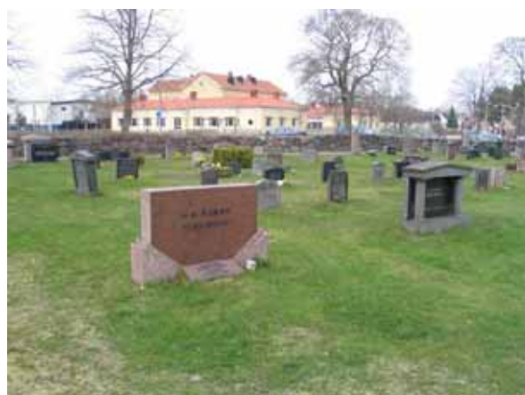
Kvarter 6 från sydost. De köpta gravplatsernas gravvårdar bildar en ram runt linjegravsområdets enklare gravvårdar. (KI Påskallavisk kyrkog 045)