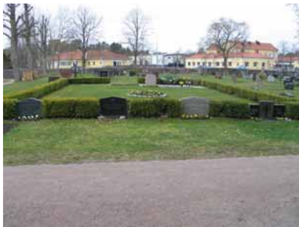
Kvarter 7 med minneslunden från öster (KI Påskallaviks kyrkog 049)

Den öppna yta som fanns i kvarter 7 innan minneslunden anlades var avsedd att användas i händelse av en katastrof. Om en större olycka eller en epidemi drabbade samhället skulle man här kunna upplåta gravplatser.