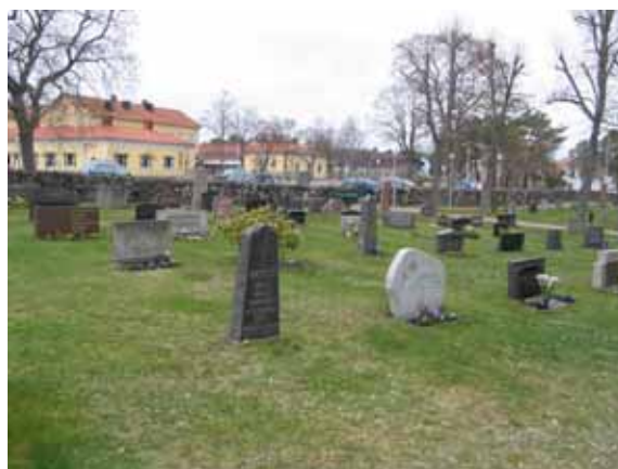
Kvarter 4 från sydost (KI Påskallaviks kyrkogård 035)