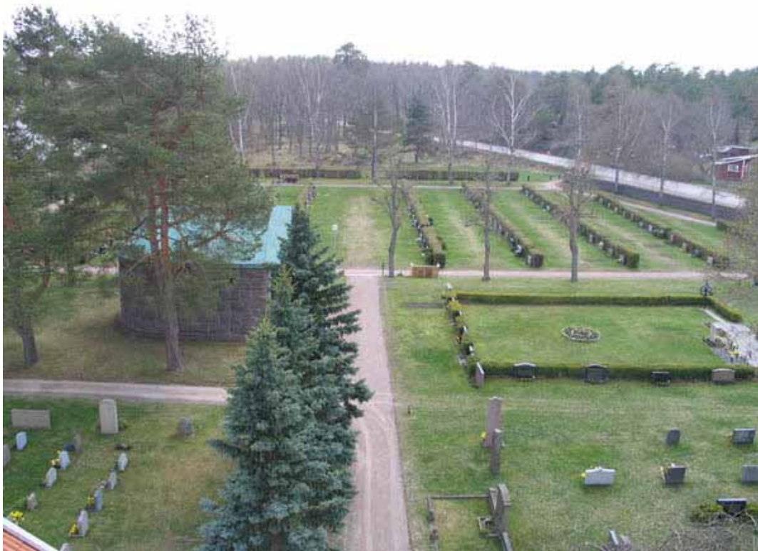
KI Påskallavik 066

Kulturhistorisk inventering av kyrkogårdar/ begravningsplatser i Växjö stift 2005