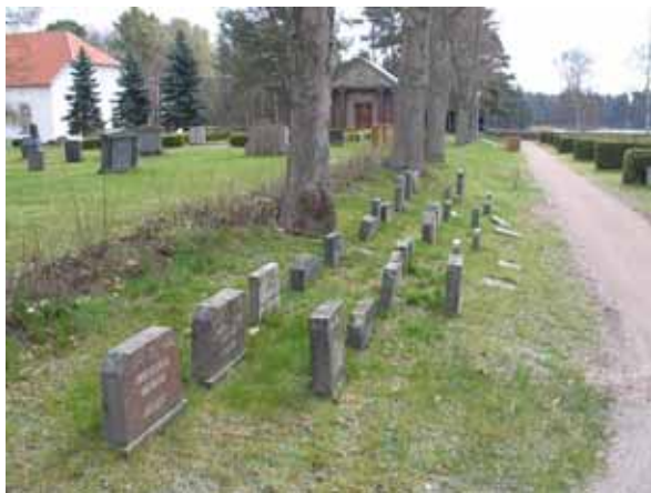
Sekundärt uppställda gravvårdar i gränsen mellan gamla och nya kyrkogården (KI Påskallaviks kyrkog 015)