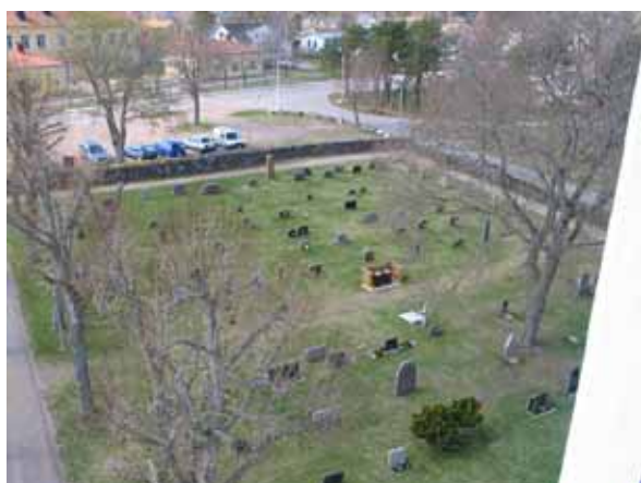
Utsikt över kyrkogårdens nordvästra del. Kvarter 1 längst bort och kvarter 2 närmast i bild. (KI Påskallaviks kyrkog 069)

Kvarter 1 är beläget i kyrkogårdens nordvästra hörn och kvarter 6 i sydvästra hörnet av den äldre delen av kyrkogården. Båda har ursprungligen haft köpegravar i en ram runt kvarterets ytterkanter och linjegravar i mitten. Ramen av köpegravar runt kvarter 1 har dock inte omfattat kvarterets östra kant. Det kvarter av dem båda som bäst bevarat sin ursprungliga utformning är kvarter 6. Gravvårdarna i detta kvarter är från 1940 till 1999. I mitten av kvarteret finns ett sammanhängande linjegravsområde från 1952 till 1959. I kvarter 1 är den äldsta vården från 1873. Endast ett fåtal gravvårdar i kvarterets mitt kan antas vara från det linjegravsområde som tidigare fanns i kvarteret. Dessa gravvårdar är från 1940-talet. Majoriteten av gravvårdarna är vända mot öster men i kvarterens kanter har vårdarnas placering anpassats efter gångsystemet. Få gravvårdar i kvarter 6 är yngre än 1959 medan åldern på stenarna varierar mera i kvarter 1. En viss dominans av vårdar från 1940 kan dock utläsas.