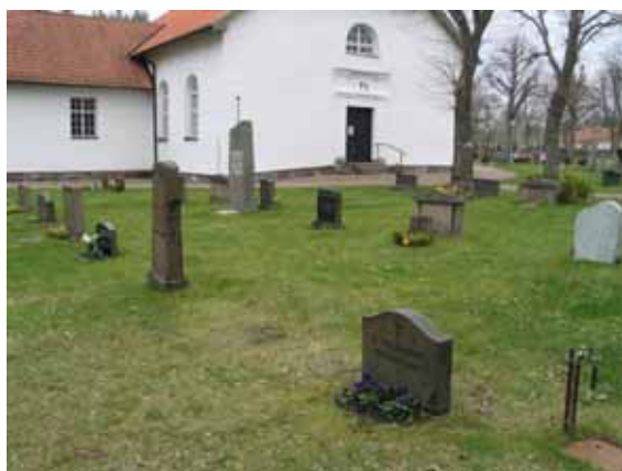
Kvarter 3 från nordost (KI Påskallaviks kyrkogård 031)

P.g.a. områdenas kontinuerliga brukande varierar typerna av gravvårdar. I området finns ett flertal höga gravvårdar i Våneviks-granit. Dessa vårdar är av utseende att döma från tidigt 1900-tal men uppvisar i vissa fall en sen datering. Det talar för att gravvårdarna i en del fall återanvänts av familjen. I kvarteren finns också låga, stående vårdar med klassicerande stildrag som knyter an till antikens tempel. Gravvårdarna är framförallt av granit och då främst av Våneviks-granit men ett mindre antal gravvårdar är av andra material. I kvarter 2 finns en gravvård i form av ett kors och en håll av marmor. Här finns också en av kyrkogårdens två gravplatser som fortfarande är belagda med grus och omgärdad av en stenram.