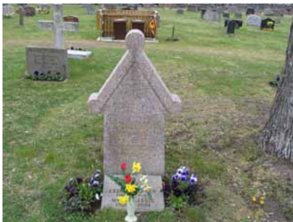
Ett mindre antal gravvårdar med denna form finns på Påskallaviks kyrkogård. Just den här stenen står i kvarter 2. Vården är från 1922 och av röd granit 2 (KI Påskallaviks kyrkog 024)