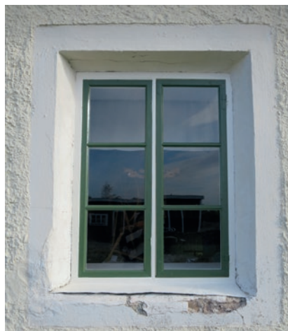
Södra fasaden efter åtgärd. Fönstret näst längst åt öster.