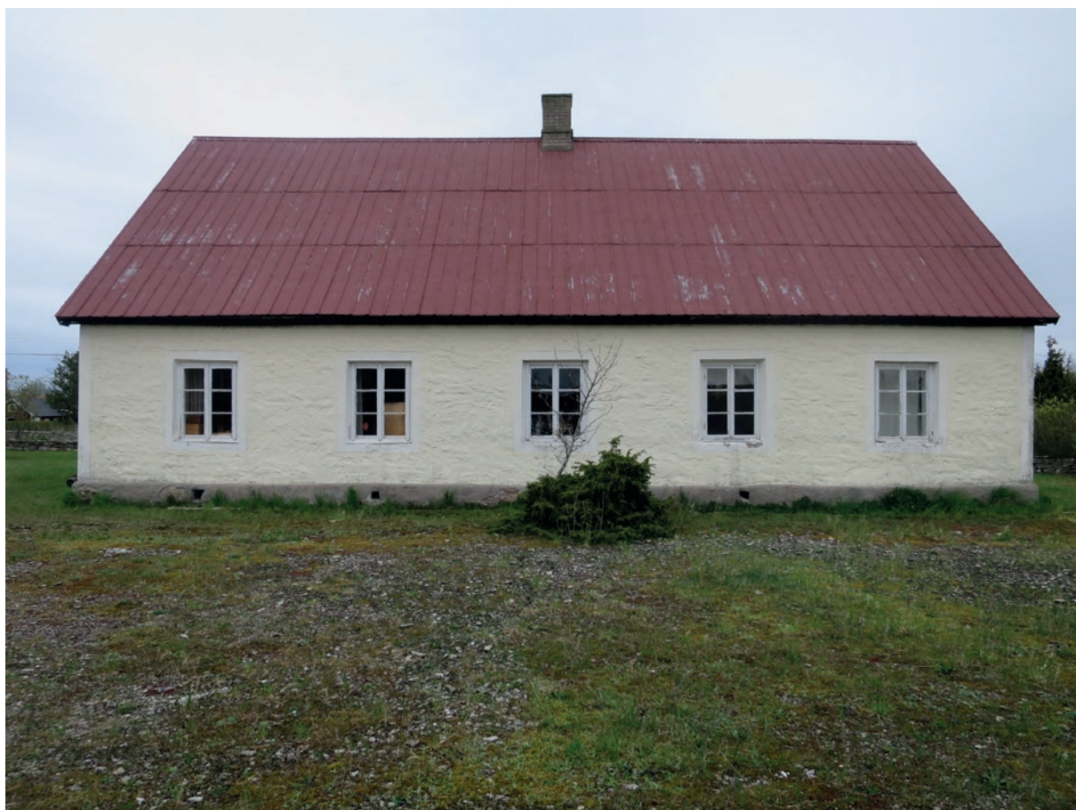
Södra fasaden före åtgärd.