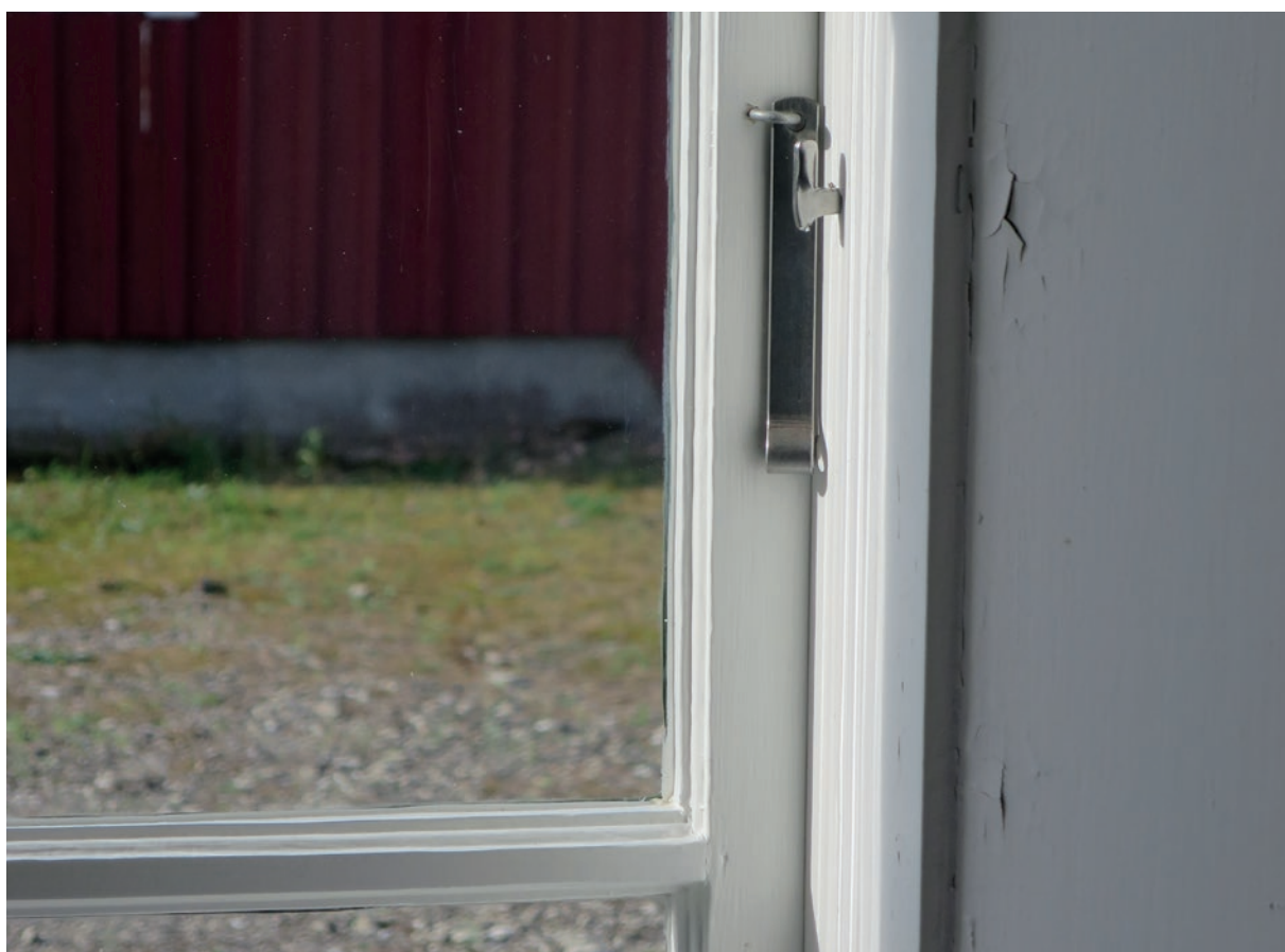
Nya handvarpor och stjärthakar samt stormhaspar.