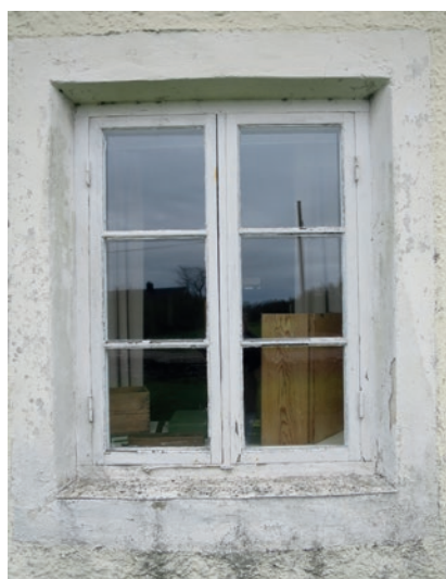
Norra fasaden före åtgärd. Fönstret längst åt väster. Detta är den enda kopplade bågen som inte renoverades 2016.