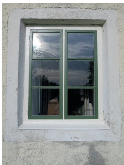
Östra fasaden efter åtgärd. Nedre fönstret.