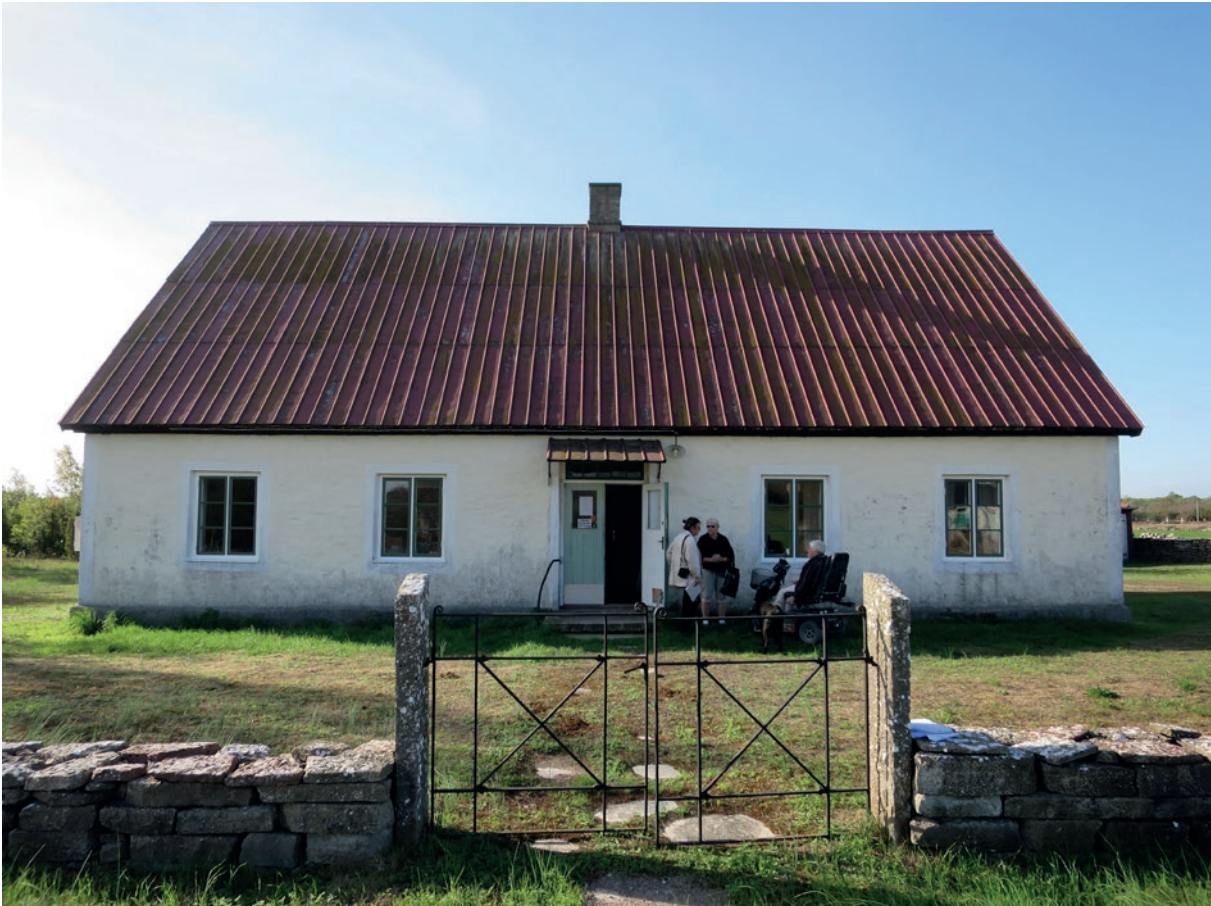
Norra fasaden efter åtgärd.