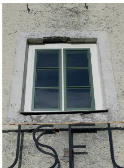
Östra fasaden före åtgärd. Övre fönstret. Bågarna till detta fönster är helt nyttillverkade. Fönstret har tätats med infällda lister mellan de båda karmarna.