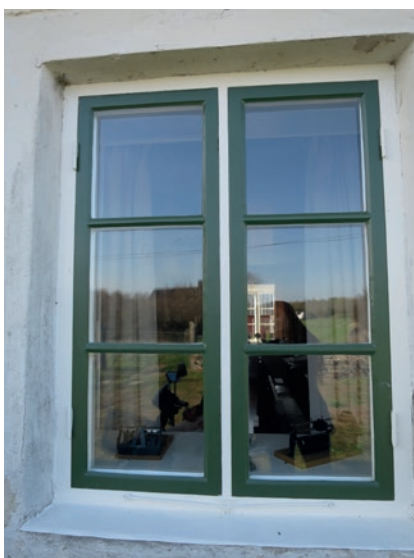
Norra fasaden efter åtgärd. Fönstret näst längst åt väster. Detta fönster har enbart målats.