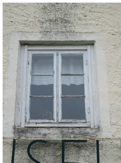
Västra fasaden före åtgärd. Övre fönstret. Detta fönster har en egen karm som satts in i den gamla karmen. Glipan mellan de båda karmarna täcks här med några lister.