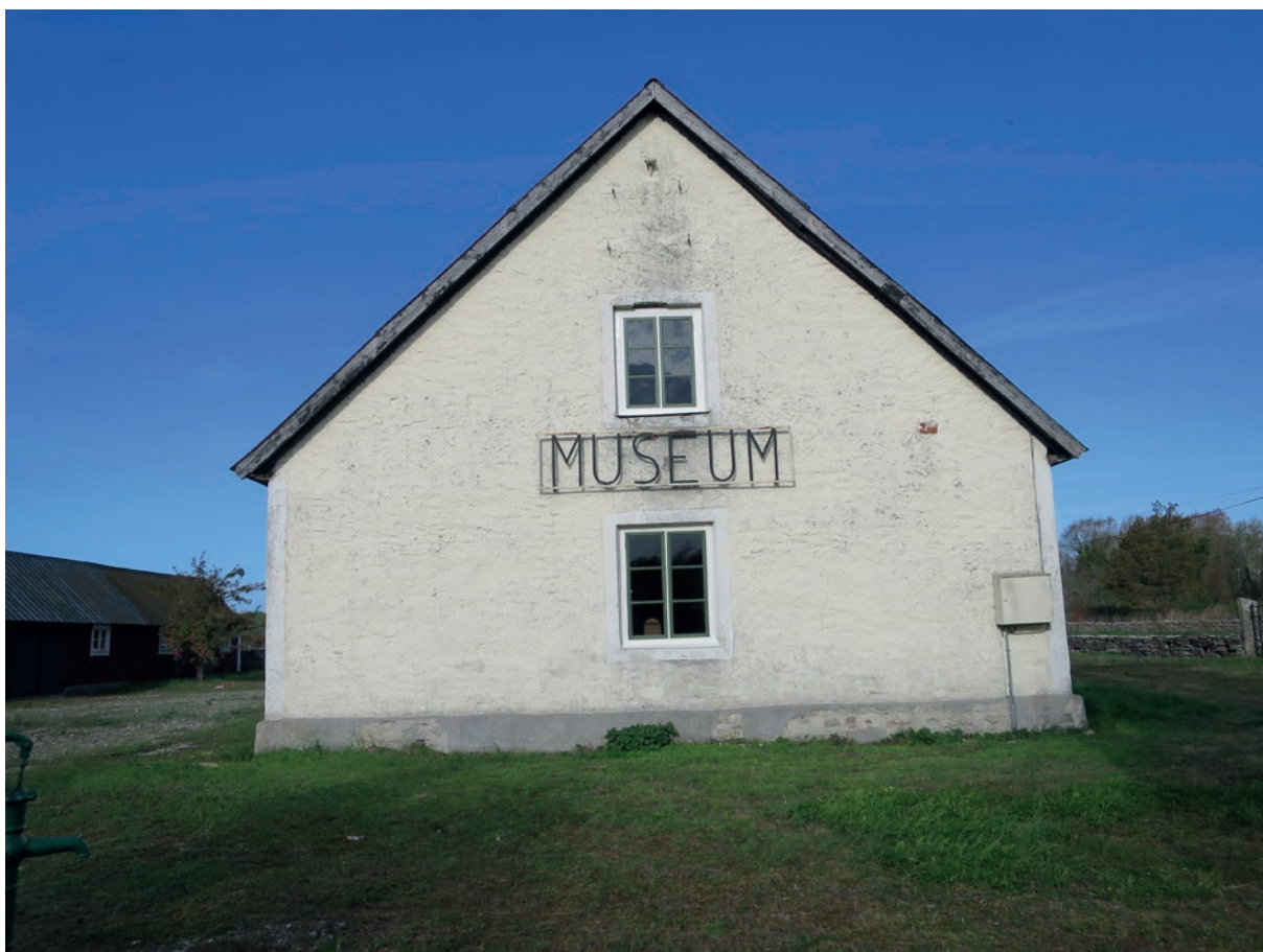
Östra fasaden efter åtgärd.