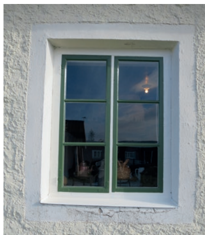
Södra fasaden efter åtgärd. Fönstret i mitten.

Vid framtida reovering av fönstren kan karmarna ur historisk synpunkt målas i samma gröna kulör som fönsterbågarna, då det enligt det äldre fotot av Persnäs skola framgår att bågarna och karmen har haft samma mörka kulör.