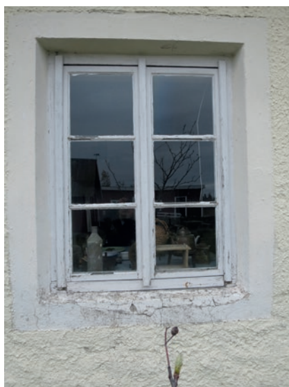
Södra fasaden före åtgärd. Fönstret i mitten av fasaden.