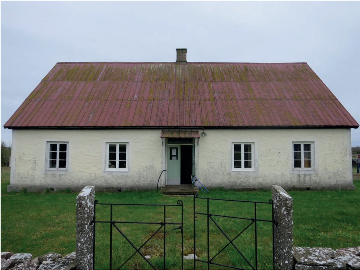
Norra fasaden före åtgärd. Här var de tre fönstren längst åt höger kopplade bågar, varav två av dem renoverades 2016.