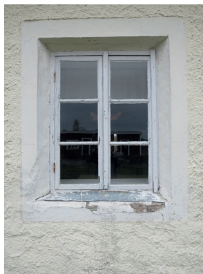
Södra fasaden före åtgärd. Fönstret näst längst åt öster.