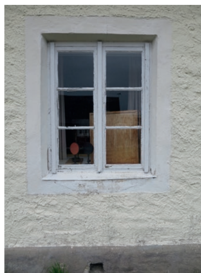
Södra fasaden före åtgärd. Fönstret näst längst åt väster.