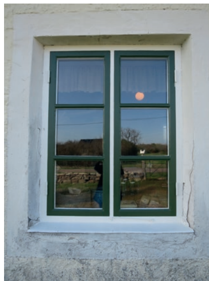
Norra fasaden efter åtgärd. Fönstret näst längst åt öster. Detta fönster har enbart målats.

Hembygdsföreningen hade önskemål om att åter skapa "det gamla" på fönstren vilket innebar att vinkelgångjärn och hörnjärn monterades på de