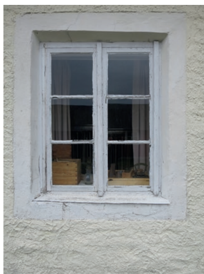
Södra fasaden före åtgärd. Fönstret längst åt väster.