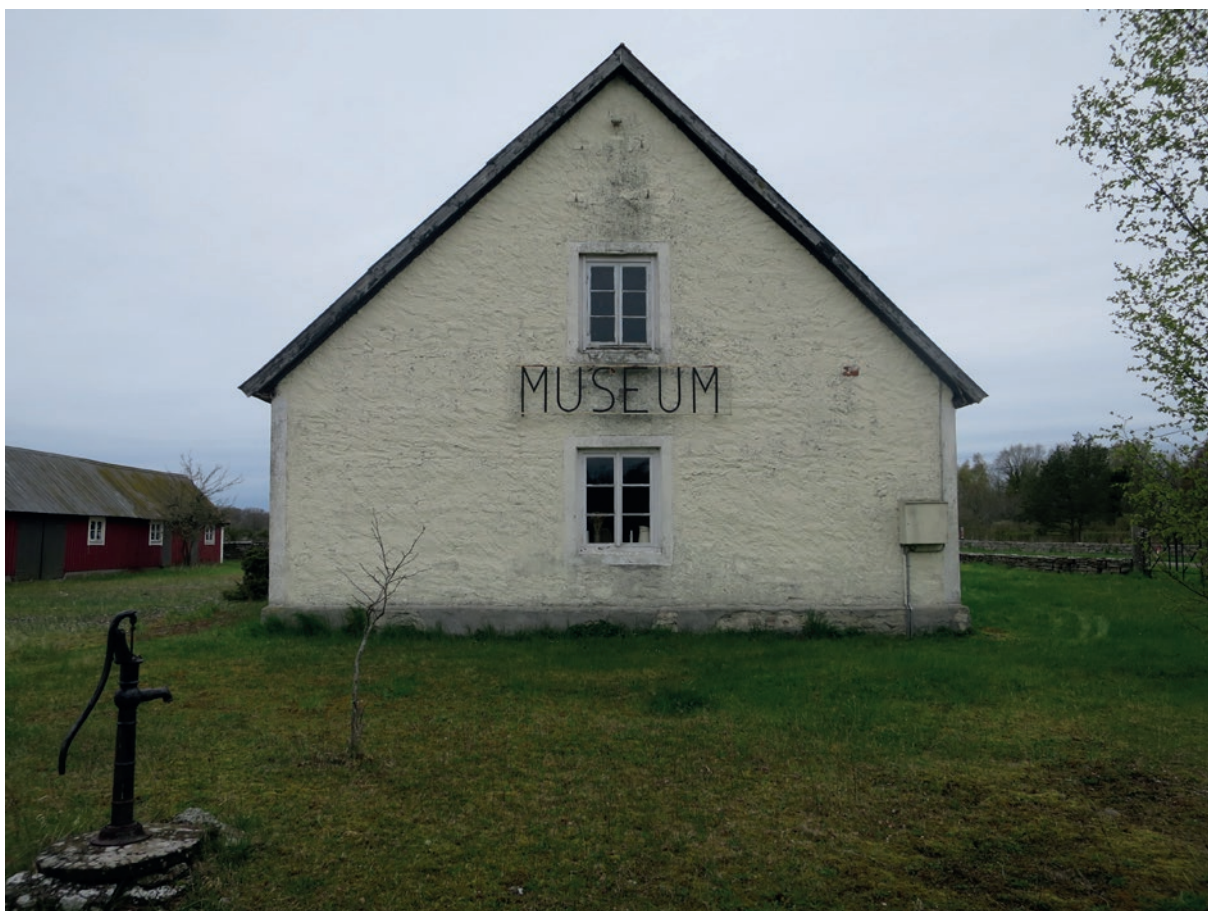
Östra fasaden före åtgärd.