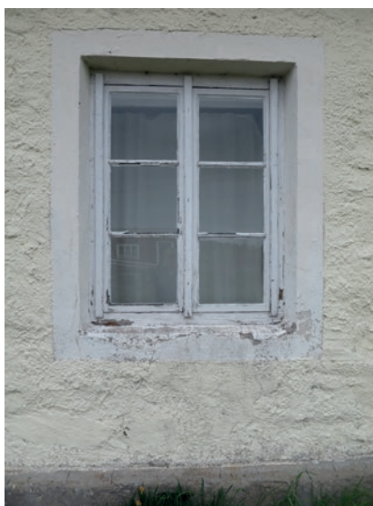
Södra fasaden före åtgärd. Fönstret längst åt öster.