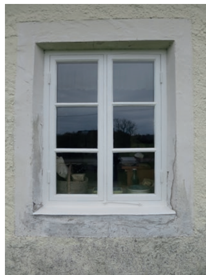
Norra fasaden före åtgärd. Fönstret näst längst åt öster. Detta är ett av de kopplade fönstren som renoverades år 2016.