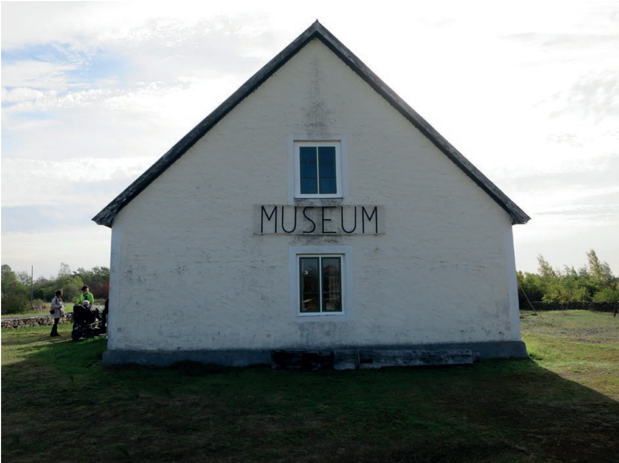
Västra fasaden efter åtgärd. Fönstret längst åt väster.