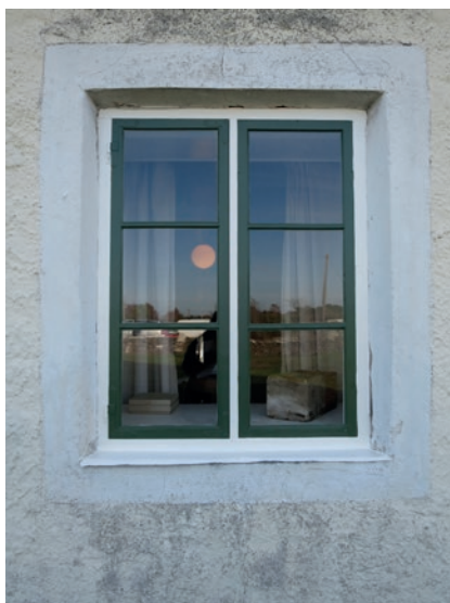
Västra fasaden efter åtgärd. Nedre fönstret.