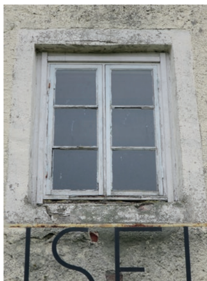
Östra fönstret före åtgärd. Övre fönstret. Detta fönstrets bågar var i så dåligt skick att de bytes ut i sin helhet.