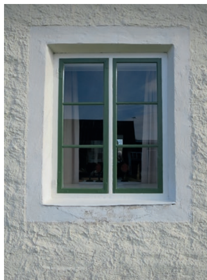
Södra fasaden efter åtgärd. Fönstret näst längst åt väster.