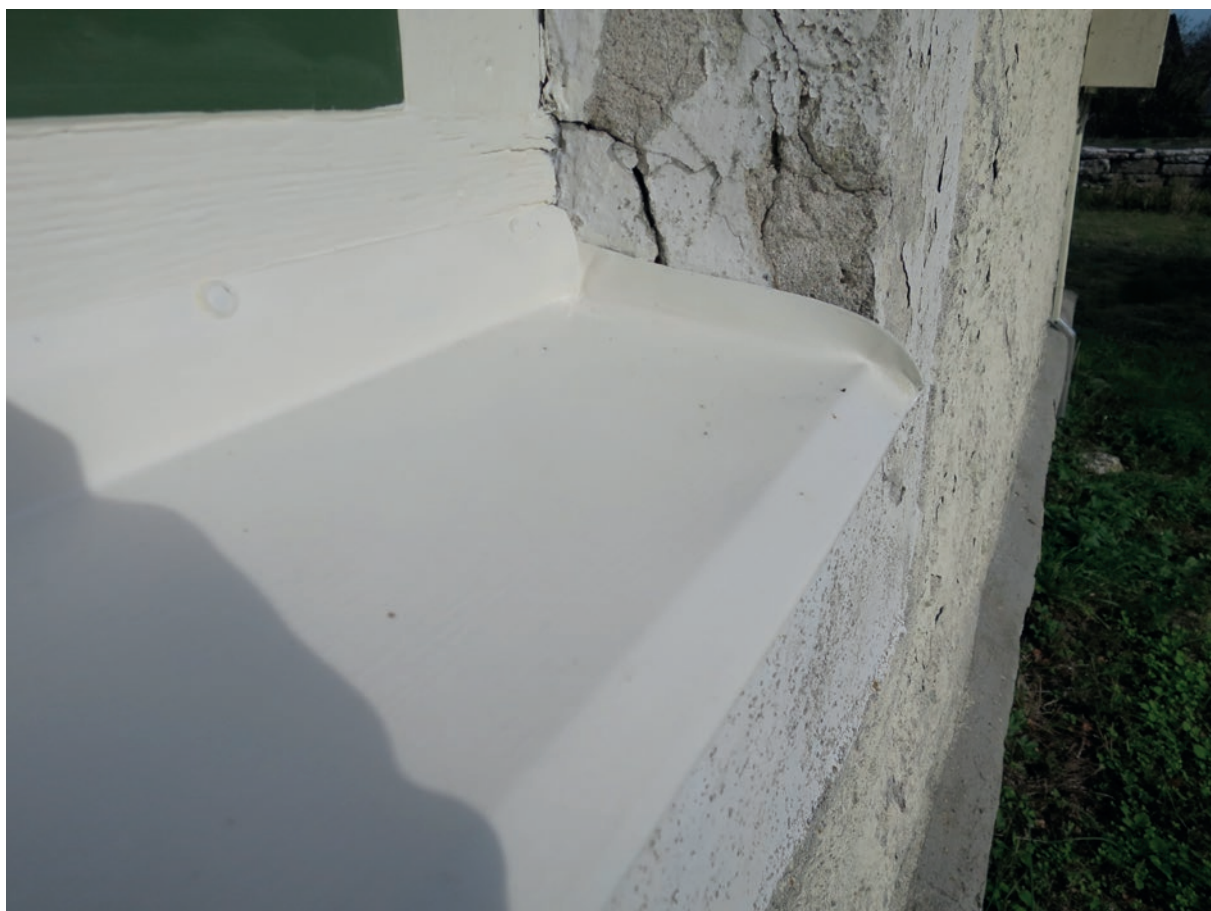
Ett av de nyttillverkade fönsterblecken.