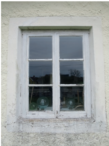
Norra fasaden före åtgärd. Fönstret längst åt öster, vars karm hade nytt virke spikat över sig.