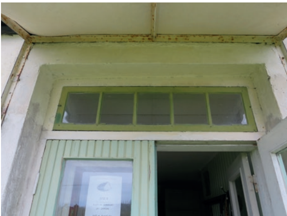
Norra fasaden före åtgärd. Överljuset som fick bestämma kulör på resterande bågar.