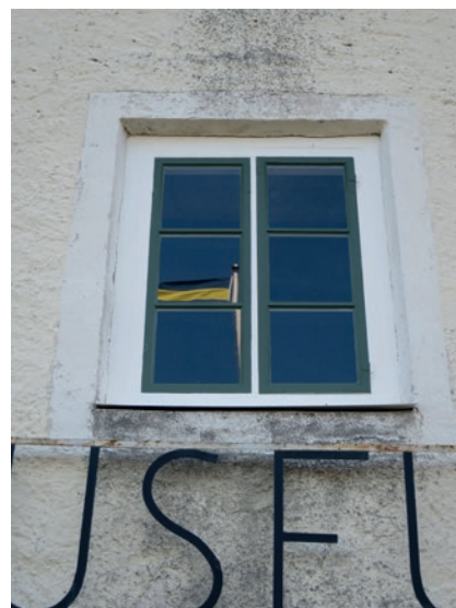
Västra fasaden efter åtgärd. Övre fönstret. Detta fönster har tätats med infällda trälister mellan de båda karmarna.