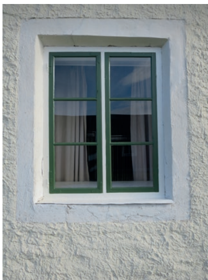
Södra fasaden efter åtgärd. Fönstret längst åt väster.