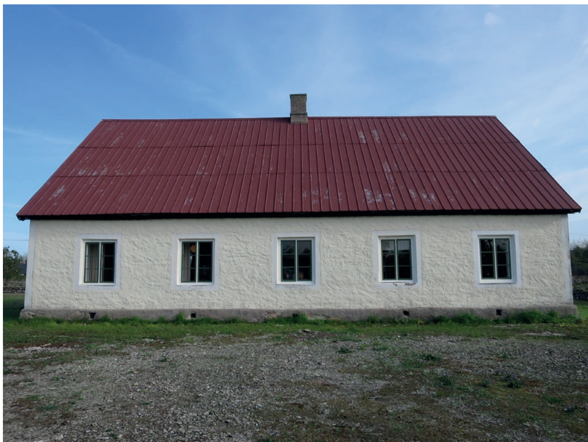
Södra fasaden efter åtgärd.