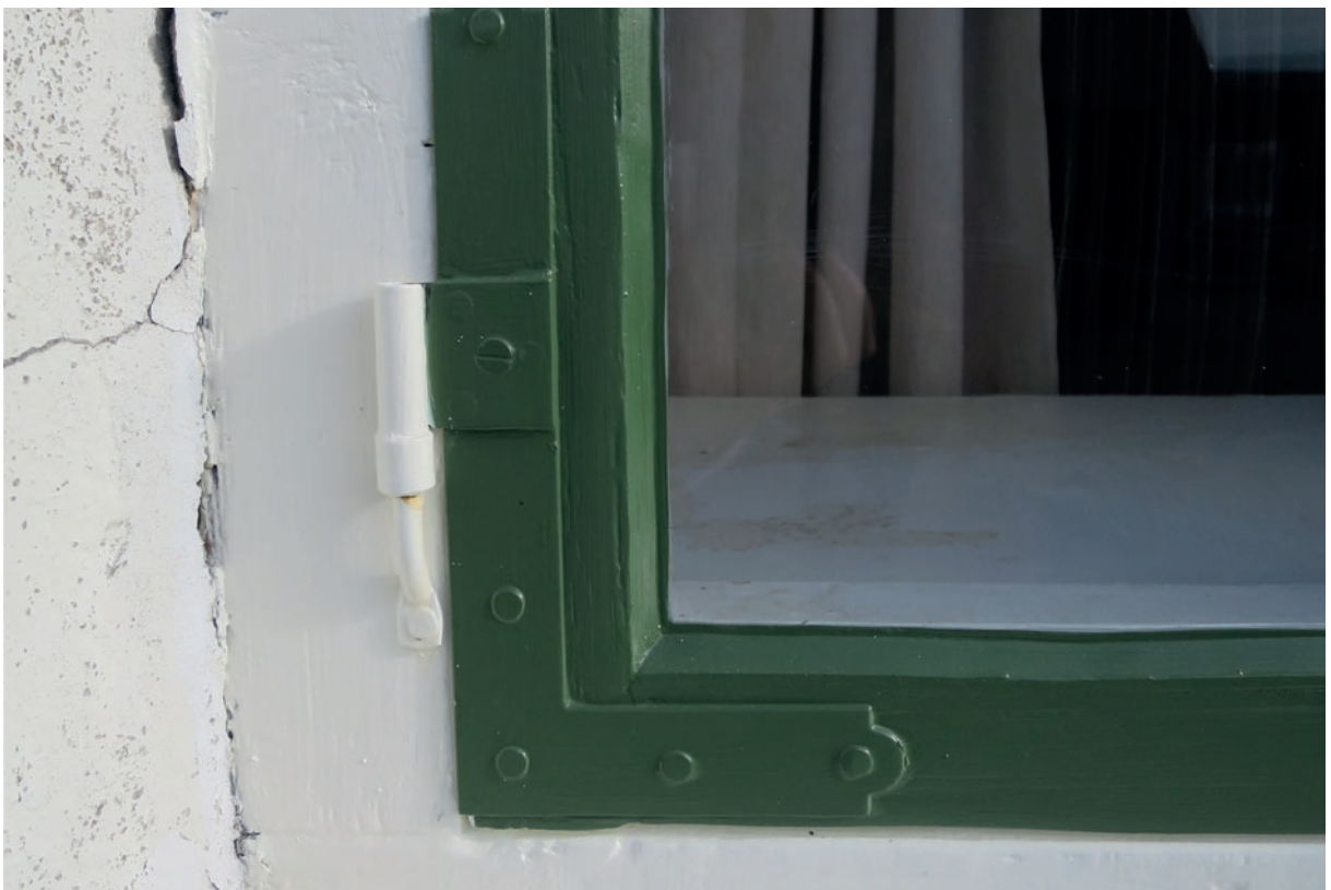
Vinkelgångjärn och hörnjärn som monterades på alla öppningsbara bågar för att få ett äldre utseende på fönstren.