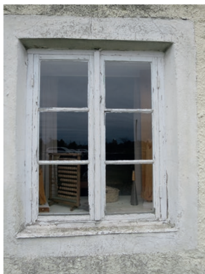
Västra fasaden före åtgärd. Nedre fönstret.