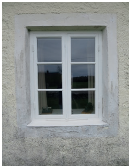
Norra fasaden före åtgärd. Fönstret näst längst åt väster. Detta är ett av de kopplade fönstren som renoverades år 2016.

Såväl fönsterbågar som karmar var i behov av renovering (förutom de två som renoverades 2016). Två karmar på södra fasaden var skadade och behövde lagas på sina ställen. Karmen längst åt öster på norra fasaden hade nytt virke spikat över sig. Fönstret på övervåningens östra gavel behövde bytas i sin helhet.