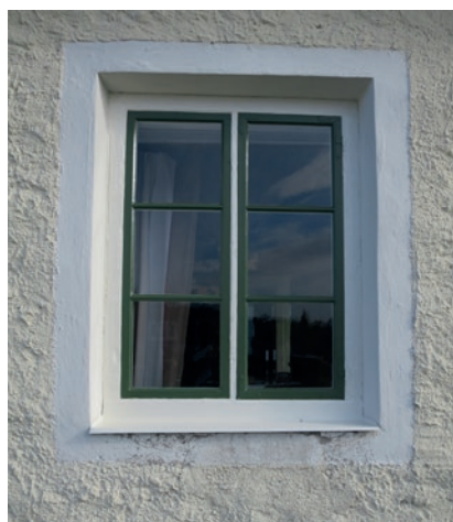
Södra fasaden efter åtgärd. Fönstret längst åt öster.