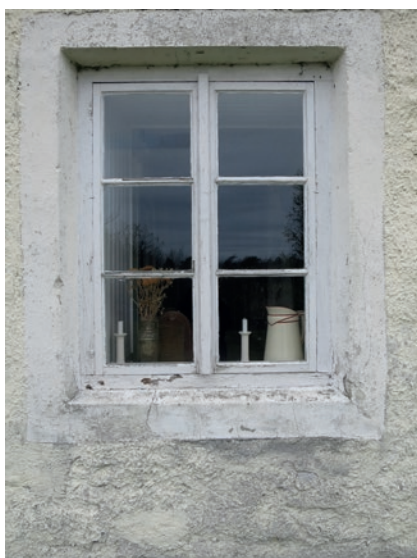
Östra fasaden före åtgärd. Nedre fönstret.