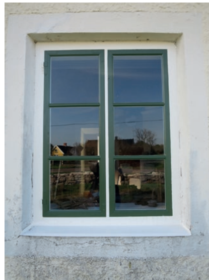
Norra fasaden efter åtgärd. Fönstret längst åt öster, vars karm har blivit lagad i bottenstycket.