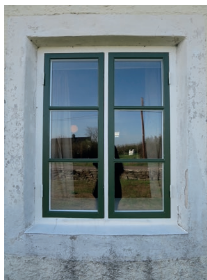
Norra fasaden efter åtgärd. Fönstret längst åt väster.