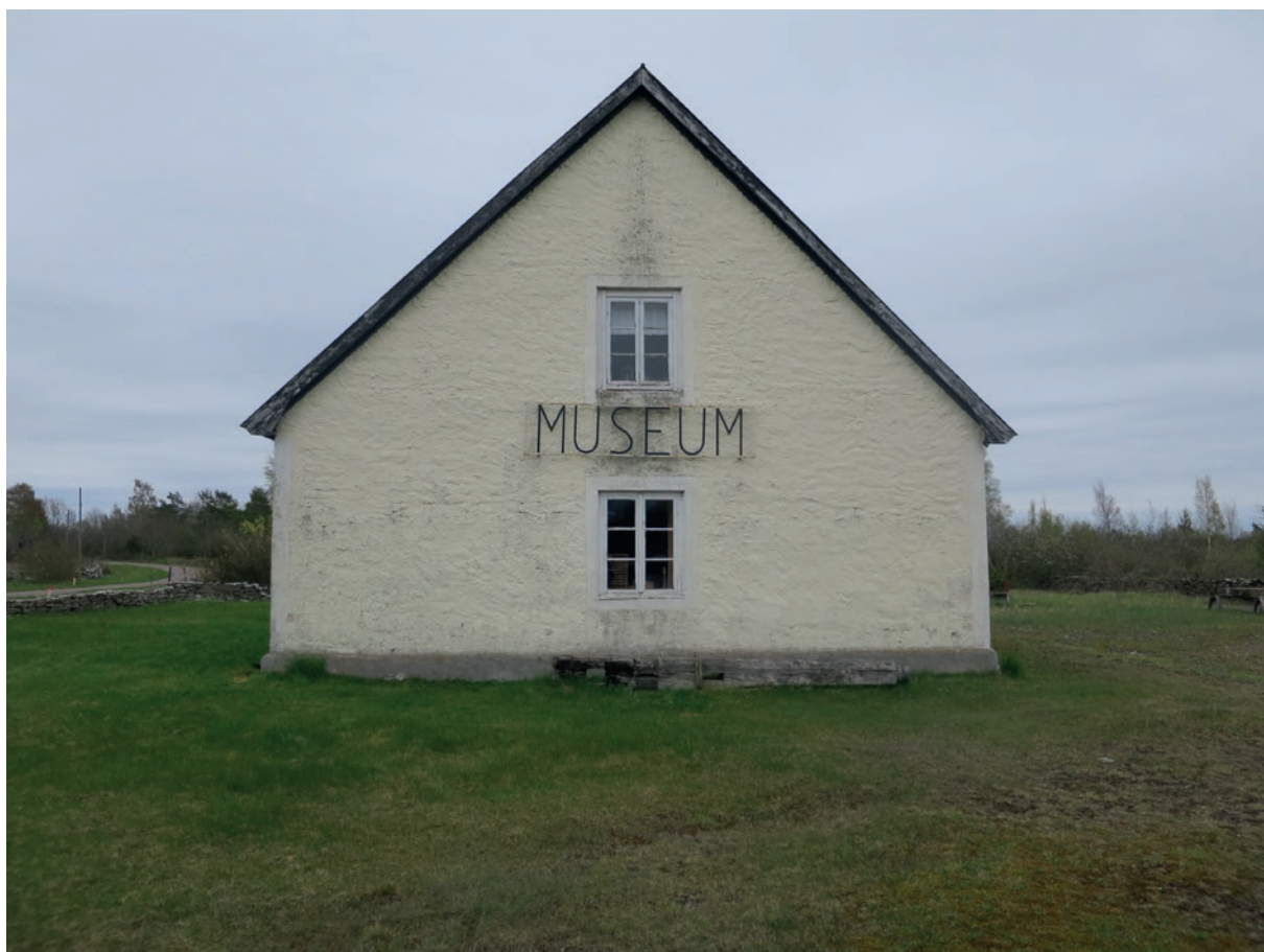
Västra fasaden före åtgärd.